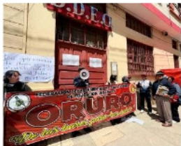
Magisterio rechaza optimización de ítems / LA PATRIA

En ese marco, se instalaron mesas de trabajo para revisar caso por caso