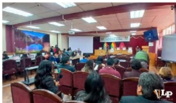
Simulacro del conteo de votos en Oruro