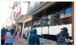
Estudiantes de Comercio Internacional Sabaya de la UTO toman Rectorado / CEPREISA

Las clases en toda la UTO comenzaron en febrero. La carrera de Comercio Internacional funciona en Sabaya y los estudiantes llegaron hacia Oruro para hacer conocer su protesta. Este conflicto pone en evidencia la necesidad urgente de atención a las demandas estudiantiles y la importancia del diálogo entre autoridades y alumnos.