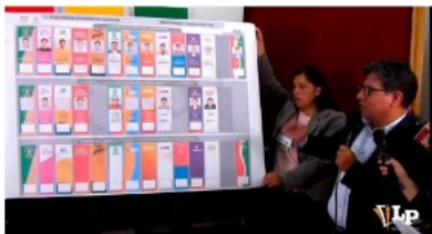
En la papeleta departamental se podrá marcar una vez en cada franja.