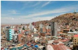
Oruro aún no cuenta con su Carta Orgánica / LA PATRIA

El 19 de febrero se concretó el segundo sorteo del documento, lo que representa un avance en el procedimiento constitucional. Sin embargo, aún no se cuenta con un informe oficial sobre su estado. Por ello, se solicitó formalmente información a esa instancia.