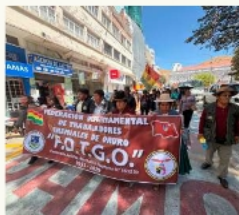
Federación gremial conmemoró su aniversario 73 años