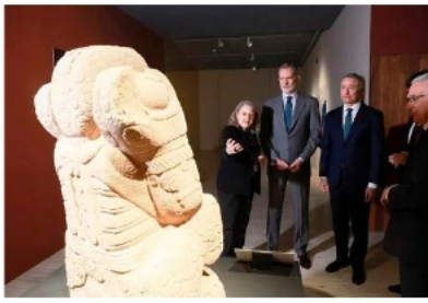
El Rey Felipe VI (21), junto al embajador de México, Quirino Ordaz Coppel (21) AF

Esta muestra, organizada por el Ministerio de Asuntos Exteriores y la Secretaría de Cultura del Gobierno de México, en colaboración con el Ministerio de Cultura de España, el Instituto Cervantes y la Secretaría General Iberoame-