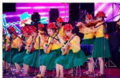
Imagen Referencial del Festival Aquí Canta Bolivia de años anteriores.