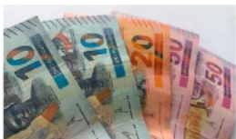
El BCB habilitó el cambio de billetes en todas las entidades bancarias del país. HEFERNANDA

"Esto ha generado incertidumbre y el pueblo boliviano no tiene por qué pagar los platos rotos por decisiones equivocadas que se han tomado. Ojalá que de una vez esta sea la mejor decisión para dejar de generar este