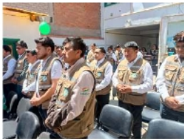
Senasag Oruro cumple 26 años y destaca su labor en control sanitario.

Colque explicó que uno de los principales ejes de trabajo es garantizar el acceso a alimentos seguros, libres de riesgos para el consumo humano. "La sanidad alimentaria se realiza asegurando que los productos