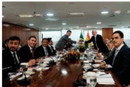
Bolivia refuerza sus lazos con Brasil priorizando el intercambio tecnológico y la innovación

"Es el inicio de una forma de vernos diferente", afirmó el Presidente Paz durante la conferencia de prensa conjunta. El mandatario boliviano subrayó que el país se encuentra bajo un nuevo paradigma de desarrollo, orientado a la producción y al crecimiento compartido. Resaltó que este cambio de rumbo ha sido decidido soberanamente mediante