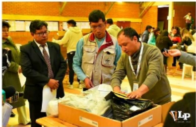
Armado de maletas electorales se hace bajo verificación.

brigada de traslado estará integrada por un policía, un militar y un funcionario del órgano electoral, quienes custodiarán el material hasta su destino. "Las maletas llegarán a los diferentes recintos, donde permanecerán resguardadas hasta el día de la elección", señaló Quispe. Los paquetes electorales solo podrán ser abiertos el domingo 22 de marzo a partir de las 06:00 horas, momento en que se iniciará formalmente la preparación de las mesas de sufragio. Desde el TED Oruro subrayan que el proceso busca ofrecer garantías a la ciudadanía sobre la integridad del material electoral y la seguridad del voto. "Queremos que la población tenga la certeza