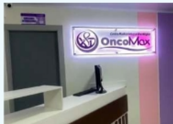
Apertura de OncoMax marca el inicio de la atención oncológica especializada en Oruro.

Con este servicio, se busca que los tratamientos puedan realizarse en