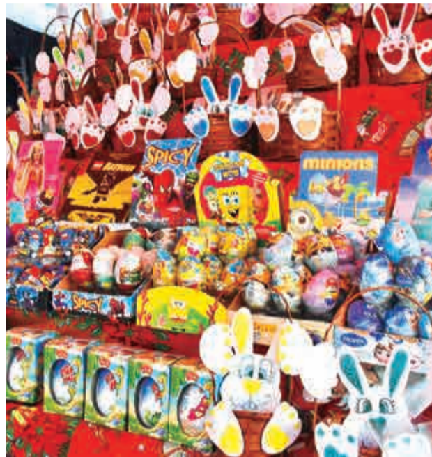
Huevitos de Pascua por Domingo de Resurrección.

La actividad incluye una dinámica en la que los niños deben buscar unas “hojitas” en el parque. En estos vales se indica qué tipo de huevo pueden