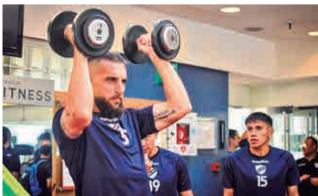
El entrenamiento de Bolívar en Argentina. CLUB BOLIVAR

El equipo paceño viajó ayer por la madrugada, partió a las 5.00 desde el aeropuerto internacional de El Alto y después de una escala en Santa