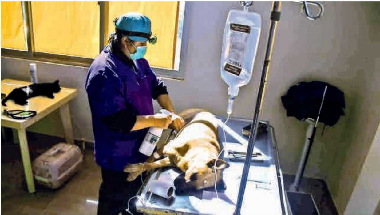
Campaña sectorial de esterilización gratuita.