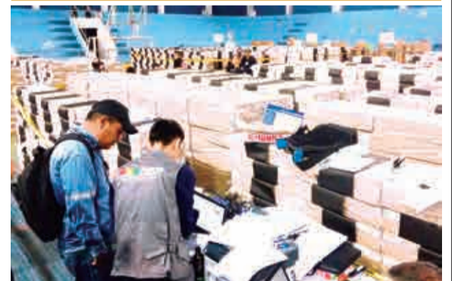
El envío de material electoral a los recintos. EL DEBER

res en financiamiento para proyectos de conservación. La especie recibirá un apoyo directo que podría marcar la diferencia en su preservación y protección.