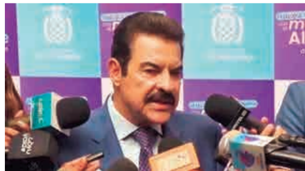
El alcalde reelecto, Manfred Reyes Villa.

Desde la entidad se recomienda a los conductores circular con precaución, respetar la señalización vial y las indicaciones del personal en carretera, además de mantener la distancia de seguridad.