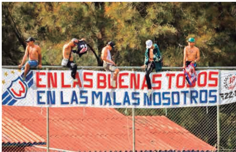
Los hinchas que dan su apoyo incondicional a Wilstermann. CLUB WILSTERMANN

El dinero que se vaya a captar no se entregará directamente al club, será administrado por Müller y serviría para que el club pague sus