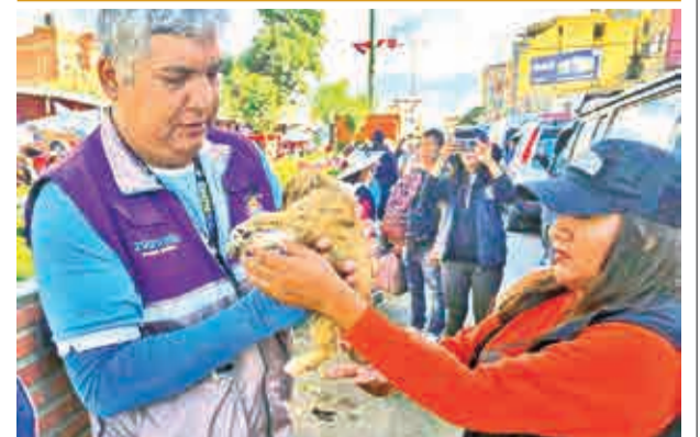
Cachorros hacinados rescatados, ayer.

La Feria del Huevito de Pascua llega así a su tercera versión, consolidándose como una de las actividades más esperadas de Semana Santa en la ciudad.