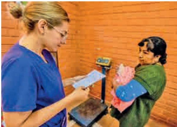
La evaluación de las mascotas que serán intervenidas.