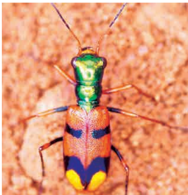
Escarabajo tigre chiquitano ( Pometon bolivianus ). UT

Originario del bosque seco de la Chiquitania, este insecto —de llamativos tonos verdes tornasolados— ha pasado de ser prácticamente desconocido a convertirse en un símbolo emergente de la riqueza natural del país. Su clasificación como especie endémica significa que no existe en ningún otro lugar del mundo, lo que aumenta su valor ecológico y vulnera-