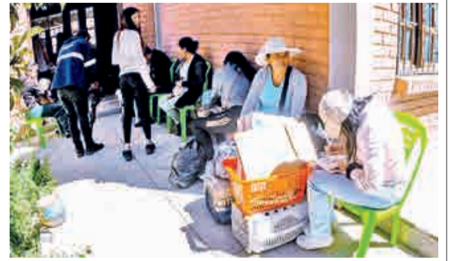
La intervención de 200 mascotas en Ticti Norte.