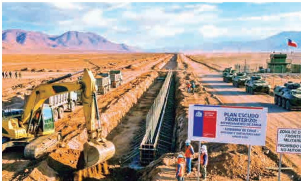
El "Plan Escudo Fronterizo" que lleva adelante Chile en la frontera con Bolivia y

En el caso de los felinos andinos, como el puma, o el zorro