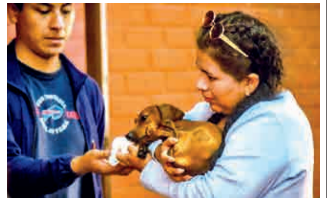
Vecinos se suma a la campaña de bienestar animal.