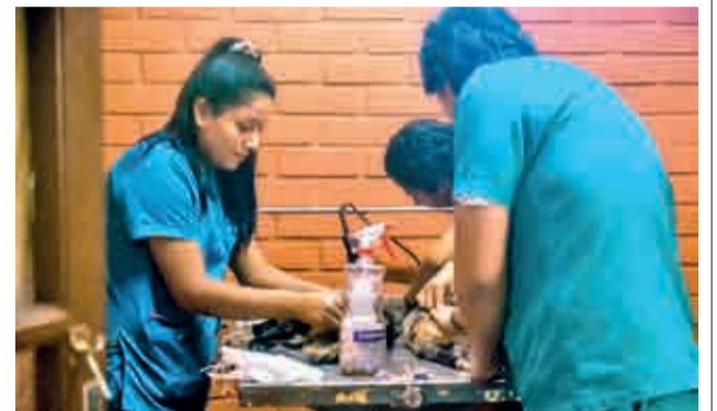
Los servicios que brinda Zoonosis.