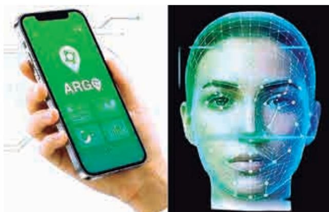
La población hace más pagos por QR. LOS TIEMPOS

El mecanismo de detención domiciliaria opera a través de la aplicación móvil ROMA del Ministerio Público, que permite a las autori-