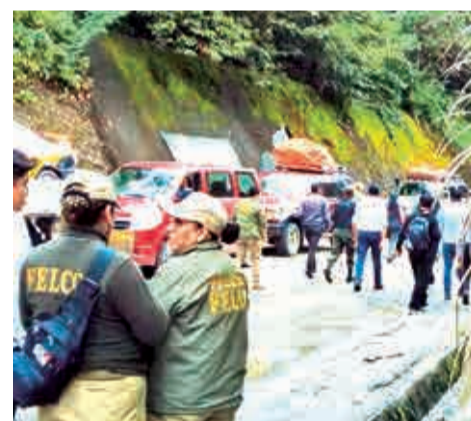
La búsqueda de la víctima en la zona de los Yungas. RRSS