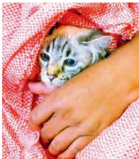
Una gatita esterilizada para el control poblacional.