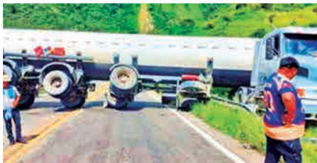
El camión cisterna que se volcó. LAN

Conexión. La circulación fue habilitada tras el vuelco de una cisterna que bloqueó la vía y generó congestión vehicular