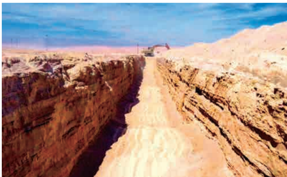
Las zanjas que construye Chile miden tres metros. SUBSECRETARÍA DE DESARROLLO REGIONAL Y ADMINISTRATIVO DE CHILE

Perú. SUBSECRETARÍA DE DESARROLLO REGIONAL Y ADMINISTRATIVO DE CHILE