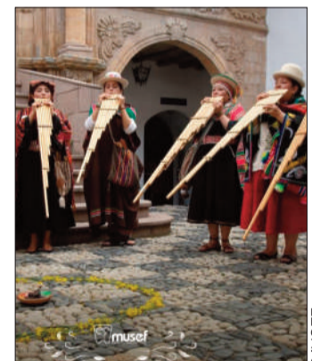
Un concierto en el Musef.

Así, hasta el 27 de abril se realizarán diversas actividades que incluyen la proyección de materiales audiovisuales y ferias a llevarse adelante tanto en El Alto como en el Musef.