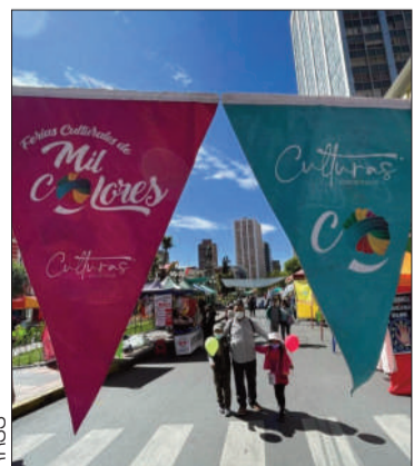
Una feria cultural de 2025.

Las ferias 'De Mil Colores' empezarán el 12 de abril y serán hasta octubre