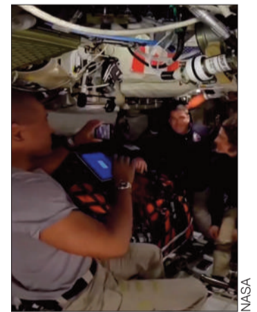
La tripulación del Artemis II.

La agencia espacial estadounidense publicó ayer una imagen tomada por la tripulación de Artemis, en la que se ve la Luna distante y la cuenca Oriental visible.