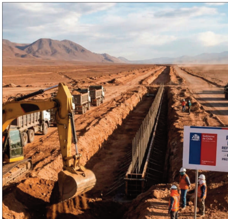
CERCO. Las zanjales que construye el gobierno chileno en la frontera.

El reportaje explica que el plan de Kast incluye la construcción de zanjales de tres metros de profun-