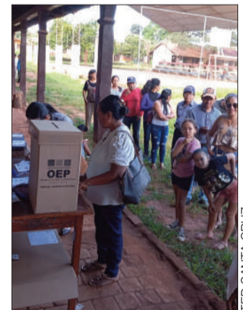
La jornada de votación.

Antes de la repetición, el TED cruceño paralizó el cómputo oficial en 99,71 %.