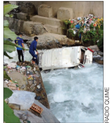
El vehículo cayó al afluyente.