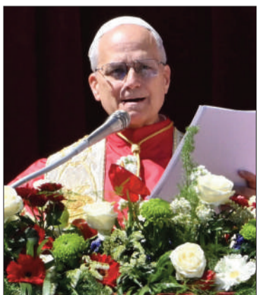
El papa León XIV, en el Vaticano.

León XIV celebró la misa de Pascua por primera vez desde su elección