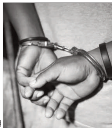
El autor del hecho fue sentenciado.

Las autoridades hallaron 3.000 archivos de material de abuso sexual