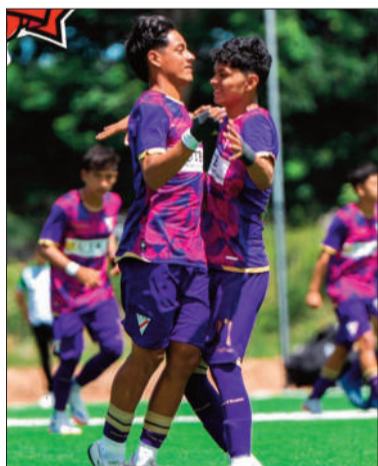
Los jugadores de Always celebran.