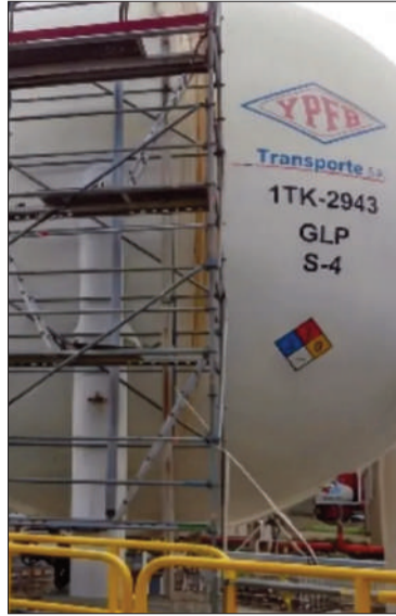
Instalaciones de YPFB Transporte.

OPERACIONES. Los datos emergen de la Rendición Pública de Cuentas