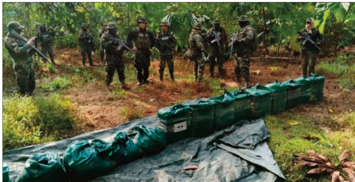
OPERATIVO. Efectivos de la Fuerza Especial de Lucha Contra el Narcotráfico en una de las intervenciones.