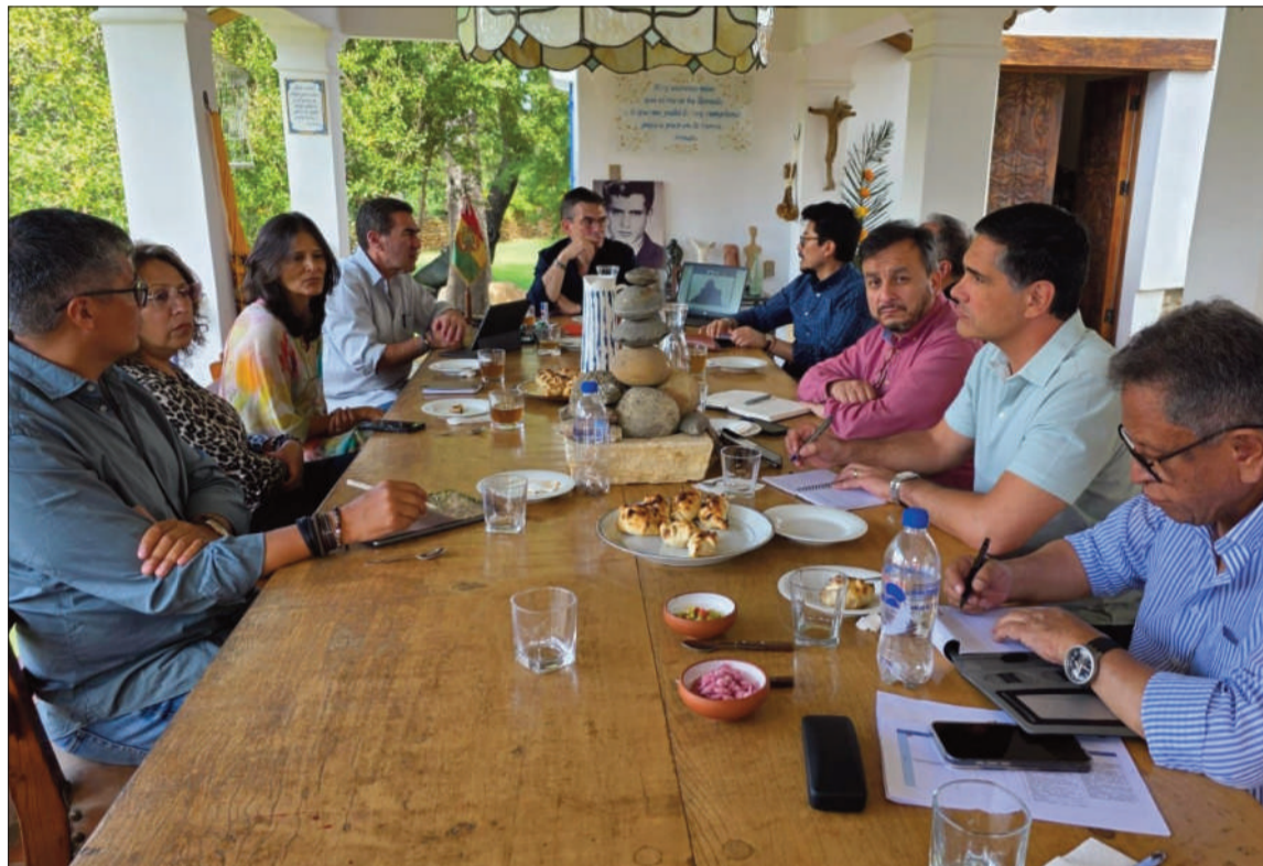
TARIJA. El presidente Rodrigo Paz tuvo un encuentro con parte de su gabinete de ministros el domingo.

“Nosotros vamos a trabajar con todos los alcaldes y todos los gobernadores porque este es un momento muy difícil para el país y lo que no podemos hacer es volver al pasado”, dijo Paz hace unos días en una reunión con los comités cívicos provinciales en Casa Grande del Pueblo, en La Paz.