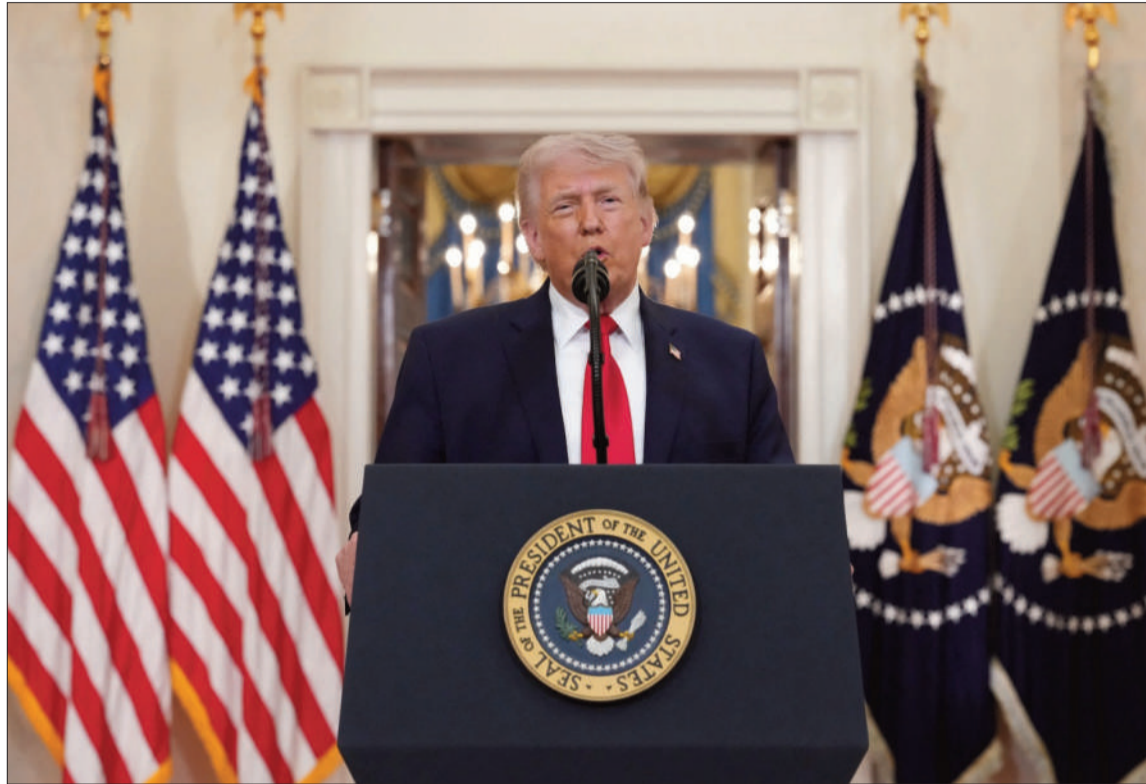
CONFLICTO BÉLICO. El presidente de Estados Unidos, Donald Trump, lanzó más advertencias a Irán.

"Sus acciones insensatas están sumiendo a Estados Unidos en un auténtico INFIERNO para todas y cada una de las familias, y toda