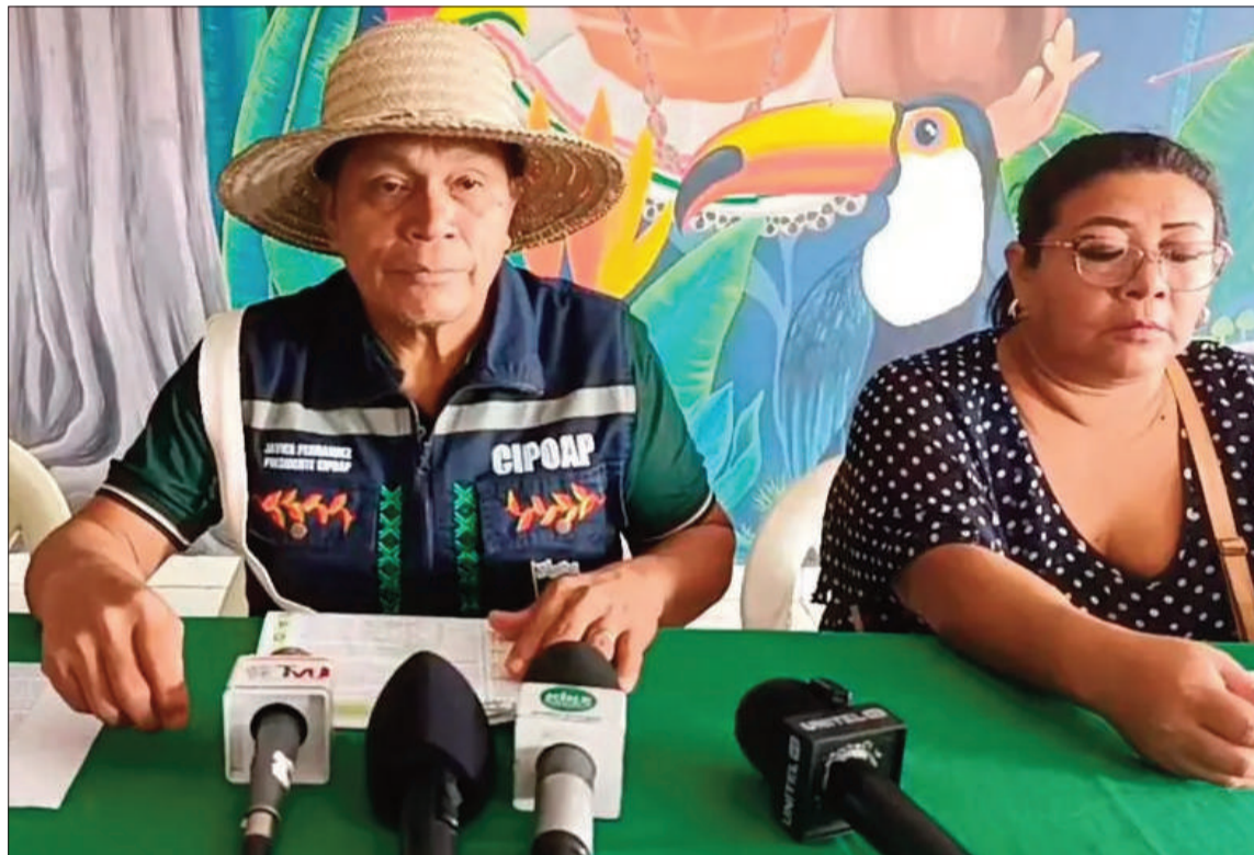
MANIFIESTO. Representantes de los pueblos del norte amazónico en conferencia de prensa.

En declaraciones públicas, representantes indígenas enfatiza-