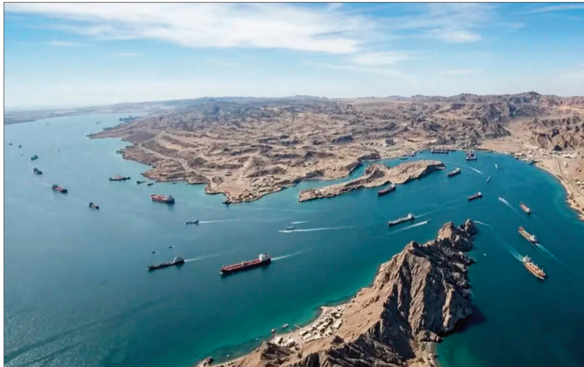
ESTRECHO. Irán impuso un férreo control sobre la ruta en represalia por los ataques de EEUU e Israel.

De las 118 travesías de buques con carga, 37 transportaban crudo, con un total de 8,45 millones de toneladas (Mt). Todos salían del Golfo y la mayoría (30) procedían de Irán o enarbolaban el pa-