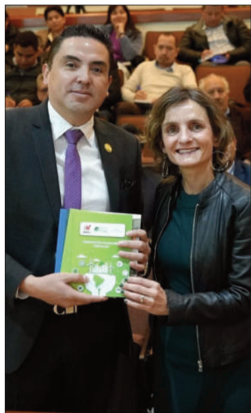
El encuentro en La Paz.

VICEMINISTERIO DE POLÍTICAS DE INDUSTRIALIZACIÓN