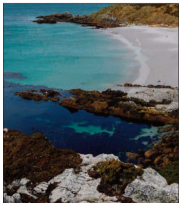
Las Islas Malvinas.

“La cancillería argentina agradece y respalda la respuesta brin-