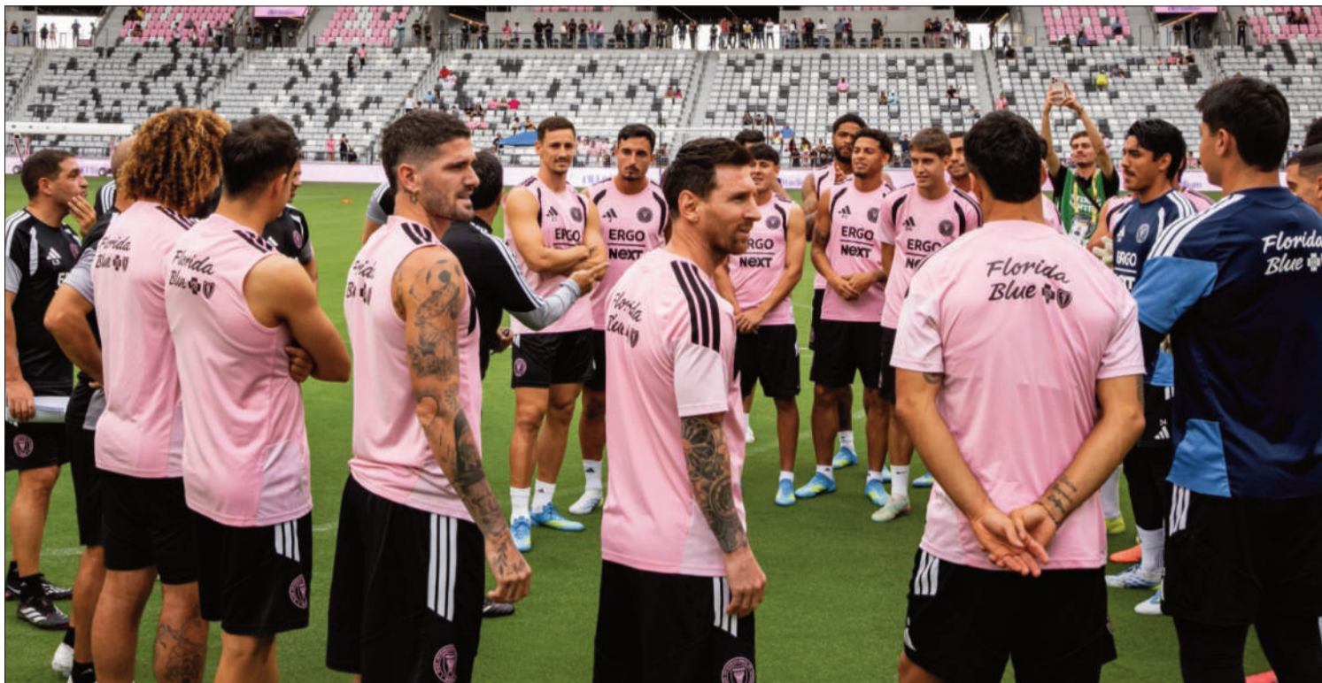
NU STADIUM. El astro del fútbol mundial, el argentino Lionel Messi, estrenará un nuevo estadio junto a sus compañeros del Inter Miami.