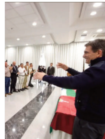
La reunión con el presidente.