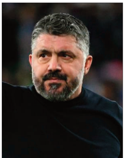
El entrenador Gennaro Gattuso.

Tras la eliminación del Mundial, el ‘terremoto’ aún se cobra víctimas