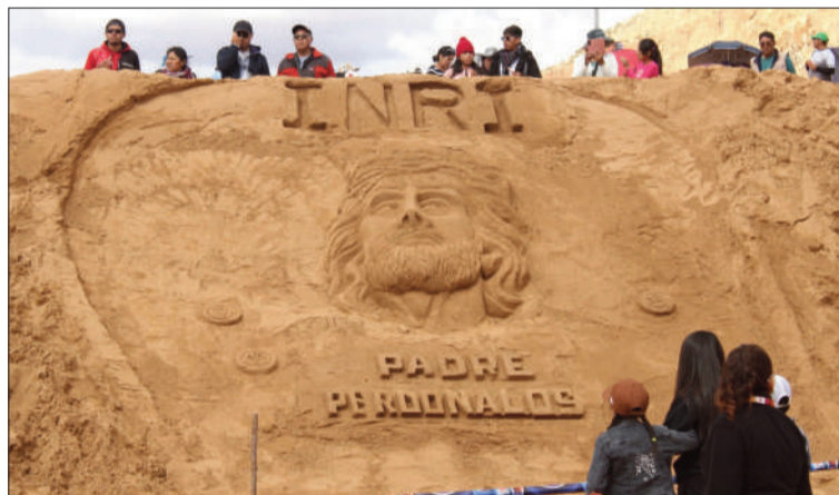
COCHIRAYA. El arte también estuvo presente en los arenales de Oruro.

Actividades. Procesiones, celebraciones litúrgicas y arte marcaron la jornada