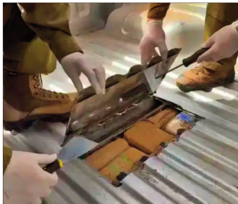
HALLAZGO. La droga encontrada dentro de un doble fondo de un auto.