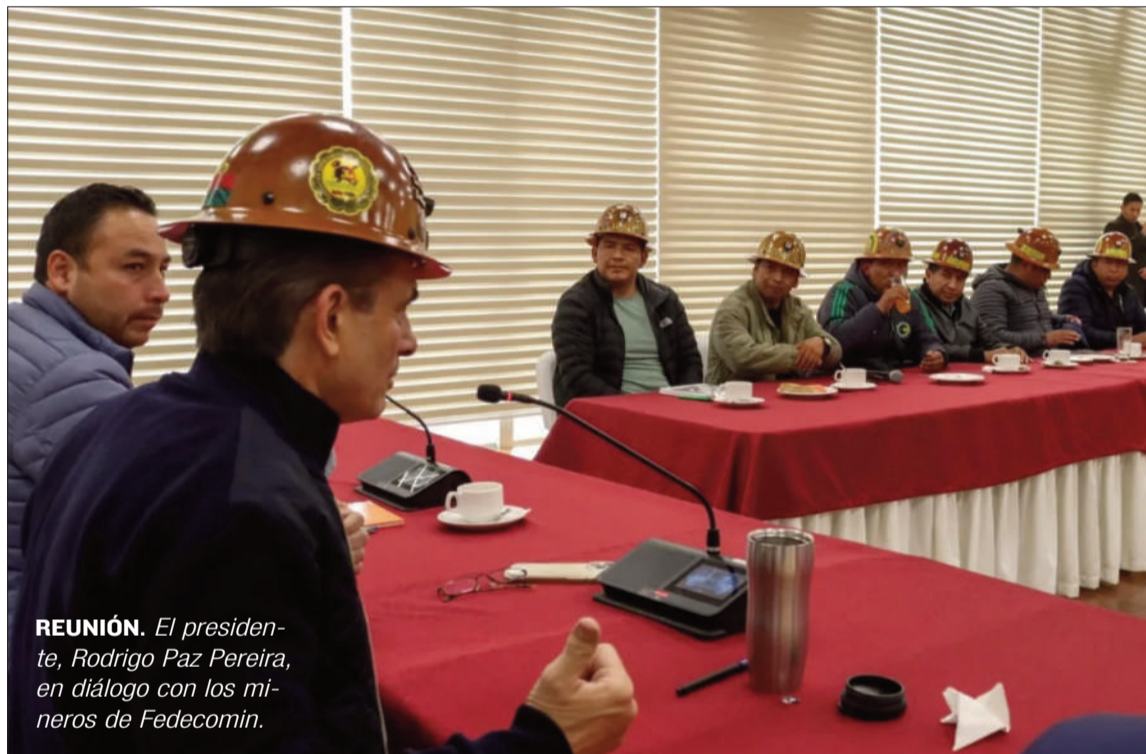
REUNIÓN. El presidente, Rodrigo Paz Pereira, en diálogo con los mineros de Fedecomín.

Asimismo, Paz Pereira pidió a los mineros estar atentos a la nue-