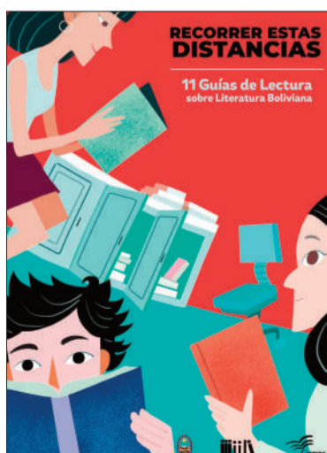
La portada de la producción literaria.

Así, cada departamento del país celebró la Semana Santa con distintas tradiciones.