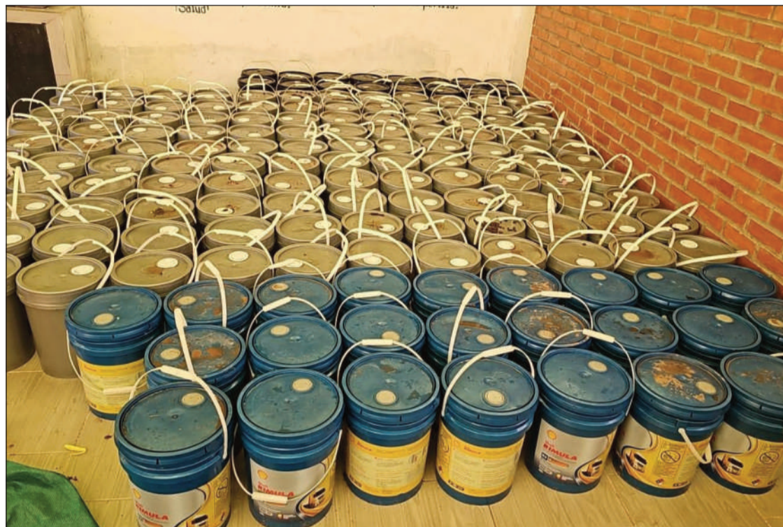
OPERATIVO. Parte de la mercadería decomisada en un operativo del Comando Estratégico Operacional.

Decomiso. Aceite automotriz, cajas con líquidos y diversos aditivos de mantenimiento vehicular y carne de cerdo fueron incautados