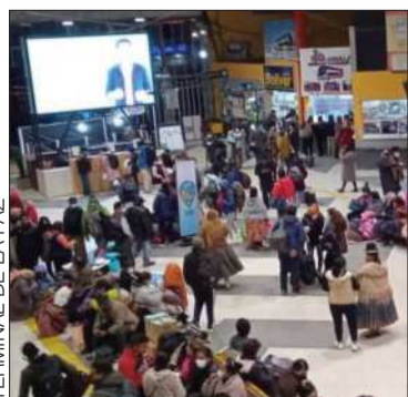
Subió la afluencia de viajeros.

La Alcaldía señaló que no se permitirá el viaje de menores sin autorización