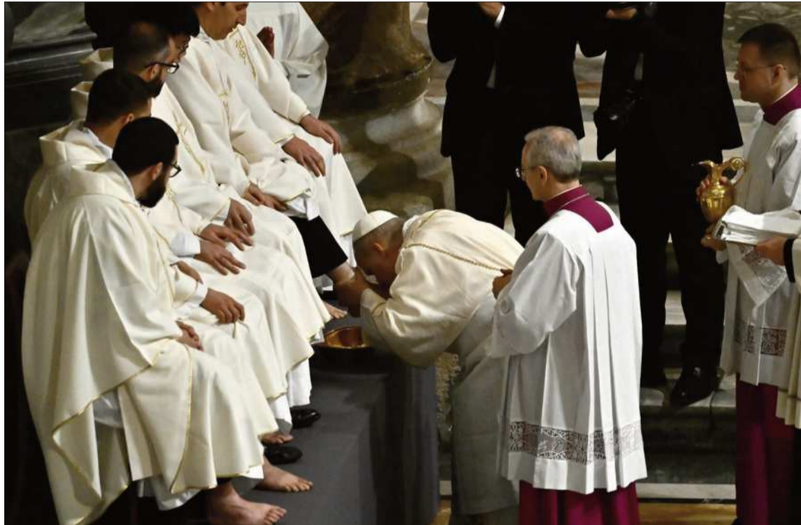
ACTO. El Papa lava y besa los pies en el Jueves Santo, en la Basílica de San Juan de Letrán, en Roma.

"Al lavar nuestra carne, Jesús purifica nuestra alma. En Él, Dios ha dado ejemplo no de cómo se domina, sino de cómo se libera; de cómo se da la vida, no de cómo se destruye. Entonces, ante una humanidad abatida por tantos ejemplos de brutalidad, postrémonos también nosotros como hermanos y hermanas de