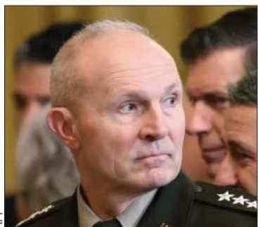
El general Randy George.

El jefe del Pentágono habría pedido la dimisión del general estadounidense