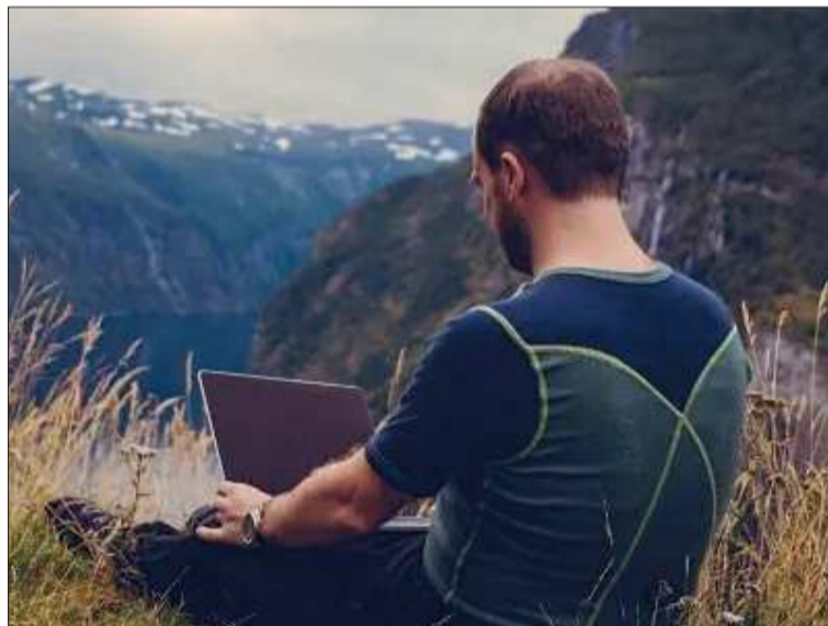
TRABAJO. Imagen referencial de una persona que trabaja en el campo.

Proyecto. El empresario planteó cuatro condiciones urgentes a la Asamblea