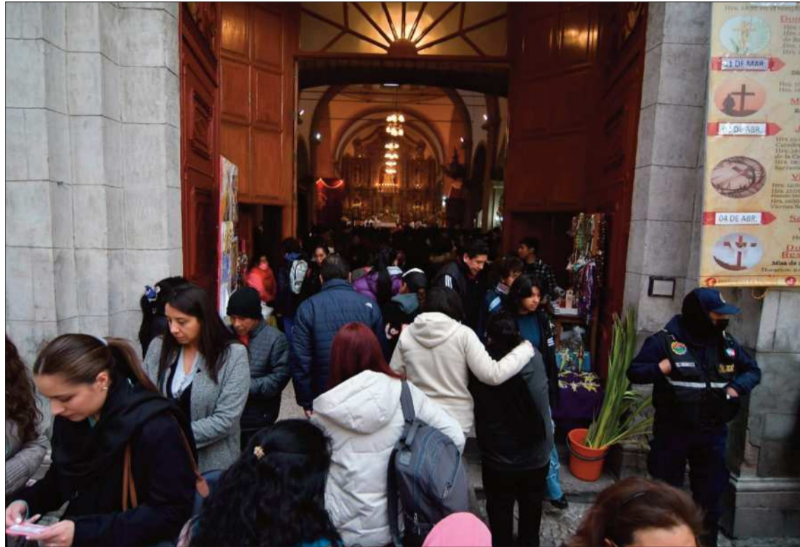
TRADICIÓN. Cientos de fieles se volcaron a las calles para visitar al menos siete templos en La Paz.

Asimismo, recordó que el Jueves Santo marca el inicio del Triduo Pascual, con actividades centrales como la renovación de votos sacerdotales y la celebración de la Última Cena del Señor, que incluye