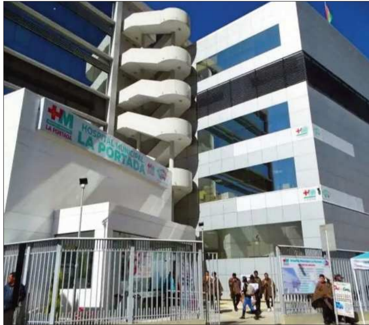
INFRAESTRUCTURA. Una imagen del hospital de La Portada en La Paz.

El exministro consideró que se debe incluir nuevas formas de gestión