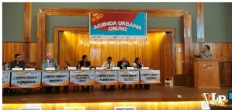
Los seis candidatas a la Alcaldía de Oruro que asistieron al foro de Agenda Urbana