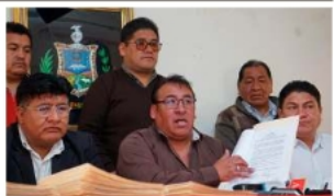
Federación Urbana de Transporte de La Paz Chuquiagu Marka, denuncia el incumplimiento del resarcimiento por parte de YPFB /AVG

Cerca del 70% de los vehículos del transporte público no cuenta con el RUA registrado a nombre del conductor. Se acor-