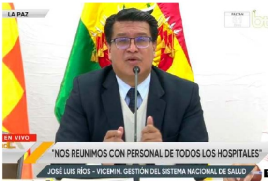
Conferencia del Ministerio de Salud y Deportes sobre el presupuesto al Hospital de la Mujer /www.vep

"El Gobierno Nacional, por Instrucciones de nuestro Presidente y nuestra Ministra, a