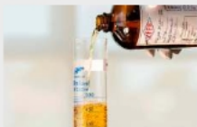
El Gobierno importará crudo liviano para producir gasolina más limpia

Medinaceli destacó que ambas instalaciones poseen laboratorios especializados que controlan la calidad de los combustibles producidos, garantizando