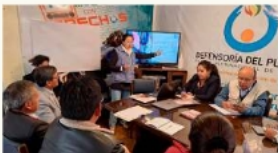
Defensoría del Pueblo advierte persistencia de uniones tempranas y pide aplicar la Ley 1639 en Oruro / IZQUIERDA A LA PATRIA