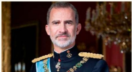
El Rey Felipe VI de España arriba a territorio boliviano este miércoles para cumplir una intensa agenda de trabajo. Ahora LOS TEMPS