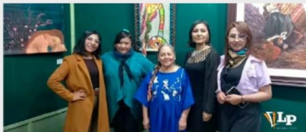
Mujeres artistas vivieron noche de talentos artísticos