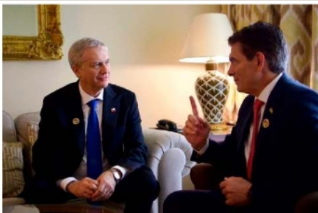
Rodrigo Paz llega a Chile para asistir a la posesión del nuevo presidente, José Antonio Kast

Asimismo, se prevé que las mesas de trabajo aborden temas críticos de la agenda regional, incluyendo seguridad fronteriza, gestión migratoria e infraestructura caminera. Estas áreas han mostrado