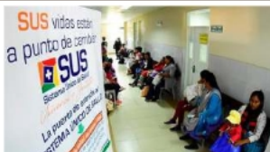
El nuevo modelo SIS busca optimizar la eficiencia del gasto para garantizar la cobertura gratuita en los centros hospitalarios del país. Ahora TEMPS

Respecto al financiamiento del nuevo SIS, se informó que se mantendrá un presupuesto similar al ejecutado durante 2025. La principal prioridad está en el éxito de la transición, que no dependerá exclusivamente de más dinero, sino de la eficiencia en la ejecución. Se busca optimizar los procesos técnicos y financieros para garantizar la gratuidad real.