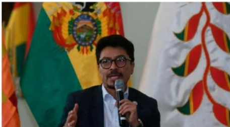
Según canciller, Bolivia y EEUU avanzan acuerdos comerciales y anuncia visita de empresarios

La cumbre 'Escudo de las Américas' se concibió como un espacio para coordinar esfuerzos regionales frente a desafíos como el narcotráfico, el crimen organizado transnacional y la migración irregular. También busca promover mayor cooperación económica y política entre los países participantes.