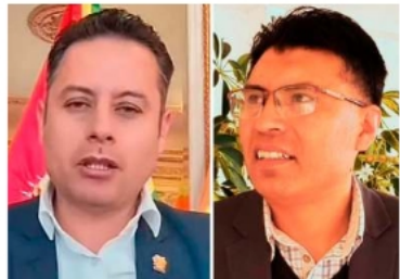
El vicepresidente Edmand Lara se suma al cabildo para reducir salarios y eliminar la pensión vitalicia