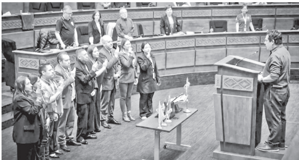
Integrantes de la Comisión de Ética de la Cámara de Diputados. CAMARA DE DIPUTADOS

“En consecuencia, es la instancia dentro de la Cámara de Diputados encargada de sustanciar las denuncias presentadas contra los legisladores, asegurando el cumplimiento de los principios éticos y normativos que rigen su accionar, en el marco del respeto a la Constitución, las leyes y el Reglamento General de la Cámara”, señala parte del reglamento.