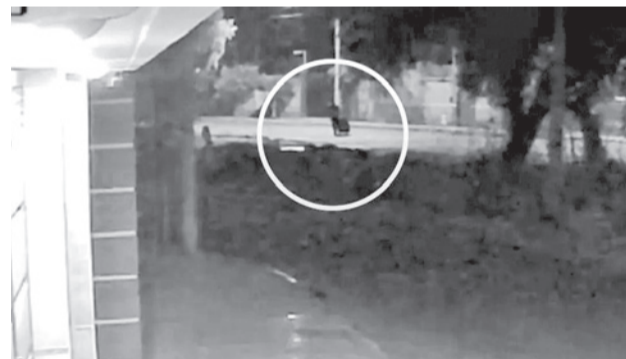
El traslado del cuerpo en una maleta.