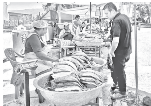
La oferta en los puestos de El Arco, ayer.