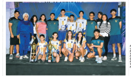
Unidos. Integrantes de A Golden Club Vóleibol.