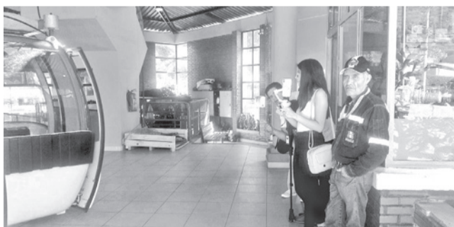
El servicio del teleférico en el Cristo.

Tradición. El Viernes Santos cientos de personas visitan las estaciones del Viacrucis, en el cerro de San Pedro