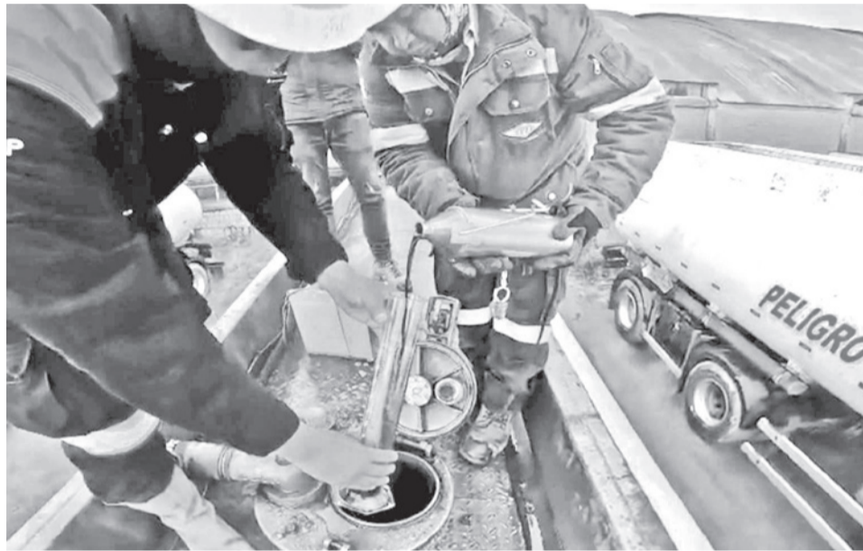
La contaminación del combustible en ciudades de Chile. YPFB

Según la estatal, el conductor cargó 32.751 litros de diésel en Iquique, Chile, el 16 de marzo, distribuidos en dos compartimientos. Uno de ellos fue adulterado tras un contacto con terceros que habrían solicitado la venta del producto.