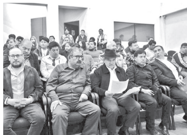
La reunión de alcaldes con la Gobernación.