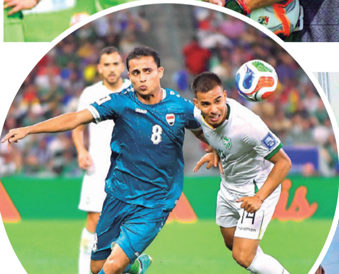
El partido entre Bolivia e Irak.