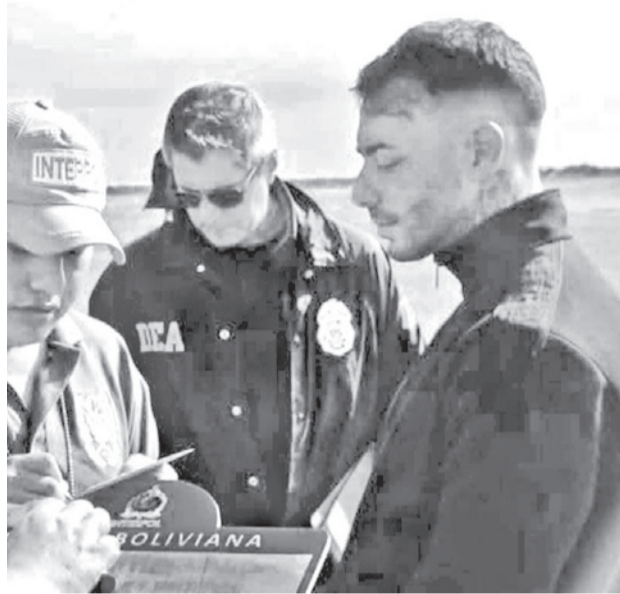
El narcotraficante uruguayo Sebastián Marset.

Marset está recluido en el Centro de Detención William G. Truesdale, de Alexandria (Virginia) tras ser capturado en Santa Cruz el viernes 13 de marzo durante un operativo