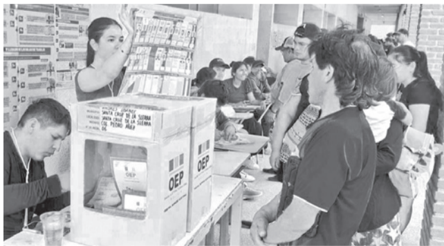
Votación en el departamento de Santa Cruz. TEDSC

Plazos. La nueva votación en alcaldías será el 5 de abril y una vez concluida el TED deberá empezar el cómputo oficial de inmediato.