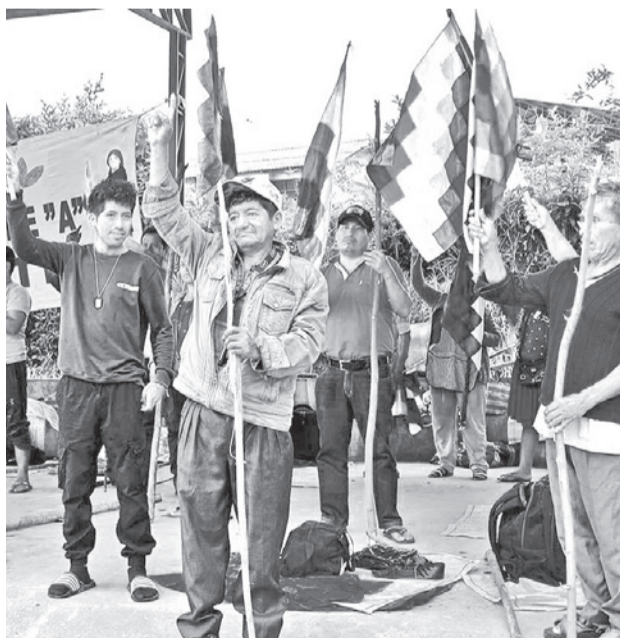
Vigilia de cocaleros en el trópico de Cochabamba. RKC

“Saludamos el primer aniversario de nuestro instru-