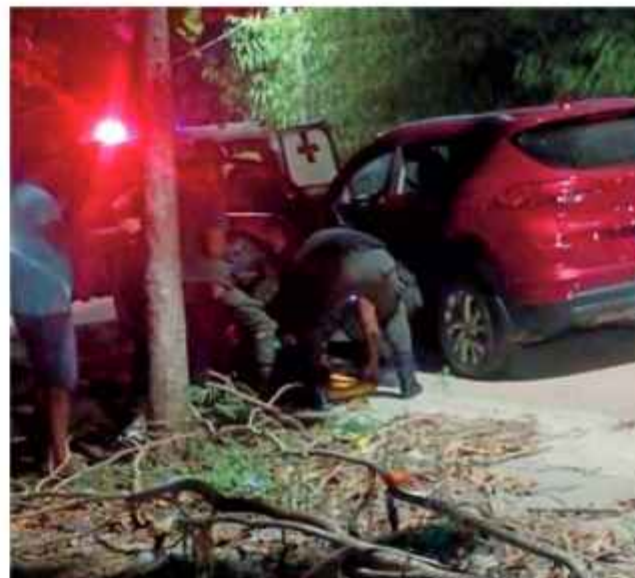
ASESINATO. El motorizado donde se encontraban las víctimas.

Los responsables se desplazaban en un vehículo particular y emprendieron la huida inmediatamente después de los disparos. La Policía activó el "Plan Z" en las rutas que conectan Villamontes con Tarija, Santa Cruz y la región fronteriza con Paraguay