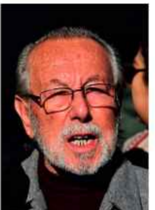
PROYECTISTA. El diputado Juan del Granado.

La propuesta principal del proyecto apunta a lograr la independencia financiera. Ante la precariedad actual, donde el sistema judicial recibe apenas el 0,4 por ciento del Presupuesto General del Estado, la ley propone elevar la asignación al 3 por ciento. "Sin recursos suficientes no hay justicia pronta ni transparente", señaló Del Granado durante la entrega del documento, que será debatido en la Asamblea.