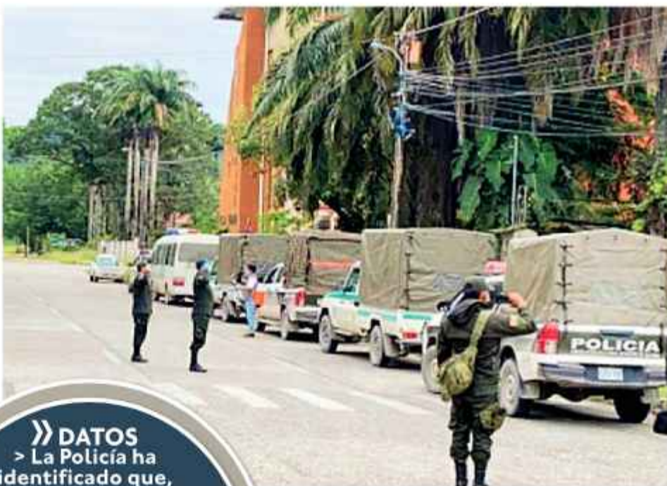
SEGURIDAD. En el trópico de Cochabamba actualmente trabajan 113 policías,