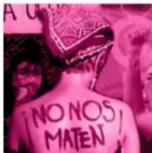
AGRESIÓN. La foto sólo es un referente de la nota.

"El Ministerio Público realiza la colección de elementos de convicción en la escena del hecho, además de la valoración médico legal externa, a fin de esclarecer las circunstancias de este lamentable deceso", dijo el fiscal Aldo Morales.