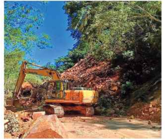
LIMPIEZA. La maquinaria levanta tierra en el tramo Samaipata.

Ante el colapso de las rutas, desde la Terminal Minasa de la sede del gobierno se confirmó la suspensión de la salida de buses y camiones de gran tonelaje hacia Chulumani, Irupana y La Asunta debido a un gran derrumbe en Puente Villa.