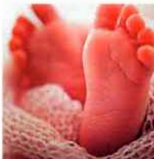
VIOLENCIA. El bebé tenía tres a cuatro meses de edad.

El cuerpo fue trasladado a la morgue judicial de Pampa de la Isla para confirmar si las quemaduras fueron la causa directa del deceso o si existen lesiones internas adicionales. El infanticidio se castiga con 30 años de reclusión.