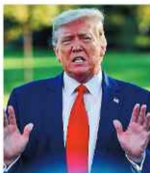
PRESIDENTE. Donald Trump, de Estados Unidos.

El presidente estadounidense, Donald Trump, comunicó ayer en sus redes sociales que el Mandatario de Irán "acaba de pedir a Estados Unidos un alto el fuego".