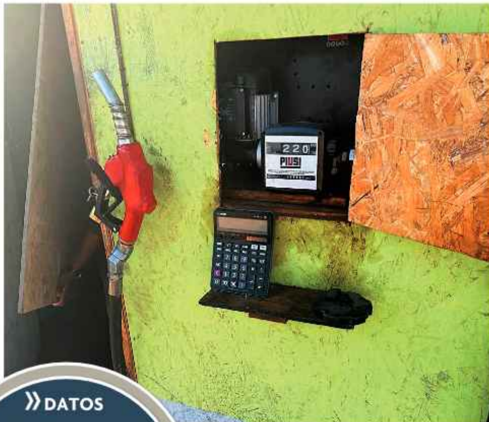
GASOLINERA. Las autoridades mostraron la foto de una gasolinera precaria que opera en el vecino país.

La investigación se desarrolló en coordinación con autoridades de los países vecinos, "ésta es una investiga-