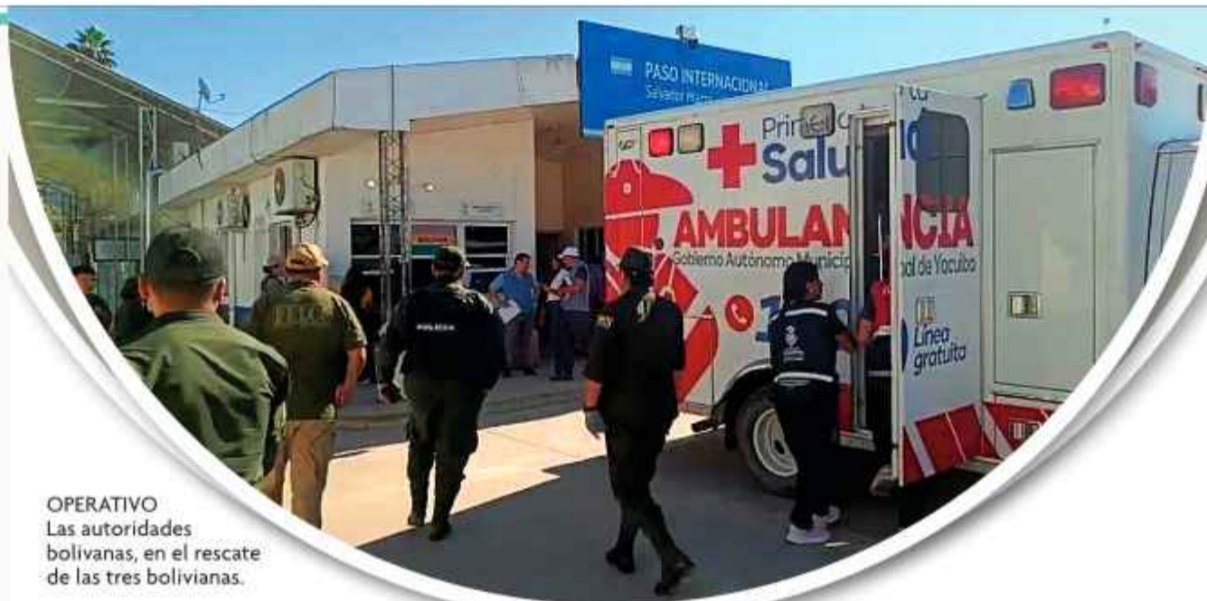
OPERATIVO Las autoridades bolivianas, en el rescate de las tres bolivianas.