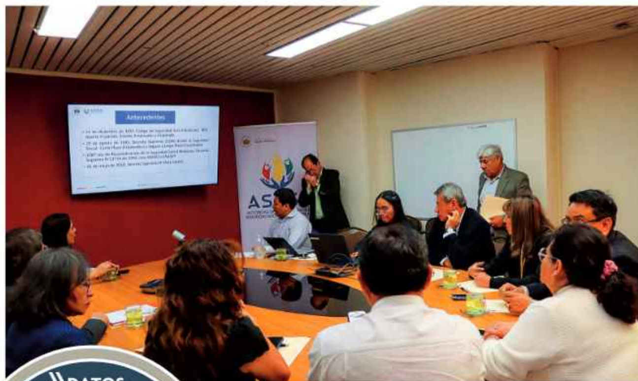
INFORME. Personal de la Asuss presenta, en el Ministerio de Salud, los datos recopilados

Según la normativa, la Ley 3131 y Decreto Supremo 28562, los responsables