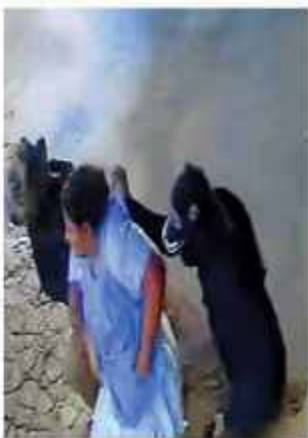
VIOLENCIA. La víctima, cuando era secuestrada.

La mujer tenía antecedentes por tráfico de sustancias controladas, uno data de 2013 y otro de 2004. "Su entorno familiar, sus hermanos y hermanas tienen antecedentes por este delito", dijo.