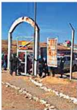
PENAL. La cárcel de Chochocoro, en Viacha.

La denuncia formal ya fue presentada ante la fuerza antiviolencia. El informe médico preliminar señala que la mujer presenta lesiones visibles debido al intento de estrangulamiento y los golpes.