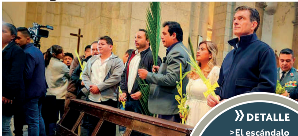
RITO. El Presidente asiste a una misa en la Catedral paceña.

Luego de participar en los actos litúrgicos en la Catedral Metropolitana de La Paz, el Primer Mandatario lanzó duras advertencias contra quienes considera