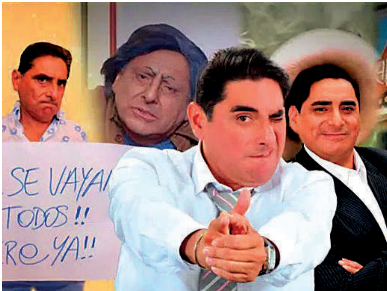
CÓMICO. El derechista Carlos Álvarez, candidato a la Presidencia de Perú.

Muestra que el sondeo muestra inesperados movimientos, por haberse realizado a nivel nacional el jueves y viernes pasados, después de los tres días del múltiple debate entre los 35 candidatos a gobernar Perú durante los próximos cinco años.