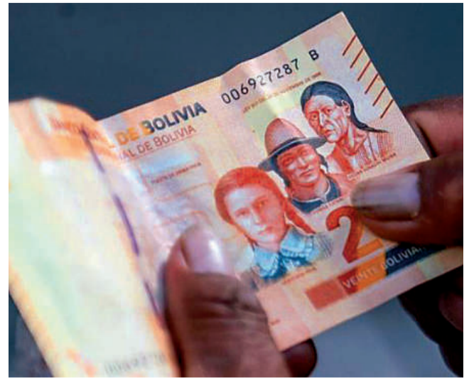
BILLETES. Uno de los valores de serie B, con plena validez legal.

La autoridad insistió en que cualquier ciudadano que posea billetes de la Serie “B”, en los cortes de 10, 20 y 50 bolivianos, que hayan sido obtenidos legalmente pueden acudir a las entidades financieras de todo el país para su canje sin encontrar ningún inconveniente.