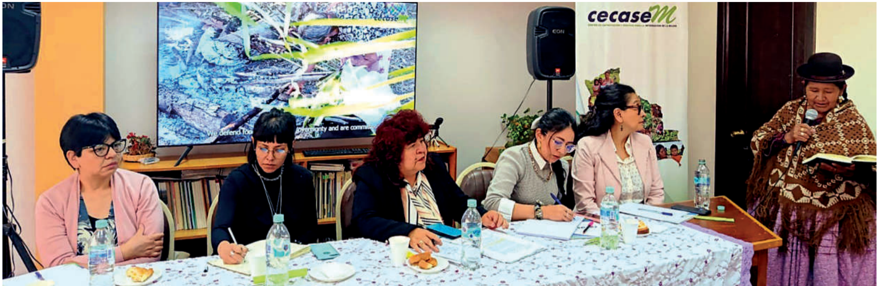
VIOLENCIA. Las expertas, en un debate de la ley, el viernes 6.

La minería, salud y autonomía son la base de trabajo de los postulantes.