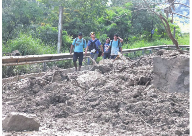
Palizada y lodo sobre la ruta clave que conecta la zona productiva de los valles.

otra gravemente herida, evidenciando la peligrosidad de la ruta en temporada de lluvias.