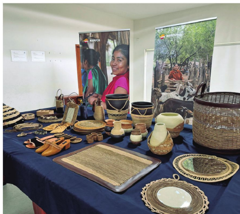
Los indígenas del Chaco también apuestan por las artesanías.

Las comunidades administran un fondo de $us 14 millones