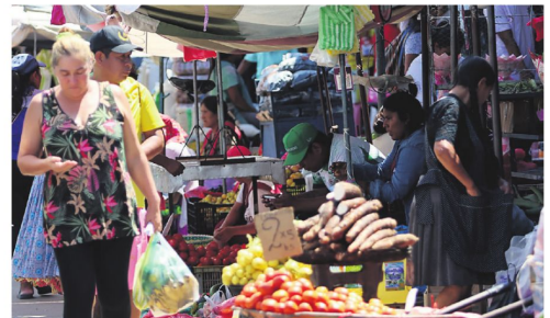
La gente se tiene que dar modos para transitar en medio del caos

La Alcaldía realiza operativos, pero no consigue recuperar la zona. El pasado lunes, un intento por despejar el espacio público en la rotonda terminó en enfrentamientos con piedras y palos, y hubo personas lastimadas. Los comerciantes denuncian uso excesivo de la fuerza por parte de la guardia municipal, mientras que las autoridades justifican las acciones para despejar zonas tomadas.