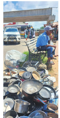
Productos de medio uso también son parte de la oferta

Al desorden se suman los charcos de agua maloliente que se acumulan en sectores del camellón, cerca de los comestibles.