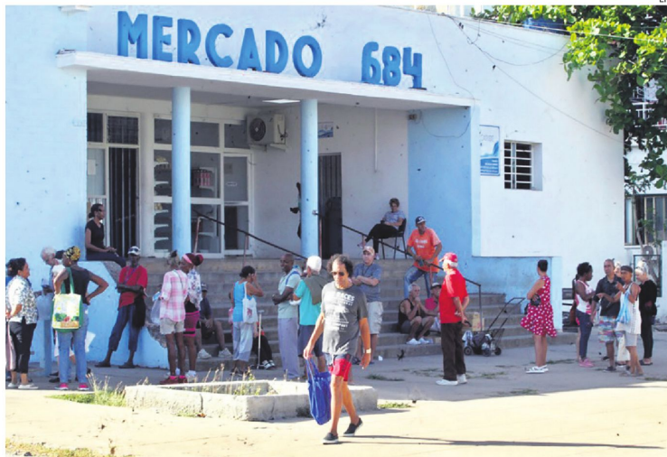
La gente esperando su turno para ingresar ayer a un mercado de La Habana, la capital de Cuba

"Hemos tenido tres 'blackouts' (en menos de un mes) porque los grupos electrógenos del país están sin combustible. Si una central termoeléctrica tiene un problema no se pueden encender para mantener el equilibrio" del sistema.