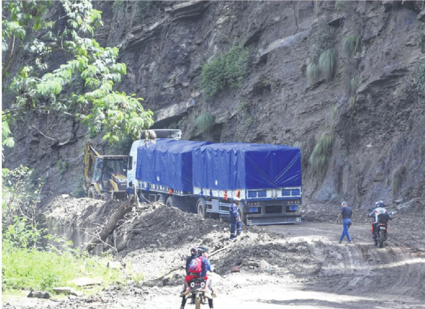
Maquinaria pesada de la ABC intenta habilitar el paso de camiones cargados de verduras