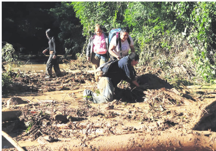
En medio del lodo, estos ciudadanos intentan sortear el obstáculo provocado por la mazamorra del sábado

El cierre fue decidido desde ayer a las 16 horas y debe ser levantado hoy a las 9:00, si las con-