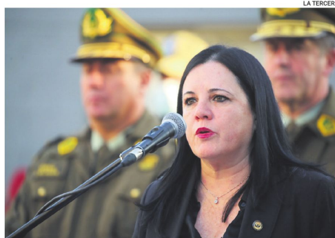
La ministra chilena de Seguridad Pública, Trinidad Steinert.

La propuesta, presentada ante la Comisión de Seguridad del Con-