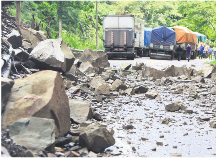
Rocas y lodo dañaron la plataforma especialmente en la zona de Petacas en la ruta que va a Samaipata.