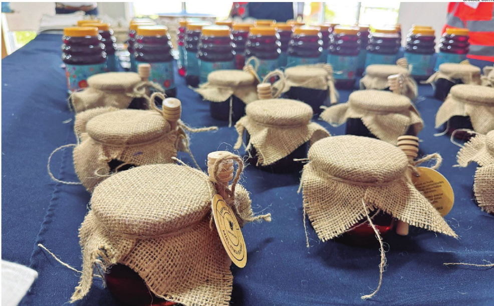
La miel de abeja producida en Chaco boliviano tiene un alto grado de pureza, calidad y vaores nutritivos.