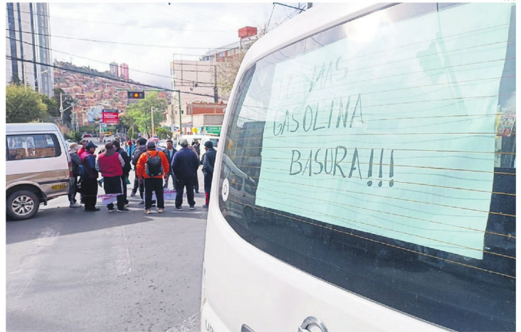
El 25 y 26 de marzo, en La Paz y El Alto hubo una movilización para reclamar por la calidad de la gasolina.

El procedimiento debería desarrollarse este martes con participación de los choferes y autoridades del sector