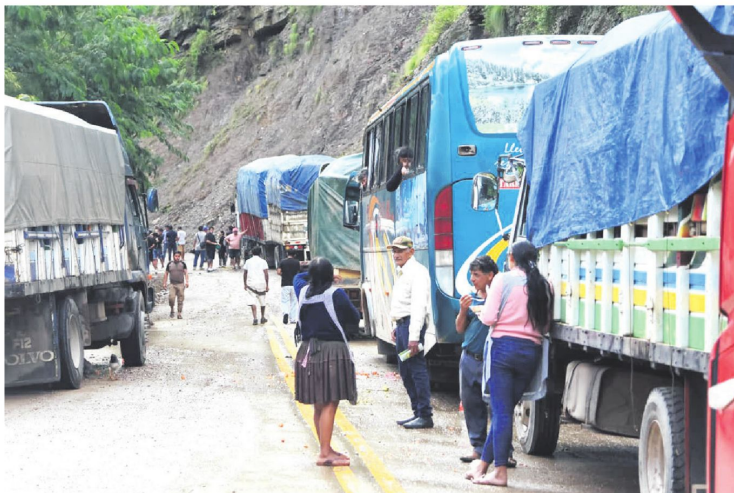
La ABC restringió el tránsito de vehículos de alto tonelaje y esto generó preocupación de productores.