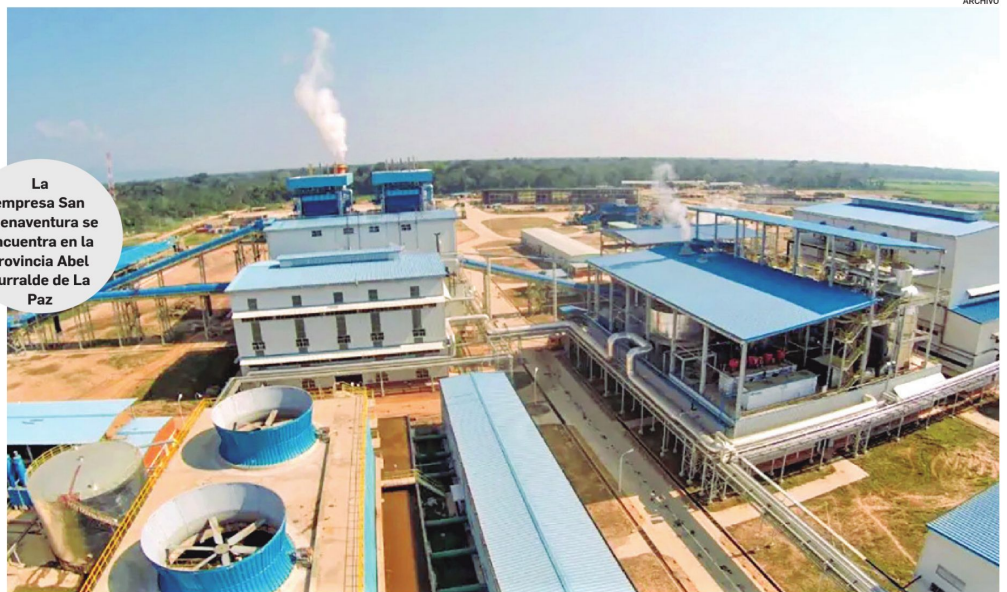
La empresa San Buenaventura se encuentra en la provincia Abel Iturralde de La Paz

Aunque la producción va en ascenso en los primeros años de operación, el crecimiento no logró acercarse a los niveles proyectados en el diseño original, y desde que la EASBA alcanzó su punto más alto de producción en 2020 con el 25%, muestra fluctuaciones