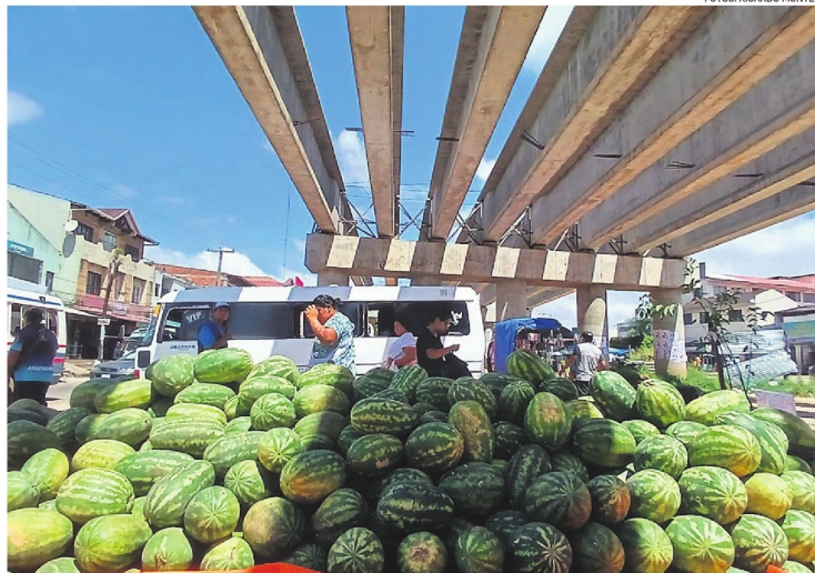
Colocan los productos debajo de la obra que está paralizada en la rotonda de la ciudadela Andrés Ibáñez

Los puestos se extienden por al menos siete cuadras, mientras los vehículos avanzan lento.