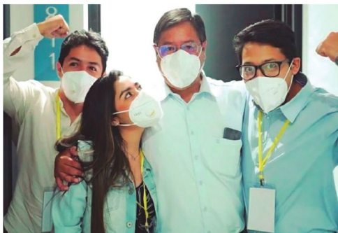
El expresidente Luis Arce junto a sus tres hijos, ahora investigados.

Identificaron a funcionarios de YPFB que actuaron como testaferros