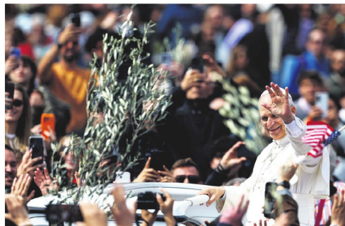
El papa durante el Domingo de Ramos en la Plaza de San Pedro.

dicho que las órdenes del comando interno impedían cualquier tipo de reunión en lugares sin refugio, pero no habíamos solicitado nada público, solo una breve y pequeña ceremonia privada para preservar la idea de la celebración en el Santo Sepulcro", explicó el patriarca.