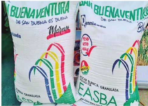
EASBA comercializa quintales de azúcar de 46 kilos.

En el resto del país, han surgido reclamos especialmente por la demora en la anunciada compensación que fue prometida.