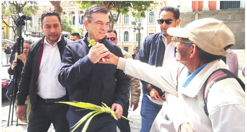
El presidente Rodrigo Paz en las puertas de la Catedral Nuestra Señora de La Paz, ayer después de asistir a la misa de Domingo de Ramos.

El oficialismo compromete transparencia y socialización de todos los proyectos de ley estructurales. Unidad, cuestiona el método y dice que la condición indispensable es hacer ajustes a la Constitución. Esto para dar seguridad jurídica a las inversiones.