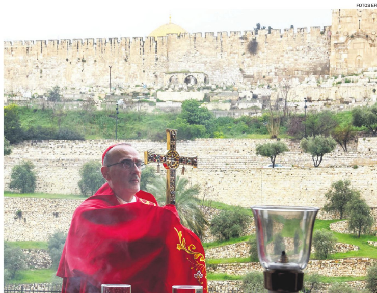
El cardenal Pierbattista Pizzaballa, patriarca latino de Jerusalén, reza desde el Monte de los Olivos.