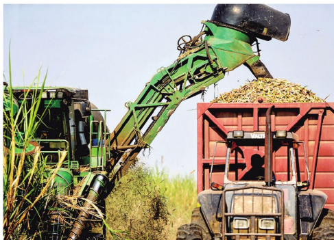
La máxima producción de caña de azúcar fue en 2020.

Camacho también cuestionó la viabilidad de algunos proyectos industriales, al señalar que fueron ejecutados sin garantizar condiciones esenciales como materia prima, energía o logística.