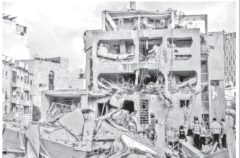
Un edificio tras los ataques de Irán en Tel Aviv, Israel.

“La campaña general contra Irán sigue en pleno apogeo, más allá de lo que algunos medios han publicado”, declaró Netanyahu en un encuentro con autoridades locales del norte de Israel, cerca de la frontera con Líbano.