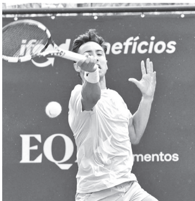
El tenista boliviano Hugo Dellien.

Para pasar de ronda, el tenista nacional tuvo que remontar un resultado adver-