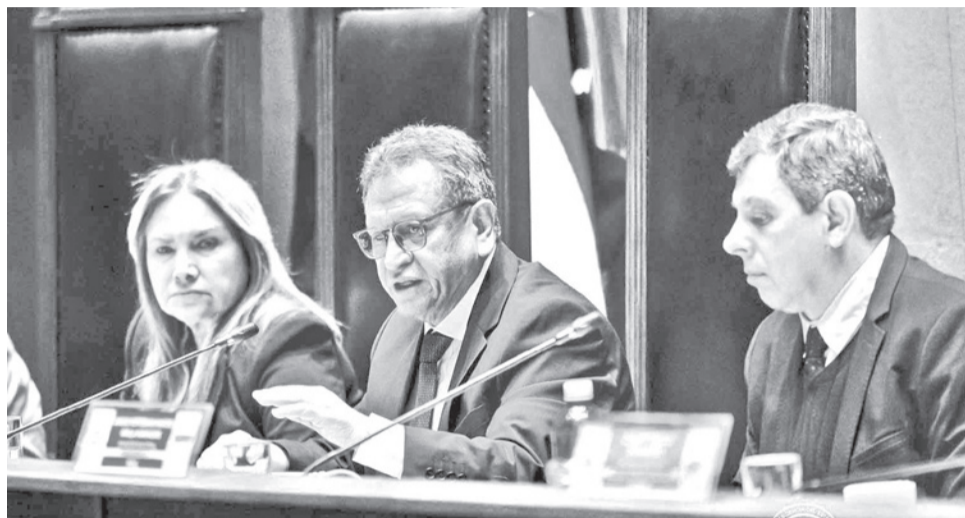
El ministro de Gobierno, Marco Antonio Oviedo, en la Cámara de Senadores, ayer.

Además, Oviedo reveló que durante su gestión recibió presiones externas para influir en el nombramiento de autoridades policiales, aunque aseguró que no accedió a dichas peticiones. “He tenido que afrontar una serie de presiones (...) pero no hemos cedido”, afirmó.