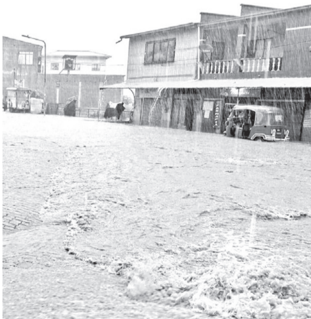
Lluvias en el municipio paceño de Mapiri. MAPIRI LARECAJA

De igual forma, precisó que los avisos hidrológicos