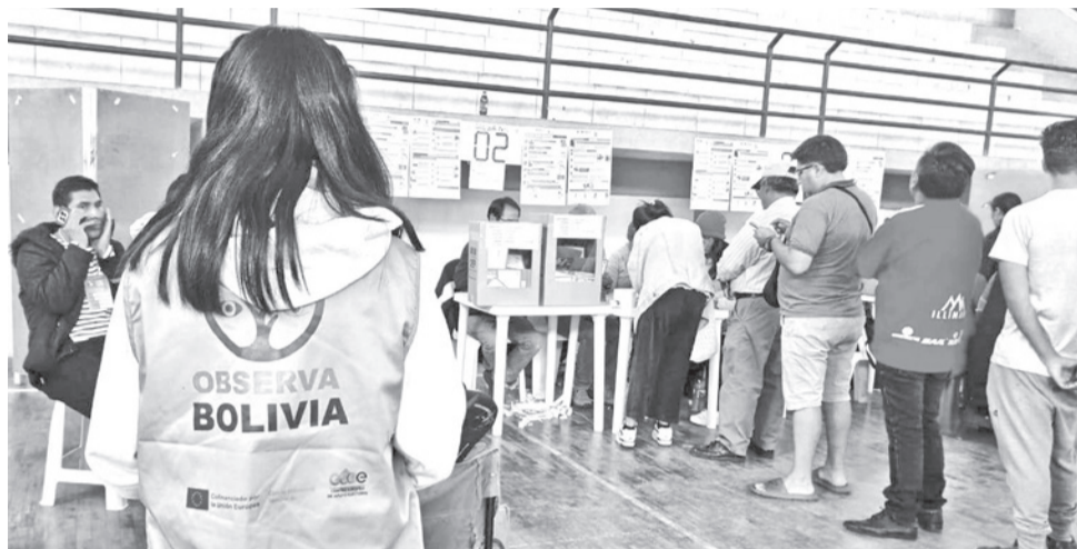
Integrantes de la Misión de Observadores capacitan a ciudadanos en temas electorales. OBSERVA BOLIVIA

-Para la segunda vuelta y procesos electorales futuros, impulsar acciones propositivas de inclusión en favor del voto de personas LGBTIQ+, específicamente para el caso del registro en el padrón biométrico de personas Trans.