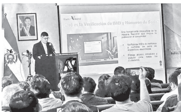
Aduana presenta el módulo DAV para el comercio.