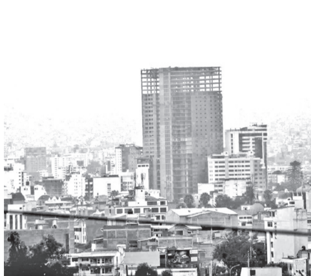
La ciudad cubierta por neblina. CARLOS LÓPEZ