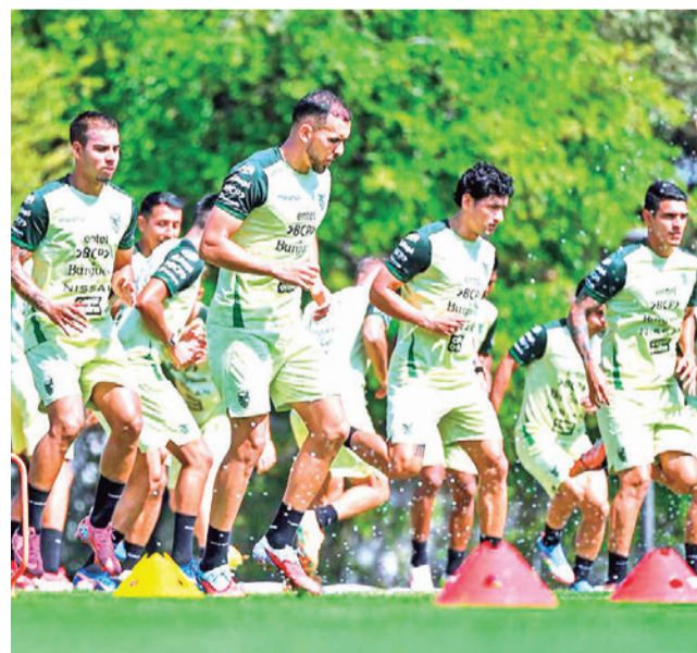
La Verde en pleno entrenamiento en México. FBF

En México, en Guadalajara, se jugará mañana el otro partido por el Repechaje Internacional, entre Jamaica y Nueva Caledonia, el ganador se medirá el martes 31 a República del Congo.