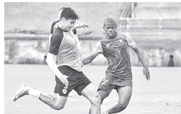
Incidencias del partido de Bolívar, ayer.