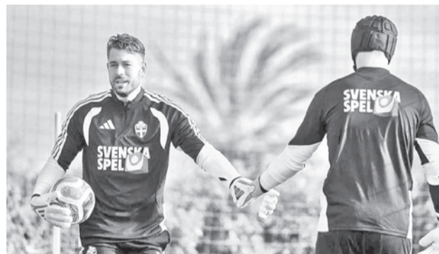
La Selección de Suecia está en el repechaje.