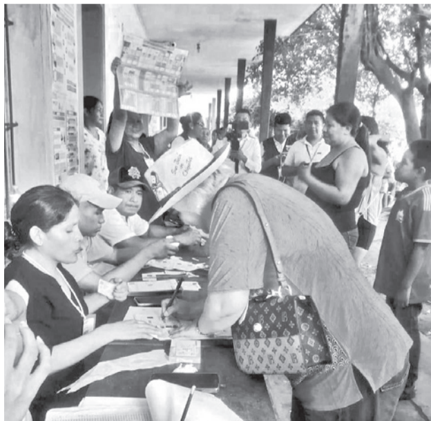
Votación en el municipio de San Ignacio de Velasco.

Bravo reconoció que “ese es una responsabilidad de los técnicos de acá”. Y, además, una vez conocido el proble- ma, “se instruyó inmedia- tamente que se suspenda la votación para gobernadores y asambleístas. La elección a alcaldes municipales se ha llevado con total normalidad, las mesas están cerrando y se están enviando ya el material electoral”, afirmó.