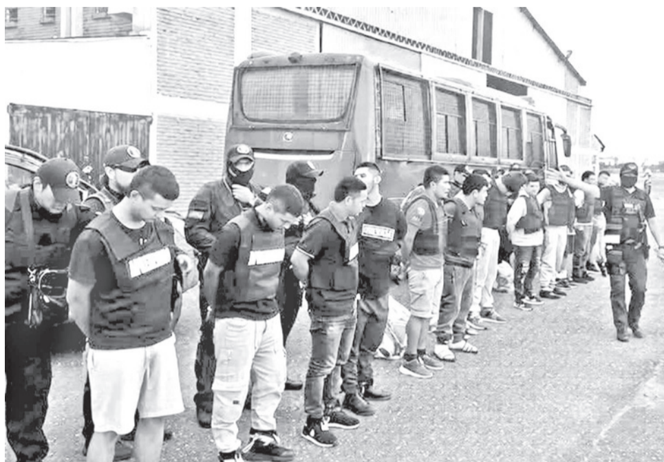
El operativo de traslado de los aprehendidos del caso del narco uruguayo Marset.

A tempranas horas del miércoles, 17 reos fueron sacados de Palmasola (Santa Cruz) para ser trasladados a dos recintos penitenciarios de Bolivia: nueve a Cantumarca y ocho al penal de Chonchocoro, considerado