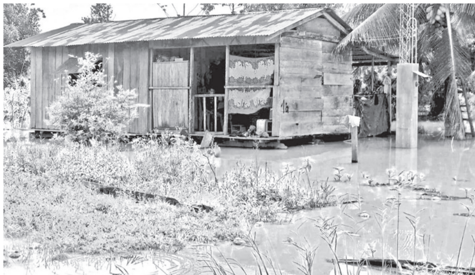
Casas inundadas en Puerto Villarroel, en el trópico.