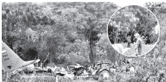
El accidente aéreo en Puerto Leguizamo, Putumayo, Colombia.

Investigación. Equipos técnicos evalúan posibles fallas mecánicas, errores humanos y eventuales excedentes en la carga