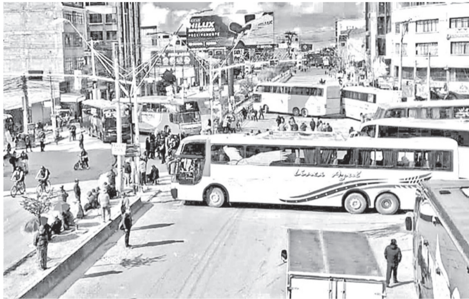
El paro del transporte público en La Paz por la compensación. LA PRENSA

El sector advirtió que la medida de presión podría extenderse a todo el territorio nacional en los próximos días. Según los voceros sindicales, federaciones de Cochabamba, Oruro, Potosí, Chuquisaca y Beni evalúan sumarse a las movilizaciones si no existe una respuesta inmediata del primer mandatario. Los choferes denuncian un incumplimiento sistemático de los acuerdos y aseguran que la presión de sus bases los obligó a abandonar el diálogo con los niveles técnicos del Ejecutivo. En contrapartida, desde la estatal petrolera se defiende