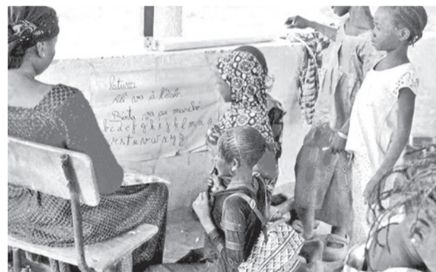
Niños en una escuela de Mali.

Los elementos técnicos son ahora foco central de la investigación.