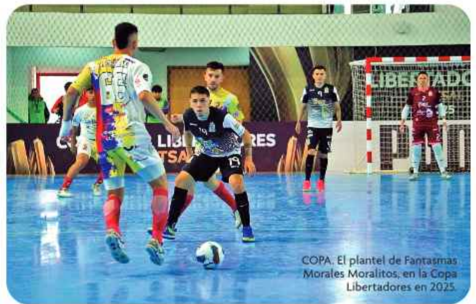
COPA. El plantel de Fantasmas Morales Moralitos, en la Copa Libertadores en 2025.

"No es que no se quiera programar campeonatos en estas ciudades, es que el público no apoyó. En torneos clave no hubo gente y también surgieron otros factores que causaron perjuicios", concluyó.