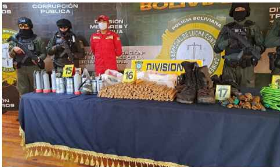
ARSENAL. La Policía exhibió parte de los artefactos secuestrados al grupo.

De acuerdo con informes preliminares del operativo policial, en los lugares intervenidos se encontró escopetas y revólveres, además