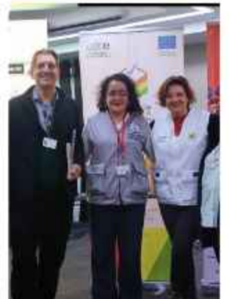
VEEDORES. Integrantes de la Red Observa Bolivia.

Si bien se reportó normalidad general en el territorio nacional, la misión mantiene bajo vigilancia incidentes aislados y puntuales reportados al cierre de mesas.