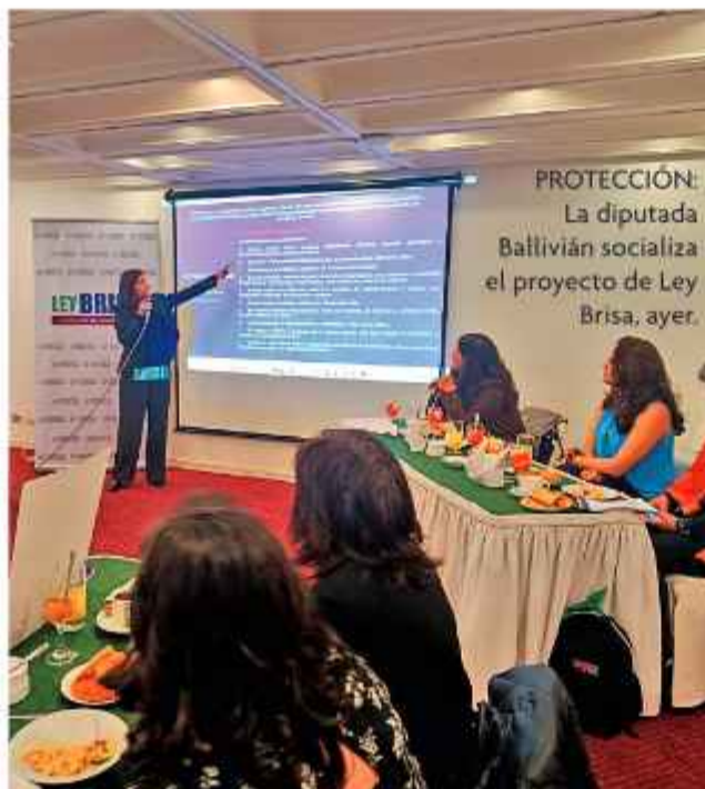
PROTECCIÓN: La diputada Ballivián socializa el proyecto de Ley Brisa, ayer.

Con el objetivo de fortalecer la protección de niños, niñas y adolescentes, el Comité de Derechos de Género de la Cámara de Diputados y al menos 40 organizaciones sociales impulsan la aprobación de la denominada Ley Brisa o Proyecto de Ley 010. Este proyecto propone reformas estructurales al Código Penal, ya que destaca la eliminación de la figura del estupro y la creación del delito autónomo de violación incestuosa, entre otras figuras delictivas.