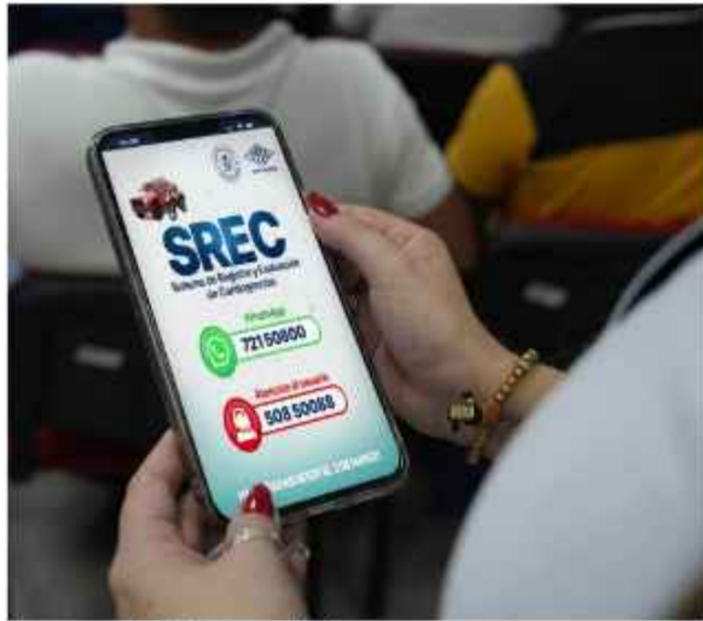
DATO. YPFB habilitó canales de comunicación.

Para facilitar el cobro a los conductores afectados por la gasolina impura en el país, YPFB activó el "pago en ventanilla", a través del Banco Unión, para que los beneficiarios retiren su compensación de forma inmediata y sin trabas.