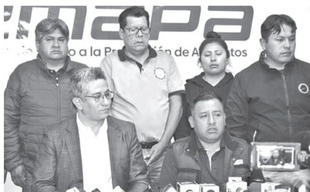
El acuerdo Emapa con los panificadores. EMAPA

“Hemos podido lograr un consenso que tiene ciertos matices que están vinculados por un lado a una devolución 50-50 tanto de producto; es decir, de la harina que esta re-