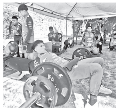
El trabajo físico de los futbolista.