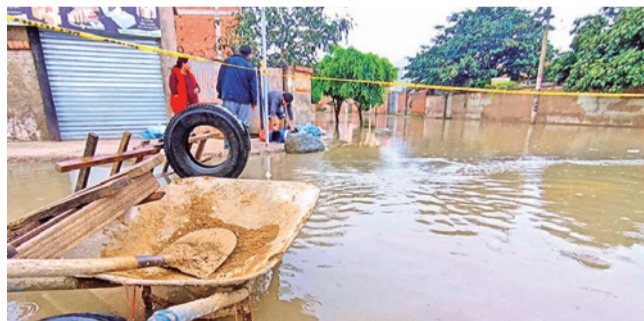
Una de las vías inundadas de Cochabamba. CARLOS LÓPEZ

Riesgo. La UGR movilizó a 400 funcionarios y utilizó 50 motobombas para atender las emergencias