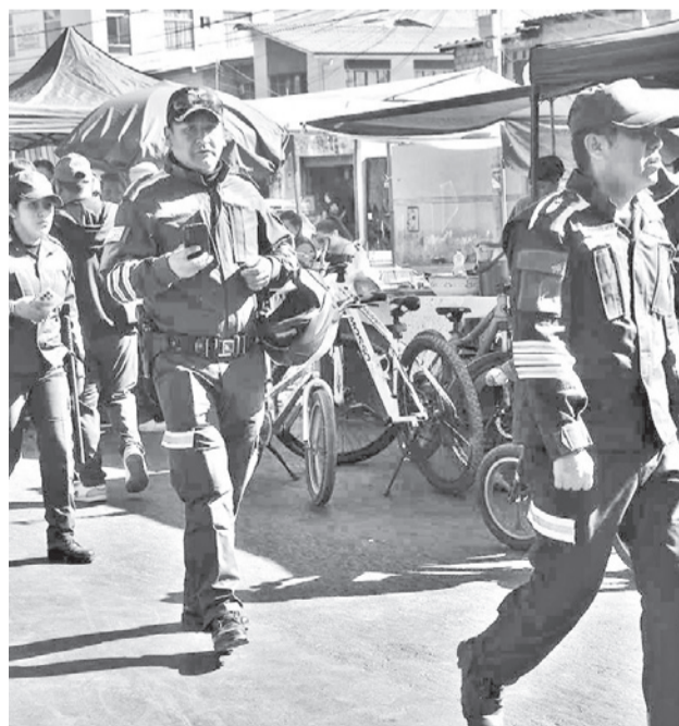
Policías resguardan las calles de la ciudad. CARLOS LÓPEZ

Así también, se prohíbe realizar actos públicos, reuniones, espectáculos de cualquier tipo.