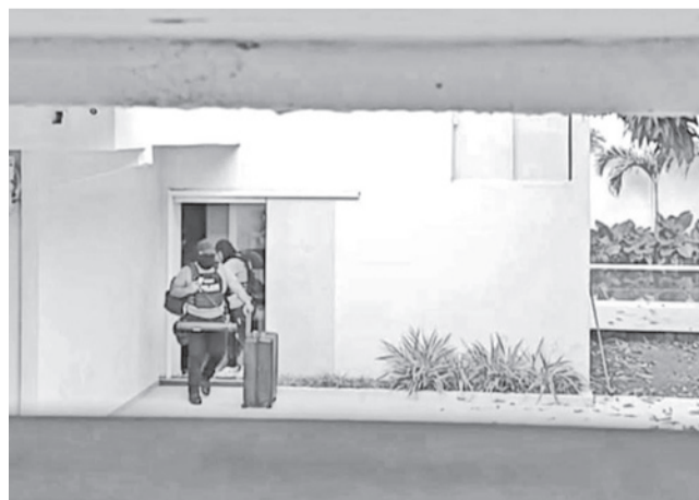
El inmueble donde fue detenido Sebastián Marset.

“Había un dato que no lo habíamos confirmado, de que existía un pasadizo en el domicilio donde fue aprehendido Marset (y conectaba) a una casa que estaba en la parte posterior. Esto lo corroboramos posteriormen-