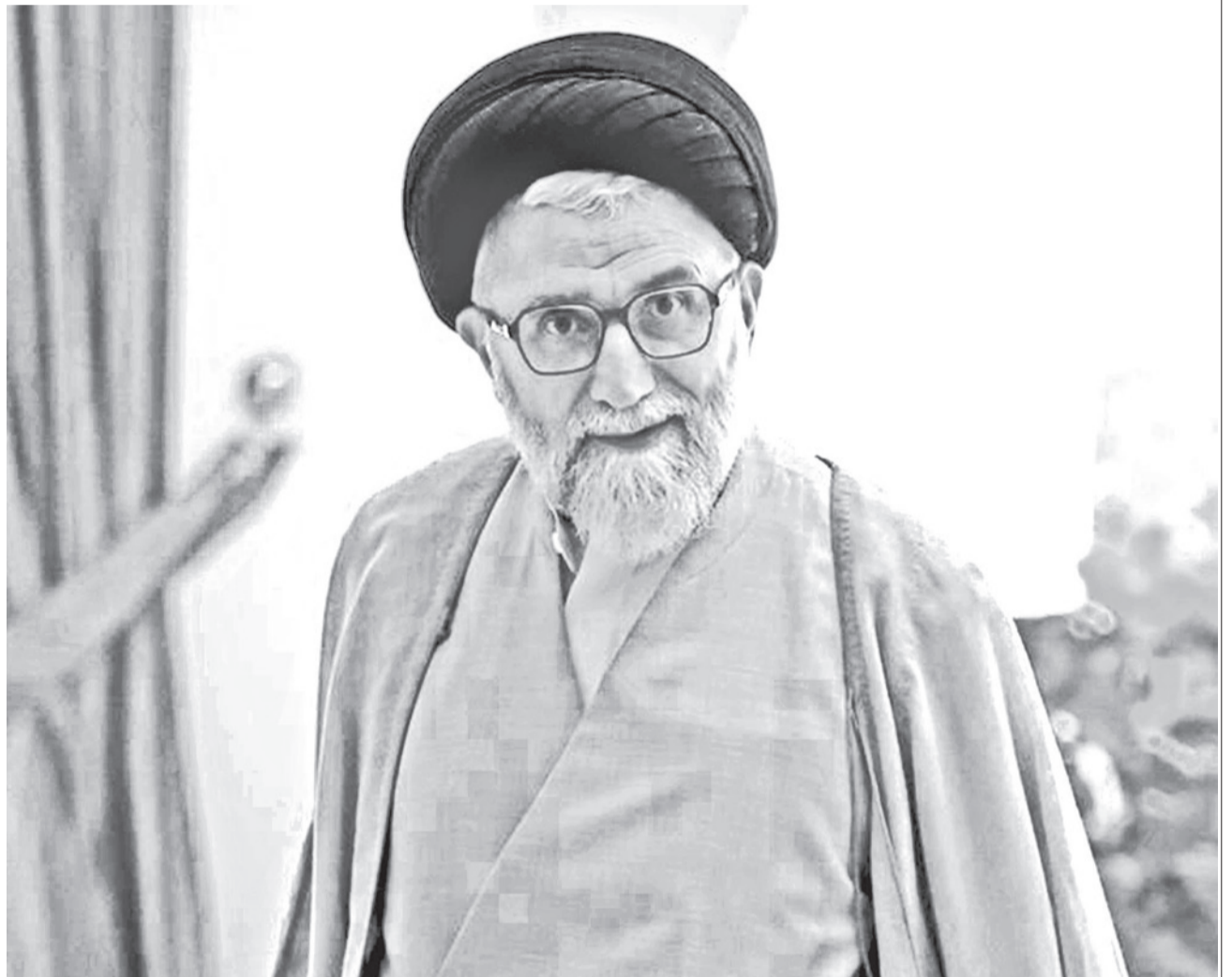
Ismail Jatib, ministro de Inteligencia de Irán, asesinado por Israel.

Baja. La muerte del ministro de Inteligencia se suma a la lista de dirigentes iraníes asesinados desde el inicio de la guerra