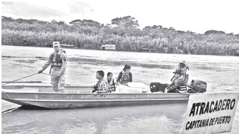
Traslado de las maletas electorales a los recintos del Tipnis, ayer. TED

“No existirá en estas elecciones subnacionales la prohibición del uso de dispositivos móviles”, confirmó el vocal del Tribunal Supremo Electoral (TSE), Ramiro Canedo. En las elecciones generales de 2025, el TSE dispuso que los electores ingresen a los recintos de votación sin celulares, aunque esa determinación no se cumplió totalmente.