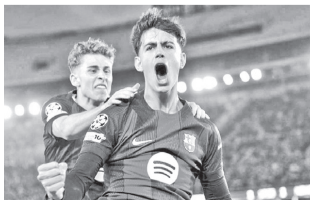
El festejo del Barcelona ante el Newcastle.

Barcelona ganó con goles del delantero Raphinha, por