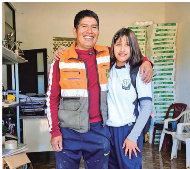
Sus cuatro hijos son el motor de su vida.