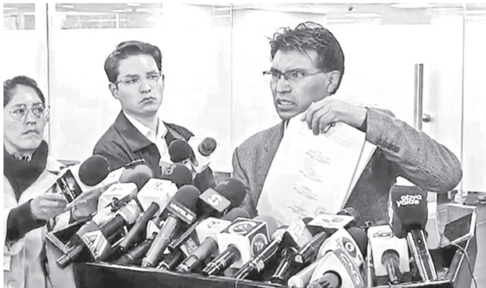
El senador Nilton Condori en conferencia de prensa. RRSS

La primera vicepresidenta de la Cámara de Senadores, Soledad Chapetón, informó ayer que el senador Nilton Condori, de la Alianza Unidad podría ser suspendido, luego de que tres denuncias en su contra fueran remitidas a la Comisión de Ética del Senado. Consultada sobre la suspensión, la asambleísta Chapetón indicó que “esa es una de las sanciones”, aunque existen distintos tipos de medidas según la infracción cometida. La decisión final dependerá de los miembros de la Comisión de Ética.