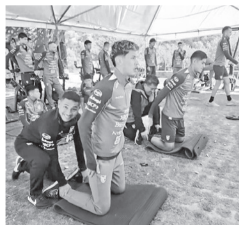
El entrenamiento de los jugadores.