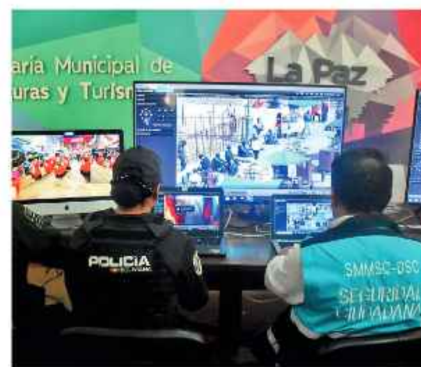
CONTROL. Monitorearán las fiestas en La Paz.

La Policía instó a las familias a denunciar cualquier comportamiento irregular a través de la línea gratuita del BOL-110 o en las oficinas de la FELCC.