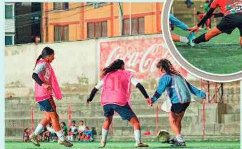
ENTRENAMIENTO. Jugadoras de la Fundación en un entrenamiento.

"Para participar en esta Copa recibimos la invitación que envió la Federación Latinoamericana de Ciudades Turísticas, que además considera nuestro proyecto (para jugadoras) y que quiere replicarlo en 12 países que forman parte de esa