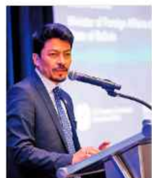
MINISTRO: Fernando Aramayo.

La organización cruceña La Casa de la Mujer emitió ayer un contundente rechazo a las recientes declaraciones públicas del ministro de Relaciones Exteriores, Fernando Aramayo, quien considera que es parte de una “viveza criolla” y “epidemia” el registro de embarazos entre las funcionarias del servicio exterior, como supuestos actos en busca de paralizar las desvinculaciones laborales.