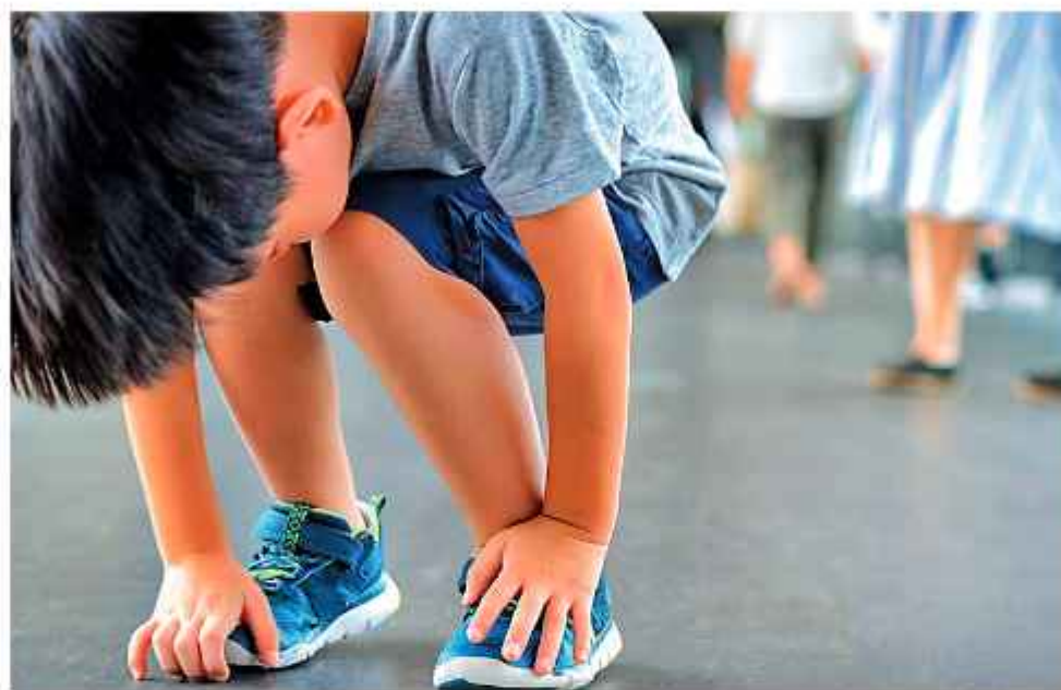
VIOLENCIA. Dos de las víctimas eran sobrinos del agresor. Fotografía ilustrativa.

El operativo se activó después de una denuncia que alertó a las autoridades