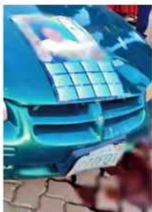
HECHO. Este es el vehículo protagonista.

Ayer por la tarde, una persona murió y varias quedaron heridas cuando se produjo un hecho de tránsito en el municipio de Calamarca, departamento de La Paz. El suceso ocurrió cuando un vehículo irrumpió violentamente en el evento de una campaña política que se desarrollaba en ese sector del altiplano.