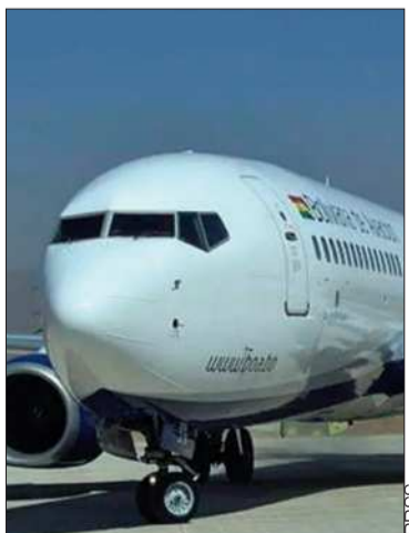
Un avión de BoA en pista.

El sector hotelero del país reportó una caída del 74% en esa actividad