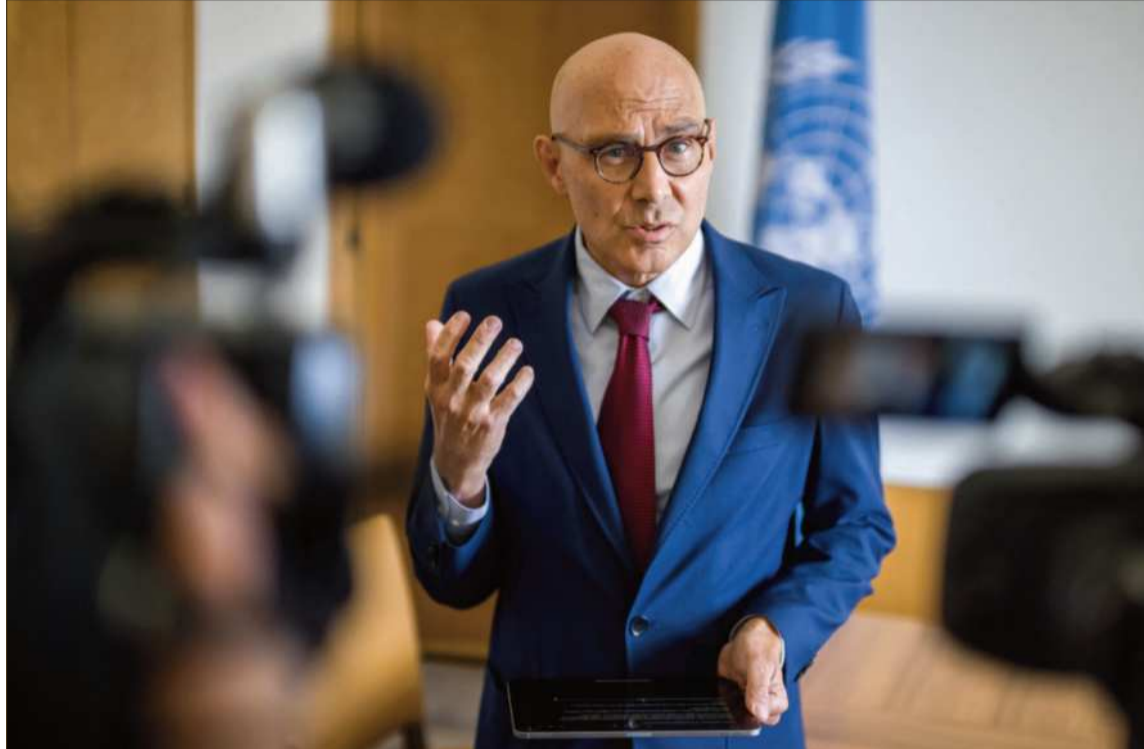
REPRESENTANTE. Volker Türk conversó con la presidenta encargada de Venezuela, Delcy Rodríguez