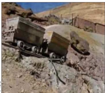
Una mina en Potosí

Las autoridades policiales investigan dos hechos ocurridos en Porco