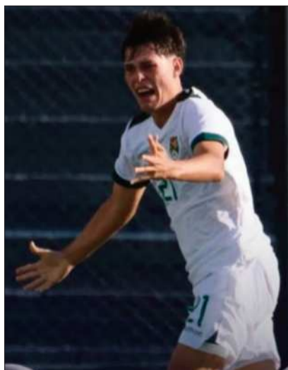
Escena de una parte del encuentro.

La selección tuvo buena actuación en Argentina. Hoy jugará ante Ecuador