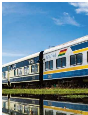
El tren hará un único viaje.

El servicio partirá desde Viacha y se propone impulsar el turismo.