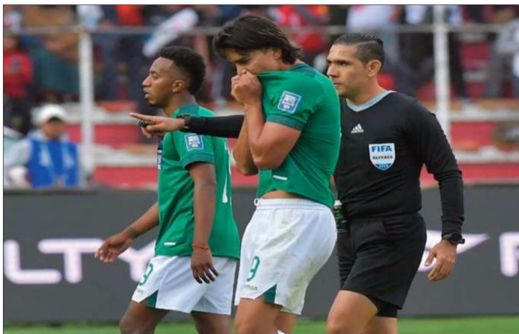
ELIMINATORIA. El ariete Marcelo Martins durante un partido anterior con la Selección Boliviana.