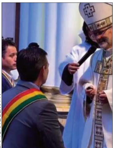
Ambas autoridades, en la misa.