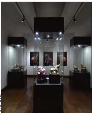
Interior del MUSEF.

El MUSEF y el Marina Núñez del Prado cuentan con nuevas autoridades