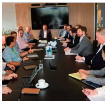
Una visita anterior de la USTDA

La USTDA afirmó que está 'comprometida' en asociarse con el país