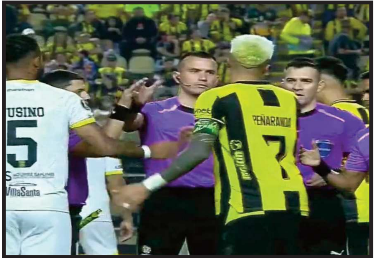
SALUDO. Los capitanes de cada plantel poco antes de que se ejecuten los penales en Pueblo Nuevo.

► Banegas fue la figura durante el cotejo. Camargo eliminó al cuadro paceño