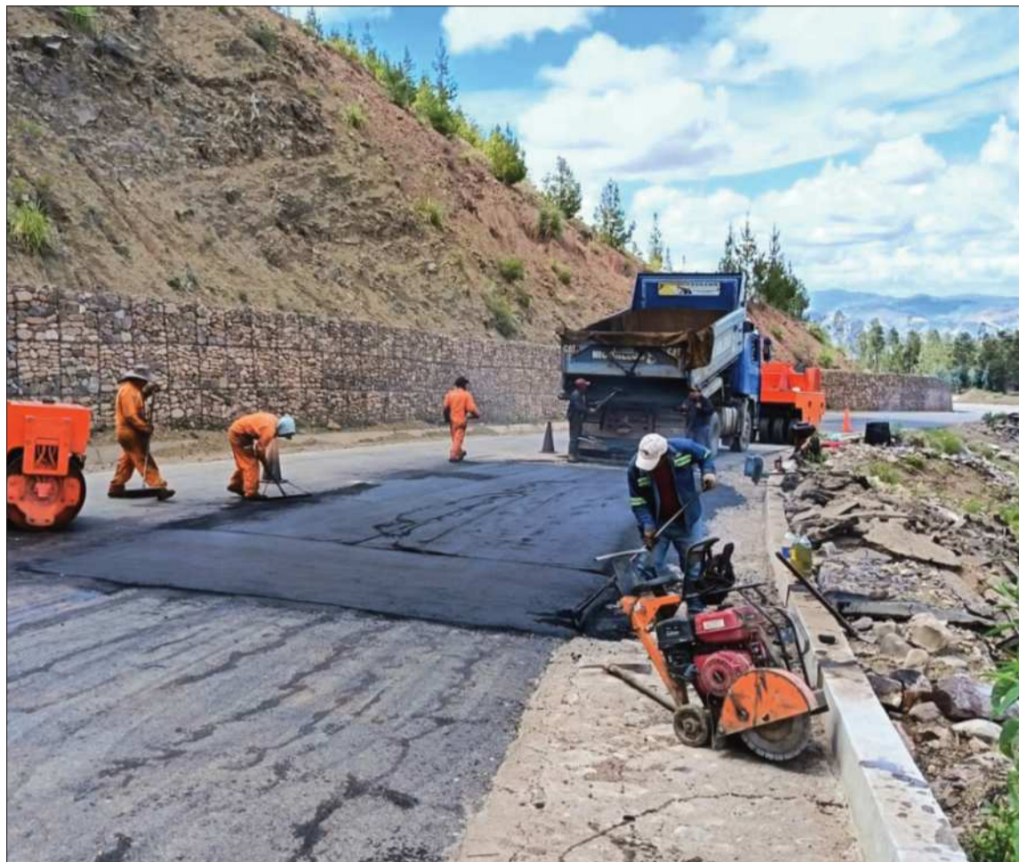
TRABAJOS. Personal de la Administradora Boliviana de Carreteras realiza tareas de mantenimiento.

CARRETERAS. El viceministro detalló que el esquema permitiría a inversionistas privados asumir la construcción y el mantenimiento de las carreteras, a cambio de una concesión vial administrada por un directorio participativo. Este directorio estaría conformado por actores públicos y privados vinculados directamente a cada corredor estratégico.