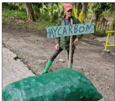
Un vendedor de carbón en Cuba

La falta de combustible afecta seriamente a la isla tras el cerco de EEUU.