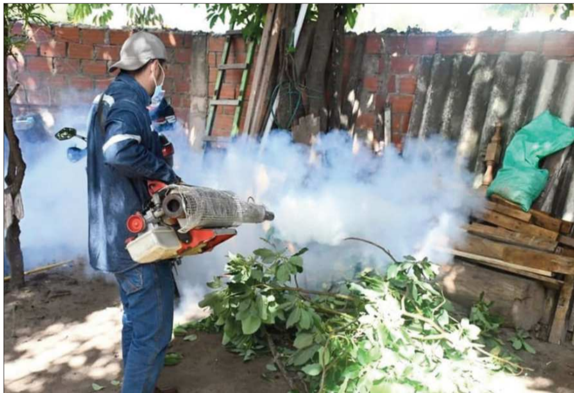
FUMIGACIÓN. Personal del Sedes de Santa Cruz realiza fumigaciones para eliminar los criaderos de mosquitos.

Asimismo, exhortó a la población a reforzar las medidas de