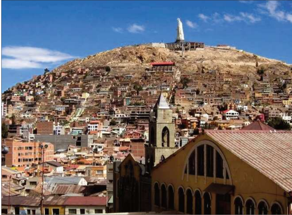
CELEBRACIÓN. Una vista panorámica de la ciudad de Oruro por su gesta libertaria.

"Su aporte desde la minería, el comercio, la integración y su enorme riqueza cultural son clave para la economía del país y para el trabajo de miles de familias. Seguimos comprometidos con impulsar más oportunidades, inversión y desarrollo para