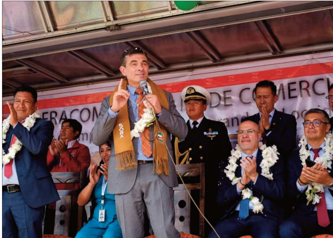
PRESIDENTE. Rodrigo Paz durante su alocución en la celebración del aniversario cívico de Oruro.

Al respecto, Paz Pereira se comprometió a explicar a detalle a los legisladores lo que se hará con los recursos y el impacto social que tendrán los proyectos