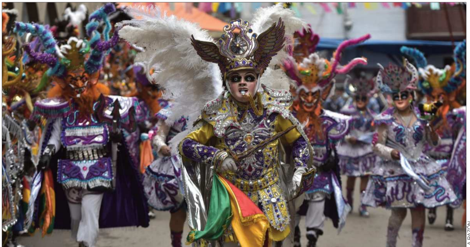
CARNAVAL. La danza de la Diablada una vez más engalanará las calles orureñas en la gran entrada folklórica del sábado.

de nuestra mamita del socavón”, puntualizó el titular de la ACFO.