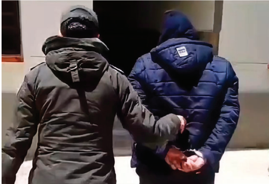
El hombre es investigado por el delito de pornografía

De acuerdo con el reporte, el hombre intentó darse a la fuga, pero fue retenido por comerciantes y transeúntes hasta la llegada de las