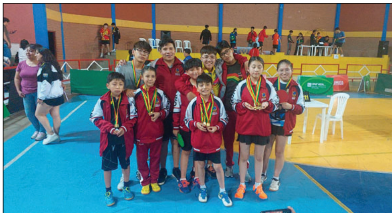
La delegación orureña cumplió una buena campaña en el torneo nacional

El certamen nacional, no solo permitió medir fuerzas entre las distintas delegaciones, sino también proyectar a nuevos talentos que comienzan a consolidarse en el ámbito nacional. Para Oruro, los resultados obtenidos son un aliciente para seguir trabajando en el desarrollo del tenis de mesa.