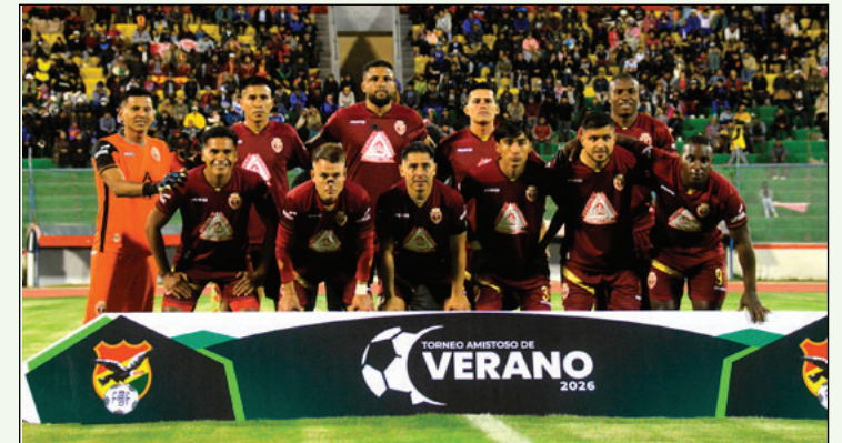
El equipo de CDT Real Oruro, se enfrentará a ABB en el torneo de repechaje

Cabe mencionar que el campeón del torneo de verano será recompensado con 15 pasajes aéreos en la temporada 2026 y el subcampeón obtendrá siete.