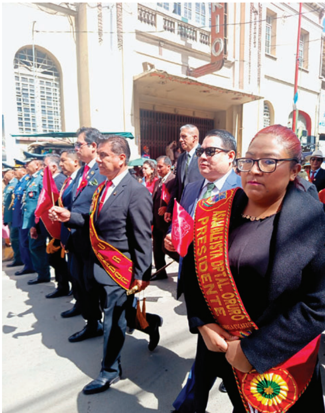
Autoridades municipales, departamentales y nacionales participaron del tradicional desfile