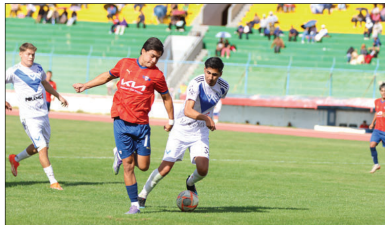
El encuentro entre "santos" y "aviadores" terminó en tablas (1-1)