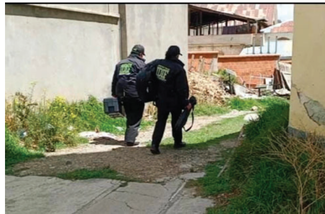
La Felv encontró el cuerpo de la mujer debajo de una cama

Durante las actuaciones investigativas también fue aprehendido el padre del sospechoso con fines investigativos, ante la pre-