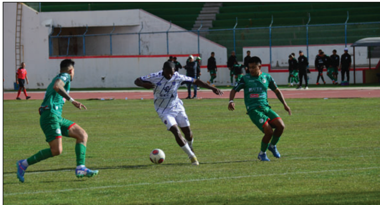
Oruro ya tiene a seis equipos clasificados, entre ellos Ingenieros / LA PATRIA

El inicio en abril, permitirá que los equipos tengan un tiempo prudente de preparación, considerando que muchos de ellos ya se encuentran en plena etapa de formación. La División Aficionados busca garantizar un campeonato competitivo, transparente y atractivo, que mantenga la esencia de ser el puente hacia el profesionalismo.