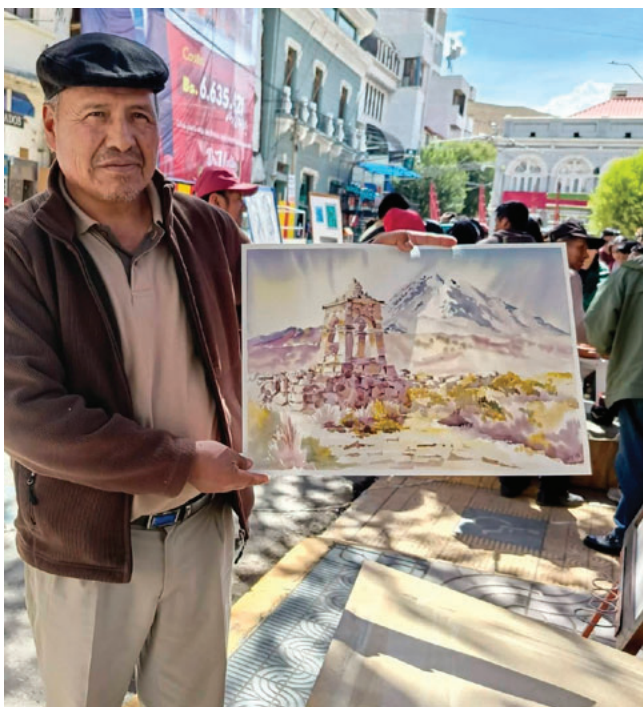
Uno de los docentes junto con su obra

la jornada, consolidando el evento como un digno homenaje a Oruro en el marco de sus celebraciones cívicas. Los docentes remarcaron que, con esta actividad, el arte se sumó a las expresiones conmemorativas del 245 aniversario de la gesta libertaria, reafirmando que la historia y la identidad orureña también se construyen y se celebran desde la creatividad y la cultura.