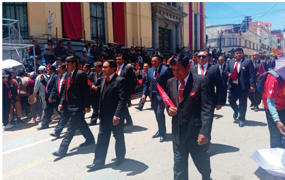
Con orgullo llevan la bandera de Oruro