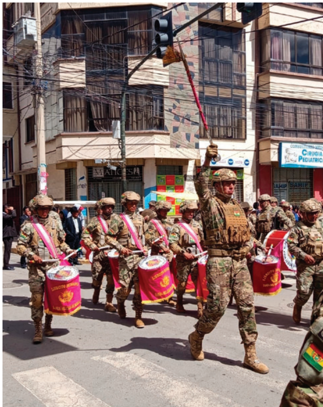
Con fervor cívico, militares fueron parte de los actos por la gesta libertaria