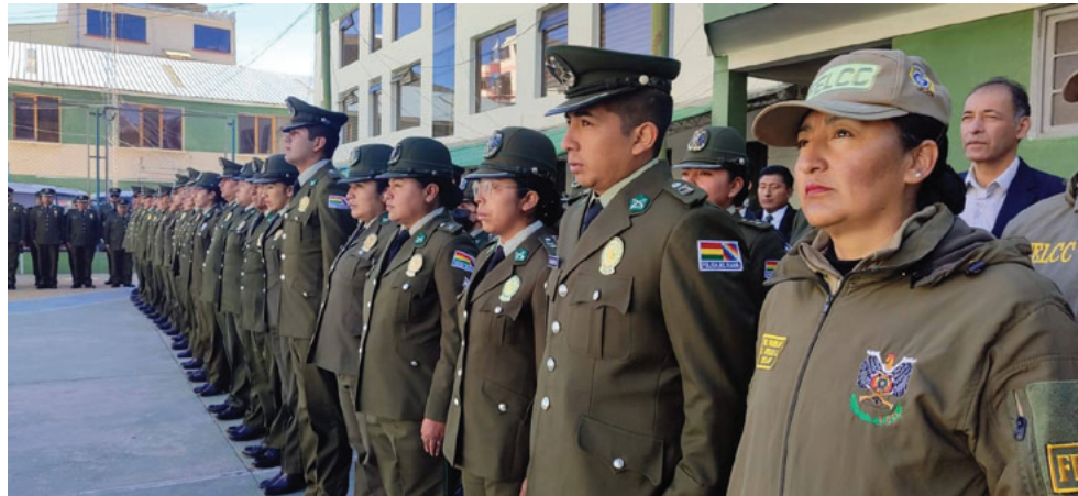
Efectivos policiales de Oruro

Indicó que se trata de diferentes conductas irregulares detectadas en unidades policiales y puestos operativos, por lo que los uniformados investigados pueden enfrentar sancio-