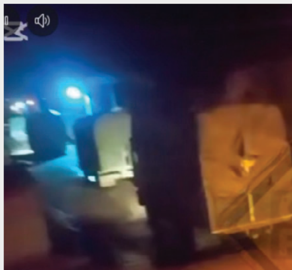
La Fiscalía abrió un proceso de oficio