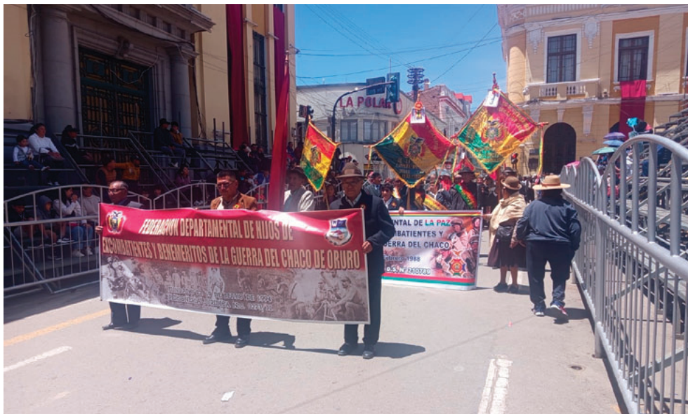
Hijos de excombatientes ingresan por la Plaza 10 de Febrero