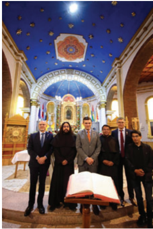
El Presidente Rodrigo Paz visitó la Basílica Menor Nuestra Señora del Socavón