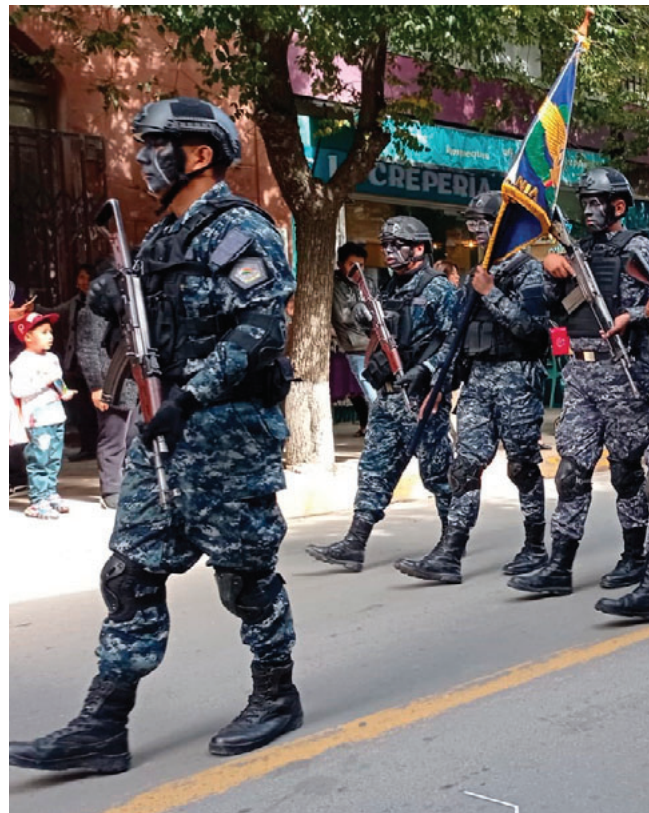
A paso firme, Fuerzas Armadas fueron parte del desfile en honor a Oruro