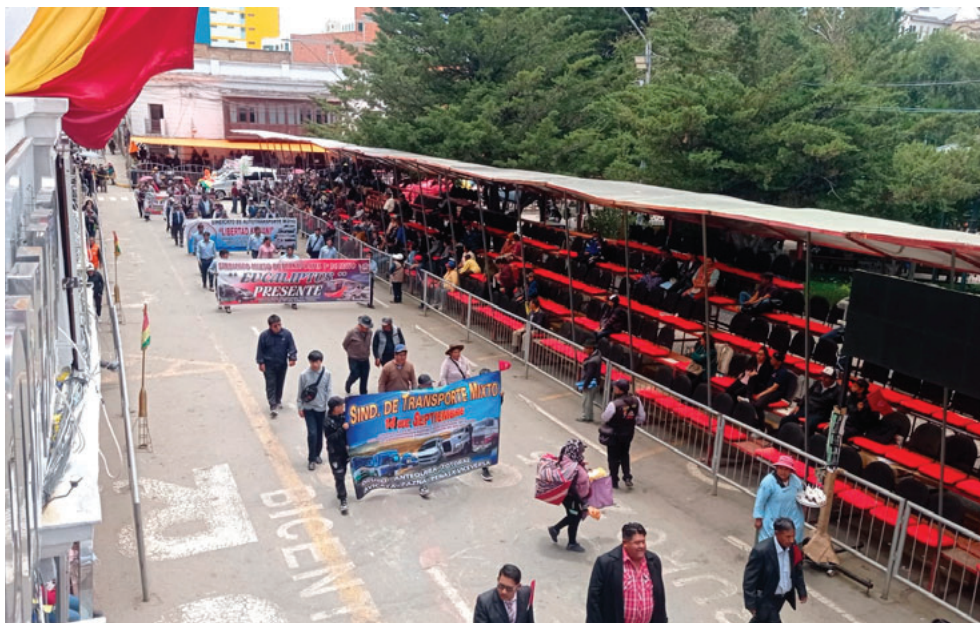
Instituciones vivas participaron por el 10 de febrero de 1781