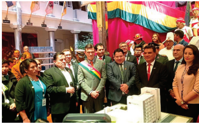
El Presidente Rodrigo Paz junto con autoridades departamentales y municipales de Oruro

“Hemos conseguido los recursos para restaurar la Basílica Menor del