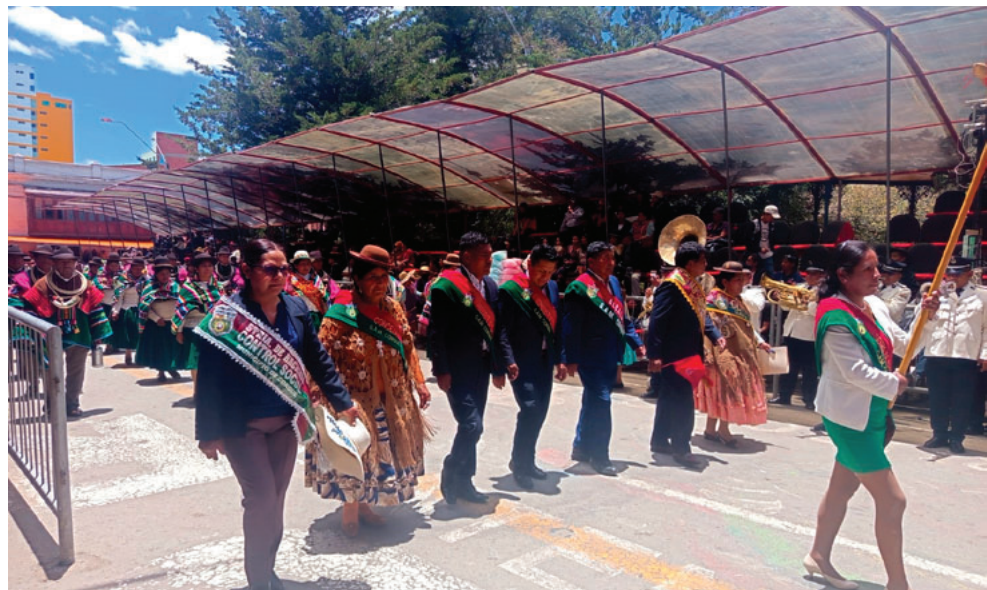
Autoridades de Corque hacen su paso por la calle Presidente Montes