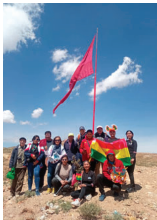
Como cada fecha cívica, se rindió homenaje con la bandera gigante / CEDIDA A LA PATRIA

La concentración se realizó en puertas de la Basílica Menor de Nuestra Señora del Socavón, desde donde los participantes iniciaron la caminata cuesta arriba portando el emblema rojo carmesí,