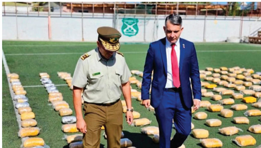
La Fiscalía de Chile secuestró más de una tonelada de droga

Las diligencias permitieron identificar a los presuntos implicados y, posteriormente, con apoyo de unidades especializadas, efectivos policiales realizaron allanamientos en tres domicilios de la ciudad de Calama, donde fueron aprehendidos un