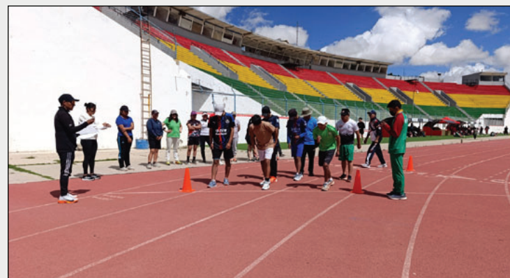
Conflictos internos complican al atletismo municipal de Oruro

La AMDO, amparada en la Ley Municipal del Deporte N° 060/2018 y la Ley Nacional del Deporte N° 804, pretende que la reunión de esta noche sea un espacio de decisión y solución. Entre los puntos a tratar se incluyen el informe jurídico sobre la situación legal del directorio, el análisis de los perjuicios ocasionados a los atletas, la definición sobre la regularización inmediata del registro institucional o la formación de un Comité Electoral transitorio, y la coordinación de acciones para recuperar el apoyo institucional y deportivo.