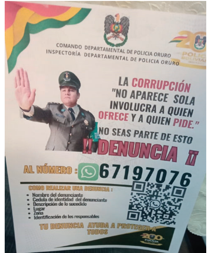
Afiches con contactos donde la ciudadanía puede denunciar hechos de corrupción

El fiscal departamental Aldo Morales también se refirió a un caso reciente relacionado con un intento de soborno a policías. Señaló que dos mujeres extranjeras se aproximaron a dependencias policiales con la finalidad de ofrecer dinero a cambio