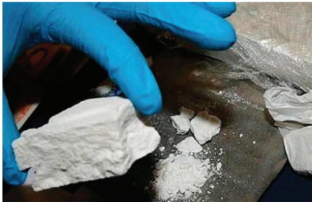
El hombre fue hallado con más de 2 kilos de cocaína /REFERENCIAL

En la revisión de pasajeros, los uniformados antinarcóticos advirtieron que uno de los pasajeros