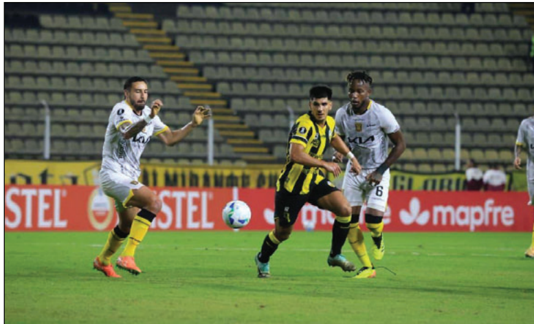
Los locales dominaron gran parte del partido jugado en San Cristóbal

A los 32 minutos, Banegas fue vencido cuando un centro fue conectado de cabeza por Pollero, llevándose por delante a José Moya.