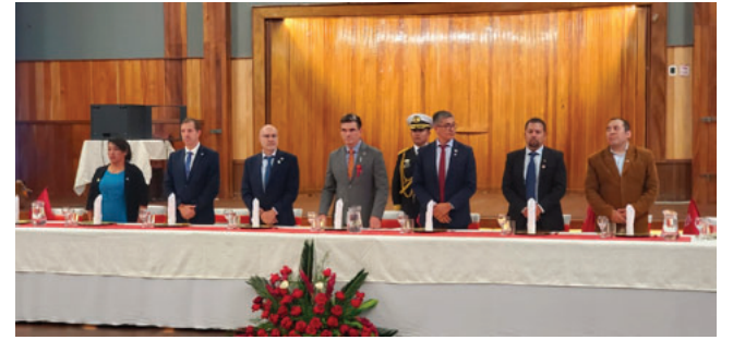
Almuerzo por la efeméride departamental de Oruro

De aprobarse, podría marcar un cambio en la política de infraestructura vial del país y abrir