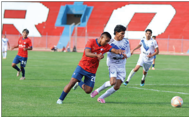
Interesante encuentro el que se disputó entre San José y Wilstermann

San José presentó un elenco alternativo, formado por futbolistas que en algún momento vistieron la casaca de la "V" azul y por integrantes del plantel que compete en la