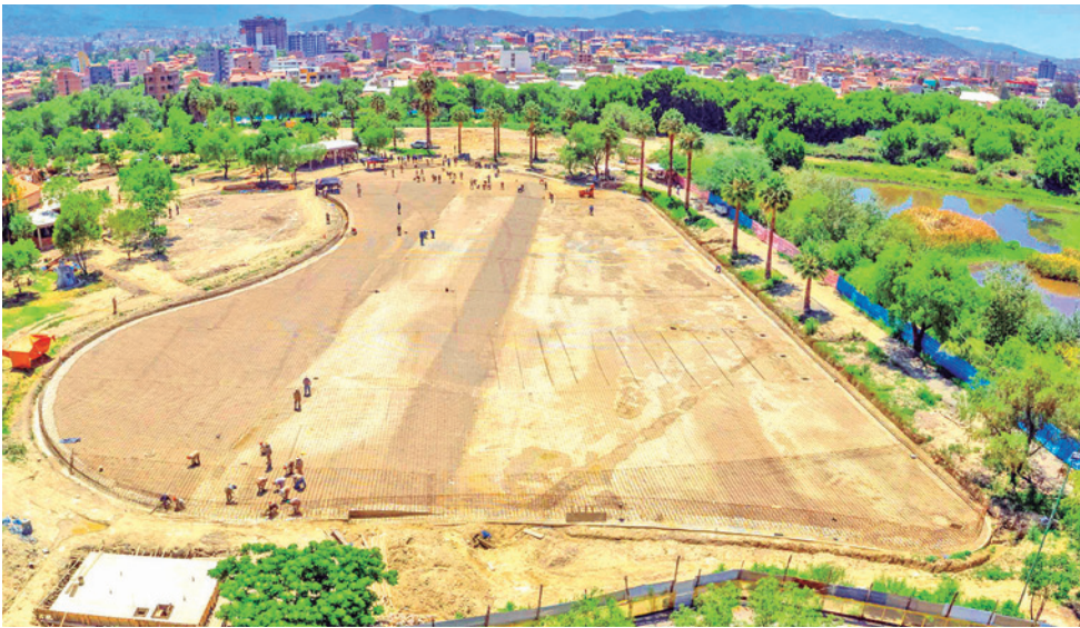
La construcción e inspección a Playa Turquesa, en la laguna de Coña Coña.