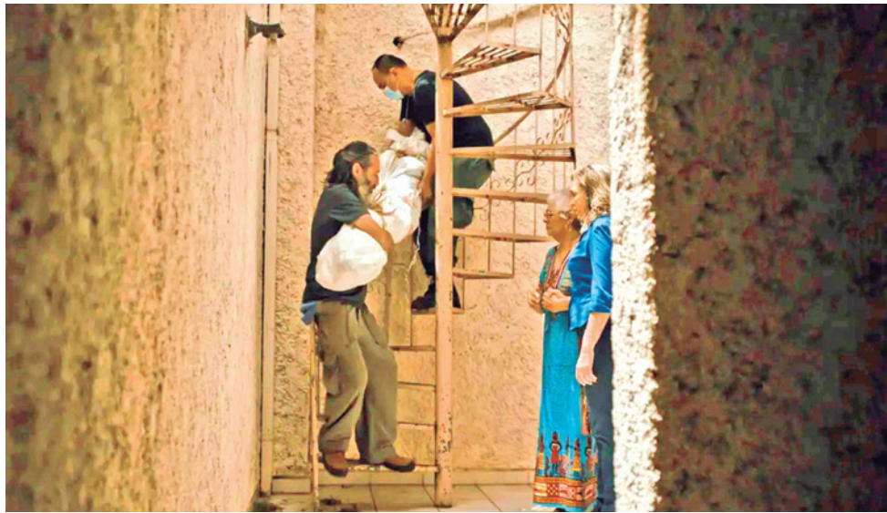
Fotograma del filme boliviano de ficción El último blues del croata , de Alejandro Suárez. EUC

Expectativa. El último blues del croata tiene 12 menciones, la entrega de los Premios Platino 2026 es el 9 de mayo en la Riviera Maya, México