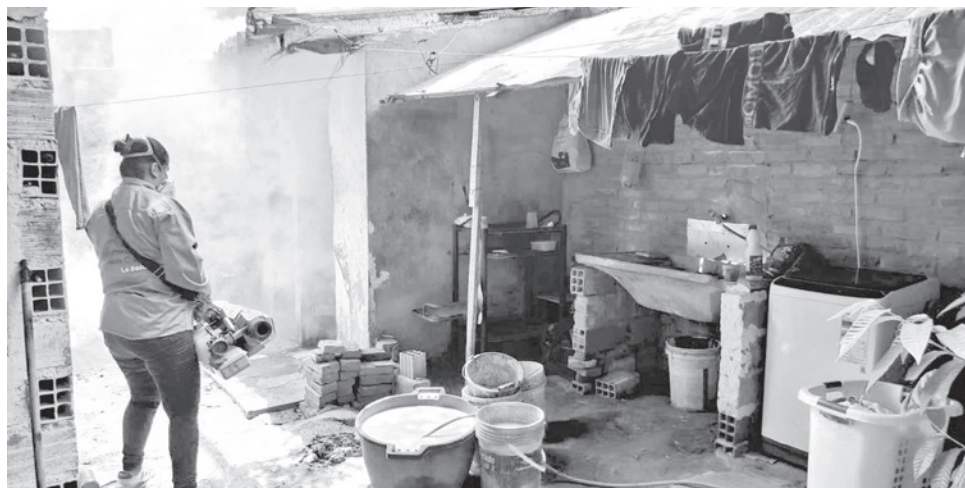
Trabajos de limpieza para evitar la propagación del mosquito transmisor de la enfermedad. GADSC

En Cochabamba se reportaron 12 casos de chikungunya esta semana, con una reducción del 68% en comparación con semanas anteriores. Los municipios afectados son Puerto Villarroel y Villa Tunari. El Servicio Departamental de Salud (Sedes) de Cochabamba recomienda destruir criaderos y notificar inmediatamente a los centros de salud ante la aparición de síntomas. Sobre el dengue en Cochabamba, el Sedes no reportó casos en la primera semana, pero se mantienen 20 notificados en el departamento (11 autóctonos y 9 importados).