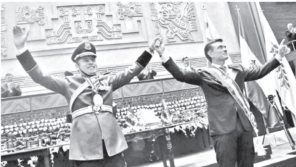
El vicepresidente Edmand Lara y el presidente Rodrigo Paz, el día de su posesión.