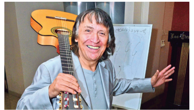
El showman Vicente Valenzuela en una imagen de archivo.