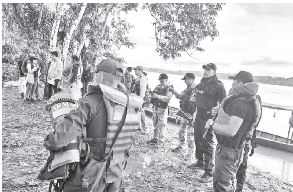
La destrucción de campamentos para la explotación de minería ilegal en el Beni.