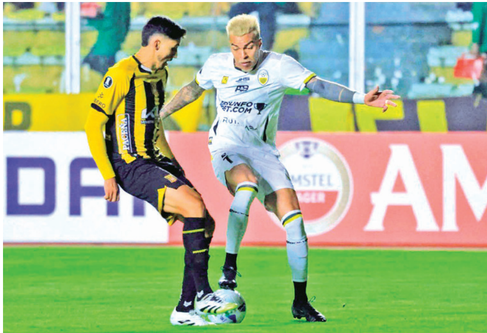
El primer partido entre The Strongest y Táchira, en La Paz.