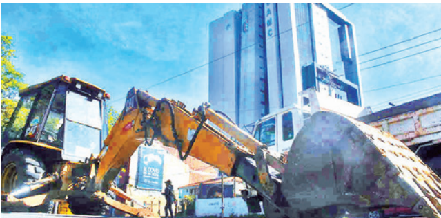
El bloqueo de los constructores en la Colón. JOSE ROCHA

Versión. El gobierno municipal explicó que existe un retraso en el desembolso de las partidas del presupuesto del gobierno central