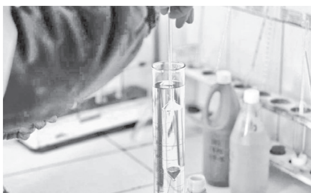
El control de calidad que se realiza en YPFB. YPFB

YPFB indicó que en diciembre de 2025, se publi-