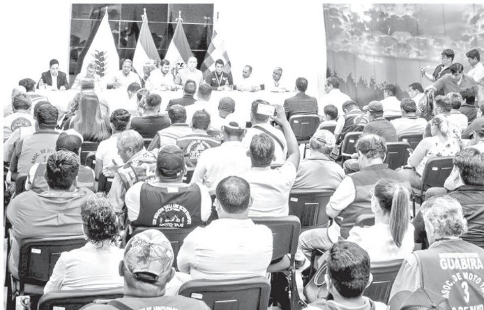
La reunión de autoridades de Gobierno, choferes y mototaxistas.

los combustibles en toda la cadena logística de suministros a su cargo, conforme a la normativa técnica y regulatoria vigente”. YPFB se compromete a emitir informes de manera periódica respecto a la calidad de los combustibles, con la finalidad de brindar mayor transparencia y confianza. Las partes acuerdan la creación de una comisión conjunta que inspeccionará instalaciones de YPFB para verificar los procesos relacionados con la calidad.