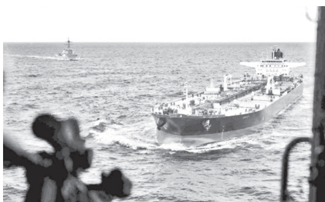
El Aquila II poco antes de la intervención de EEUU.

Un comunicado publicado en redes sociales no especifica si el buque tenía vínculos con Venezuela, cuyo régimen enfrenta sanciones estadounidenses por su petróleo y depende de una flota fantasma de buques con bandera falsa para