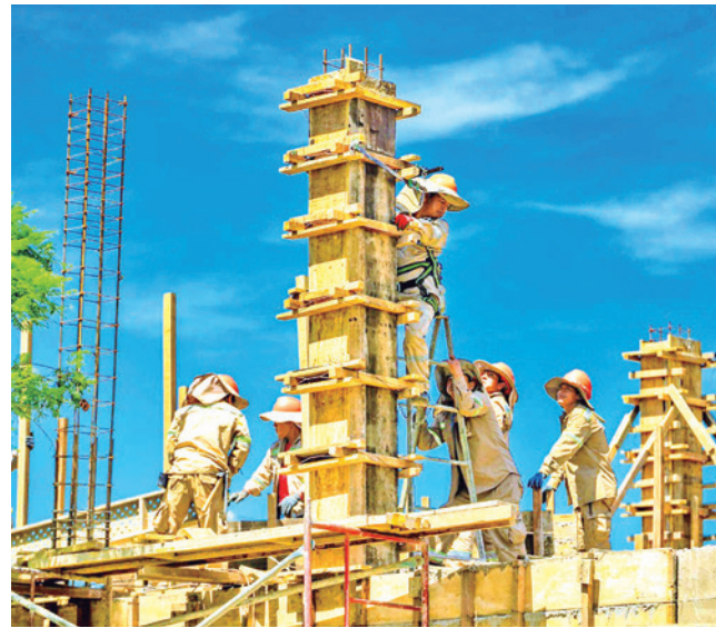
La obra recreativa tiene un 30% de avance.

Dato. El proyecto recreativo se construye sobre un sector de la laguna de Coña Coña, al oeste de la ciudad de Cochabamba. Actualmente, trabajan en la obra unas 200 personas