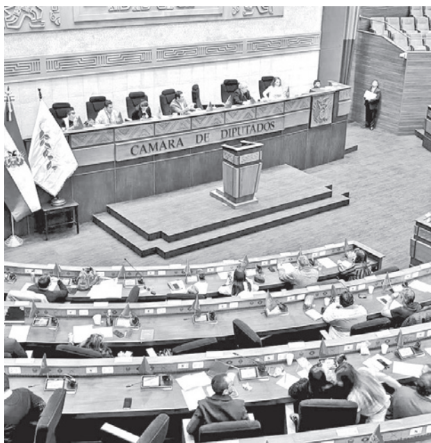
Sesión de la Cámara de Diputados.

“Es un abuso completo, un acto irrazonable, arbitrario y desproporcionado del Estado”, cuestionó el abogado constitucionalista, al recordar que el arraigo es una medida cautelar y solo puede ser emitida por un juez.