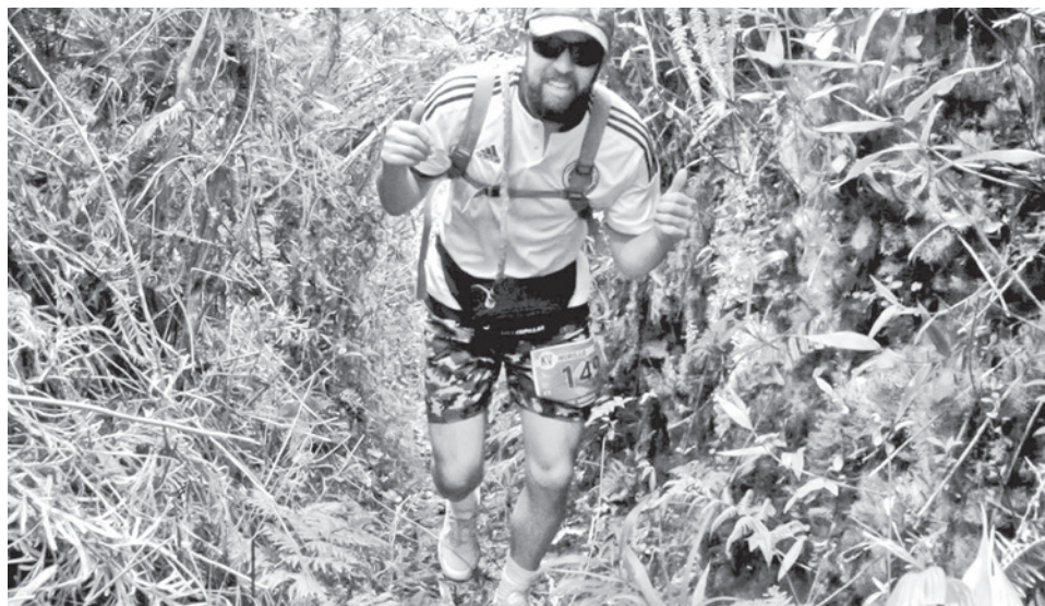
Uno de los atletas en pleno recorrido, el fin de semana.