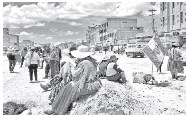
Bloqueo de carreteras en la vía La Paz-Oruro.

El viceministro añadió que Bolivia también comparte información con la cooperación internacional sobre los operativos antidroga ejecutados por la Felcn.