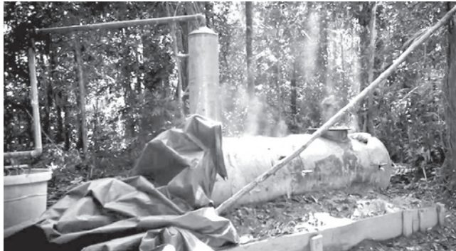
Las fábricas de droga destruidas en el trópico. VDSSC

Operativo Tormenta II. La Policía también incautó sustancias controladas y grandes volúmenes de precursores químicos