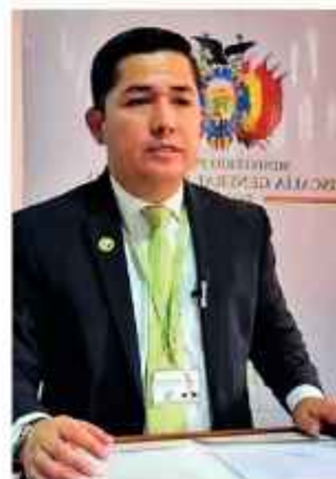
AUTORIDAD. El fiscal Alexander Mendoza.

Sucedió el domingo 8. Pese a la magnitud del ataque y la cantidad de disparos, no se reportaron personas heridas ni fallecidas, aunque los daños materiales son de consideración. La Fiscalía presume que el objetivo era un hombre que vivía junto a su madre en dicho inmueble. El hecho no dejó heridos.