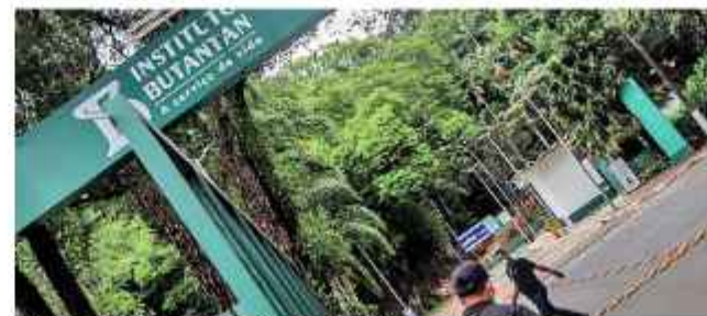
LABORATORIO. El Instituto Butantan, de Brasil

Durante la ceremonia fueron firmados órdenes de servicio para la construcción de dos nuevas fábricas y la