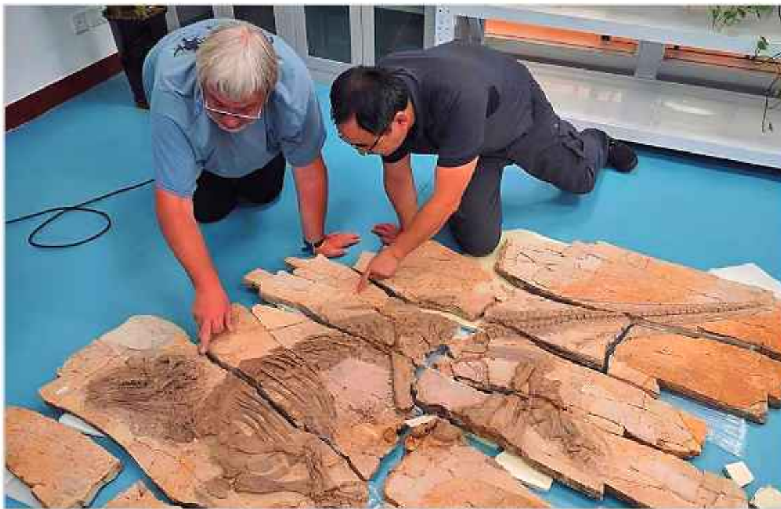
ESTUDIO. Dos científicos analizan los restos fosilizados de un joven iguanodonte.

dores que impulsó el estudio de los dinosaurios en Asia y que contribuyó a posicionar a China como una de las regiones clave para la investigación paleontológica mundial.