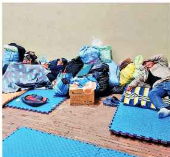
ALBERGUE. Indígenas del Tipnis descansan en el coliseo de la UMSA, en La Paz.

Al cumplirse 16 días de su llegada a la ciudad de La Paz, pobladores del Territorio Indígena y Parque Nacional Isiboro Séure (Tipnis) denunciaron la desatención del Gobierno frente a las inundaciones que afectan a decenas de comunidades de esa región y exigieron ser recibidos por el presidente Rodrigo Paz para exponerle la magnitud de la emergencia.