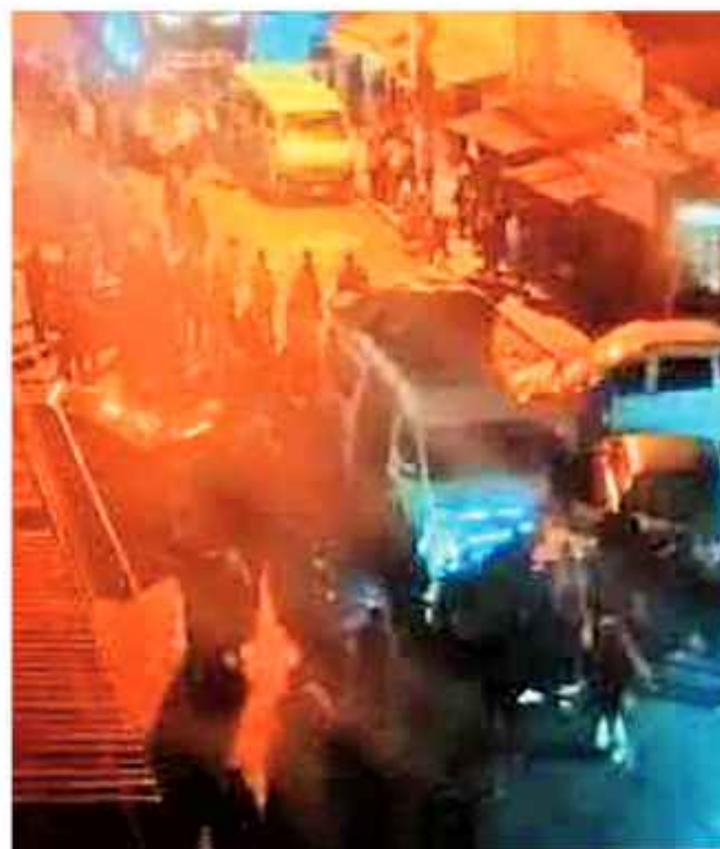
TRAGEDIA. Imágenes del hecho vial registrado el domingo 8.

El siniestro ocurrió aproximadamente a las 21:00, cerca del mercado de la Asociación Departamental de Productores de Hoja Coca de La Paz (Adepcoca). Un minibús de transporte público proveniente de los Yungas aparentemente sufrió una falla en el sistema de frenos. El vehículo descendió a gran velocidad por la calle Arapata e impactó contra trabajadores que realizaban la descarga de bultos de coca, peatones y otros tres vehículos estacionados en ese sector urbano paceño.