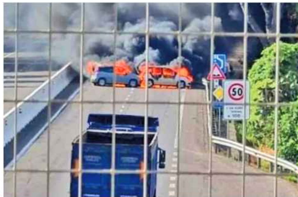
ASALTO. La violenta actuación de los delincuentes durante el asalto al camión blindado.

El operativo se destacó por el nivel de sofisticación. Los atacantes emplearon vehículos camuflados como patrulleros para simular un control policial y obligaron a detenerse tanto al blindado como a su custodia. De acuerdo con la reconstrucción del periodista Andrei Serbin Pont, “al menos cinco o seis integrantes, algunos disfrazados de policías, bloquearon completamente la vía”. Detalló Serbin Pont que, como parte del