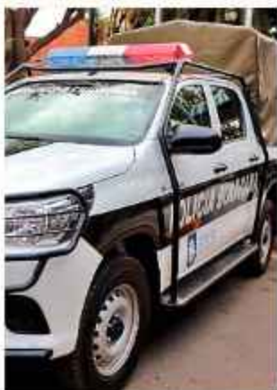
CAÍDA. El hecho es investigado por la Policía.

Dentro de las diligencias investigativas, personal de la Policía procedió a la toma de testimonios de los empleados que cumplían funciones en el establecimiento de diversión ese momento, así como a sus amigos.