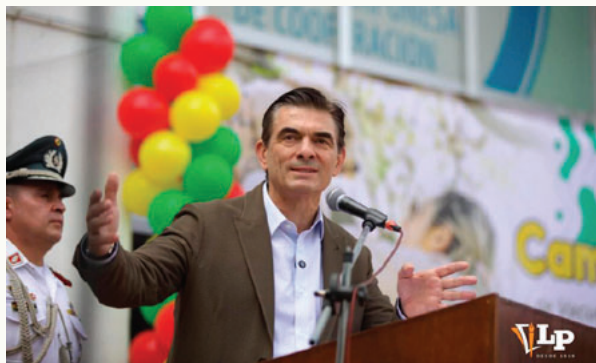
El Presidente de Bolivia, Rodrigo Paz