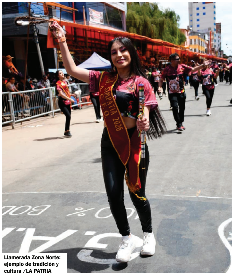
Llamerada Zona Norte: ejemplo de tradición y cultura