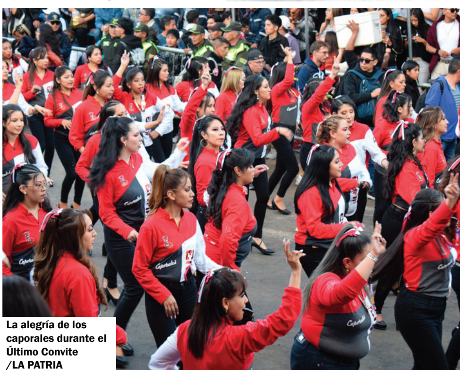
La alegría de los caporales durante el Último Convite