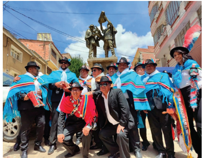
El monumento se encuentra en la calle Cochabamba y Linares

El monumento, denominado también Monumento al Verdadero Convite, representa el ritual de confraternización que realizan cada convite y Sábado de Peregrinación la Gran Tradicional Auténtica Diablada Oruro y la Morenada Zona Nor-