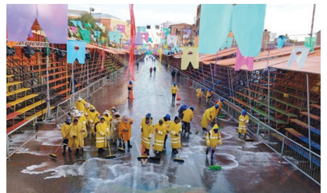
Equipos especializados garantizarán la limpieza de la ruta del Carnaval