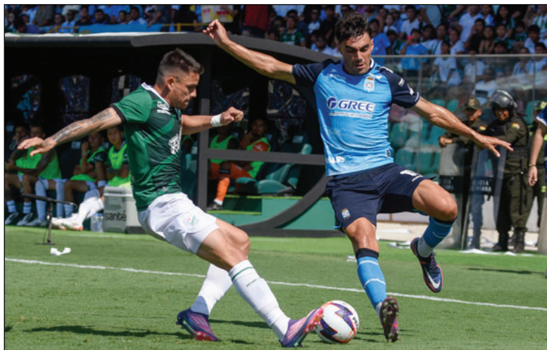
El clásico cruceño se disputó con bastante intensidad

Independiente que recién jugó el miércoles 4 de febrero el partido de