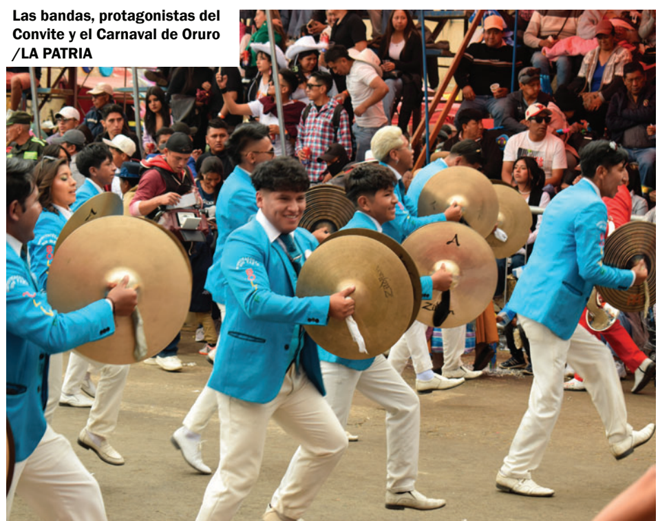
Las bandas, protagonistas del Convite y el Carnaval de Oruro