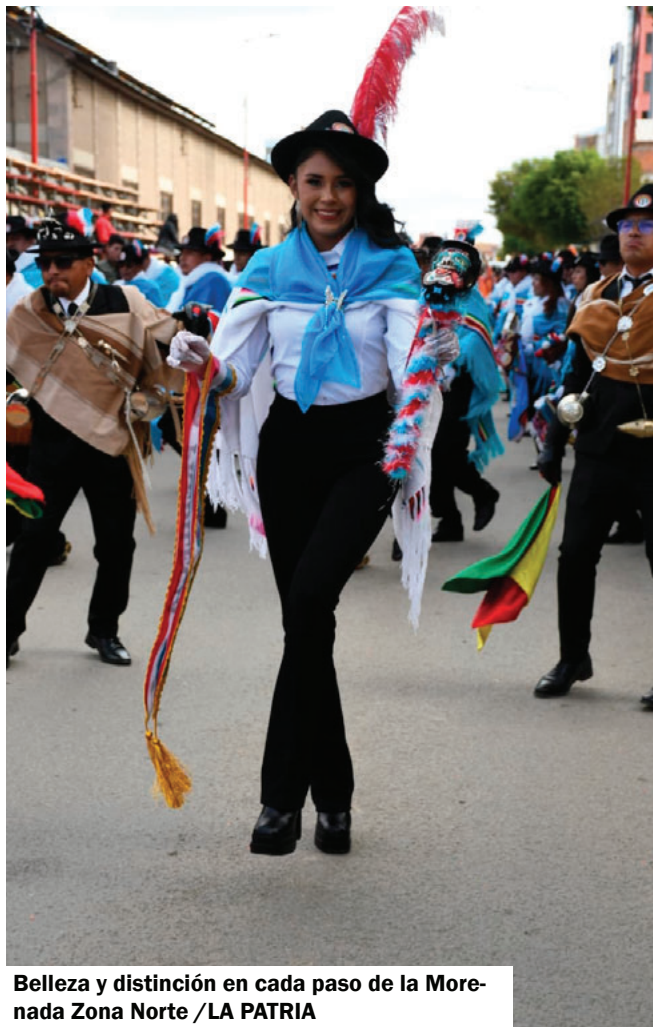
Belleza y distinción en cada paso de la Morenada Zona Norte