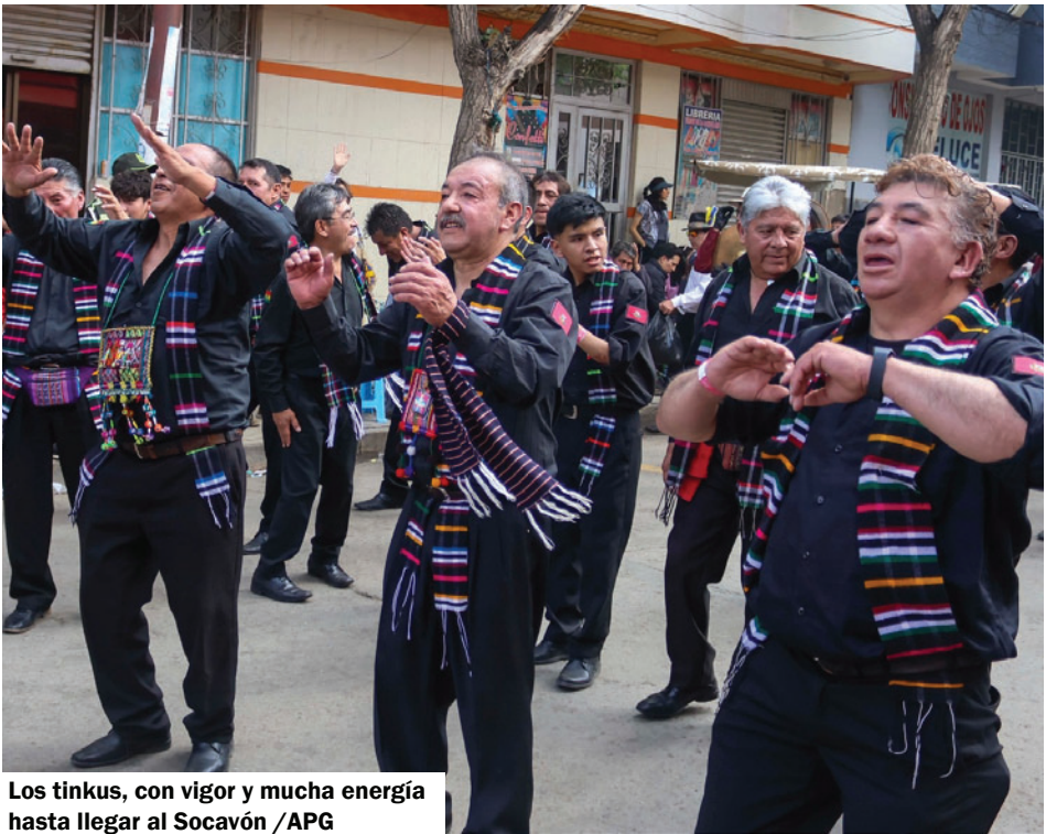
Los tinkus, con vigor y mucha energía hasta llegar al Socavón