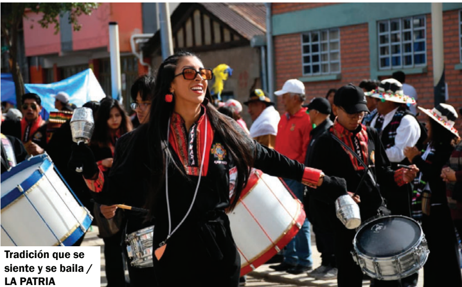
Tradición que se siente y se baila