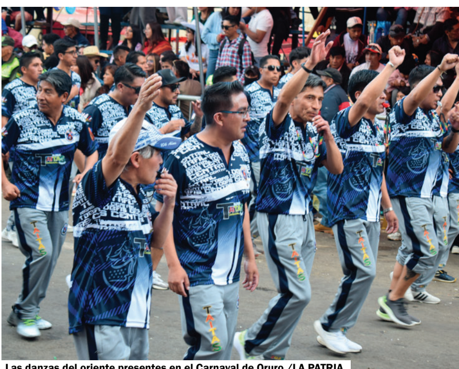
Las danzas del oriente presentes en el Carnaval de Oruro