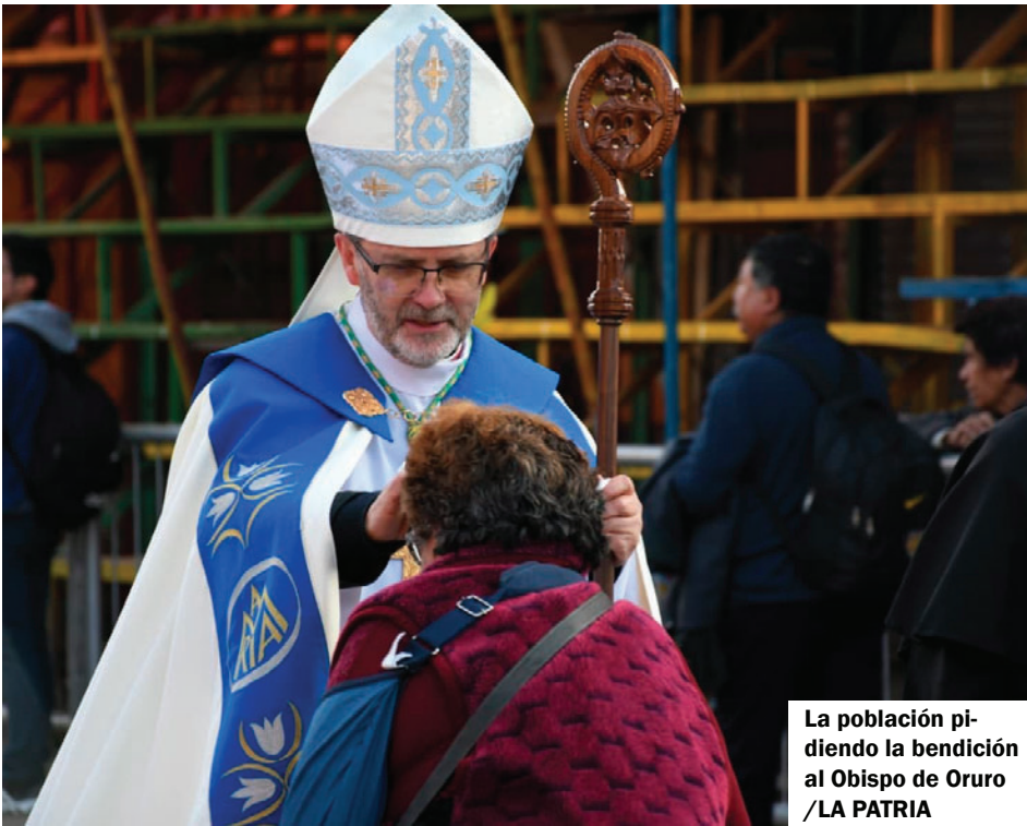
La población pidiendo la bendición al Obispo de Oruro