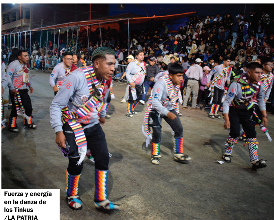
Fuerza y energía en la danza de los Tinkus