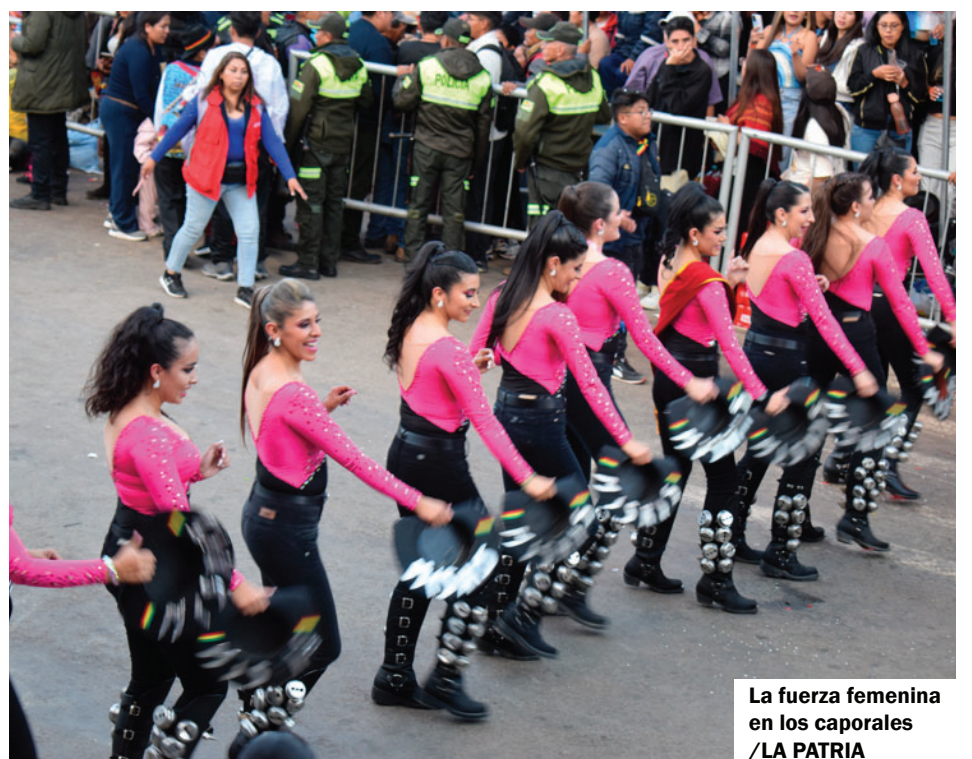
La fuerza femenina en los caporales