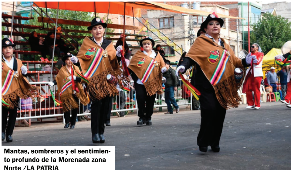
Mantas, sombreros y el sentimiento profundo de la Morenada zona Norte