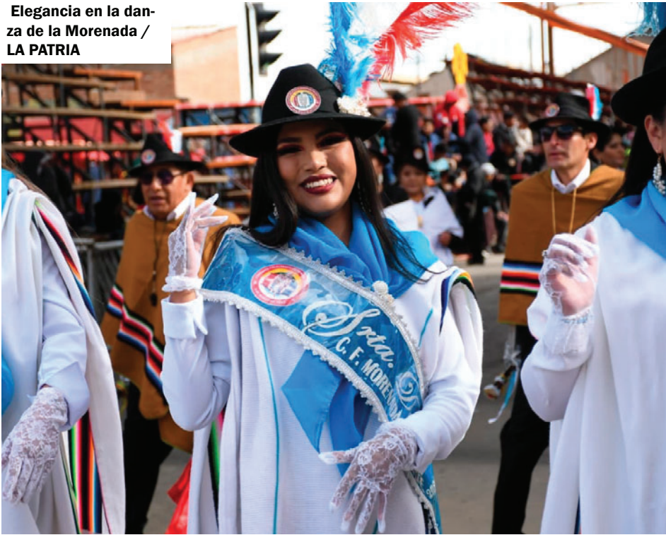
Elegancia en la danza de la Morenada / LA PATRIA