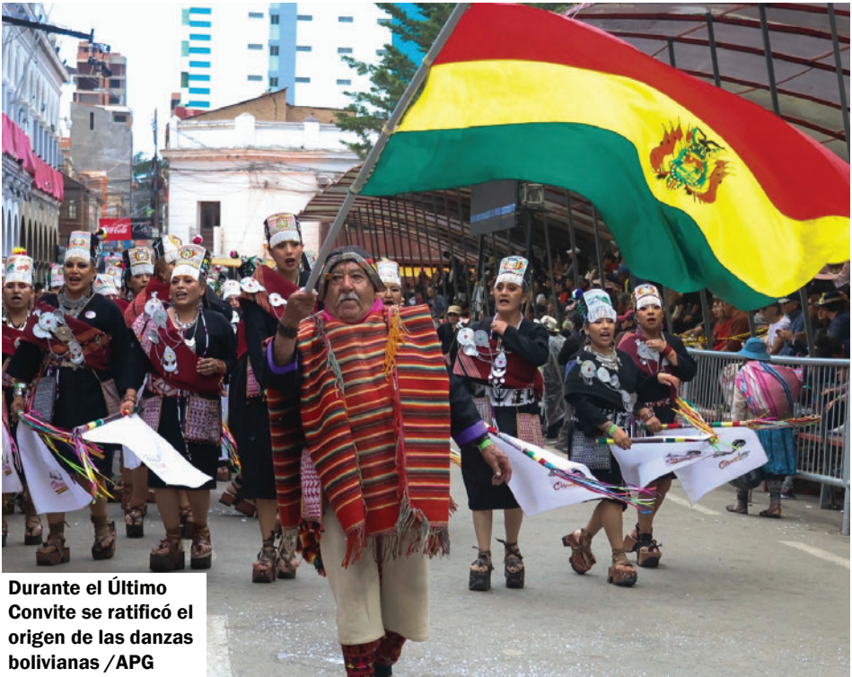
Durante el Último Convite se ratificó el origen de las danzas bolivianas