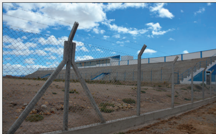
Después de una larga espera el estadio de la AFO contará con pasto sintético

Se menciona que a la par del estadio principal de la AFO, también se piensa implementar dos canchas de césped natural en el amplio espacio que tiene la asociación en la parte Norte de la ciudad y de esa forma seguir masificando esta disciplina deportiva con las comodidades necesarias.