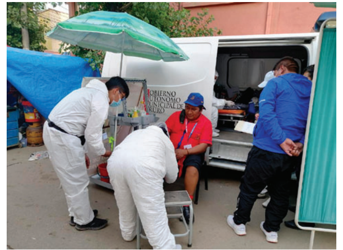
Puntos de salud garantizarán atención durante el Carnaval

das también se instalarán tres puntos de atención en la Avenida Cívica, bajo la misma estrategia de prevención, evacuación y respuesta inmediata. El mismo esquema se replicará durante el Anata Andina, considerando la concentración de público en estos eventos previos al Carnaval.