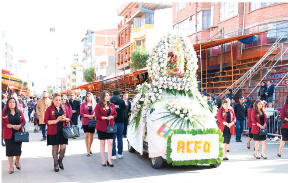
Desde el inicio, la devoción a la Virgen del Socavón fue la protagonista