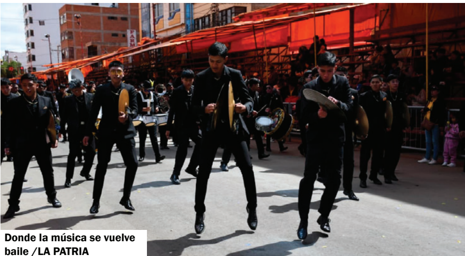
Donde la música se vuelve baile /LA PATRIA