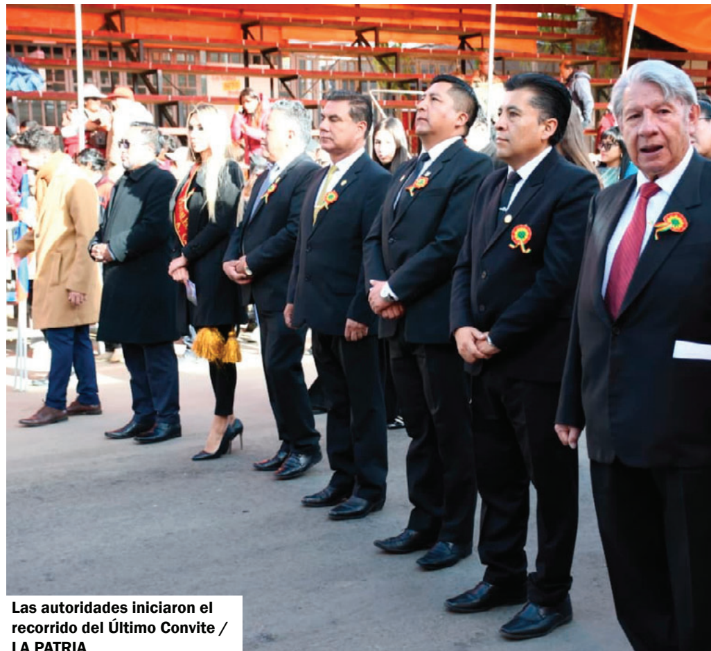
Las autoridades iniciaron el recorrido del Último Convite