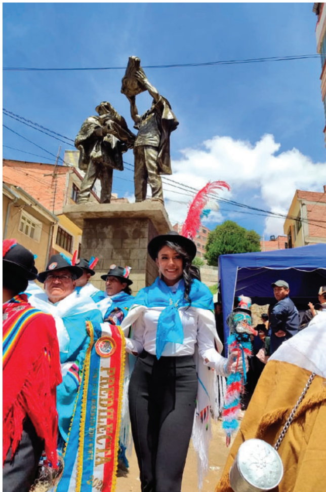
La predilecta de la Morenada Zona Norte junto al nuevo monumento

te, reafirmando una tradición viva del Carnaval de Oruro.