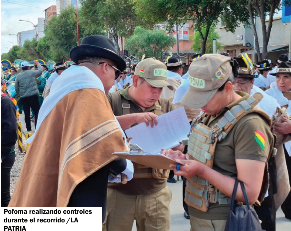
Pofoma realizando controles durante el recorrido