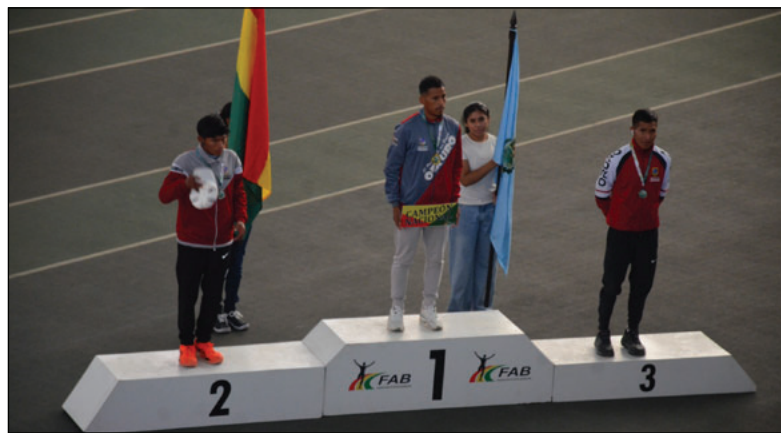
Podio orureño en el atletismo Indoor en Cochabamba

El Nacional Indoor incluyó pruebas de velocidad (60, 200 y 400 metros), medio fondo y fondo (800, 1500, 3.000 metros), además de salto largo, salto con garrocha,