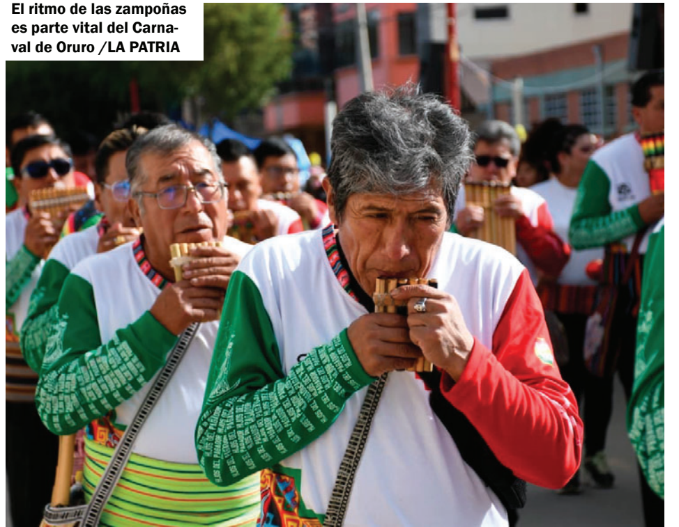
El ritmo de las zampoñas es parte vital del Carnaval de Oruro