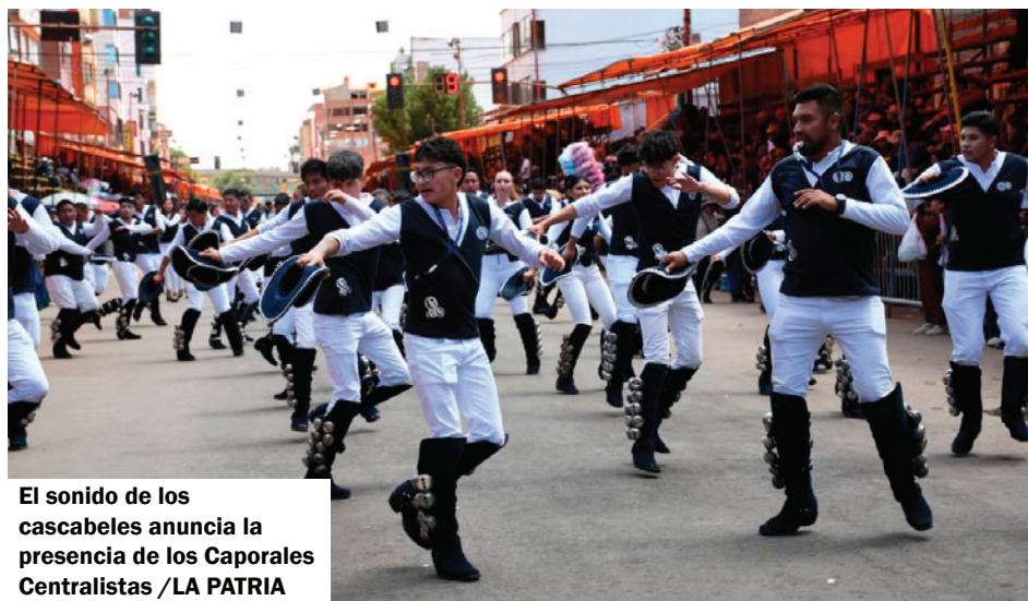
El sonido de los cascabeles anuncia la presencia de los Caporales Centralistas