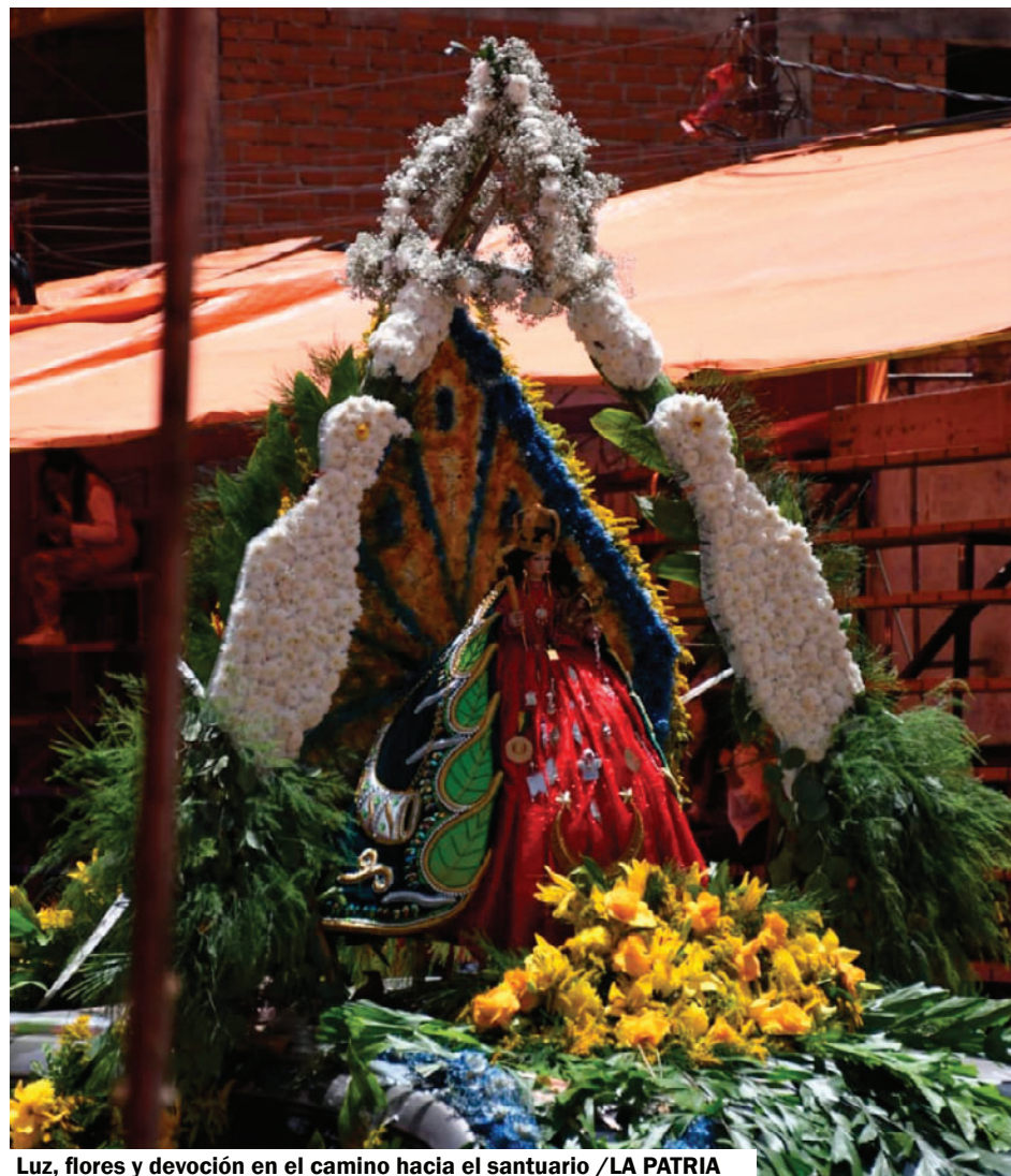
Luz, flores y devoción en el camino hacia el santuario /LA PATRIA