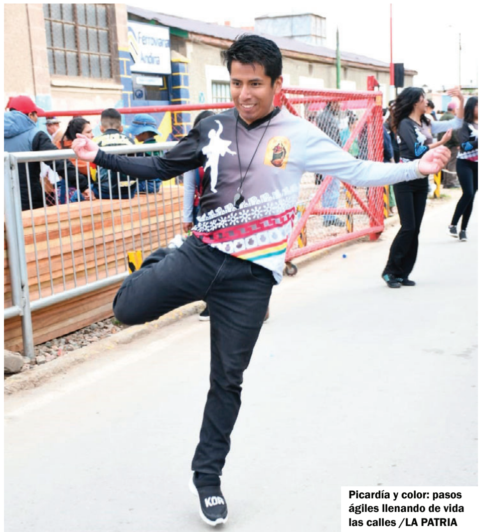
Picardía y color: pasos ágiles llenando de vida las calles