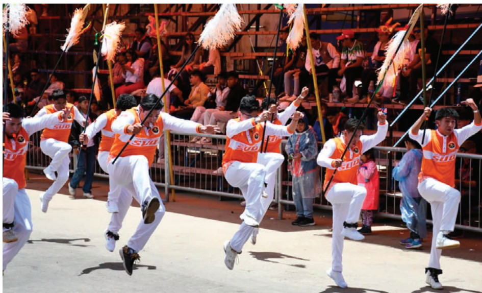
Ritmo ágil y espíritu libre: la esencia de los Tobas en su máxima expresión