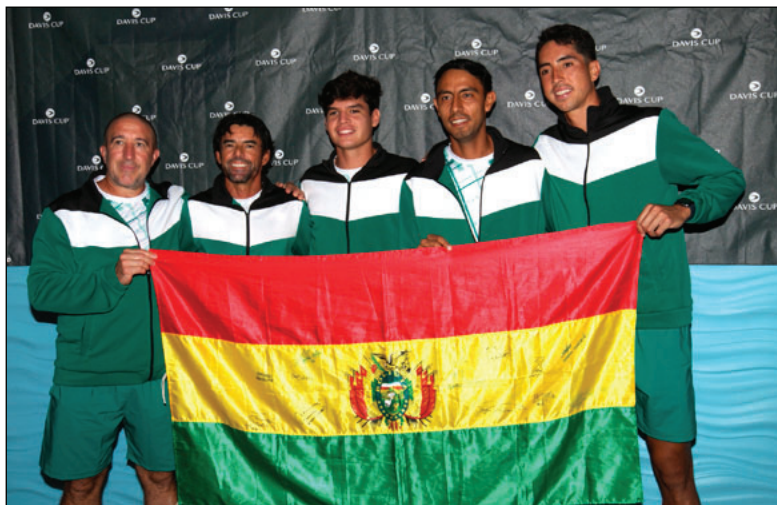
Integrantes del equipo boliviano de tenis que lograron el objetivo / FBT

El punto ganador generó una gran algarabía por parte de la comitiva nacional, que durante una semana se hizo presente en Barbados para preparar el duelo de la Copa Davis.