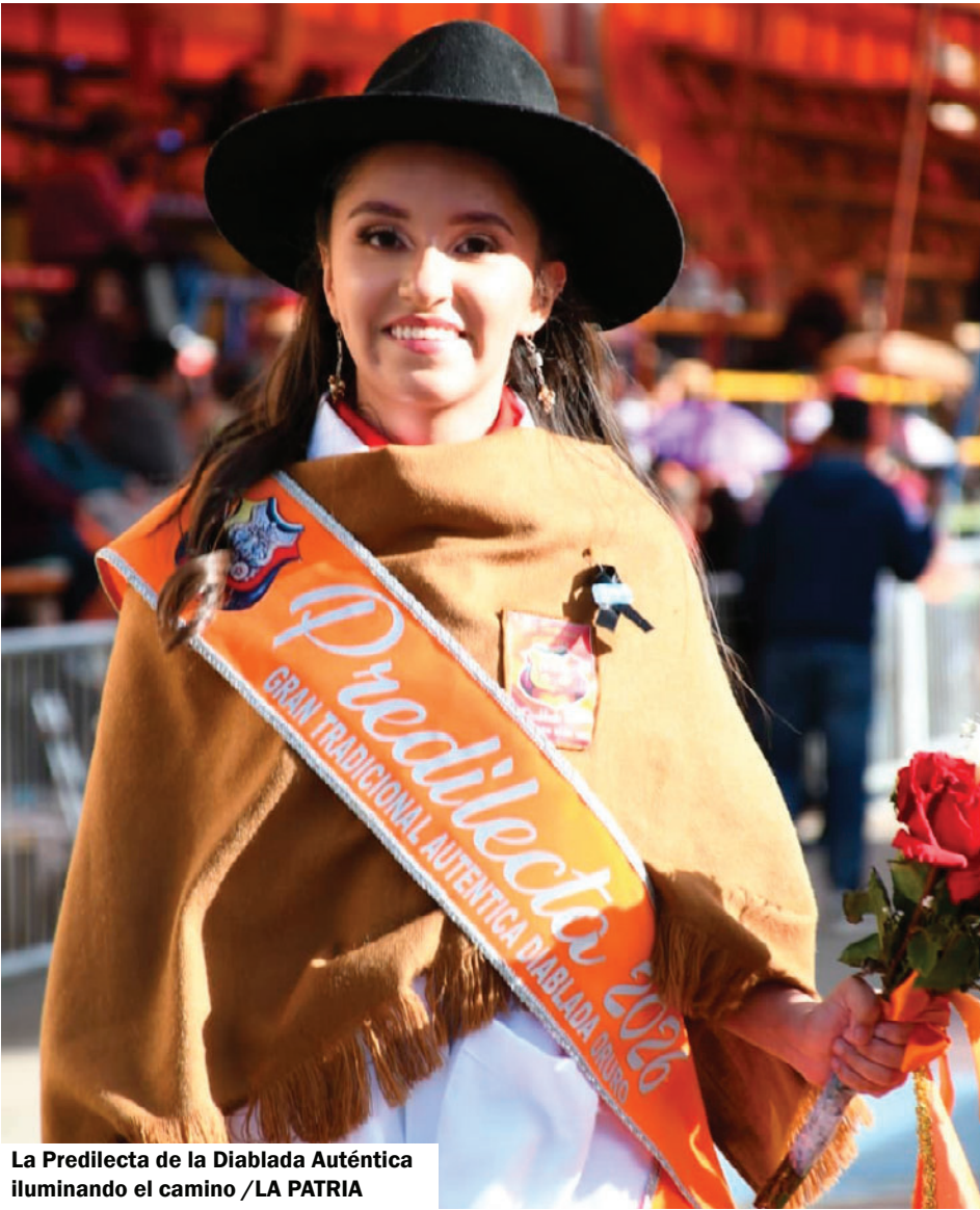
La Predilecta de la Diablada Auténtica iluminando el camino