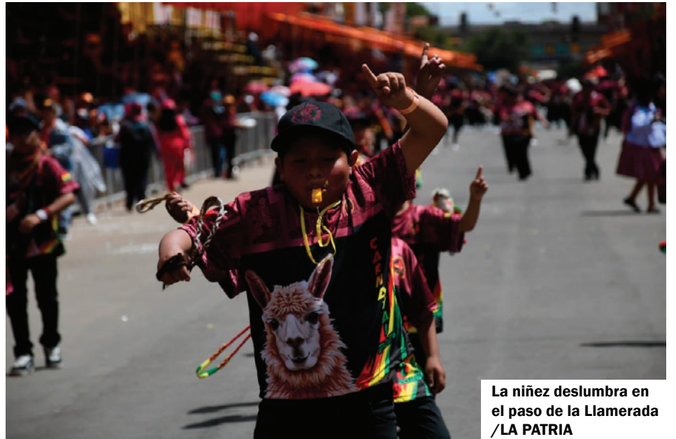
La niñez deslumbra en el paso de la Llamerada