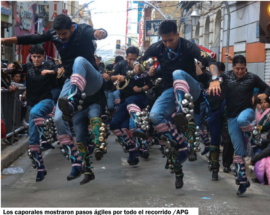
Los caporales mostraron pasos ágiles por todo el recorrido