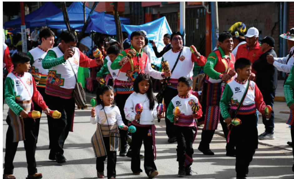
Los más pequeños de los Zampoñeros Hijos del Pagador siguiendo los pasos de sus mayores