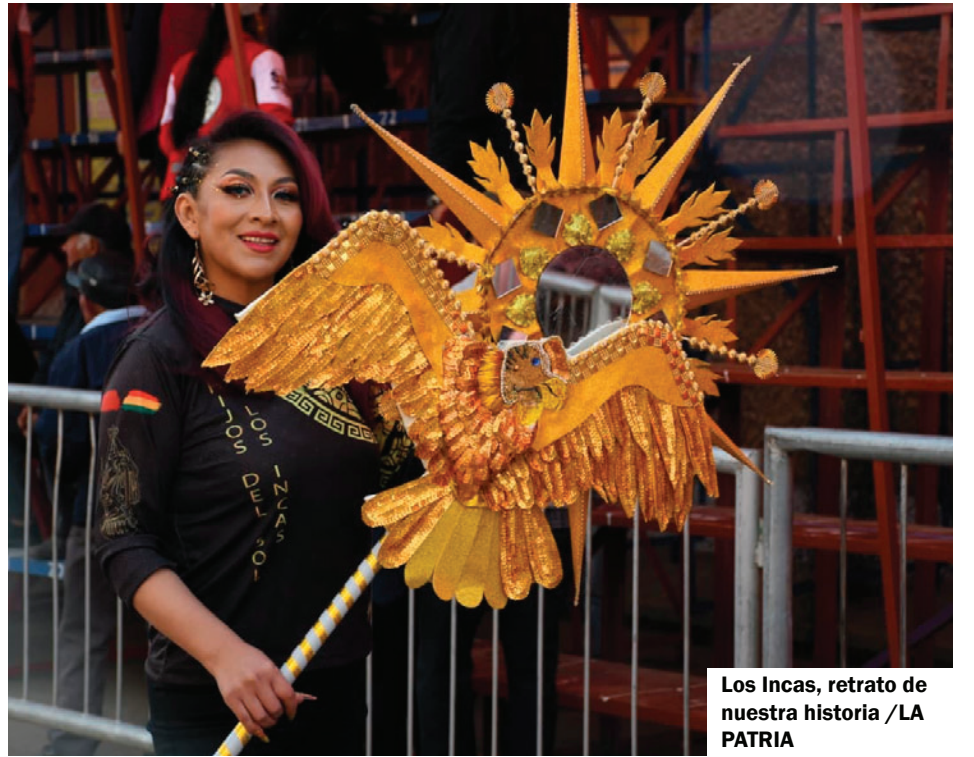
Los Incas, retrato de nuestra historia