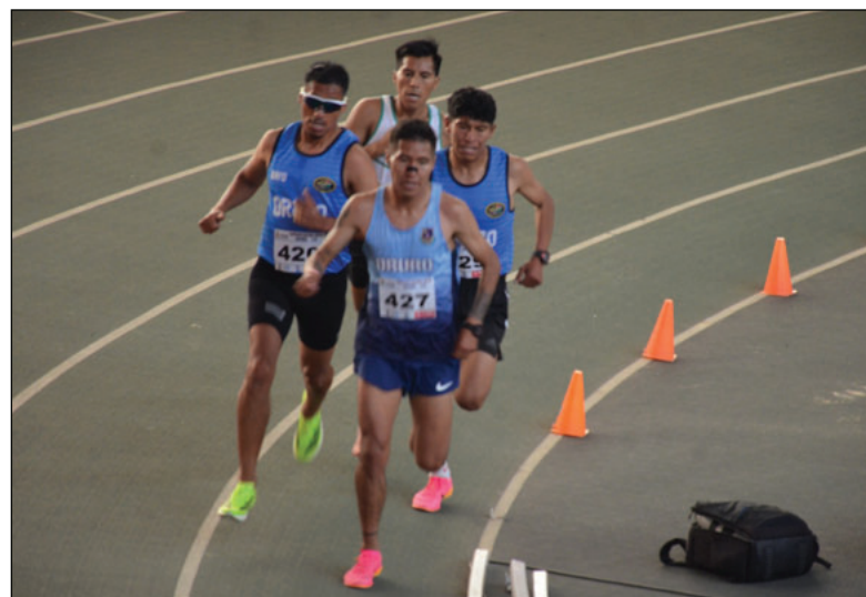
Oruro brilló con luces propias en la prueba de 3 mil metros

lanzamiento de bala y el heptatlón. Más allá de los resultados, el certamen marcó el inicio de la tempora-