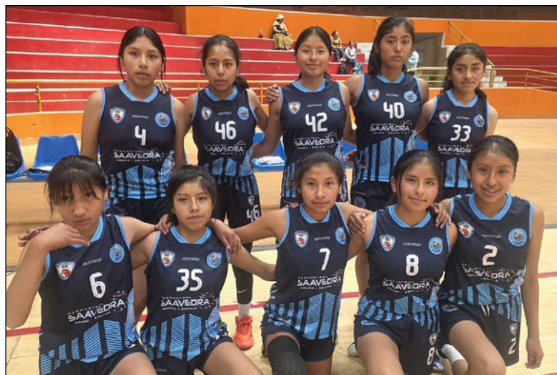
El equipo de Saavedra cumplió una gran campaña en Potosí

Con esta campaña perfecta, Saavedra no solo aseguró su presencia en la fase final, sino que se consolidó como uno de los equipos más sólidos de la Libomenor.