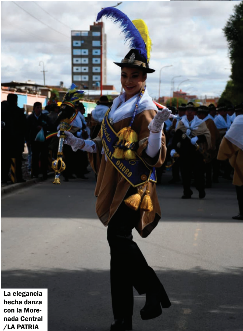
La elegancia hecha danza con la Morenada Central