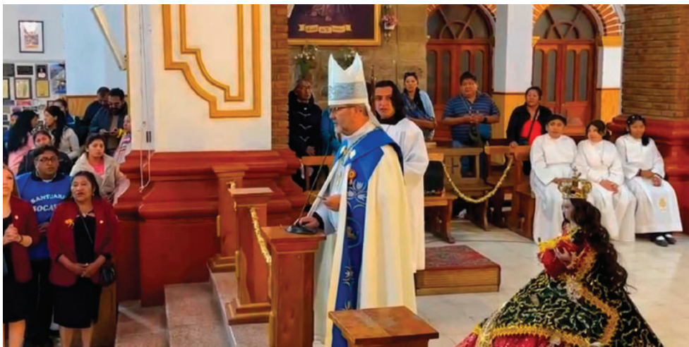
Monseñor Cristóbal Bialasik en la Basílica Menor Nuestra Señora del Socavón

En el santuario, la emoción fue evidente. Varios danzarines ingresaron de rodillas hasta el altar de la Virgen del Socavón, mientras otros lo hicieron entre lágrimas, reflejando el sacrificio, la fe y la devoción que caracterizan al Carnaval de Oruro, Obra Maestra del Patrimonio Oral e Intangible de la Humanidad.