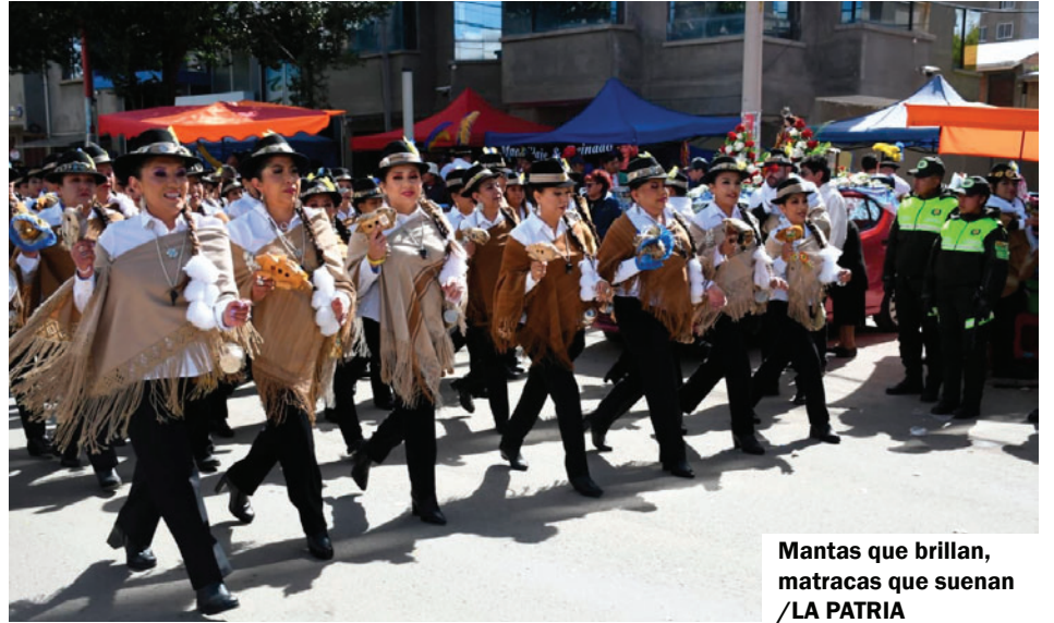
Mantas que brillan, matracas que suenan /LA PATRIA