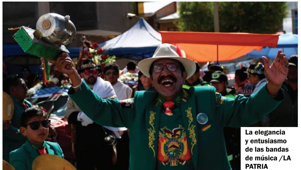
La elegancia y entusiasmo de las bandas de música