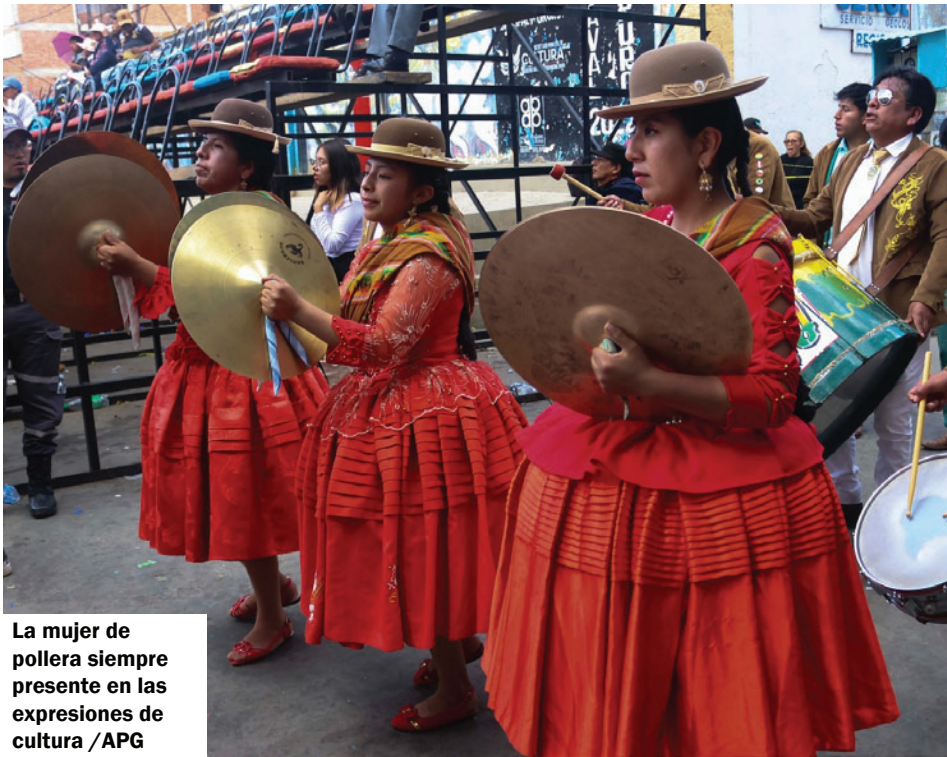
La mujer de pollera siempre presente en las expresiones de cultura