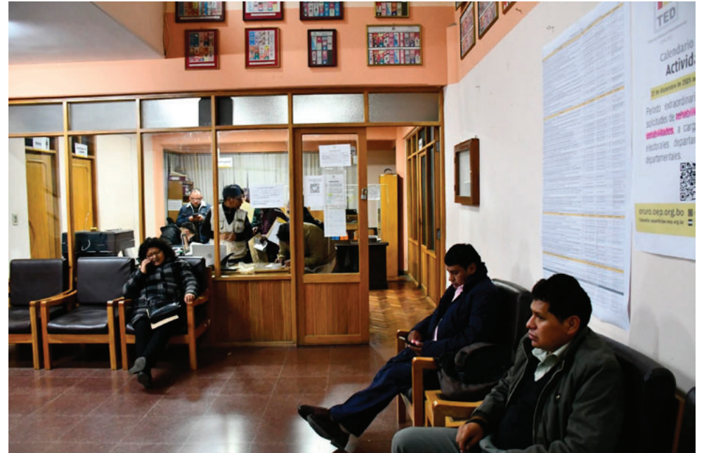
Las actividades del calendario electoral se desarrollaron también el fin de semana

El calendario electoral mantiene hitos relevantes incluso durante los días de Carnaval. Este lunes 10 de febrero está prevista la publicación de la lista de medios de comunicación habilitados para la difusión de propaganda electoral.