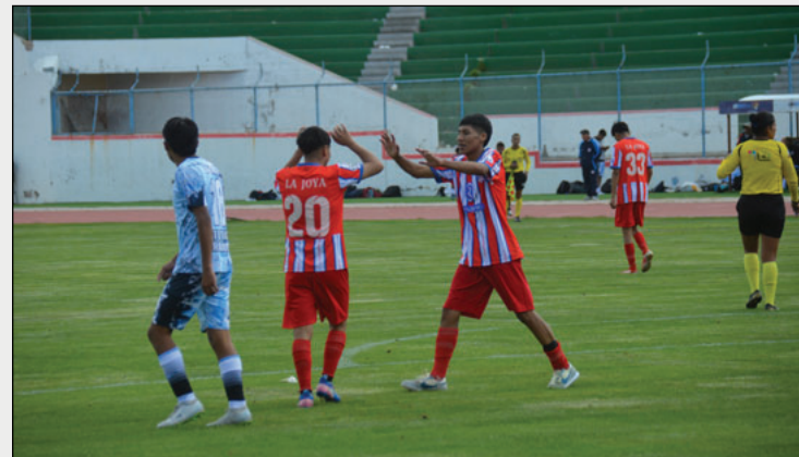
Buen triunfo de los albirrojos que permanecerán en la Primera "B"

Con este resultado, Atlético La Joya ratifica su permanencia en la Primera "B", demostrando contundencia ofensiva y solidez colectiva. Hermandad, pese a la entrega de sus jugadores, no logró sostener el ritmo y deberá replantear su futuro deportivo. El triunfo de Atlético La Joya, no solo asegura su lugar en la Primera "B", sino que también demuestra que es un equipo con ambición y capacidad para competir en el fútbol orureño.