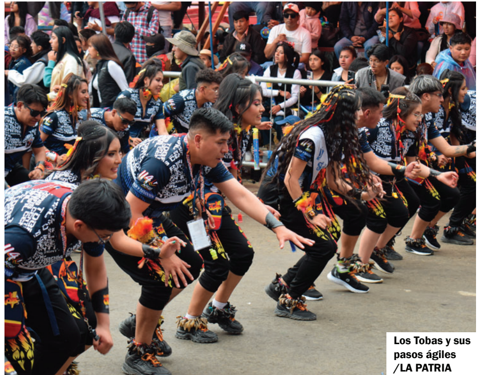
Los Tobas y sus pasos ágiles