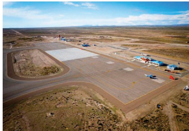
Aeropuerto Joya Andina de Uyuni

Sin embargo, el dato más relevante es el arribo de vuelos procedentes de