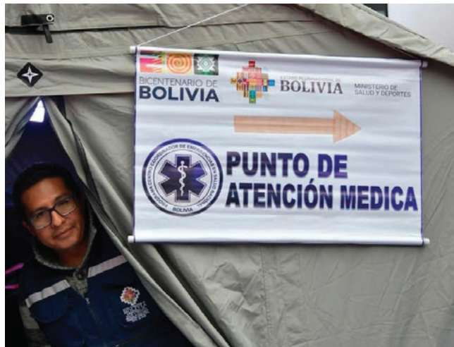
Personal de salud estará atento ante cualquier emergencia

El operativo de salud busca garantizar una respuesta oportuna durante todas las actividades del Carnaval de Oruro, en una de las festividades que concentra a miles de participantes y espectadores cada año.