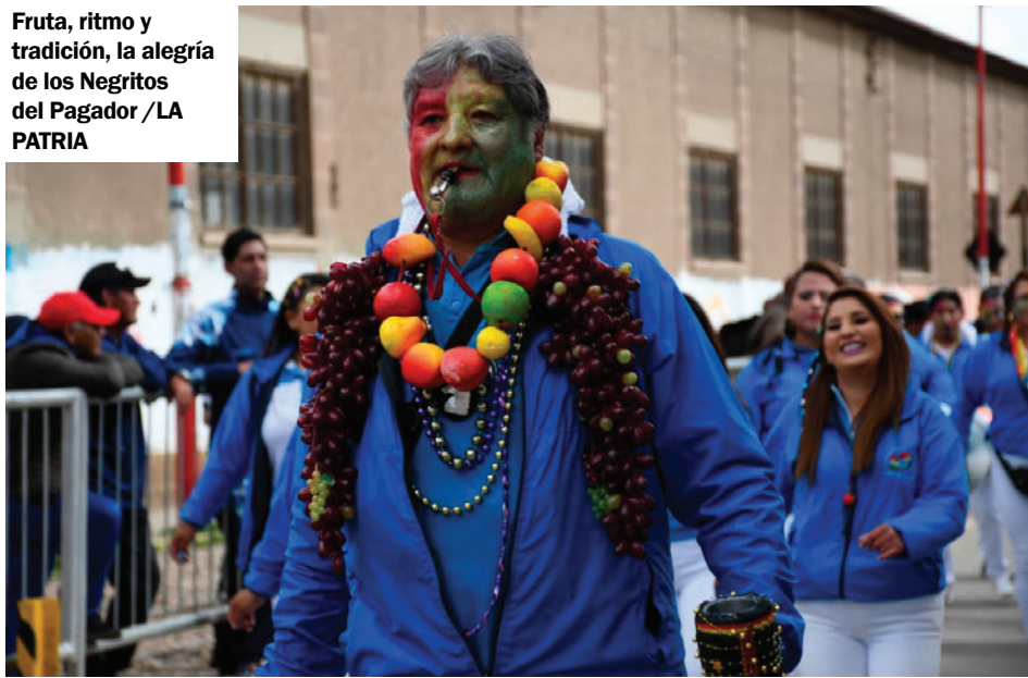
Fruta, ritmo y tradición, la alegría de los Negritos del Pagador