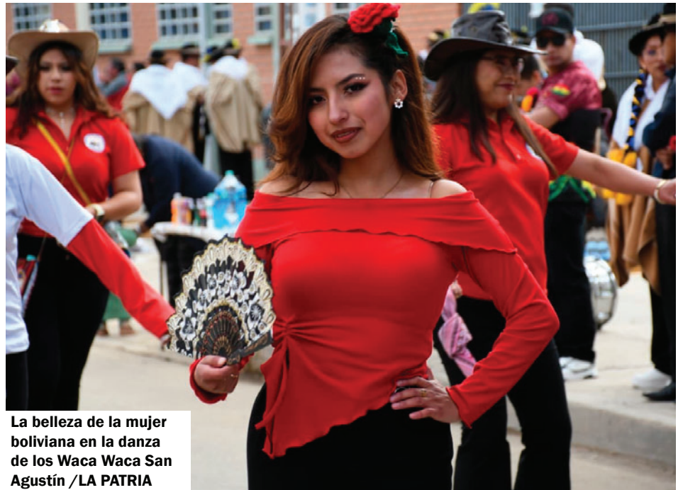
La belleza de la mujer boliviana en la danza de los Waca Waca San Agustín / LA PATRIA