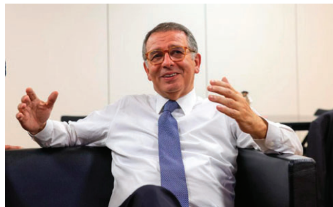
Antonio José Seguro ganó las elecciones en Portugal

Debido al mal tiempo en algunas zonas afectadas por inundaciones, que suman un total de 36.852 electores, se retrasaron las elecciones por una semana hasta el 15 de febrero.