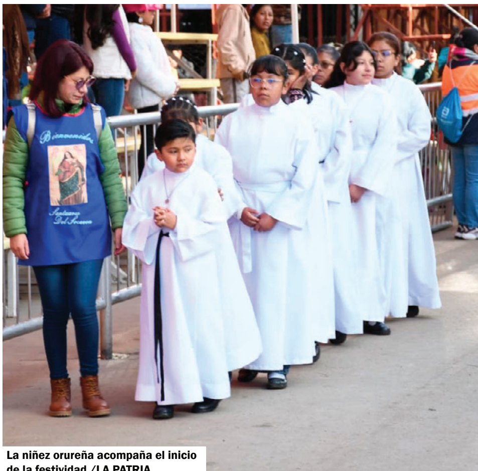
La niñez orureña acompaña el inicio de la festividad