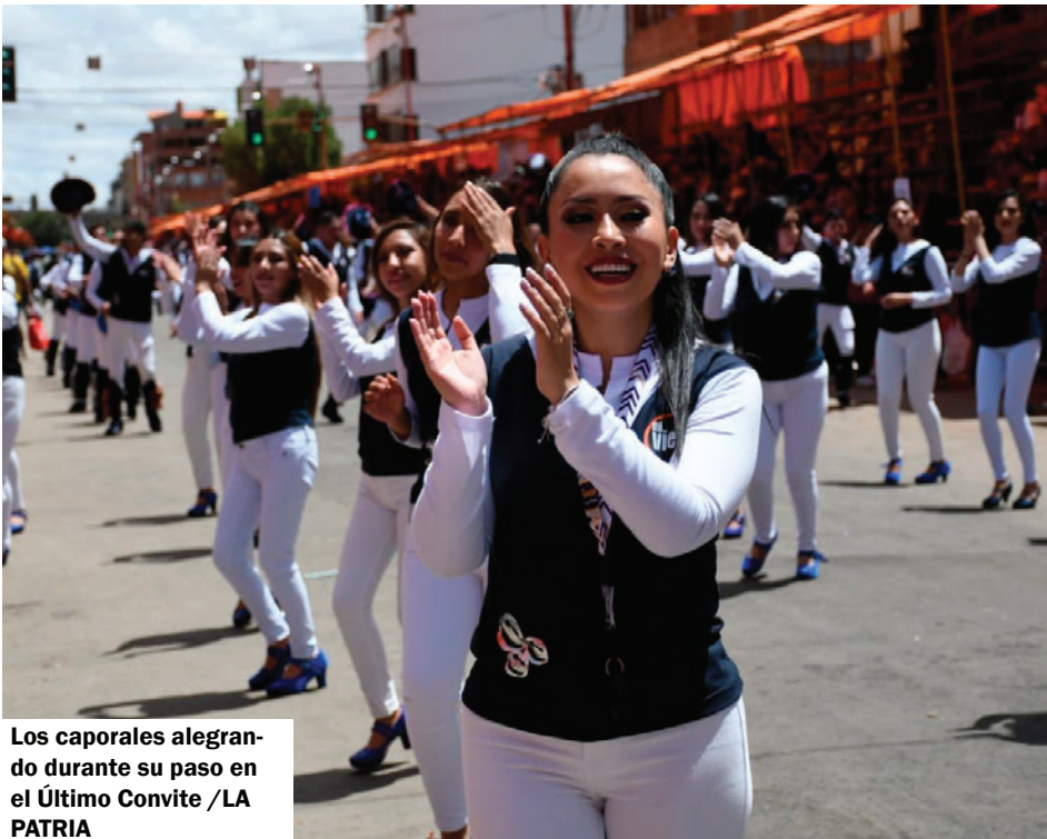
Los caporales alegrando durante su paso en el Último Convite