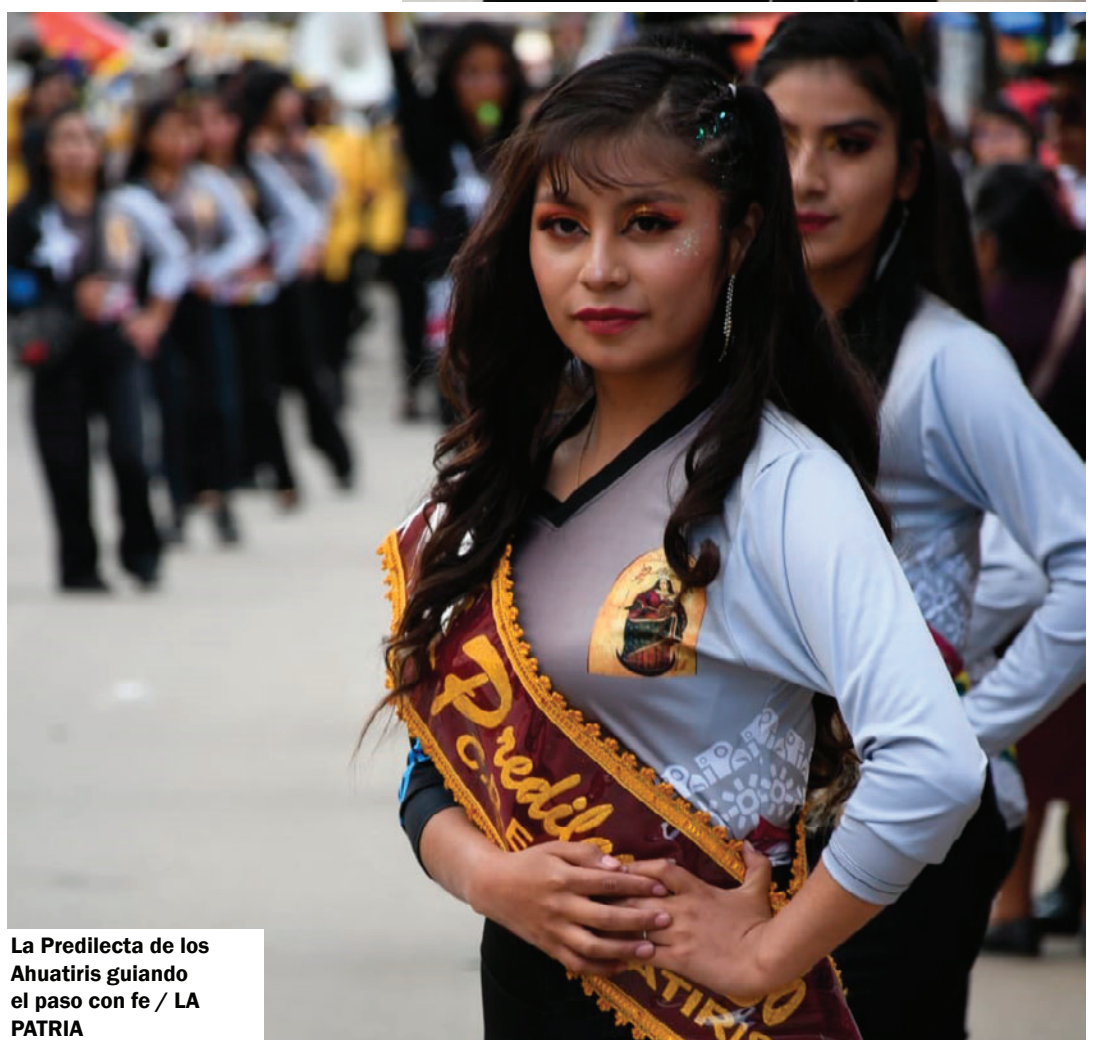
La Predilecta de los Ahuatiris guiando el paso con fe