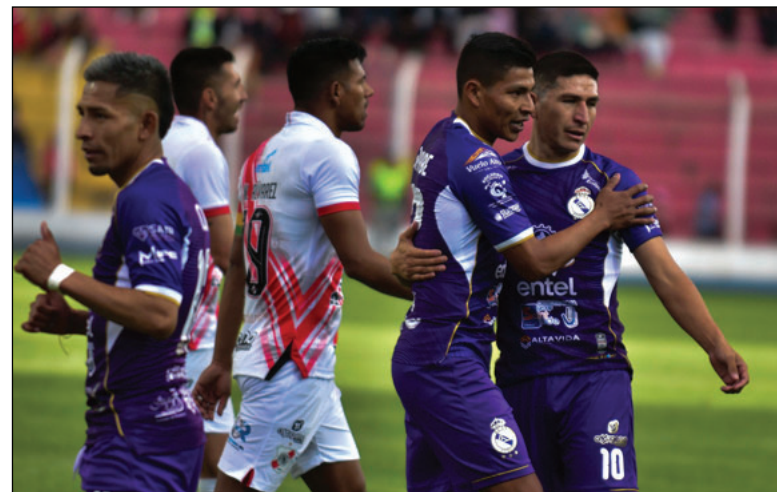
Jugadores de Real Potosí celebran la clasificación a cuartos de final

ida, el cual perdió por 2-1 ante Real Tomayapo en Tarija, el domingo 8, revirtió la cuenta ganando por 5-2 en el estadio Patria de Sucre. En cuartos de final rivalizará con Blooming.