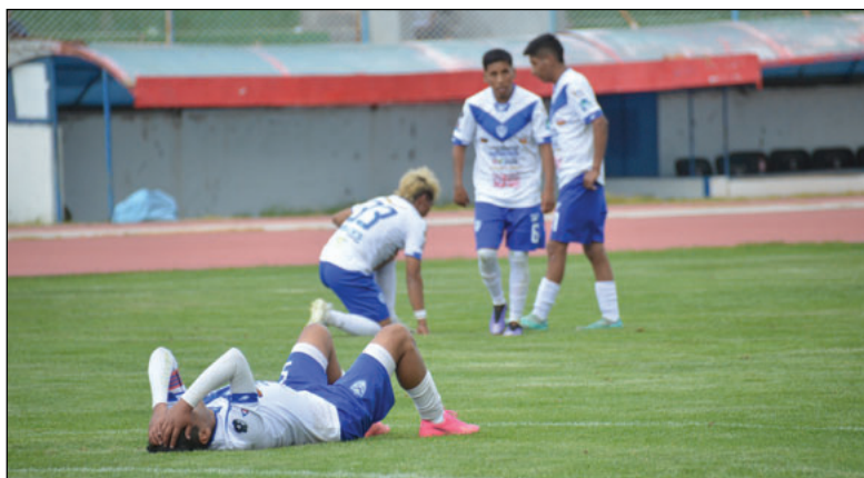
Jugadores de San José se lamentan por la derrota en la primera batalla