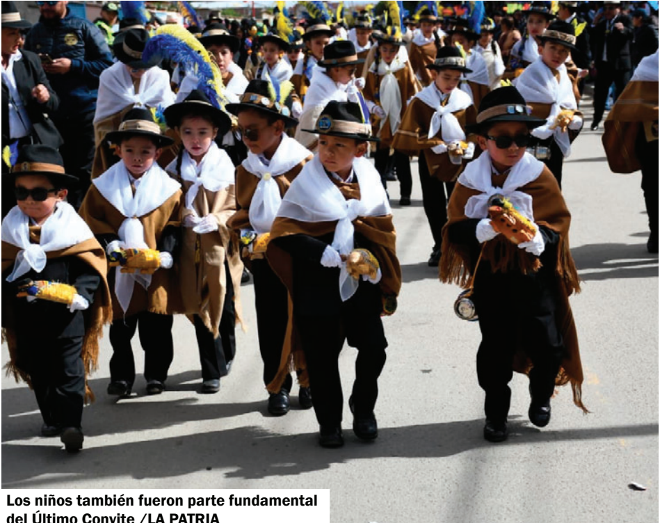
Los niños también fueron parte fundamental del Último Convite