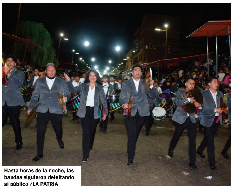
Hasta horas de la noche, las bandas siguieron deleitando al público