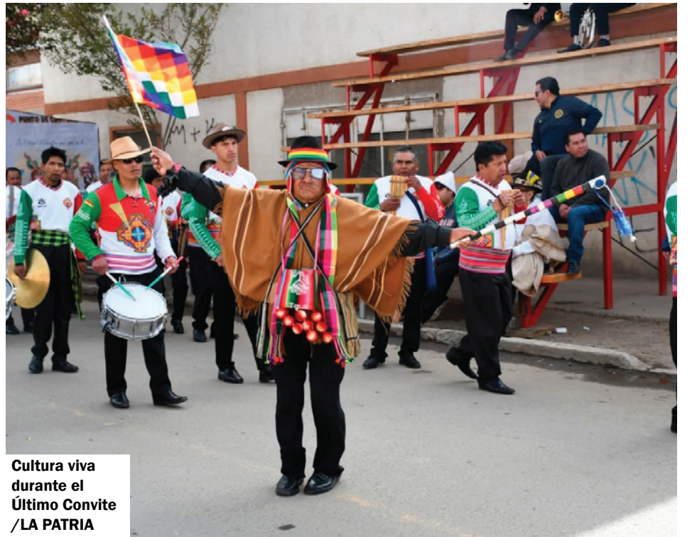
Cultura viva durante el Último Convite / LA PATRIA