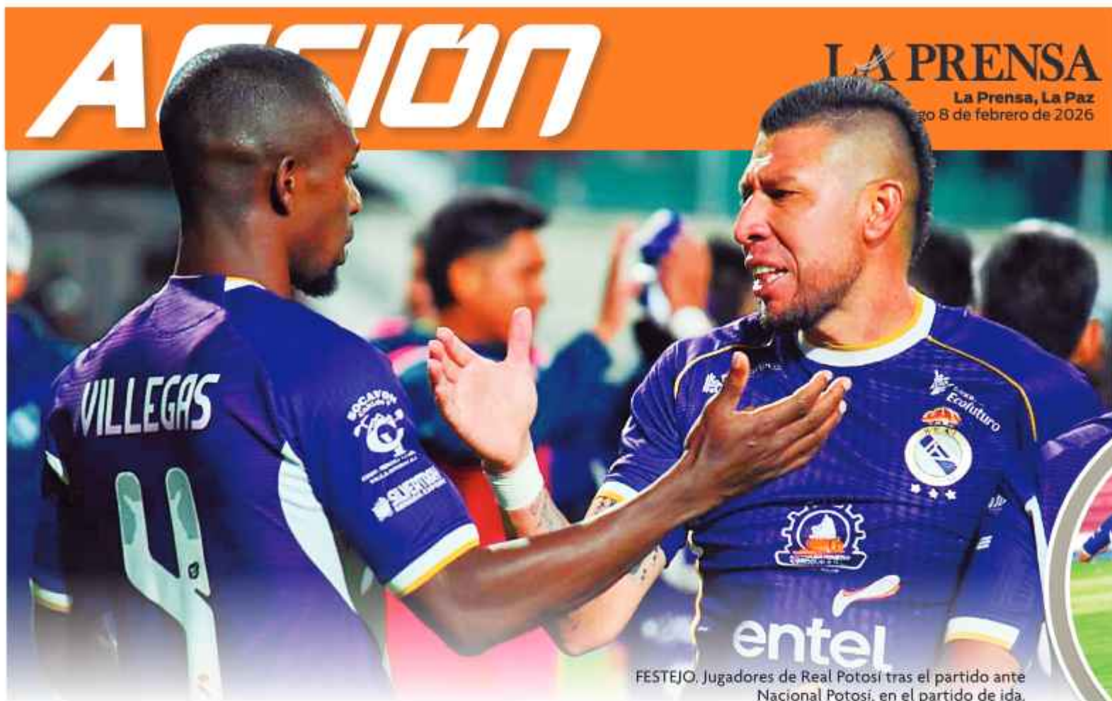
FESTEJO. Jugadores de Real Potosí tras el partido ante Nacional Potosí, en el partido de ida.