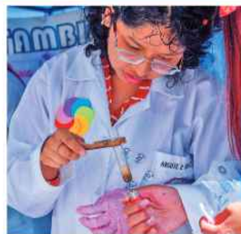
UMSA. Una estudiante realiza un experimento en la feria.

El club realiza visitas a colegios urbanos y rurales, además asiste a ferias y exposiciones.