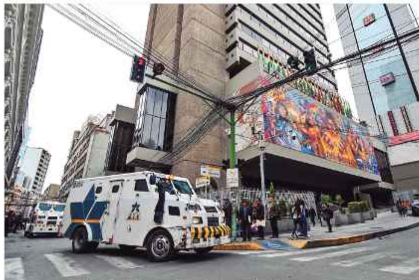
FRONTIS. Vehículos blindados salen de las bóvedas del Banco Central de Bolivia.

LA TASA DE INTERÉS ES DE 4,55% ANUAL, LA FECHA DEL DESEMBOLSÓ FUE 2 DE FEBRERO