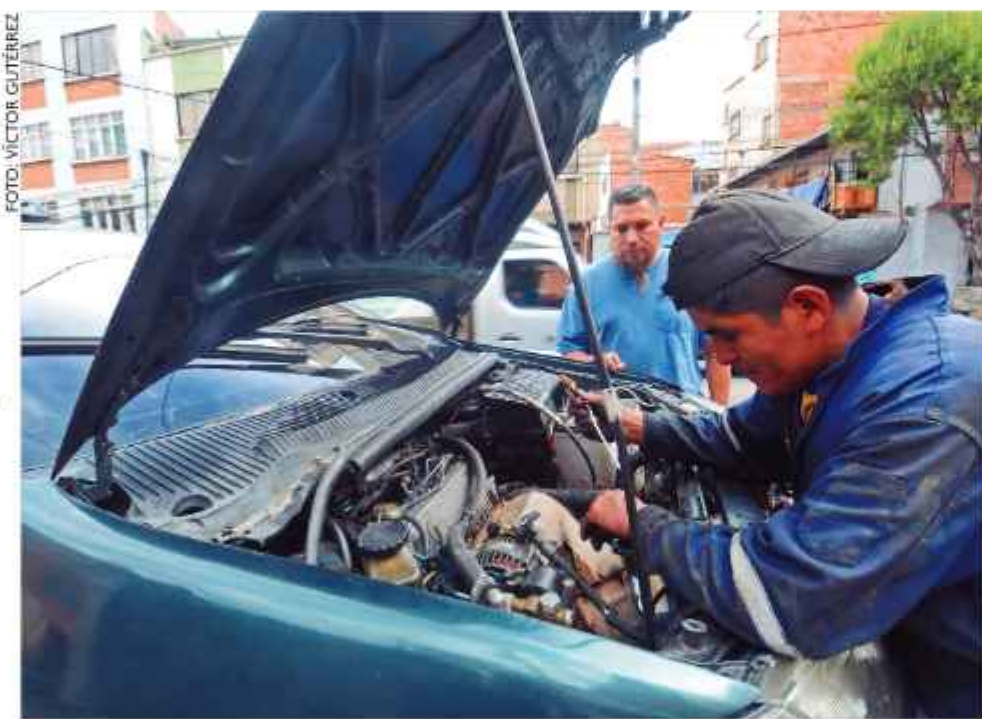
REVISIÓN. Un mecánico trabaja en el motor de un vehículo.

El ministro de Hidrocarburos, Mauricio Medinaceli, explicó que la estatal petrolera dispone de pólizas integrales en toda la cadena de hidrocarburos. Este mecanismo permitirá una atención individualizada bajo protocolos especializados. El sistema no contempla la entrega de dinero en efectivo; en su lugar, el seguro cubrirá