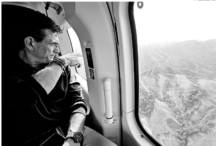
Rodrigo Paz tiene 57 meses por delante para seguir ejecutando las reformas propuestas en campaña

"Hemos generado un superávit de $us 2.300 millones al eliminar la subvención a los hidrocarburos y logramos que el riesgo país baje drásticamente de 2.000 a