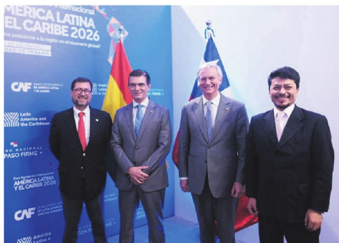
Rodrigo Paz junto a José Kast, presidente electo de Chile (centro).