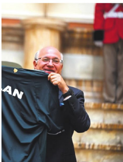
El presidente del BID Ilan Goldfajn.