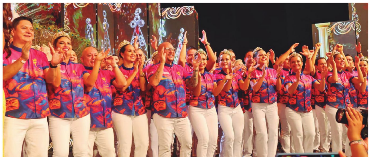
Misión cumplida para Los Testarudos. La coronación fue memorable