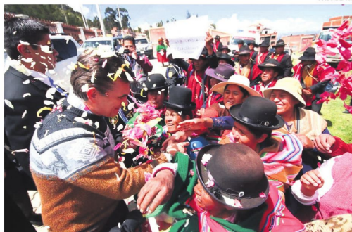
El presidente Rodrigo Paz saluda a campesinos de Copacabana

Entre el 28 y 29 de enero, Bolivia participó en Panamá del "Foro Económico Internacional América Latina y el Caribe 2026", organizado por CAF -Banco de Desarrollo de América Latina y el Caribe. Para este foro Bolivia estuvo representada por una delegación de 60 empresarios y funcionarios de alto nivel. En el evento, Paz sostuvo varios encuentros bilaterales, entre ellos con Panamá, Brasil y Chile.