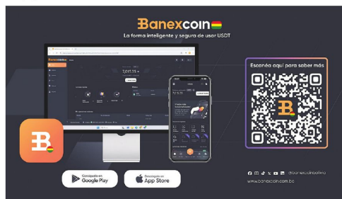
Los servicios incluyen transferencias y conversión de activos virtuales