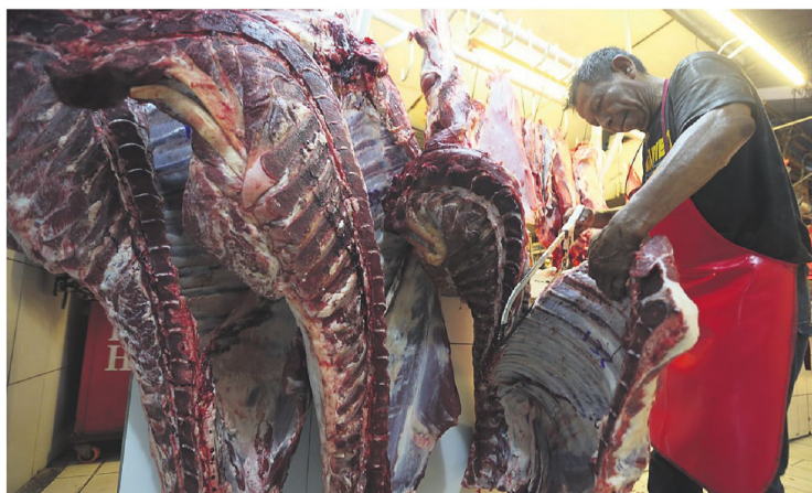
Algunas carnicerías pasaron de vender dos reses diarias a una; el sector está en situación de emergencia