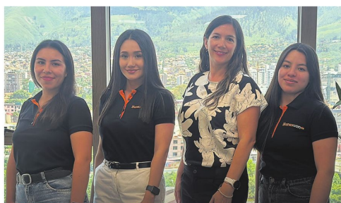
El equipo de Banexcoin Bolivia

Innovación con cumplimiento regulatorio. La obtención del Certificado de Adecuación no solo evidencia el cumplimiento de la normativa vigente, sino que reafirma la seriedad, responsabilidad y compromiso de Banexcoin Bolivia con la población boliviana. En un entorno dinámico y en constante evolución como el de los criptoactivos y los servicios asociados al rubro, este certificado además evidencia que la empresa opera bajo los estándares técnicos, operativos y de seguridad exigidos por el ente regulador, brindando a sus usuarios un marco de confianza, transparencia y protección en cada operación.