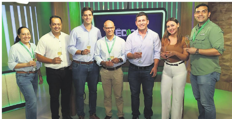
Representantes de Atlestar junto a parte del equipo del Grupo EL DEBER celebrando la alianza

Ambas instituciones proyectan nuevos eventos deportivos para este 2026 que incluyen una cobertura multiplataformas