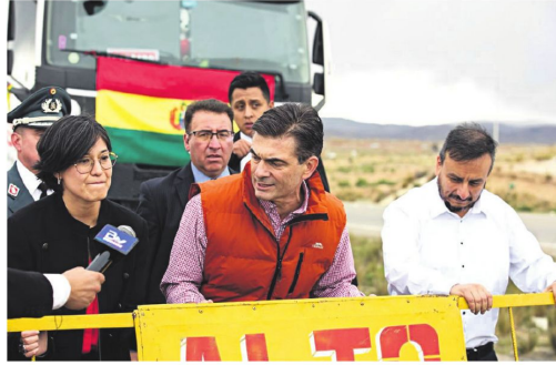
El presidente Paz en el operativo de ingreso de cisternas a Bolivia.