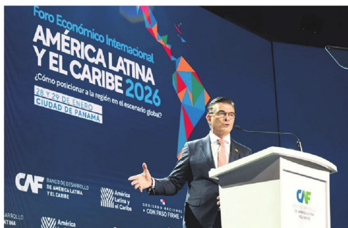
El presidente Rodrigo Paz inaugura el Foro de CAF, en Panamá.