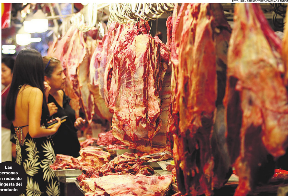
Las personas han reducido la ingesta del producto

Según explicó, este fenómeno no solo afecta a la carne de res, sino también a otros productos de la canasta básica como huevo, azúcar y harina, lo que repercute directamente en el acceso a