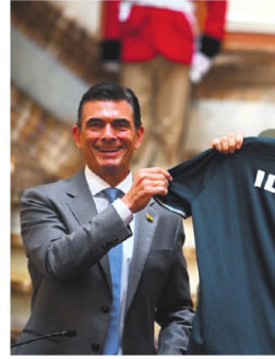
Paz regala una polera de la Selección