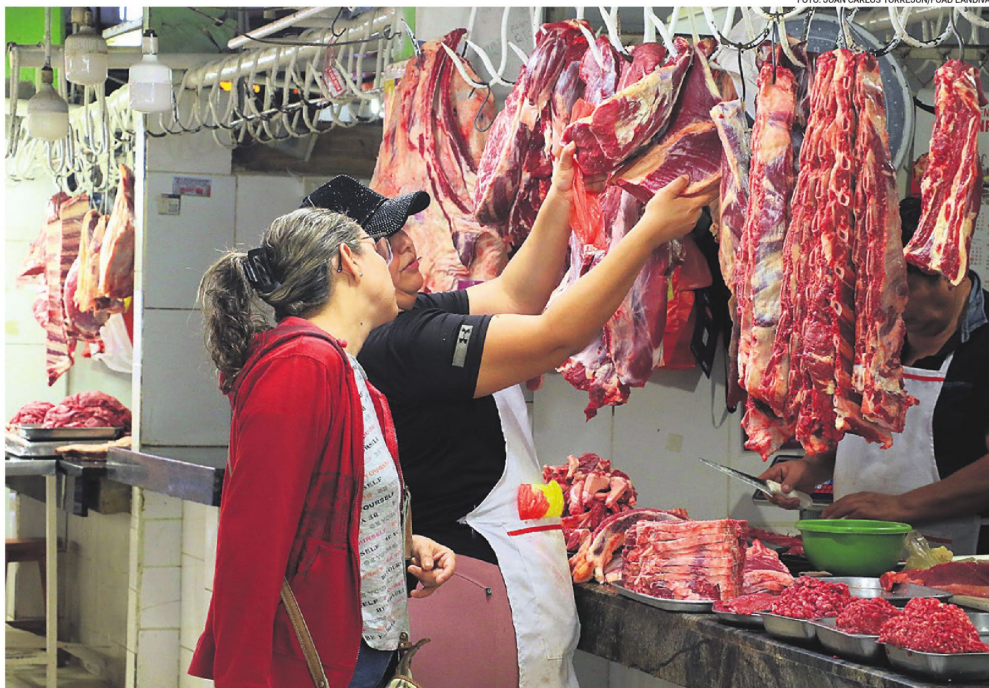
En los mercados, la afluencia de personas se redujo. La gente compra solo lo necesario o prefiere cortes más económicos, como el hueso