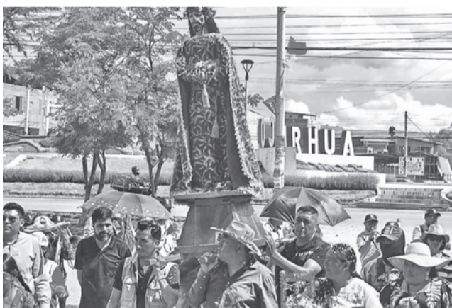
El festejo de Compadres en Colcapirhua, valle bajo.

Desde el barrio San Roque ayer más de 5 mil compadres descendieron rumbo a la plaza en la segunda entrada de Compadres, convirtiendo a la ciudad en el epicentro del Carnaval Chapaco 2026.