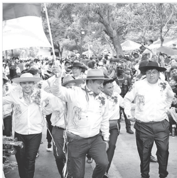
Compadres festejan en Tarija, ayer.