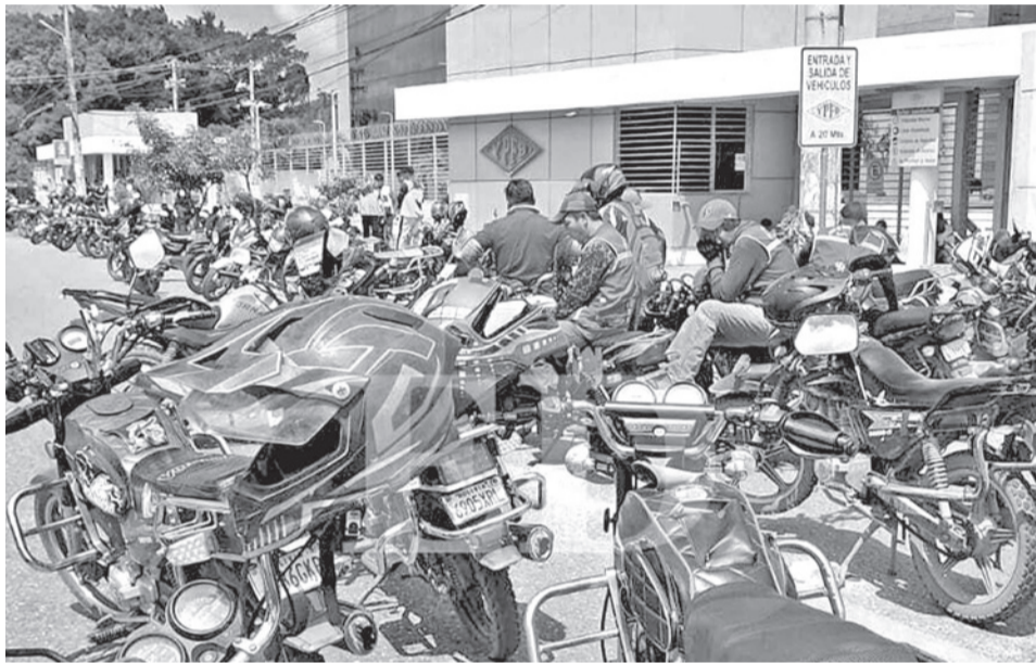
Mototaxistas bloquean el ingreso a YPFB, en Santa Cruz, ayer.

Los choferes del sector sindicalizado y libre de La Paz se movilizaron ayer y advierten con entrar en paro desde el lu-