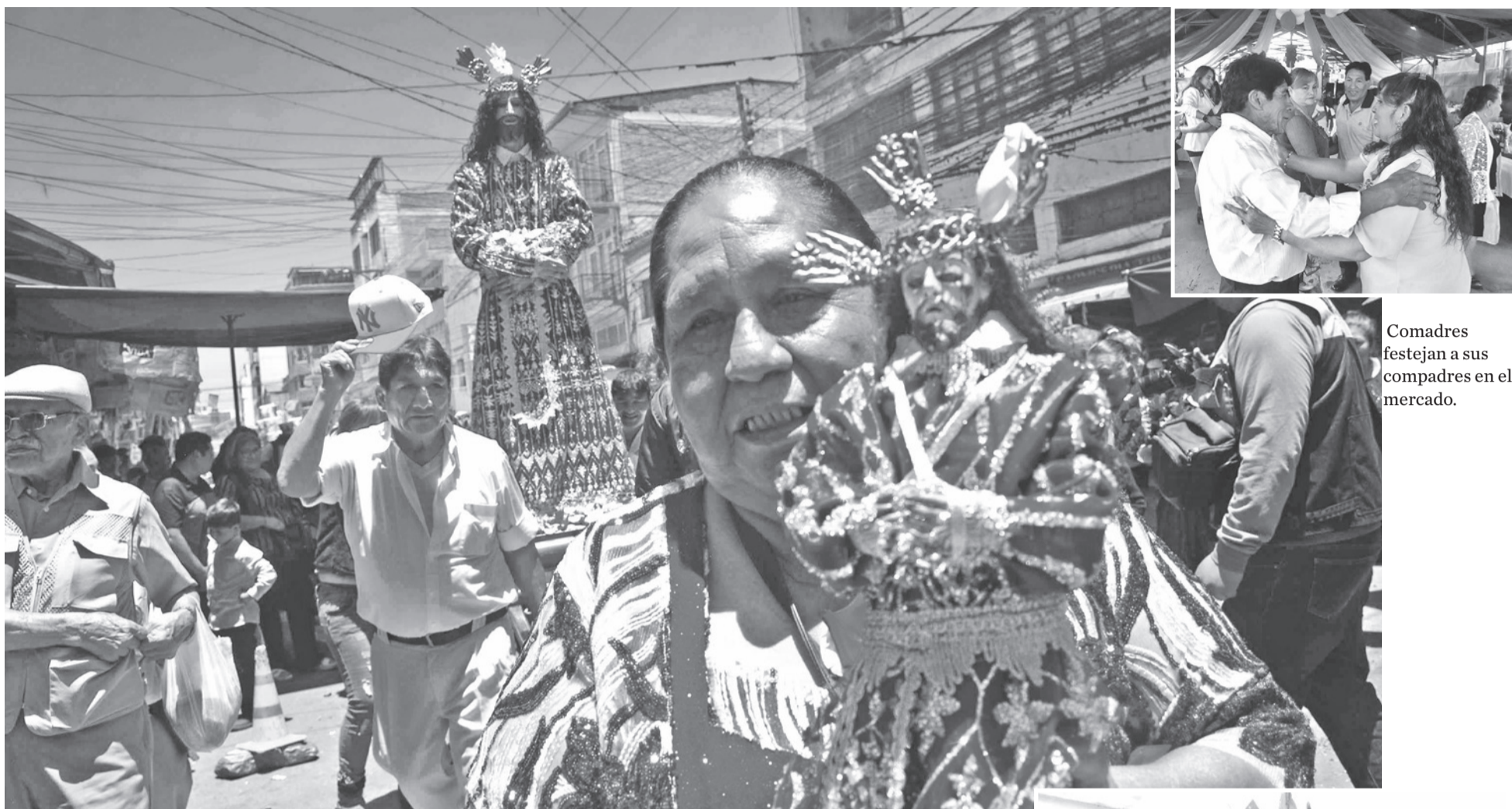
Comadres festejan a sus compadres en el mercado.

La tradicional procesión del Señor de la Sentencia o Tata Compadres en el mercado Calatayud.