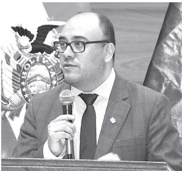
El presidente del TSE, Gustavo Ávila. TSE

En el otro extremo, los departamentos con menor actividad administrativa eran Pando con 98, Santa Cruz con