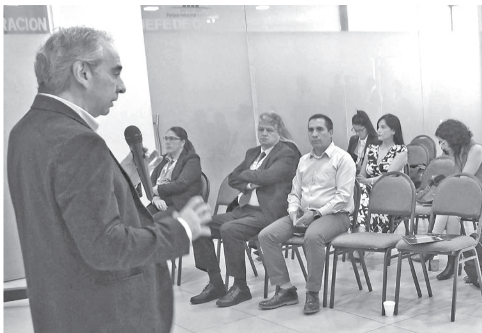
La presentación del Reporte Empresarial 2025 en la FEPC, ayer.

El principal riesgo identificado corresponde a la menor tracción de la demanda interna, asociada a la caída simultánea de sectores con alta incidencia en la estructura económica departamental. Durante 2025, la industria manufacturera (18% del PIB) registró una variación de -2,01%, el transporte y las comunicaciones (15%) -3,39%, la construcción (6%) -2,98% y el comercio (8%)