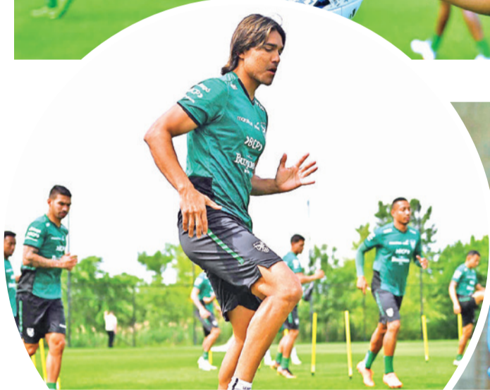
El Matador en un entrenamiento con la Verde.