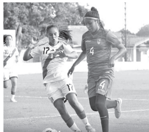
Un partido de la Selección Femenina. FBF