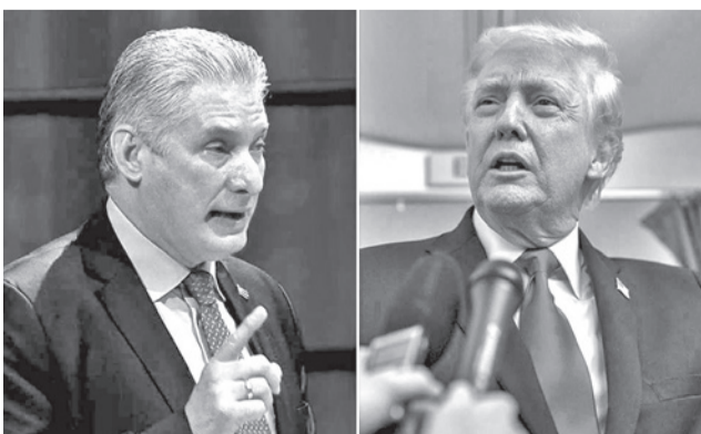
Los presidentes de Cuba y de Estados Unidos.

se desde “una posición de iguales, en una posición de respeto a nuestra soberanía, a nuestra independencia, a nuestra autodeterminación” y sin “injerencia en nuestros asuntos internos”, agregó.