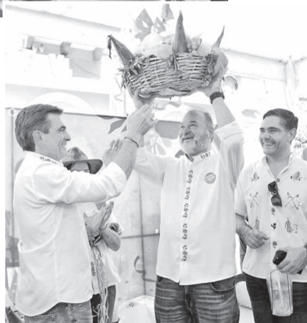
El presidente Paz festejó compadres en Tarija.

participó de las celebraciones en Tarija y destacó la importancia de mantener vivas las tradiciones anunciando que el Carnaval boliviano está siendo evaluado por empresas extranjeras para impulsar nuevos proyectos que fortalezcan el turismo y la cultura del país.