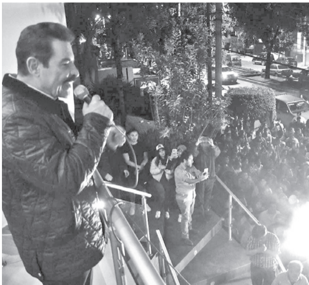
Festejo de los seguidores de Manfred Reyes Villa. J.ROCHA

Durante la audiencia, los vocales coincidieron en que el accionante no acreditó de manera sustancial la vulneración de los límites de autorregulación, razón por la cual la Sala no ingresó al análisis de fondo de la demanda.