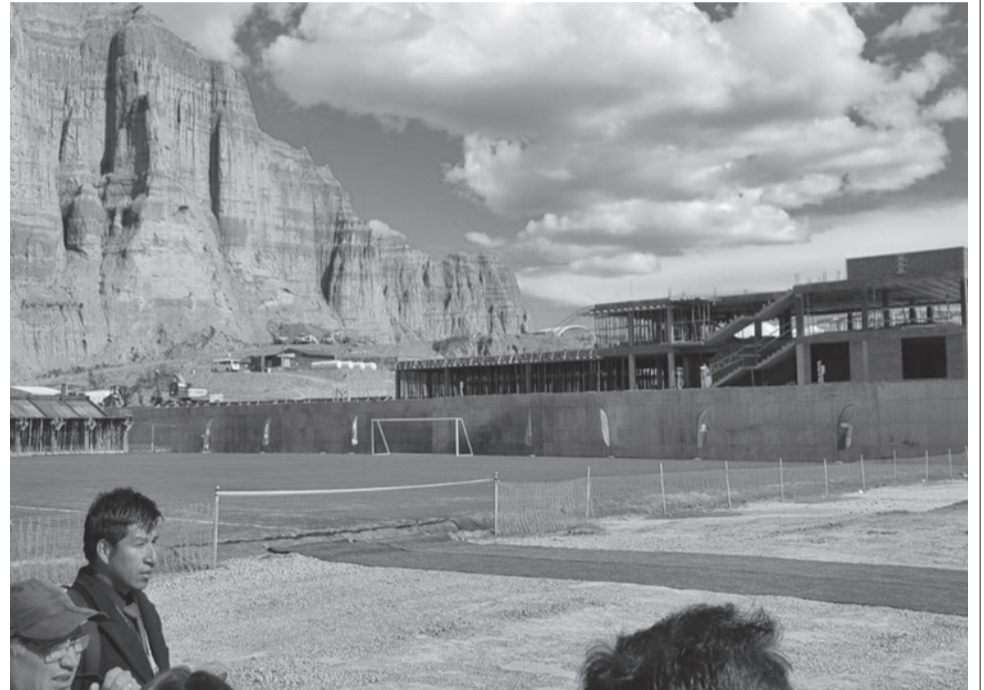
El CAR que se construye en La Paz para la Verde. RSS

La meta es que las jugadores cuenten con una casa del fútbol para su preparación