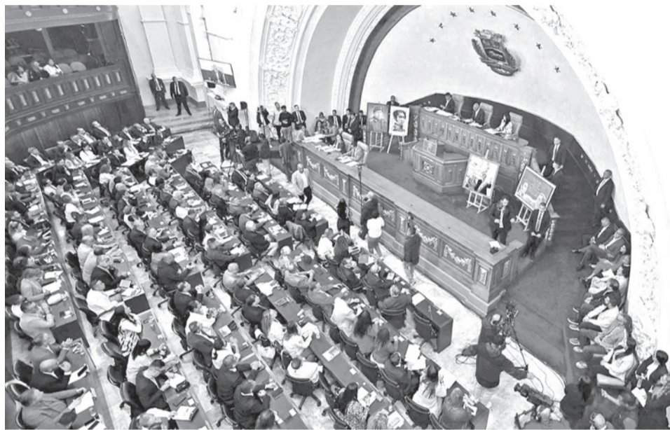
La Asamblea Nacional de Venezuela en su sesión de ayer, en Caracas.

la presidenta encargada, instó a que la consulta sea “profunda” e incluya a “quien tenga un testimonio” o propuesta, así como a los “familiares de las personas privadas de libertad”, los propios detenidos y “las víctimas también de los crímenes que se han cometido en todos estos años”.