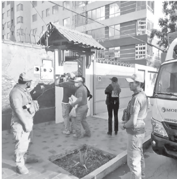
Policías en el lugar del crimen en Cochabamba. FGE

Un vecino relató que se percató del incidente mientras realizaba tareas en su moto y acudió al lugar tras escuchar los gritos de la mujer, señalando que la víctima aún presentaba signos vitales antes de ser atendida