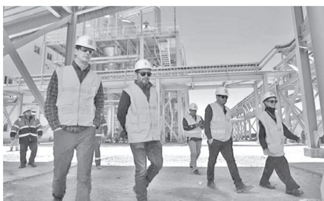
Misión de la UE en YLB, en Potosí. YLB

“Se firmó un acuerdo de cooperación, la comunidad europea propone 5 millones