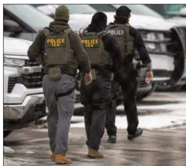
Agentes del ICE.

Sin embargo, el operativo contra la inmigración continuará en la región