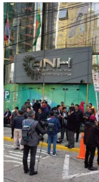
Reclamo frente a la ANH.

Pese a los pedidos de resarcimiento económico, el ministro de Hidrocarburos, Mauricio Medina-celi, lo descartó, debido a que, en su criterio, el daño fue ocasionado por la anterior administración. No obstante, anunció procesos para dar con los responsables.