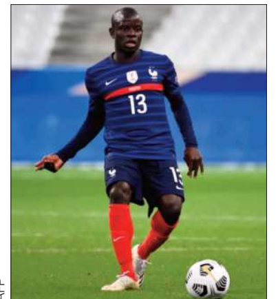
El volante francés N'Golo Kanté.

"En mi nombre y en el del club, deseo expresar mi gratitud a nuestro presidente, el señor Recep Tayyip Erdogan, por su apoyo inquebrantable, que permitió la buena conclusión de este proceso, el cual contribuirá al desarrollo del Fenerbahçe y del fútbol turco", escribió el presidente del club estambulita Sadettin Saran.