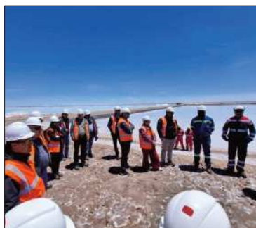
Una visita a la planta de litio.

Una misión técnica alemana evalúa alianzas para el desarrollo del litio