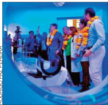
Paz en la entrega del tomógrafo.

El equipo entregado es computarizado y de última tecnología