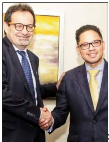
Encuentro entre la CNI y la UE.

Bolivia tiene importantes oportunidades de inversión en varios rubros