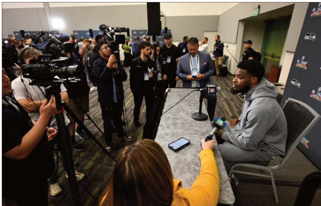
FIGURA. La estrella del Seattle, Devon Witherspoon, habla con los medios en San José, California.