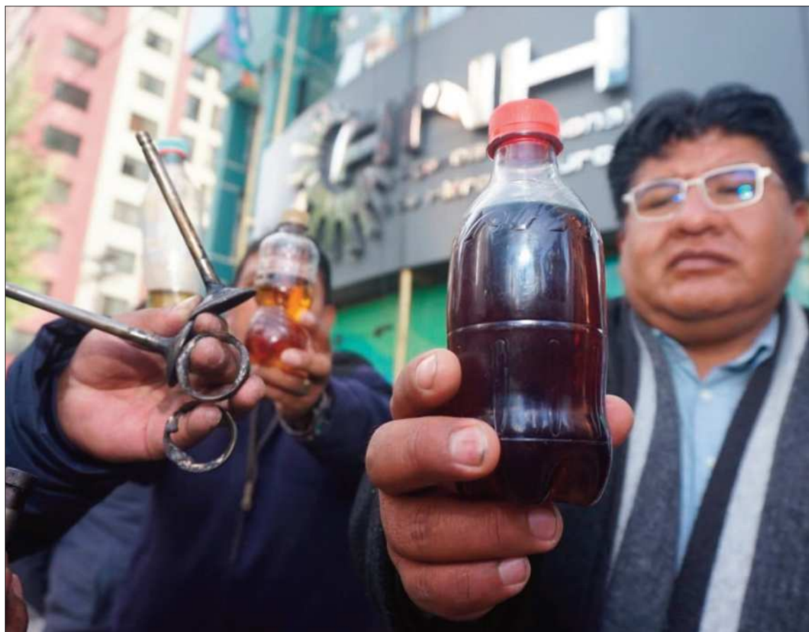
MOVILIZACIONES. Los choferes en La Paz reclaman por la calidad de la gasolina.

En tanto, en La Paz, choferes de la Federación Chuquiago Marka, transporte libre de La Paz e interciudad también protestaron en puertas de la Agencia Nacional de Hidrocarburos (ANH) en demanda del resarcimiento por el daño ocasionado por el combustible.