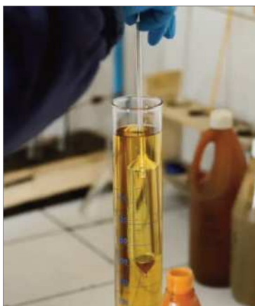
Laboratorio analiza la gasolina.

Propietarios de surtidores piden certificación ante reclamos de conductores