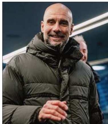
Joseph Guardiola, DT del City.

El exitoso entrenador del Manchester City consiguió una victoria tranquila este miércoles en casa, pese a haber alineado a sus habituales suplentes, desde el portero hasta el delantero centro.