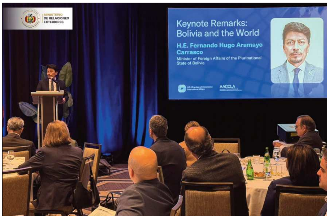
PARTICIPACIÓN. El canciller Fernando Aramayo participa en AACCLA's Outlook on the Americas.

En noviembre, durante el acto de posesión del presidente Rodrigo Paz, arribó una delegación norteamericana encabezada por Christopher Landau, subsecretario de Estado. Posteriormente, en diciembre, una misión económica de ese país llegó a Bolivia para