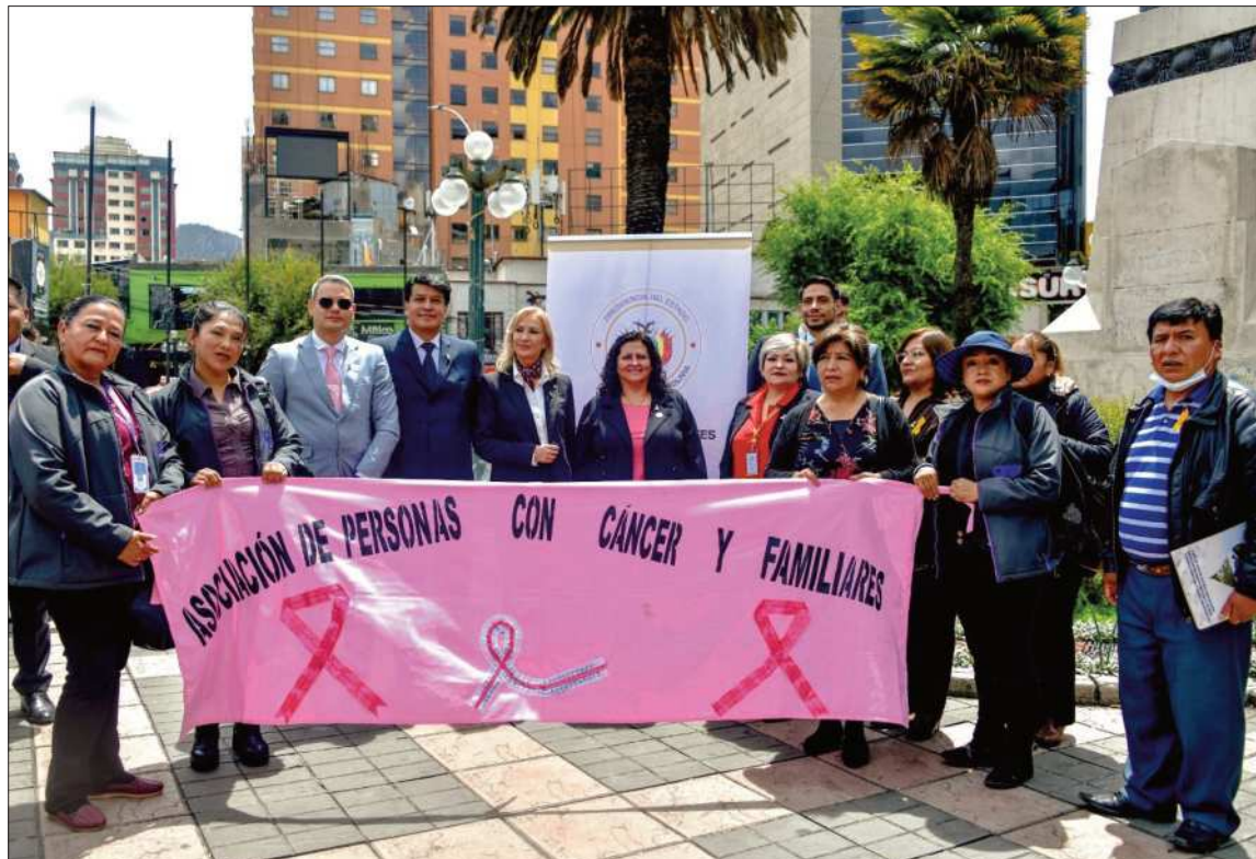
IMAGEN Miembros de la Asociación de Personas con Cáncer y Familiares junto a la Ministra de Salud.

Ante la situación, el Ministerio de Salud lanzó la campaña “Tu