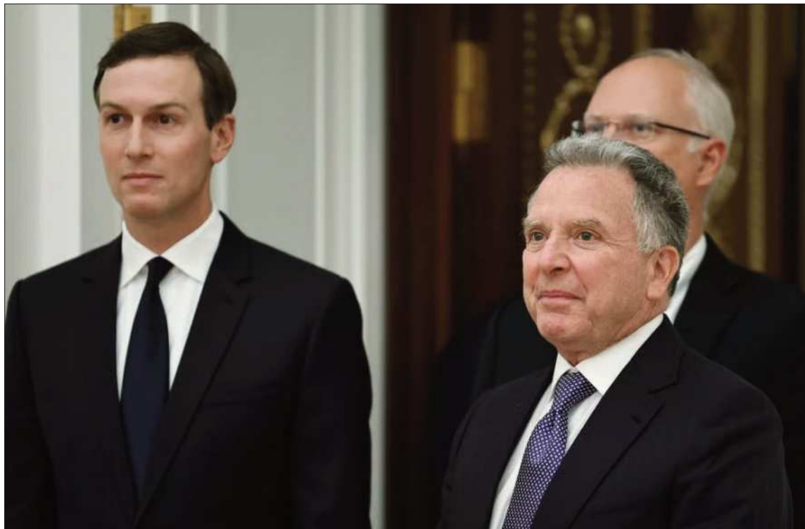
NEGOCIADORES. Steve Witkoff y el yerno de Trump, Jared Kushner, participaron de las tratativas.

TIERRAS. El Kremlin insistió el miércoles en que proseguirá con su ofensiva hasta que Ucrania