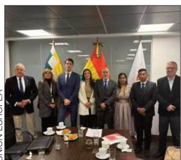
Asambleístas y misión de la UE.

El organismo conoció los principales desafíos que enfrenta el Legislativo