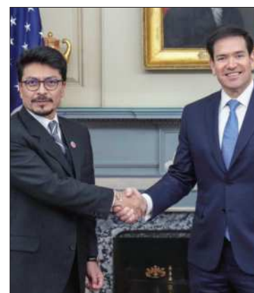
Bolivia y EEUU estrechan lazos.

El encuentro fue calificado como un hito diplomático enmarcado en el compromiso de Bolivia con una política exterior basada en el diálogo y la cooperación.