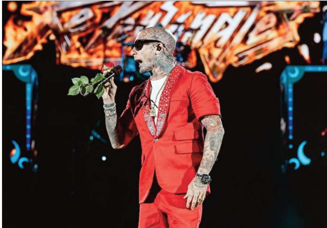
FIGURA. Emanuel Noir es el vocalista que lidera la banda argentina Ke Personajes. Vendrá a Comadres antes de actuar en el Festival de Viña del Mar, en Chile

Tradición. La Fiesta de Comadres es una fiesta muy popular en Tarija, pero con el tiempo su práctica se esparció por todos el territorio boliviano.