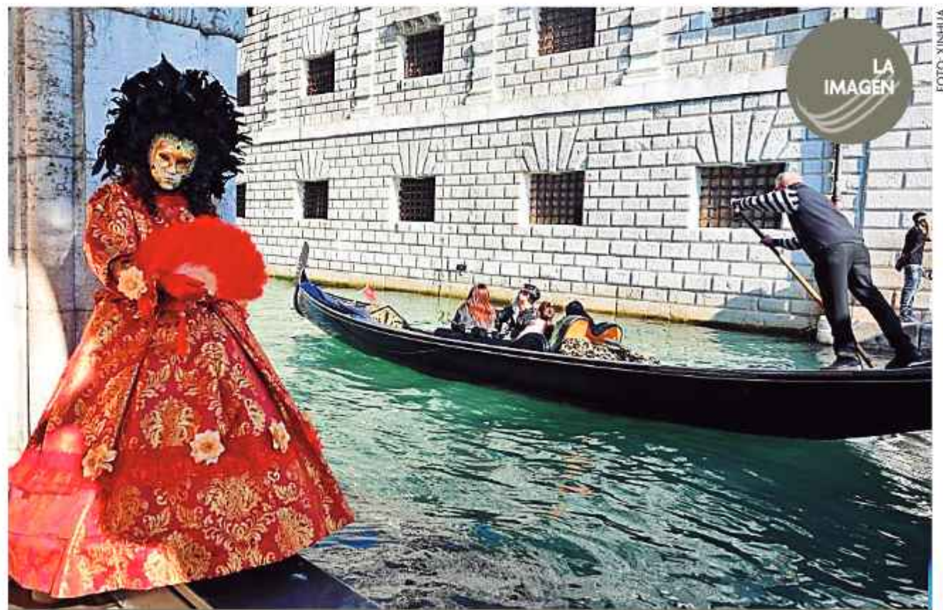
EL CARNAVAL DE VENECIA

Otro atractivo de gran relevancia es la Virgen del Socavón, que fue declarada "Dignidad de basilica menor" y confirmado por la Santa sede en 2025, cuya imagen tiene aproximadamente de 45 metros de altura y es considerada una de las más grandes de Latinoamérica.