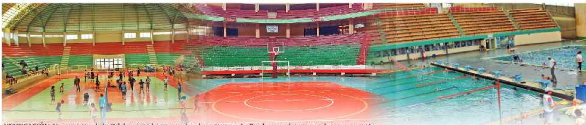
VERIFICACIÓN. Un comisión de la Odebo visitó los escenarios deportivos en La Paz, los que dejaron una buena impresión.

El Presidente de Odebo recomienda habilitar otros escenarios deportivos, además de esperar con "optimismo y paciencia" la respuesta de la organización regional.