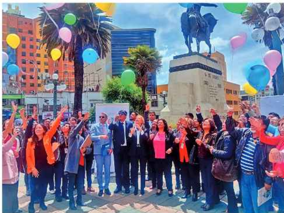
ACTO. Autoridades y representantes que luchan contra el cáncer soltaron globos de esperanza.

Para la ejecución de esta estrategia se movilizará a