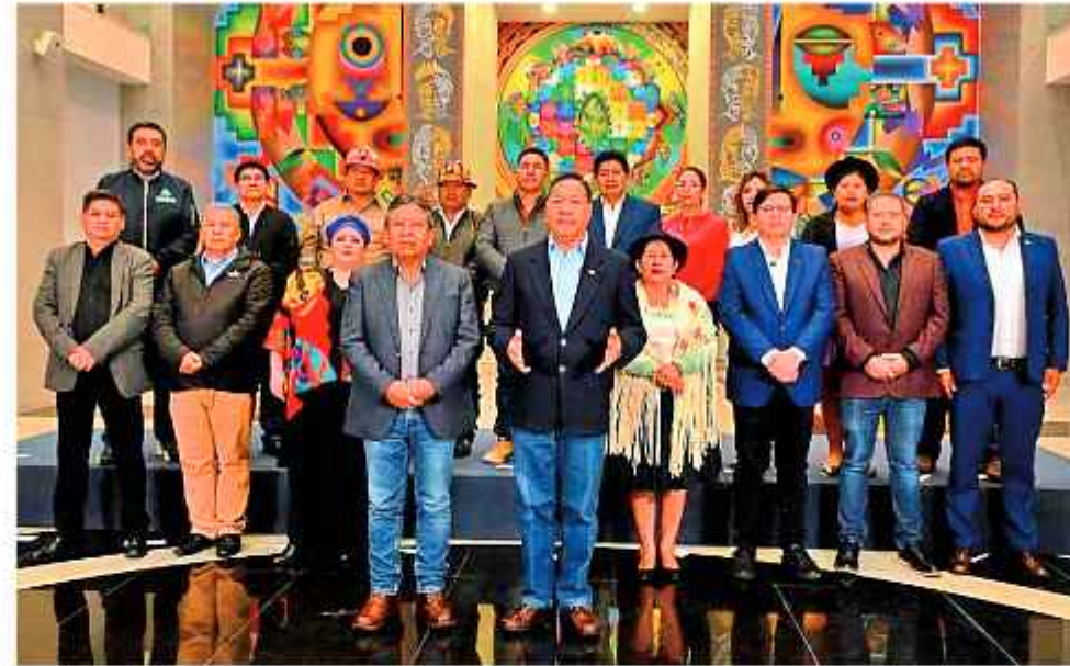
GRUPO. Las exautoridades del gobierno de Luis Arce están en la mira de la actual administración.

El objetivo principal es asegurar que quienes ejercieron funciones públicas no abandonen el territorio nacional, mientras se consolidan las investigaciones