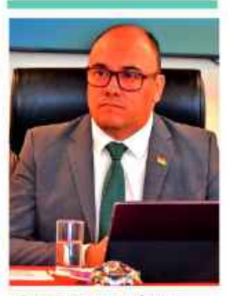
PERFIL. Gustavo Ávila, presidente del TSE.

Los legisladores buscan una aprobación por "dispensa de trámite" o vía rápida para evitar "fugas".