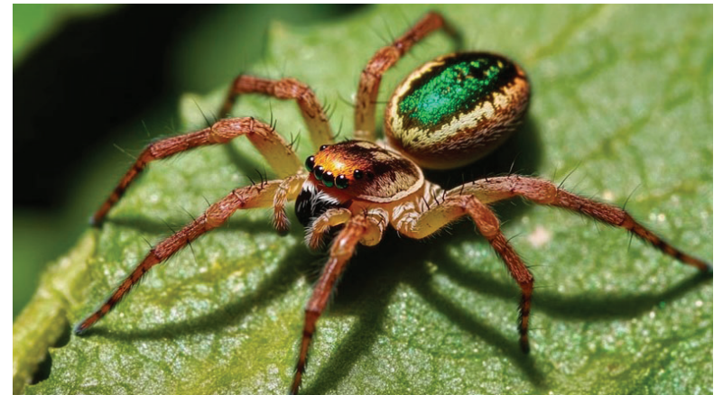
Algunas arañas utilizan la ilusión óptica como defensa frente a sus depredadores

Gracias al seguimiento de campo y al uso de grabaciones, investigadores han podido documentar cómo las arañas seleccionan meticulosamente los materiales y los disponen en patrones que maximizan el efecto visual. Las observaciones también han permitido comparar la variedad de figuras entre diferentes regiones.