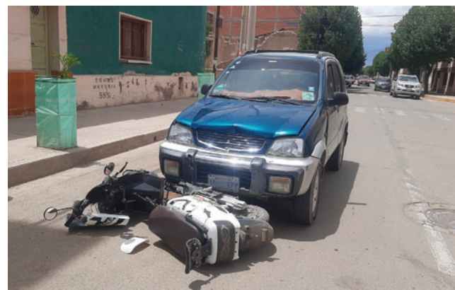
Los motorizados protagonistas

El médico indicó que, debido a la naturaleza del accidente, se determinó la