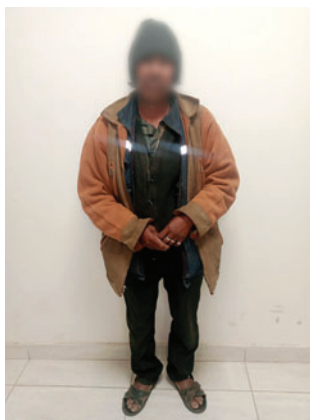
El hombre fue aprehendido

El Ministerio Público investiga un presunto caso de parricidio ocurrido en una comunidad rural del departamento de Oruro, donde una mujer adulta mayor fue hallada sin vida al interior de su vivienda con evidentes signos de violencia. El principal sospechoso es su hijo, quien fue aprehendi-