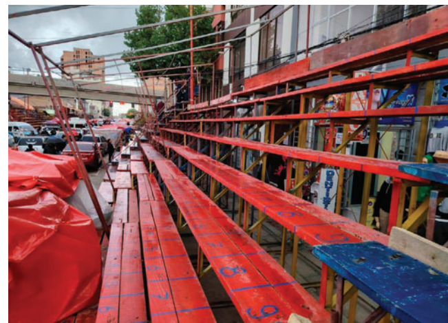
Concejo Municipal aprobó ley para regular el precio de las graderías en la ruta del Carnaval