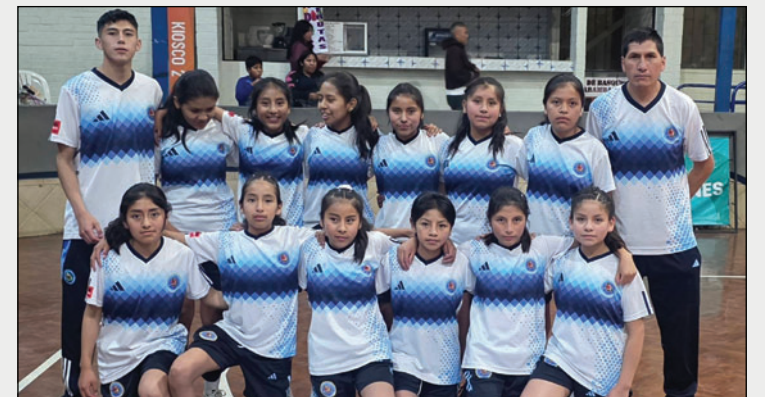
Saavedra quiere lograr la clasificación a la siguiente fase

En anteriores ediciones, los equipos orureños demostraron su valía, incluso con títulos en su haber, como el campeonato logrado por Saavedra en la U-12 de la Libomenor. Ese antecedente convierte al club Saavedra en uno de los firmes candidatos para alcanzar la clasificación y pugnar por el título.