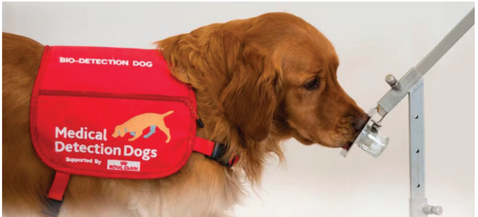
Los canes, con su agudo olfato, logran detectar enfermedades y ayudan en asistencia médica

En tanto, las HeroRATs son lo suficientemente ligeras para no detonar las minas, pero lo bastante grandes para abarcar grandes superficies. El trabajo de estos animales ha permitido limpiar más de 120 millones de metros cuadrados de campos minados en Angola, Azerbaiyán y Camboya, entre otros países. Su método consiste en identificar el olor de explosivos como el TNT y señalar el lugar exacto rascando el suelo, lo que facilita la intervención segura de los técnicos humanos. A pesar