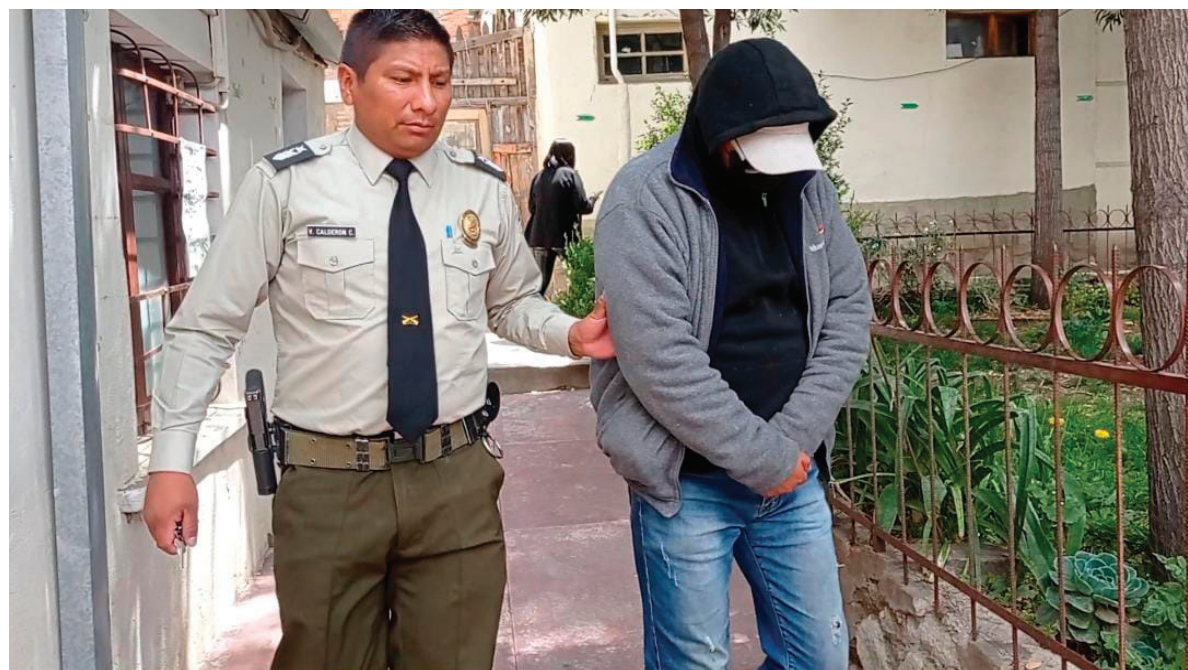
El sujeto fue trasladado a celdas de la Fiscalía

El Ministerio Público estableció que los encuentros aparentemente se produjeron en reiteradas oportunidades en el domicilio del sindicado, en saunas de la ciudad y en otros espacios privados. Asimismo, se evidenció que el imputado exigía a la menor el envío de fotografías íntimas y grababa algunos de los encuentros, hechos que forman parte de los elemen-