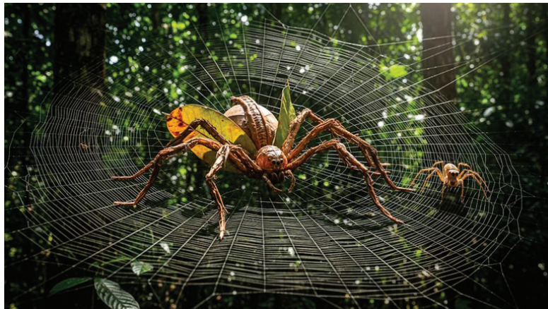
Las arañas recolectan materiales para crear figuras de un tamaño mayor

Las figuras suelen estar formadas a partir de una combinación de materiales recolectados en el entorno inmediato. Entre los más habituales se encuentran hojas secas, pequeños trozos de madera, restos de caparazones de insectos y fibras vegetales. Cada araña selecciona y