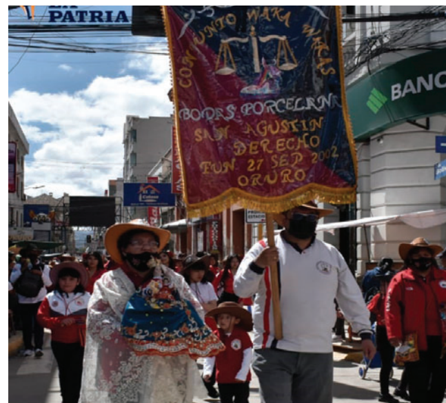
Cada conjunto hará una evaluación posterior para el Sábado de Peregrinación / LA PATRIA

El representante de la ACFO destacó que Oruro se encuentra a pocos días de vivir una de sus manifestaciones culturales y religiosas más importantes, reafirmando que el Último