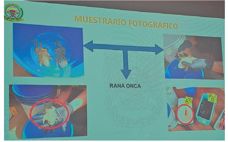
Tres personas fueron aprehendidas durante un operativo en Huatajata

El fiscal Torrez advirtió que su comercialización es totalmente ilegal y que este tipo de actividades clandestinas aceleran la desaparición