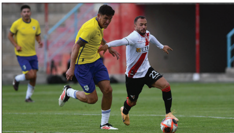
El cuadro "millionario" fue dominador del partido y pudo clasificar