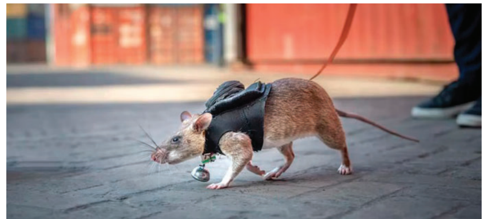
Las ratas africanas han logrado el desminado en países como Angola y Camboya