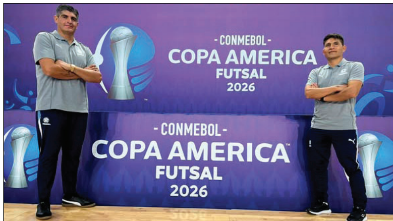
Los jugadores se alistan para lograr la victoria y clasificar

Aunque el torneo de verano es considerado parte de la preparación para el campeonato oficial, la premisa es vencer a su clásico rival. Un triunfo permitiría sumar otros dos encuentros amistosos y así darle mayor rodaje competitivo al equipo. Bajo esa consigna, el plantel dirigido por Marcelo Robledo cumplió una nueva jornada