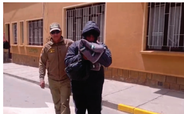
El sujeto fue trasladado al penal de San Pedro