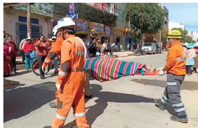
Una mujer falleció producto del accidente de tránsito

El fiscal señaló que, además de la falta de habilitación, se investiga el exceso de velocidad como uno de los factores que aparentemente contribuyeron al hecho. En ese marco, el Ministerio Público formalizó la imputación