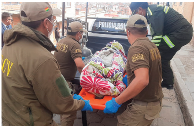
Las autoridades investigan el hecho

El fiscal de materia Luis Antezana informó este miércoles 4 de febrero de 2026 que el hecho ocurrió la madrugada del martes 3 de febrero de 2026 al interior de un inmueble ubicado en la calle Tarija, entre Tomás Frías y Renjel. La víctima, identificada como Verónica S.A.C. de 47 años, convivía con su pareja, un hombre de 53 años, con