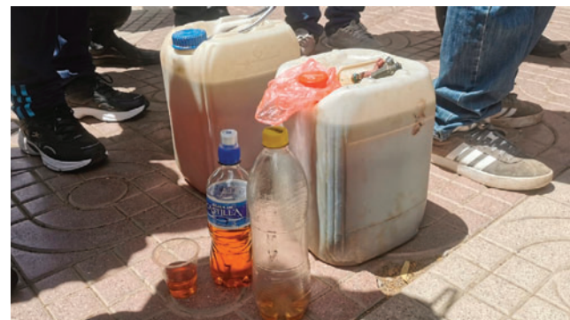
Los movilizados cargaron la gasolina en presunto mal estado

Choque advirtió que, de no existir una respuesta pronta y favorable por parte del