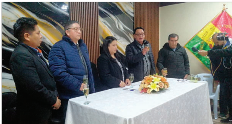
Durante el acto de entrega de la remodelación del salón de reuniones

El trabajo se ejecutó con recursos propios de la agremiación y bajo la supervisión de la Gobernación de Oruro, que pudo constatar cómo se debe actuar en este tipo de casos en lugar de dejar morir uno de los ambientes más emblemáticos del deporte orureño.