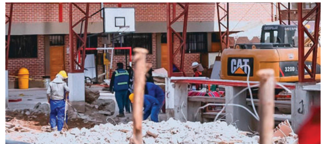
Proyecto contempla una inversión de más de Bs 6 millones

bloque educativo se enmarca en el plan municipal de fortalecimiento de la infraestructura escolar. En un contexto donde la demanda por espacios adecuados y equipados