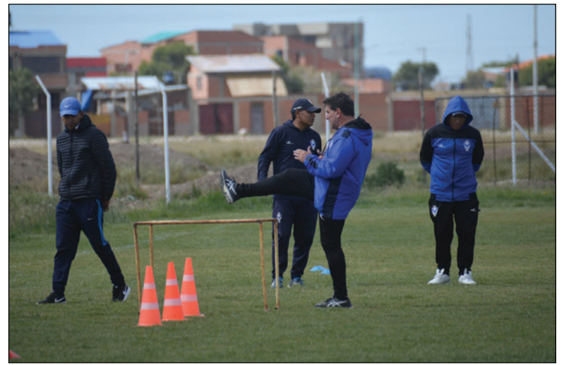
Las prácticas no cesan en el equipo de GV San José

tierra donde ya tuvo un buen paso por el club.