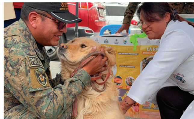
Campaña de vacunación antirrábica se realizará este 5 y 6 de febrero

Indicó que la campaña priorizará la vacunación de canes que no cuentan con cintillo y aquellos que no fueron inmunizados en la última campaña realiza-