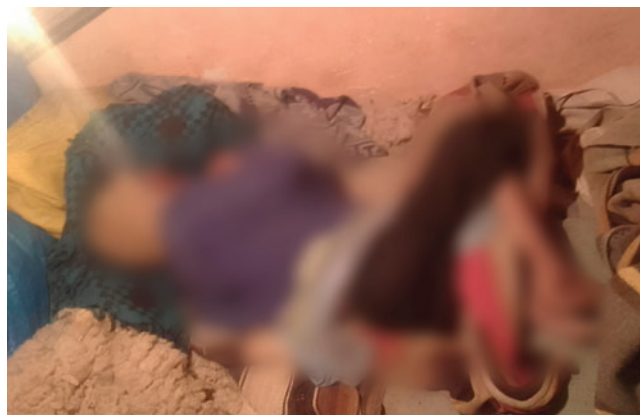
La mujer fue hallada sin vida en su domicilio

El fiscal señaló que el hombre ya contaba con antecedentes de agresiones físicas y psicológicas contra su madre. Además, los vecinos expresaron su