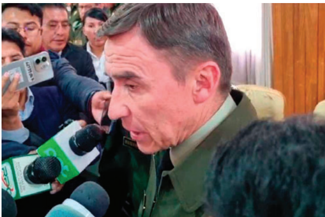
El general Sokol ante los medios de comunicación

Sokol explicó que “hay grupos que cuentan con armamento sofisticado”, mientras la Policía ha sido desarticulada durante los últimos 20 años.