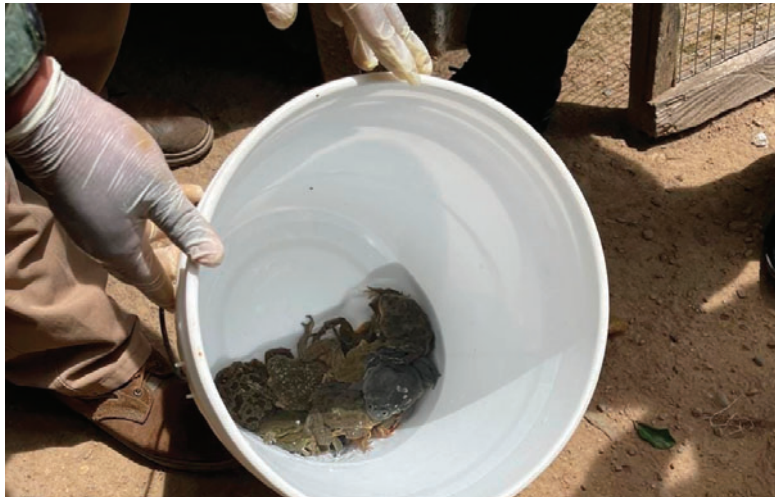
Investigan la comercialización ilegal de ranas gigantes