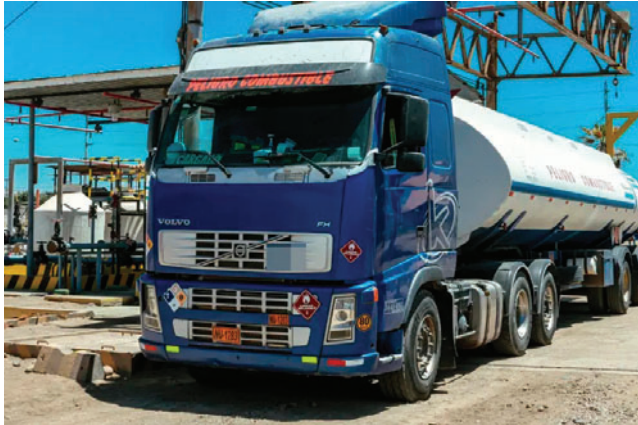
Desde YPFB anunciaron medidas ante reclamos por la calidad de combustible

Al ser preguntado sobre las medidas que implementará la petrolera estatal frente a los residuos detectados en los depósitos de almacenamiento, Akly detalló que se va a reducir la