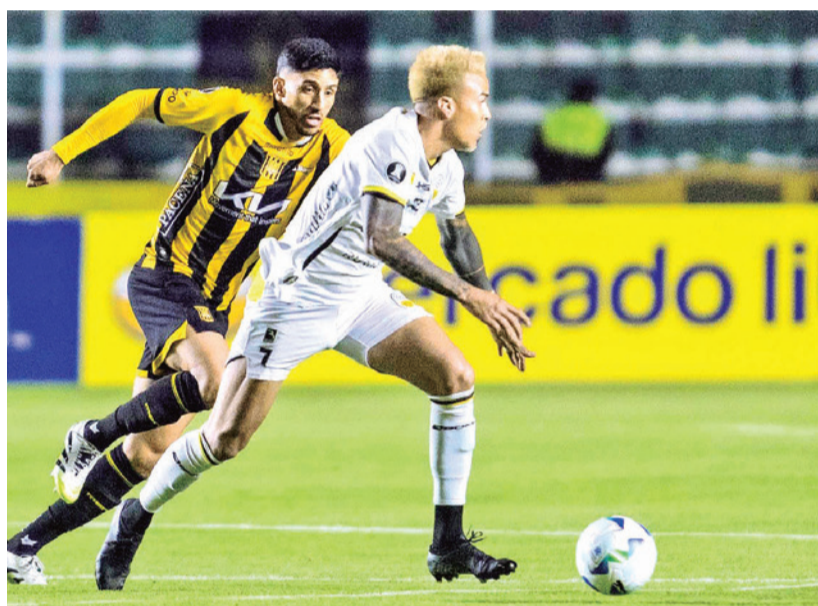
Una jugada y el festejo del gol.

Complicado. Los venezolanos hicieron un planteamiento inteligente, maniataron el Tigre que no pudo anotar más de dos goles, ambos de remate penal