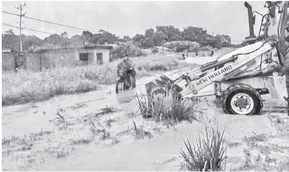
Las lluvias y riadas afectan a varios municipios del Bolivia. GAMCOBIJA

Las intensas lluvias que afectan al norte del departamento de La Paz obligaron a migrar a la modalidad a distancia a los estudiantes de la unidad educativa 16 de Julio del municipio de Tipuani. Las aulas y calles quedaron inundadas en la zona, lo que impidió el normal inicio de las labores escolares. Las autoridades determinaron la aplicación de la modalidad a distancia por cinco días. La decisión se asumió tras coordinar con la dirección del establecimiento, ubicado en una de las zonas más vulnerables del municipio.