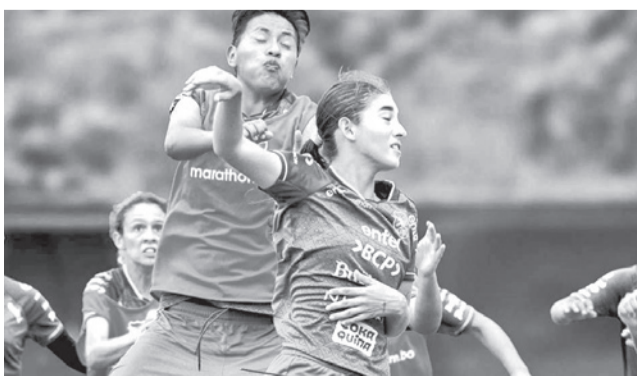
Un partido de la Selección femenina. FBF

campeonato, el Seleccional Nacional ya se encuentra en Paraguay donde mañana en el mismo escenario deportivo debutará contra Perú, el partido fue programado para las 17:00 (HB). Con miras a este torneo de la Conmebol, el técnico Yury Villarroel, dirigió los entrenamientos del equipo en Santa Cruz, desde donde viajó. El certamen sudcontinental finalizará el sábado 28 y contará con la participación de las 10 selecciones de esta parte del continente.