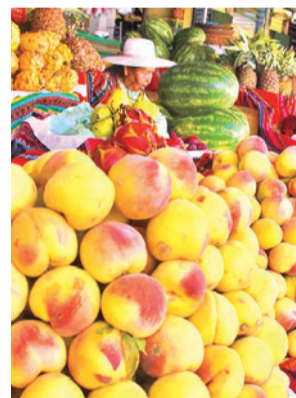
El durazno, la fruta de la temporada. JOSE ROCHA

Butrón destacó que estas actividades buscan rescatar expresiones culturales propias del valle cochabambino,