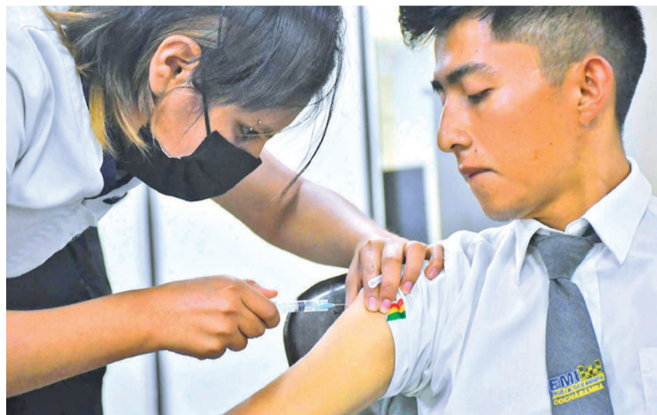
La vacunación contra el sarampión en los centros de salud. CARLOS LÓPEZ

De estos, 268 pacientes presentaron neumonía, algunos con complicaciones, principalmente tras el reinicio de actividades educativas. Las autoridades recomiendan reforzar medidas de bioseguri-