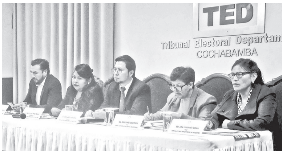
Reunión de Sala Plena del Tribunal Electoral Departamental (TED).

López explicó que la organización política realiza la representación correspondiente en el marco del artículo 217 de la Ley 026 del Régimen Electoral.