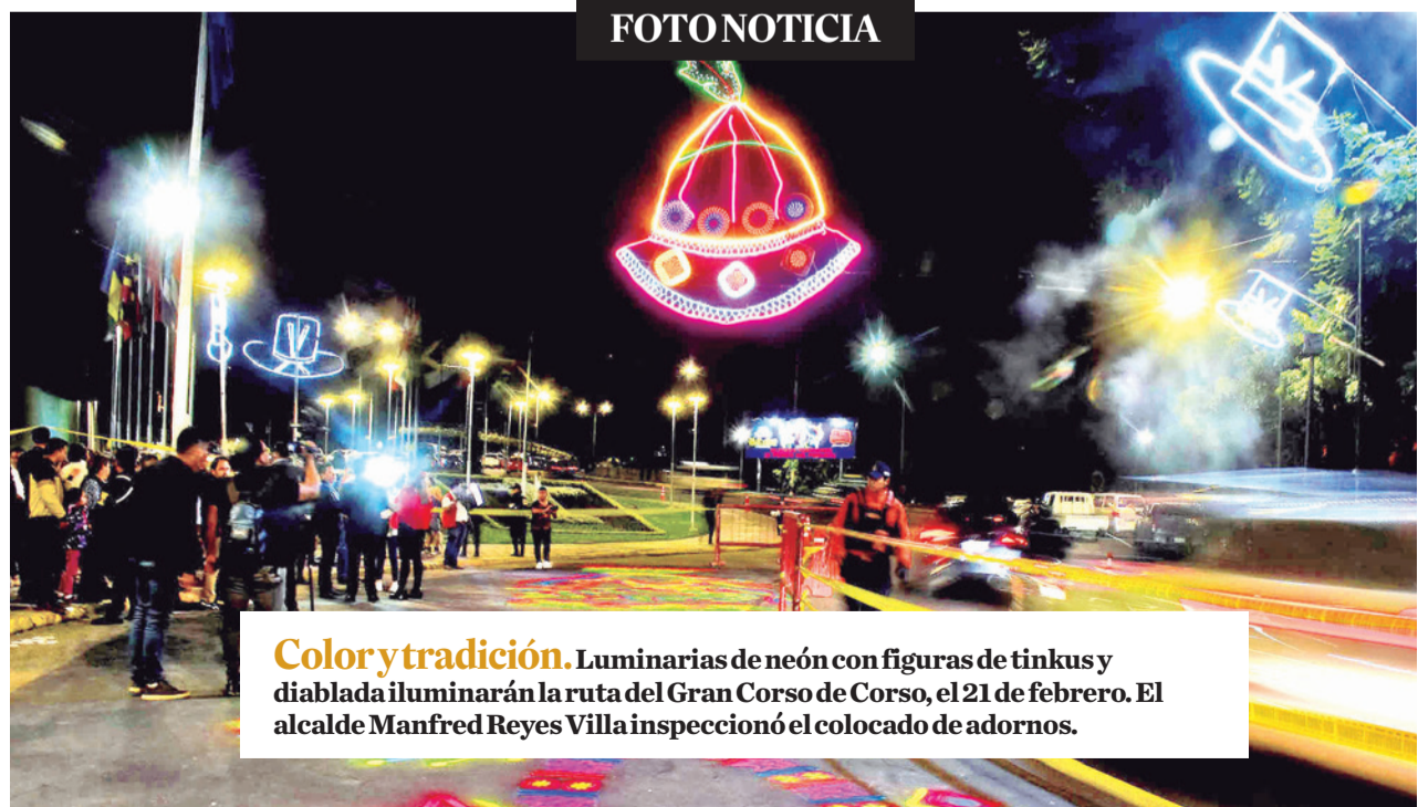
Color y tradición. Luminarias de neón con figuras de tinkus y diablada iluminarán la ruta del Gran Corso de Corso, el 21 de febrero. El alcalde Manfred Reyes Villa inspeccionó el colocado de adornos.