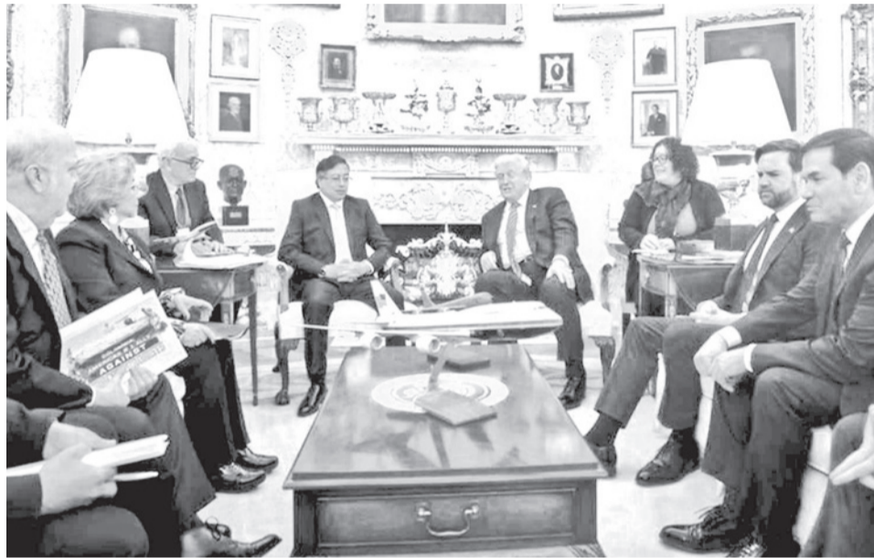
Los presidentes de Colombia y de Estados Unidos, ayer en la Casa Blanca. PRC

Petro llegó a la residencia presidencial hacia las 10.55 hora de Washington (11.55 en Bolivia) a bordo de un vehículo