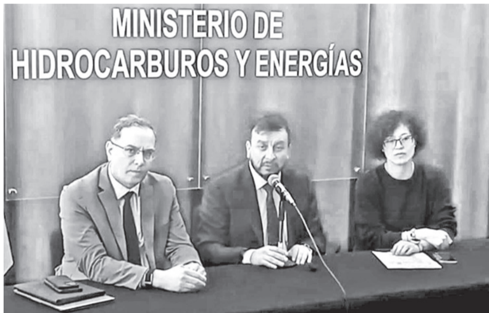
La conferencia de YPFB y el ministro Medinaceli, ayer.

Los controles de calidad a la gasolina importada y distribuida no presentaban novedades; sin embargo, luego en una investigación se identificó un “producto residual” en tanques de almacenaje con impurezas adicionales. “Estos otros componentes son el manganeso y la goma, que normalmente en un examen normal no se mapean, no se estudian, porque se hacen en otro tipo de laboratorios. Ese residual que venía de gestio-