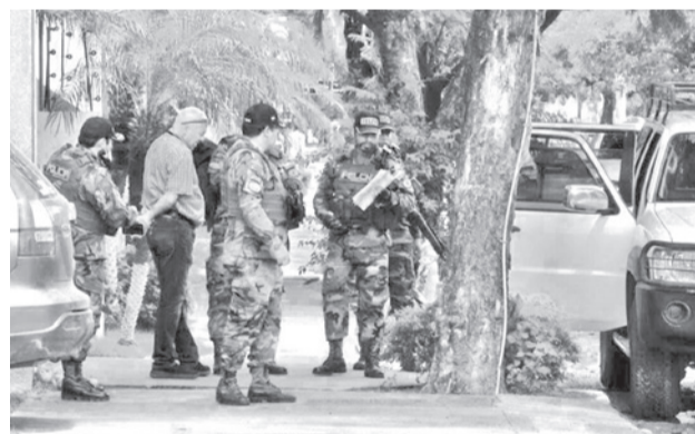
Operativos de la Policía por el caso “maletas”.

Lupo considera que estas medidas serán debatidas dentro de la ALP y que ya no serán emanadas mediante un decreto supremo. “Esa es exactamente la estrategia que vamos a seguir respetando el orden constitucional y nuestro ordenamiento legal en el país, pero sí hay un sentido de urgencia”, dijo Lupo.