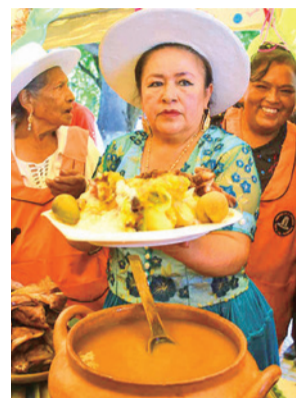
El lanzamiento de la Feria del Puchero.