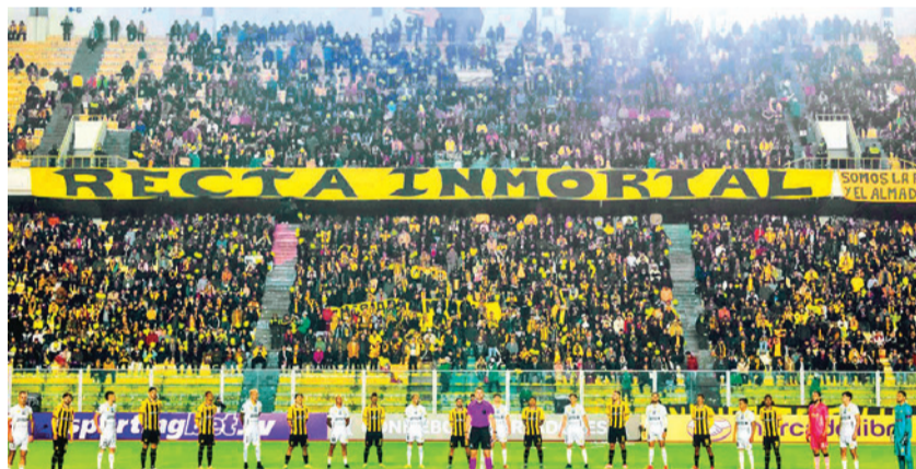
Los equipos que se enfrentaron, ayer.