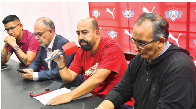
La dirigencia de Wilstermann. HERNAN ANDIA

En caso contrario, podría dar a entender un desistimiento del proceso, por lo que este podría ser finalizado,