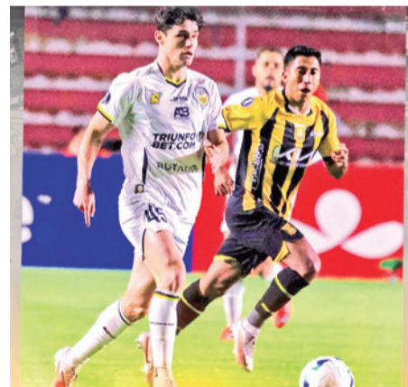
Incidencias del partido. CLUB TACHIRA