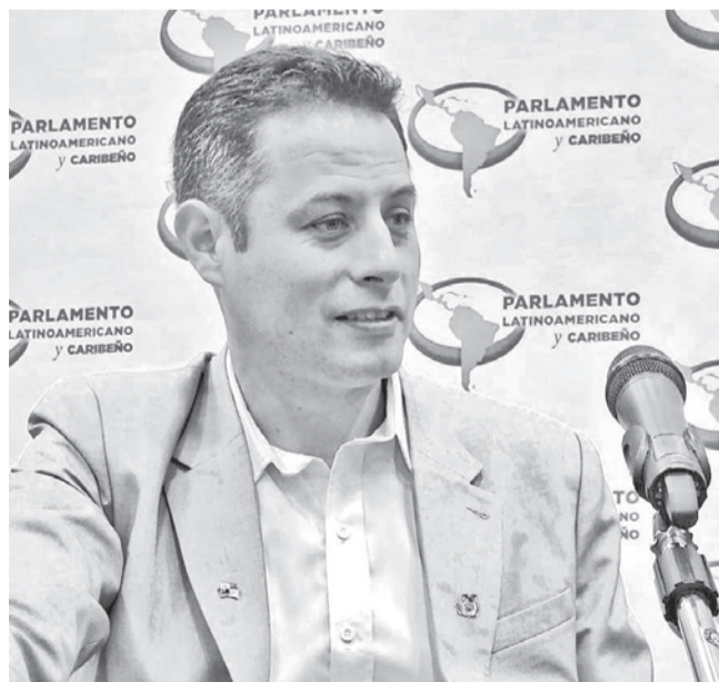
El vicepresidente del Estado, Edmand Lara.