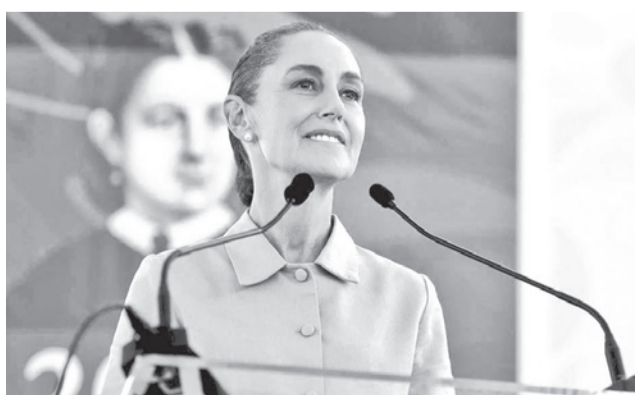
La presidenta de México, Claudia Sheinbaum.

“Eso (la mediación) depende de Cuba y de Estados Unidos. Cuba es un país soberano, independiente. EEUU también. México siempre ha puesto la mesa para poder atender cualquier conflicto”