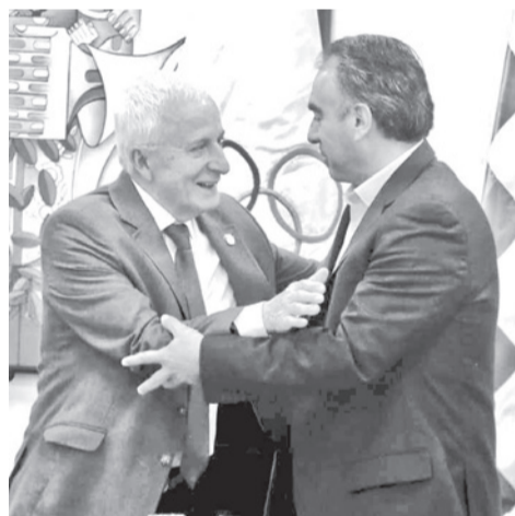
La comisión que evalúa la sede.