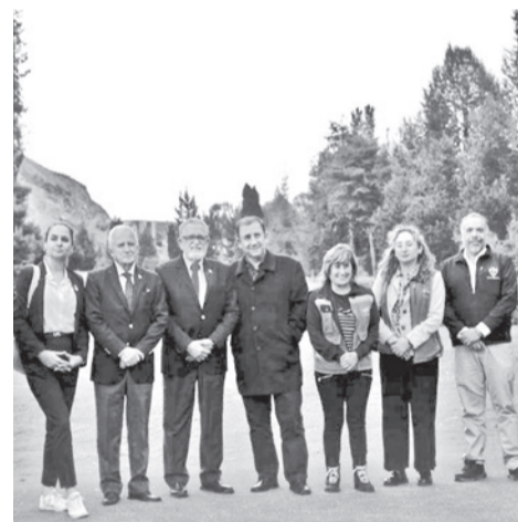
El trabajo para confirmar la sede.