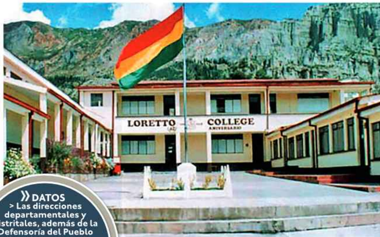
COLEGIO. Infraestructura del establecimiento privado de la zona Sur en La Paz.

Una madre de familia, quien pidió mantener su identidad bajo reserva, relató que pese a reconocer una deuda por pensiones correspondientes a algunos meses de la gestión 2025, asumió el compromiso de pagarla en su totalidad; sin embargo, aseguró que la administración del colegio se negó a devolverle las libretas de sus hijos. “Hace más de una semana pido