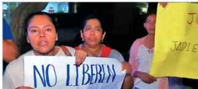
PROTESTA. Familiares del joven piden justicia.

Al llegar a la clínica, el padre recibió una versión