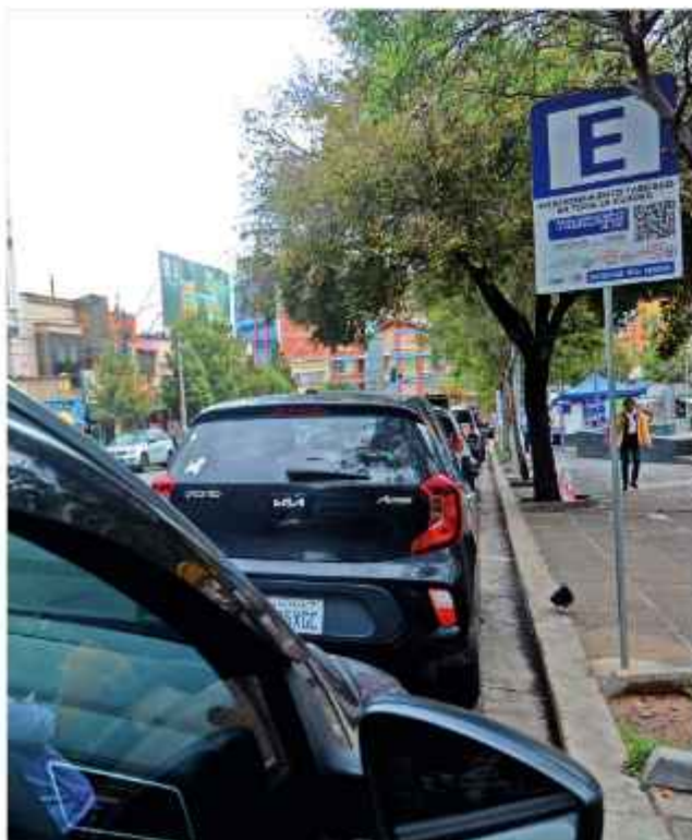
ESPACIOS. Vehículos estacionados en Sopocachi, La Paz.

El parqueo tarifado continúa vigente, según el Ejecutivo Municipal, pero el Presidente del Concejo Municipal, señaló que está suspendido el cobro por el estacionamiento vehicular en La Paz.