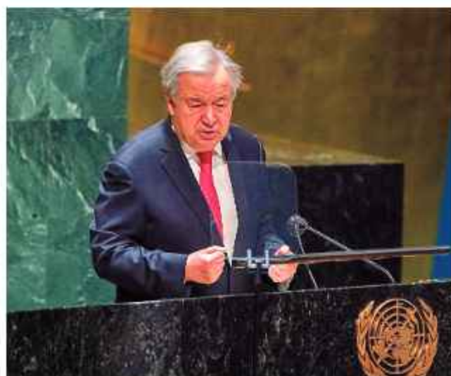
DIPLOMÁTICO. Antonio Guterres, secretario general de la ONU.

El ministro de Defensa, Pedro Sánchez, había destacado la prioridad que se le daba al caso el día anterior, lunes 2, desde Estados Unidos, donde acompañó al presidente Petro en su visita a la Casa Blanca: “El Presidente de la República dio una orden muy clara: que alias ‘Pipe Tuluá’ sea extraditado lo más rápidamente posible de Colombia a Estados Unidos”.