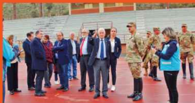
INSPECCIÓN. Medina recibe la explicación de una autoridad militar.

Será el Comité Ejecutivo de la Odebo, en su reunión de marzo, la que confirmará oficialmente si La Paz será sede de los Juegos Bolivarianos de 2029.