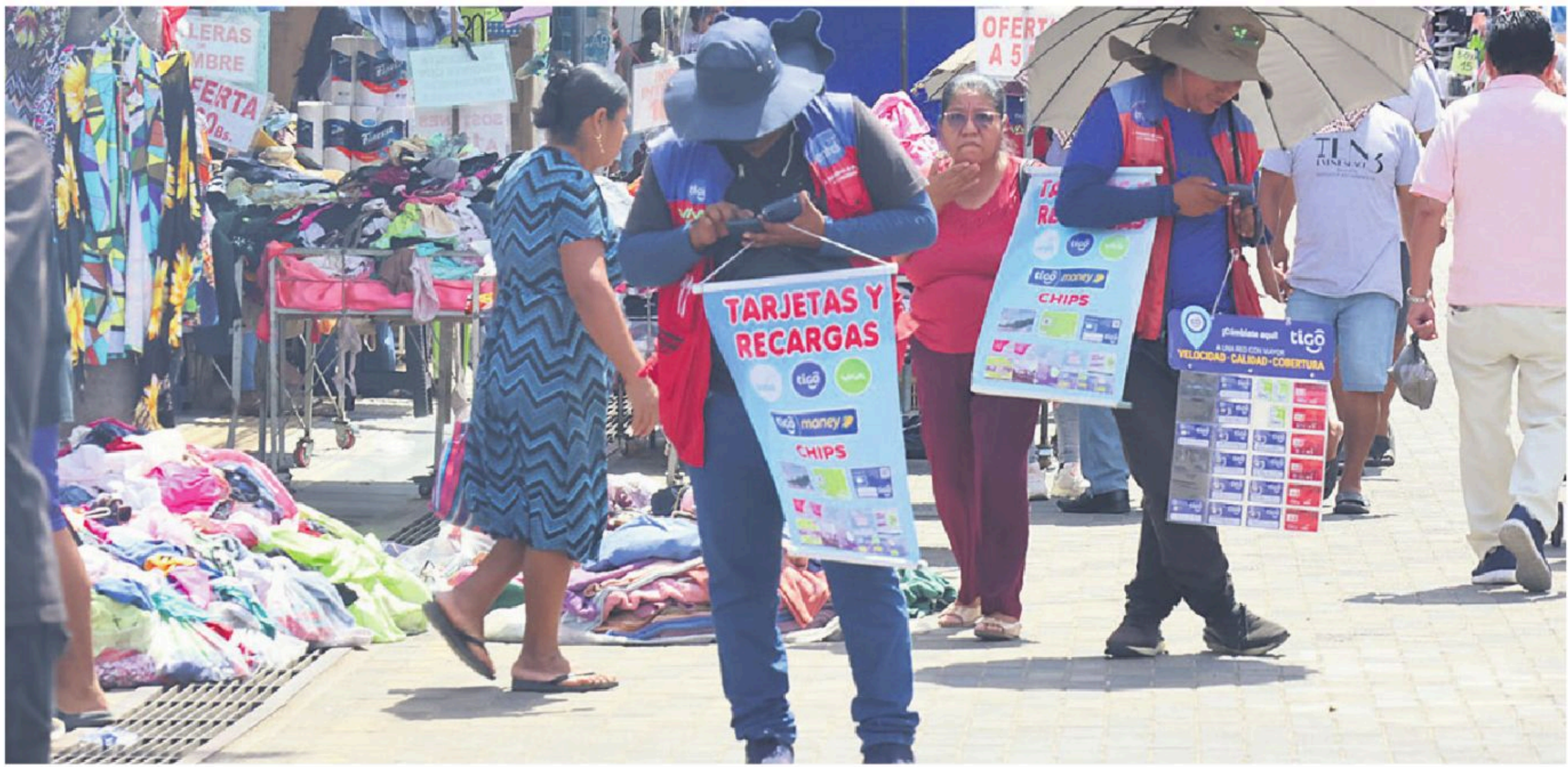
Los ambulantes toman las aceras y calles en inmediaciones del mercado Los Pozos

pación de las aceras y calles. En algunos sectores, como los alrededores de Los Pozos, el desorden parece haberse normalizado. La calle 6 de Agosto, que antes permitía un tránsito fluido, ahora es un corredor de ambulantes. Puestos de ropa, calzados y artículos de limpieza ocupan la calzada, algunos con estructuras precarias