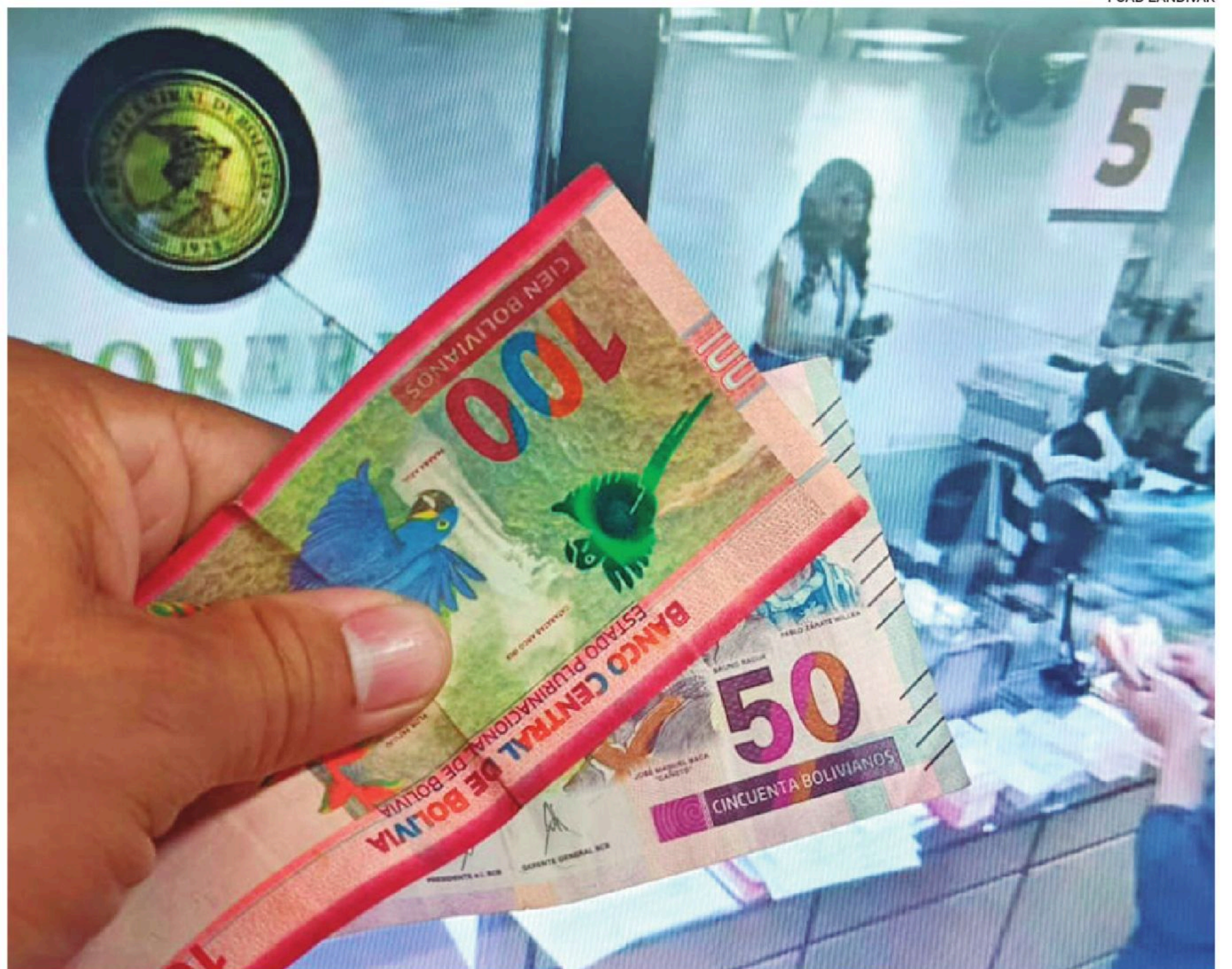
El incentivo se entregará en tres pagos de Bs 150 y alcanzará a hogares identificados por el gobierno

El documento oficial aclara que “Si por ejemplo eres madre gestante (Bono Juana Azurduy) y tienes hijos en edad escolar (Bono Juancito Pinto) no puedes cobrar doble o más beneficios del programa PEPE, el sistema aplica criterios que excluyen la duplicidad del beneficio”.