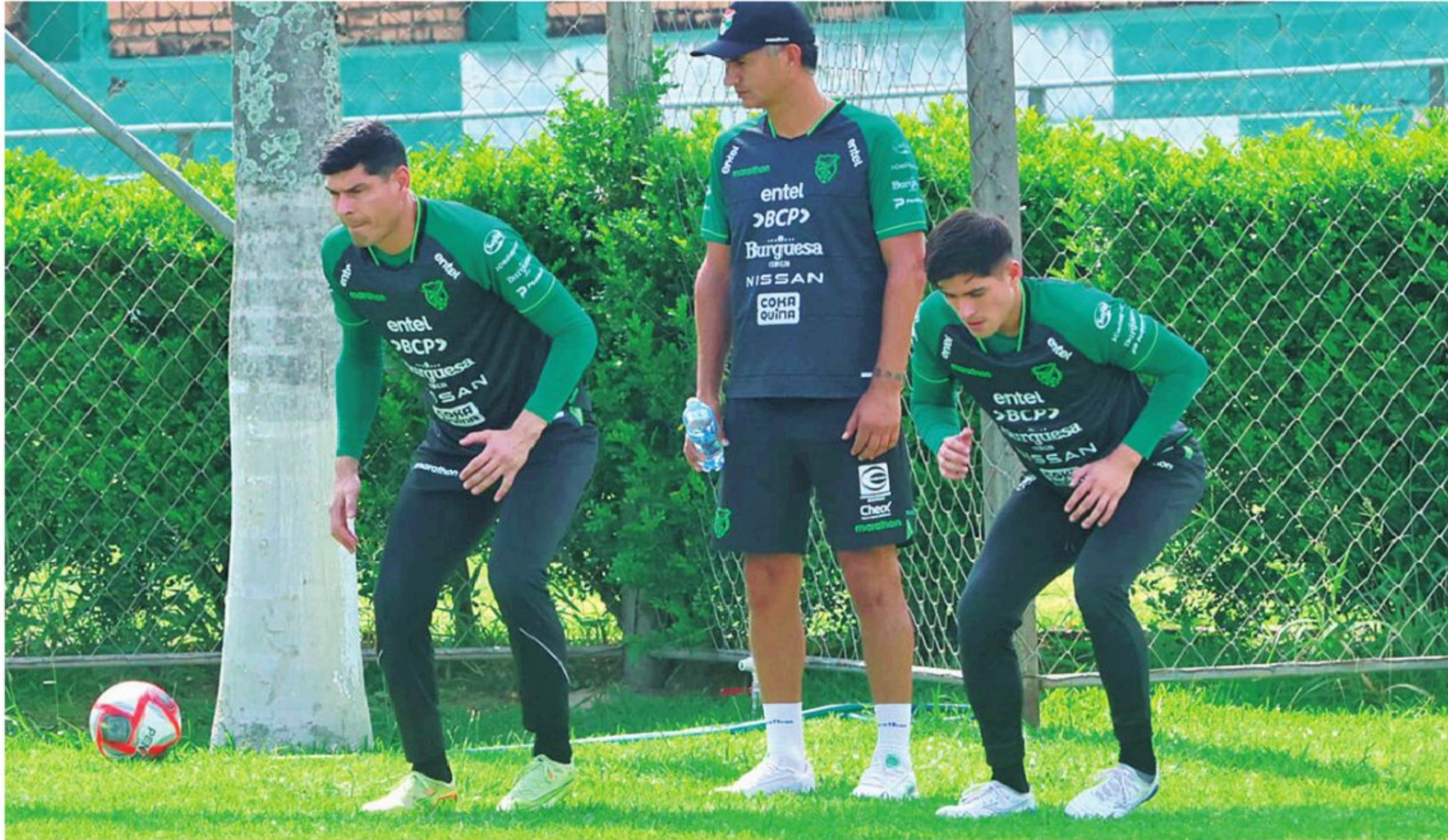
Evitar las fallas en el arco nacional es fundamental para que se puedan conseguir buenos resultados