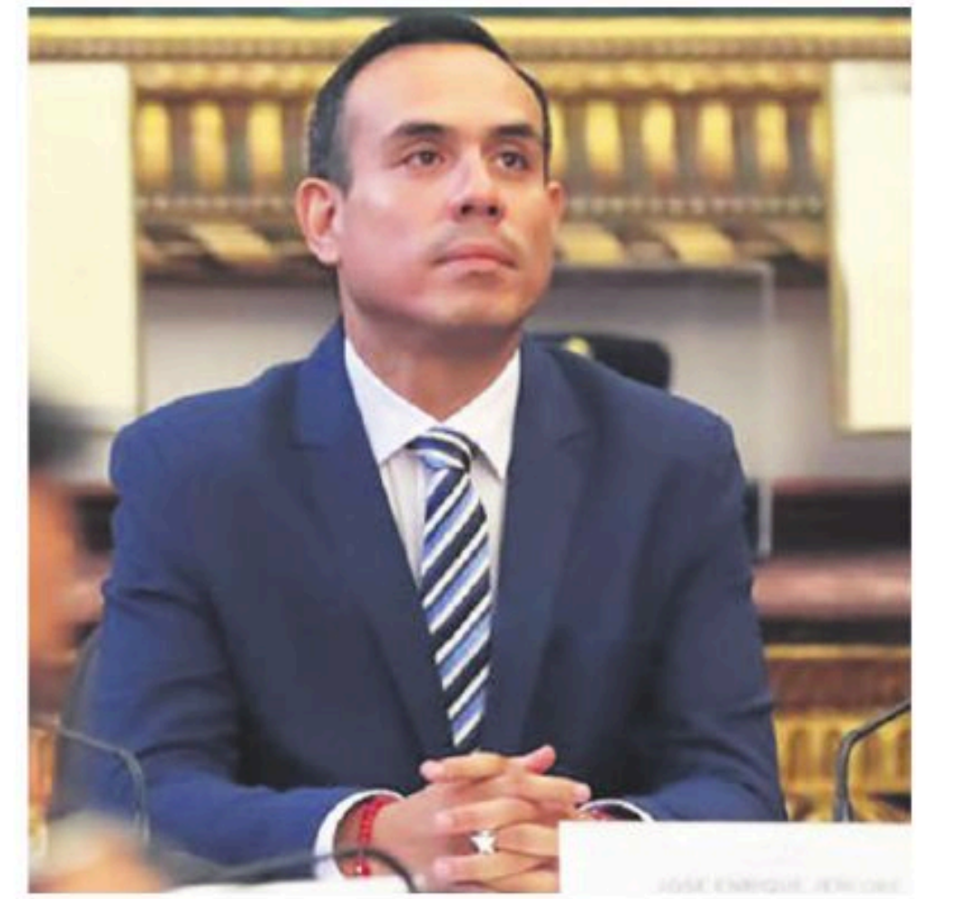
Jerí, presidente de Perú

Trump señaló que los aliados de la OTAN participarán en la construcción de la denominada Cúpula Dorada y en asuntos relacionados con los minerales de Groenlandia, un acuerdo que, según afirmó, durará “para siempre”.