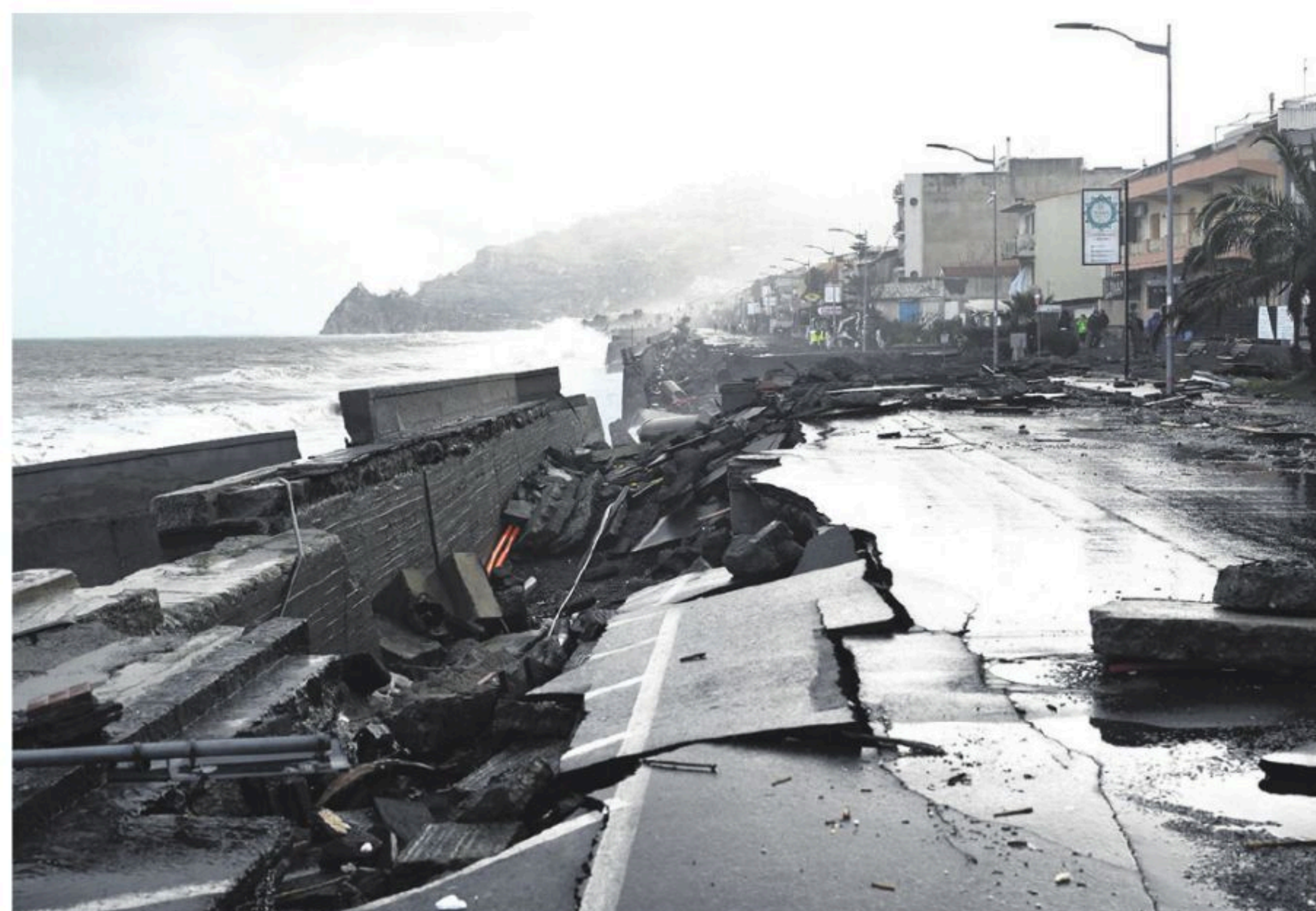
Zonas afectadas por el mal tiempo en un paseo marítimo en Sicilia

El temporal ha puesto en alerta roja la mayor parte del país y se cobró este miércoles la vida de un guardacosta en el pueblo costero de Paralio Astros, en la península del Peloponeso. En Atenas, dos estaciones del metro tuvieron que