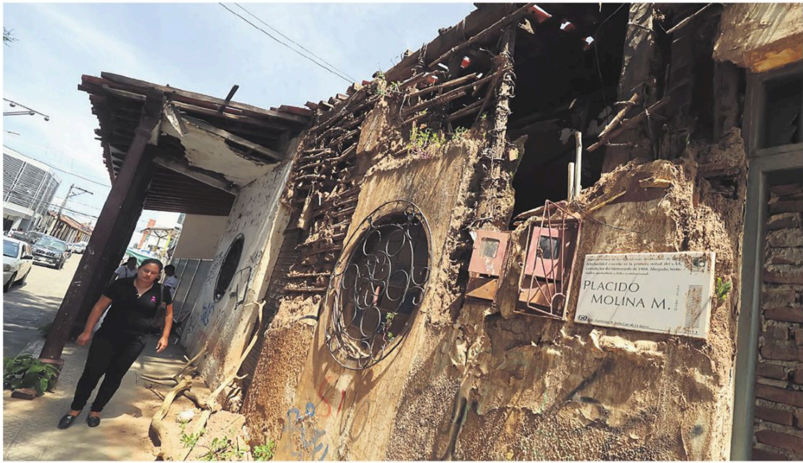
La casa que perteneció a Plácido Molina se encuentra en estas condiciones