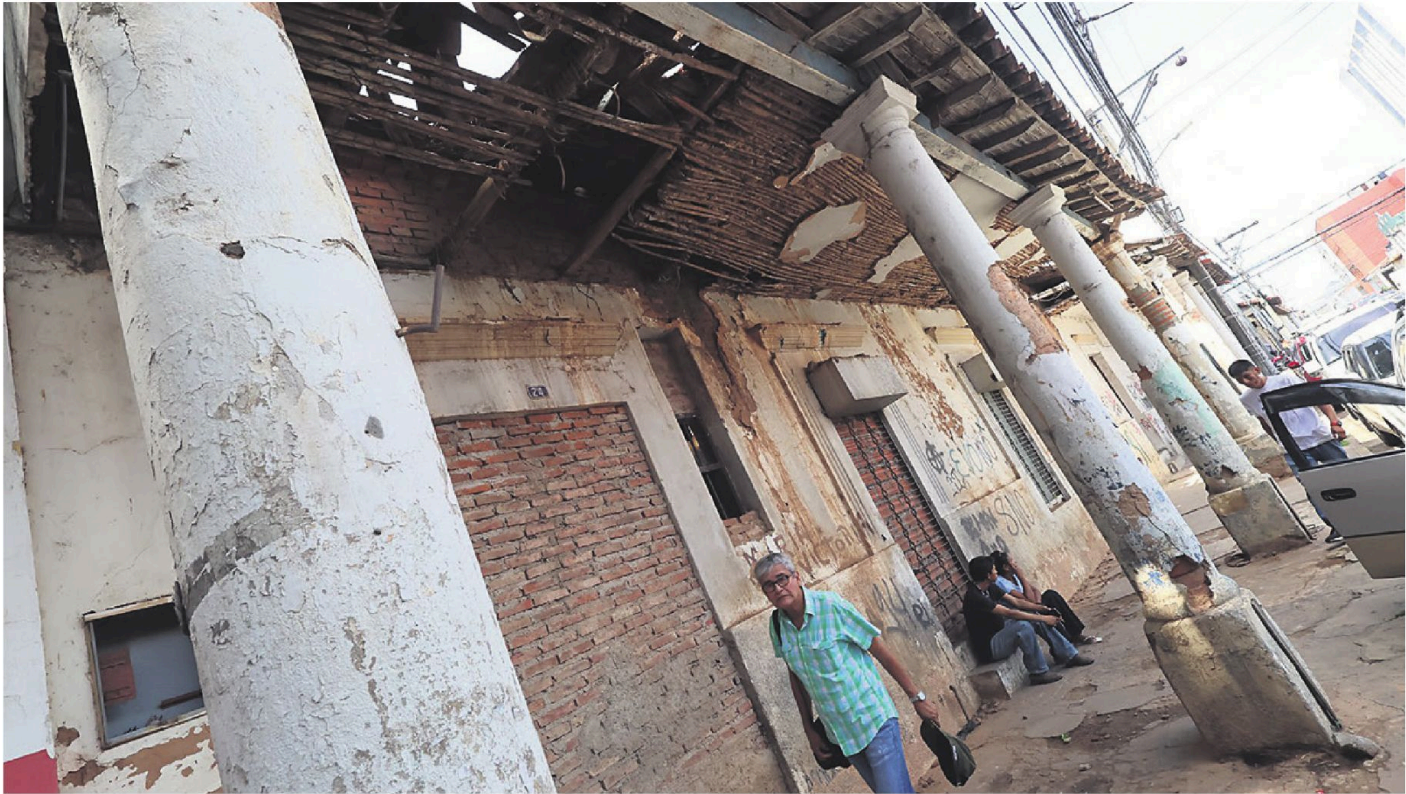
Varias casonas muestran daños en paredes y techos, como esta que se encuentra en la calle Nuflo de Chávez

Cuando se recorre el centro, los testimonios de los vecinos coinciden en que conviven a diario con la inseguridad. “Solo vemos a los policías cuando vienen a remolcar o engrapar vehículos por infracciones”, reclamó una vecina que vive por inmediaciones del mercado Los Pozos. Asegura que la zona se ha vuelto un foco de inseguridad, puesto que grupos de drogodependientes acechan a quienes hablan por celular. Los asaltos se registran principalmente al caer la tarde, cuando los negocios y oficinas cierran, los mercados se vacían y la gente se dirige a buscar transporte público. En ese momento, los malvivientes aprovechan la distracción de los pasajeros para cometer robos en cuestión de segundos. Landívar afirmó que se sienten desprotegidos frente a los constantes hechos delictivos. Lamentó la falta de patrullaje y recordó que desde hace años no se implementa un plan integral de seguridad en el centro. Comercio informal La inseguridad no es el único problema. También está la ocu-