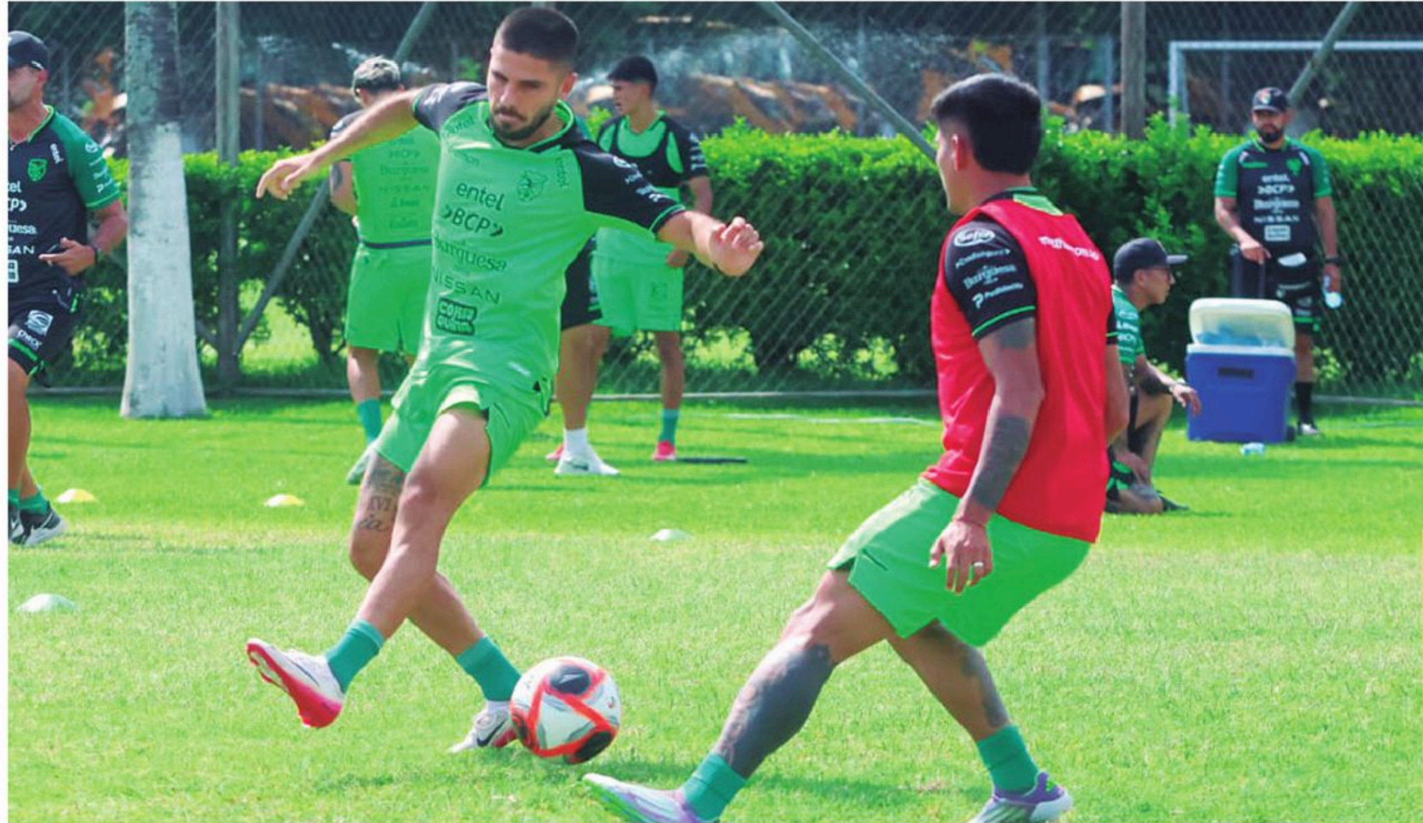
La selección pule los detalles para hacer un buen partido el domingo ante el Tri del DT Javier 'Vasco' Aguirre

Richet Gómez marcó el empate con Panamá e iría desde el inicio ante el 'Tri'