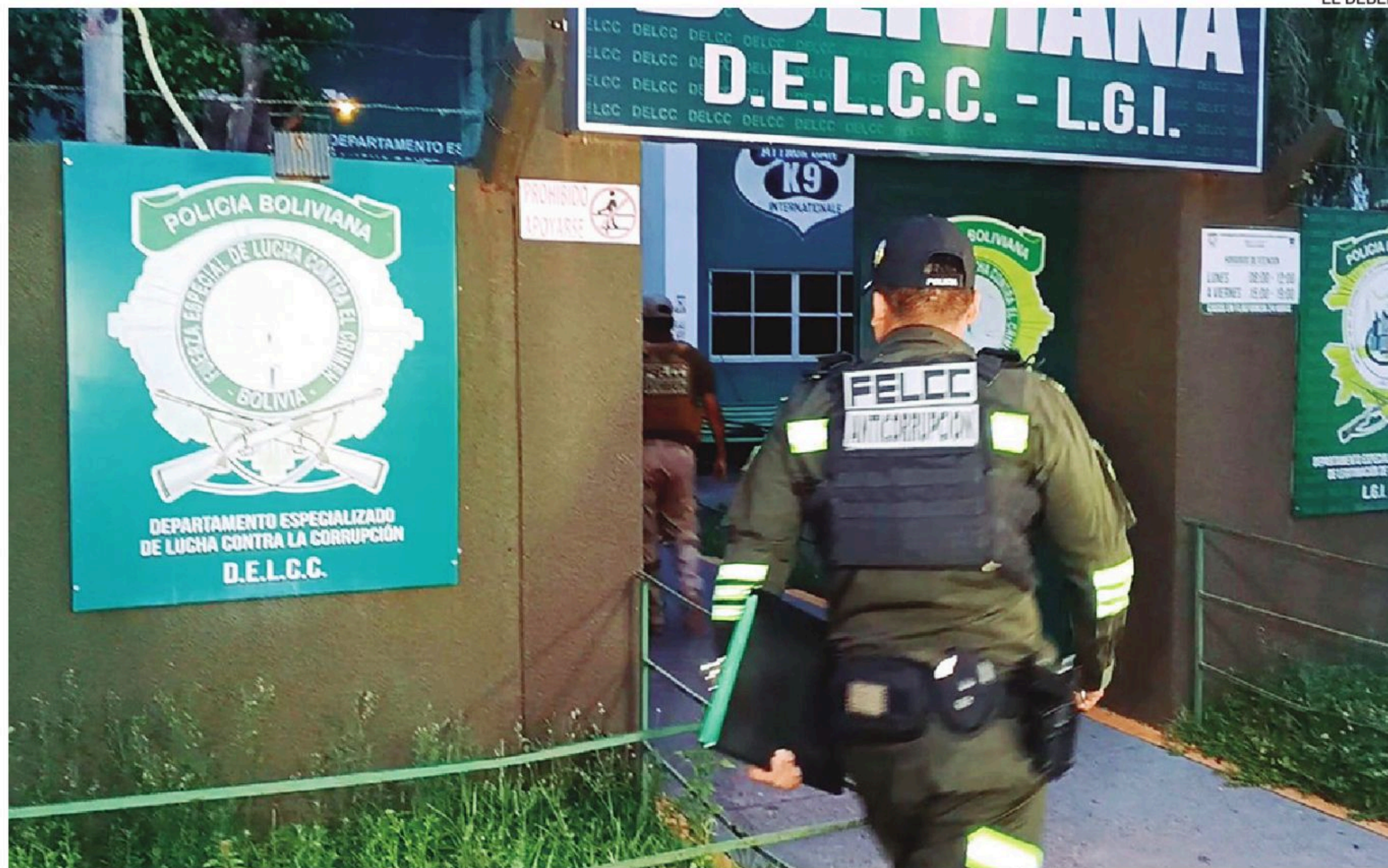
Las instalaciones del DELCC, donde estuvo aprehendido el juez de Cuatro Cañadas

En paralelo, el TSE cerró filas en defensa de sus decisiones y ratificó que los candidatos inscritos bajo la sigla de Acción Democrática Nacionalista (ADN) no podrán registrarse en otros frentes en esta elección. Mediante la Resolución Administrativa TSE-RSP-ADM N.° 020/2026, el Órgano Electoral confirmó la cancelación de la personalidad jurídica