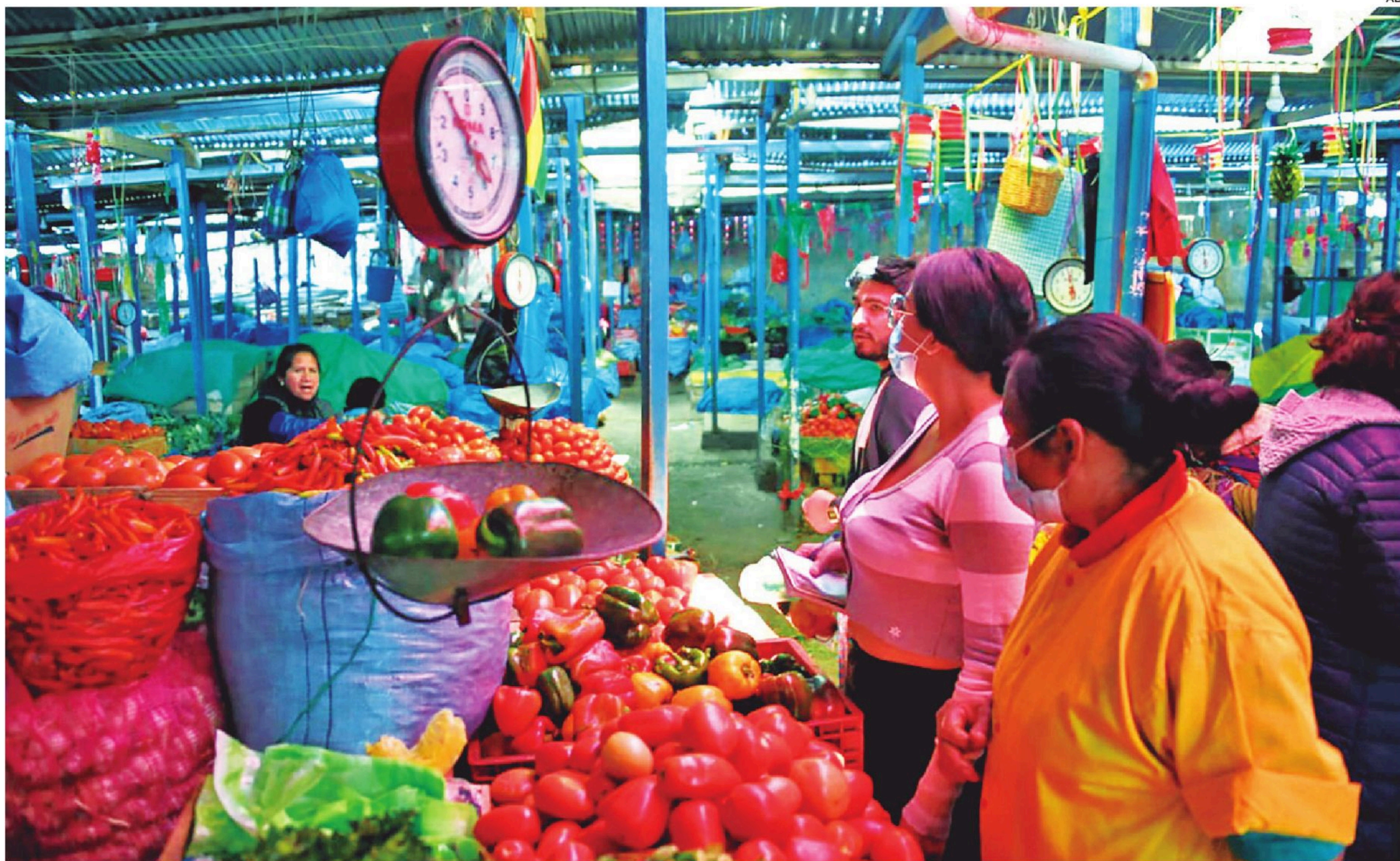
El año 2025 cerró con una inflación de 20,5% expresada principalmente en el incremento de la canasta familiar.

La eliminación del subsidio a los combustibles y la reducción del gasto salarial entre el 25% y 30% son los pilares del ajuste fiscal proyectado para 2026. Expertos señalan que se deben tomar en cuenta también otros factores internos y externos.