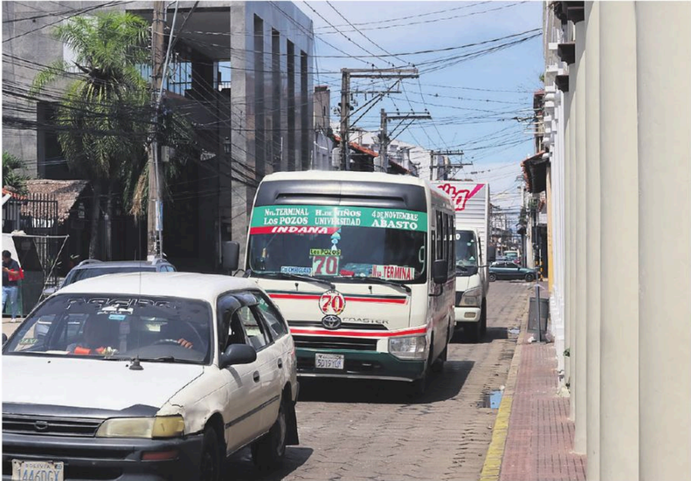
Los micros pasan a una cuadra de la plaza principal, agravando el caos

PARA SABER ESTUDIO De acuerdo con una encuesta realizada a vecinos del centro, la plaza 24 de Septiembre figura como el principal espacio que debe ser preservado. A esto se suma la necesidad de resguardar el atractivo histórico, comercial y recreativo del área (80%), así como la conservación de los edificios patrimoniales (70%). También demandan el mejoramiento de las áreas verdes (70%), el estado de las aceras y calles (60%) y el alumbrado público (60%).