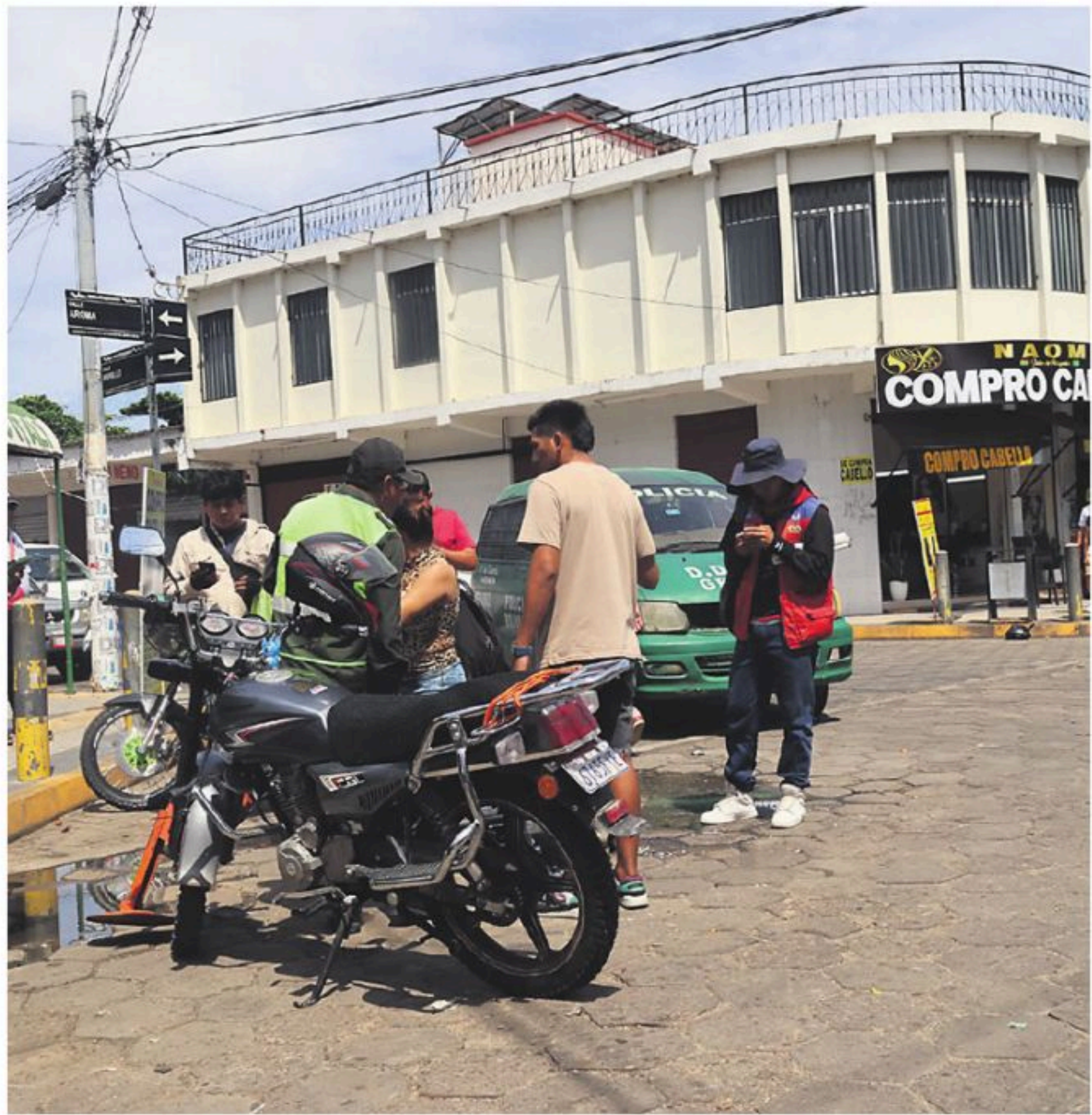
La Policía coloca grapas a las motocicletas