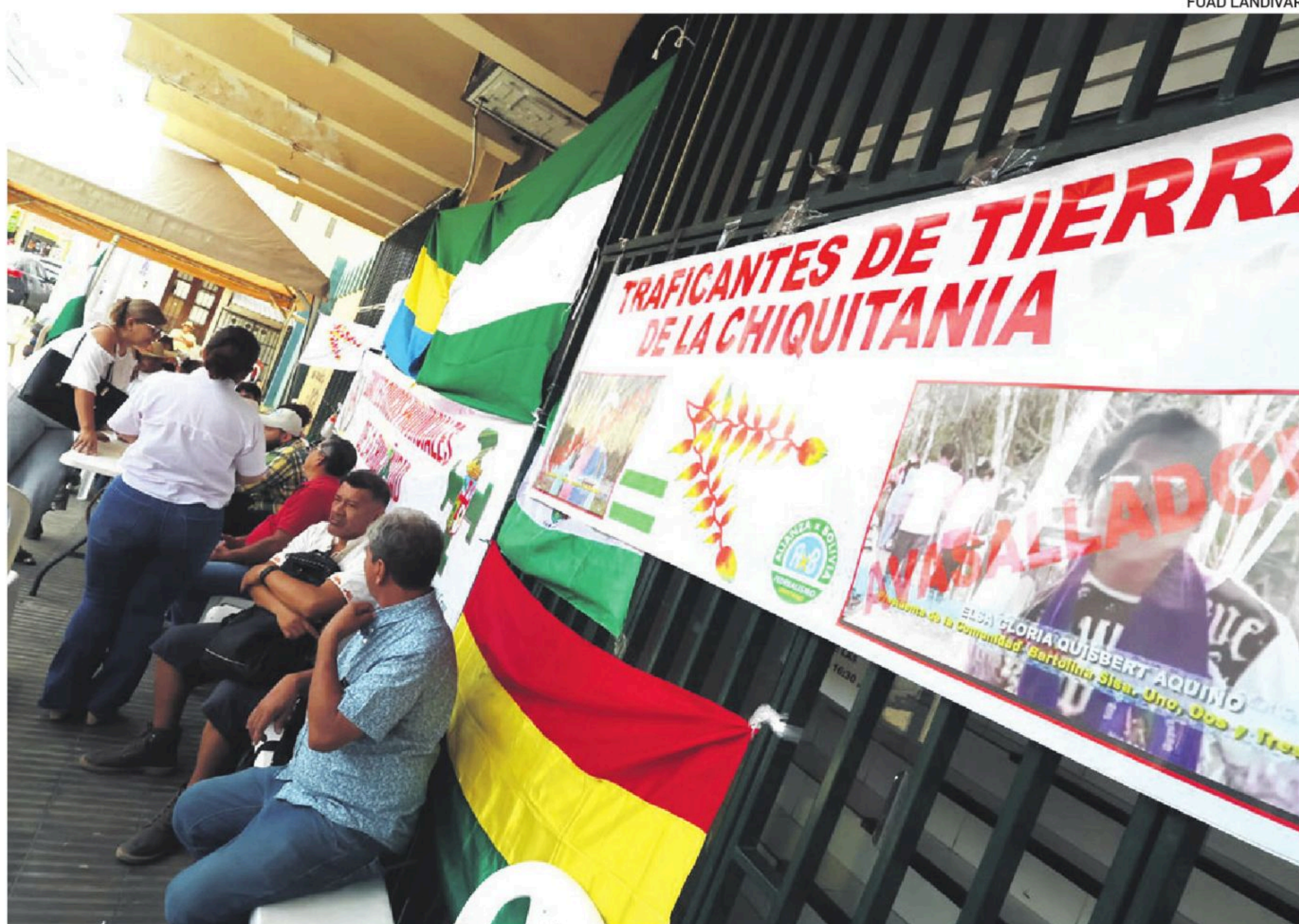
Cívicos provinciales, dirigentes de comunidades de la Chiquitanía están en vigilia en el INRA de Santa Cruz.

La Cidob y representantes de las comunidades de la Chiquitanía, y representante de los Co-