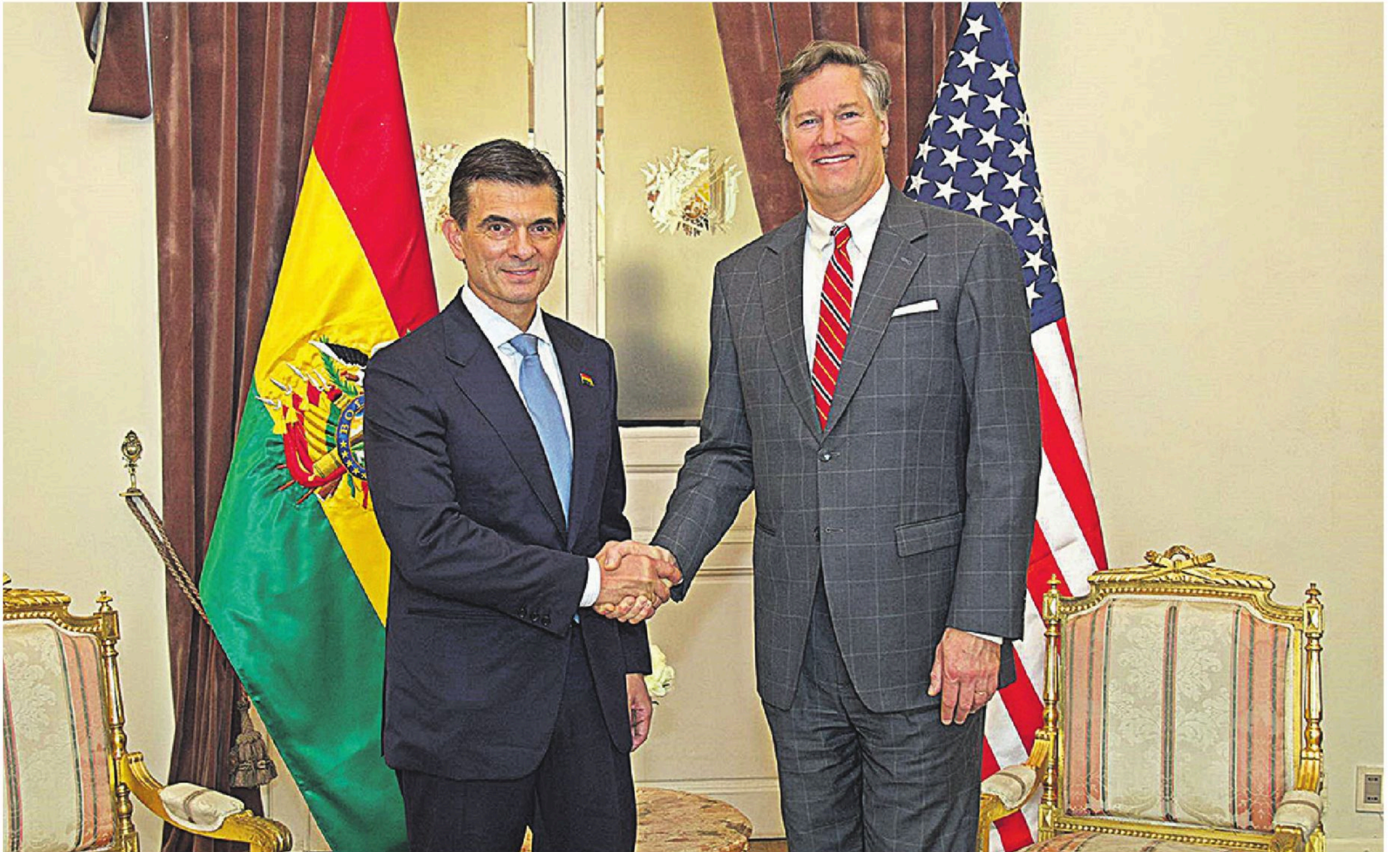
El presidente Rodrigo Paz se reunió en La Paz con el vicesecretario de Estado, Christopher Landau, en Palacio Quemado

Desde Davos, el canciller Fernando Aramayo afirmó que ambos gobiernos trabajan para reponer embajadores este año.