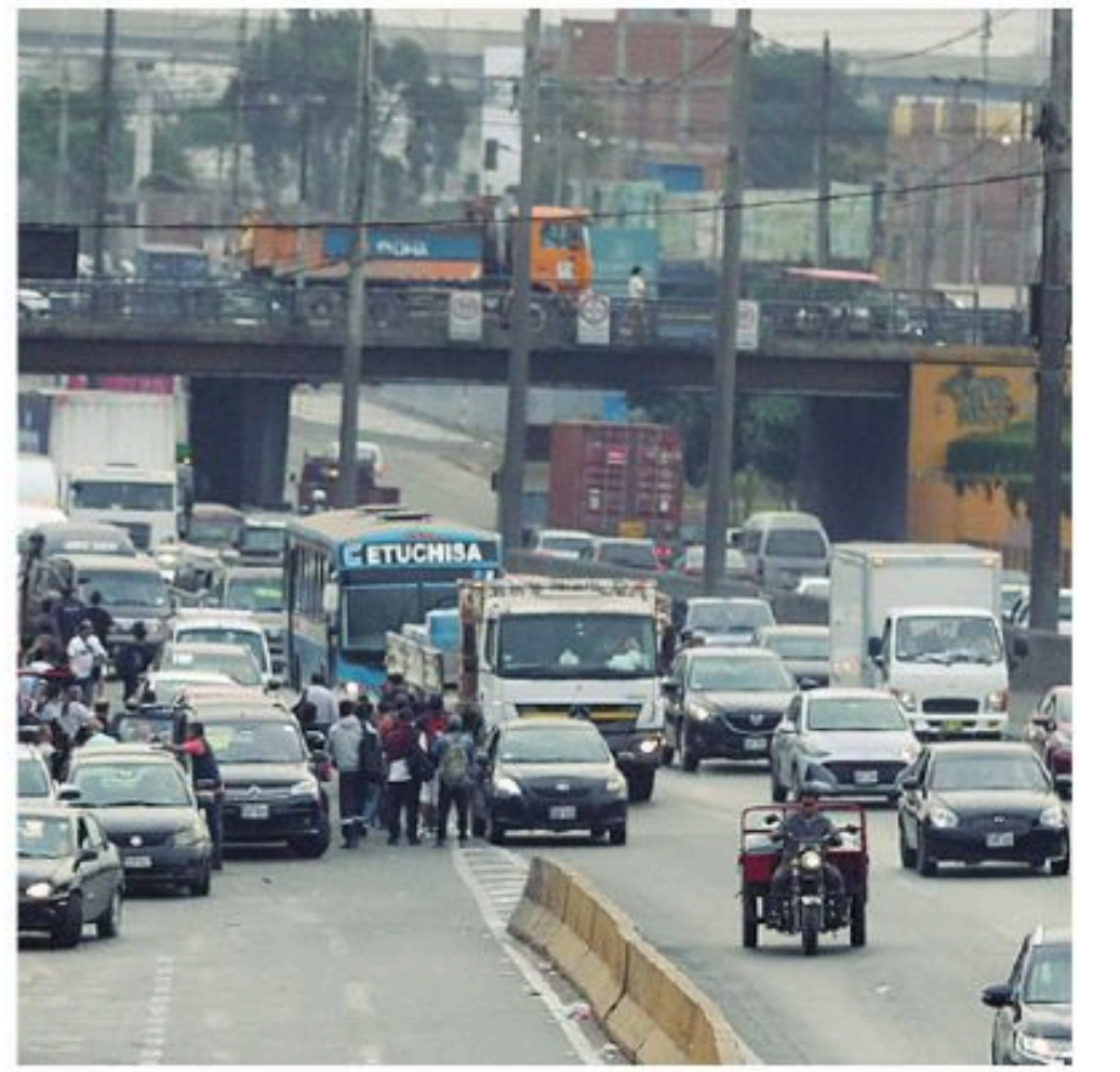
Lima consolida economía

En pasadas horas, la ONG Foro Penal, que dirige la defensa de presos políticos, y la dirigencia opositora mayoritaria confirmaron entre 100 y 130 nuevas excarcelaciones entre jueves y viernes, con lo que el número de opositores liberados superaría los 400, según datos evacuados por la propia Rodríguez.