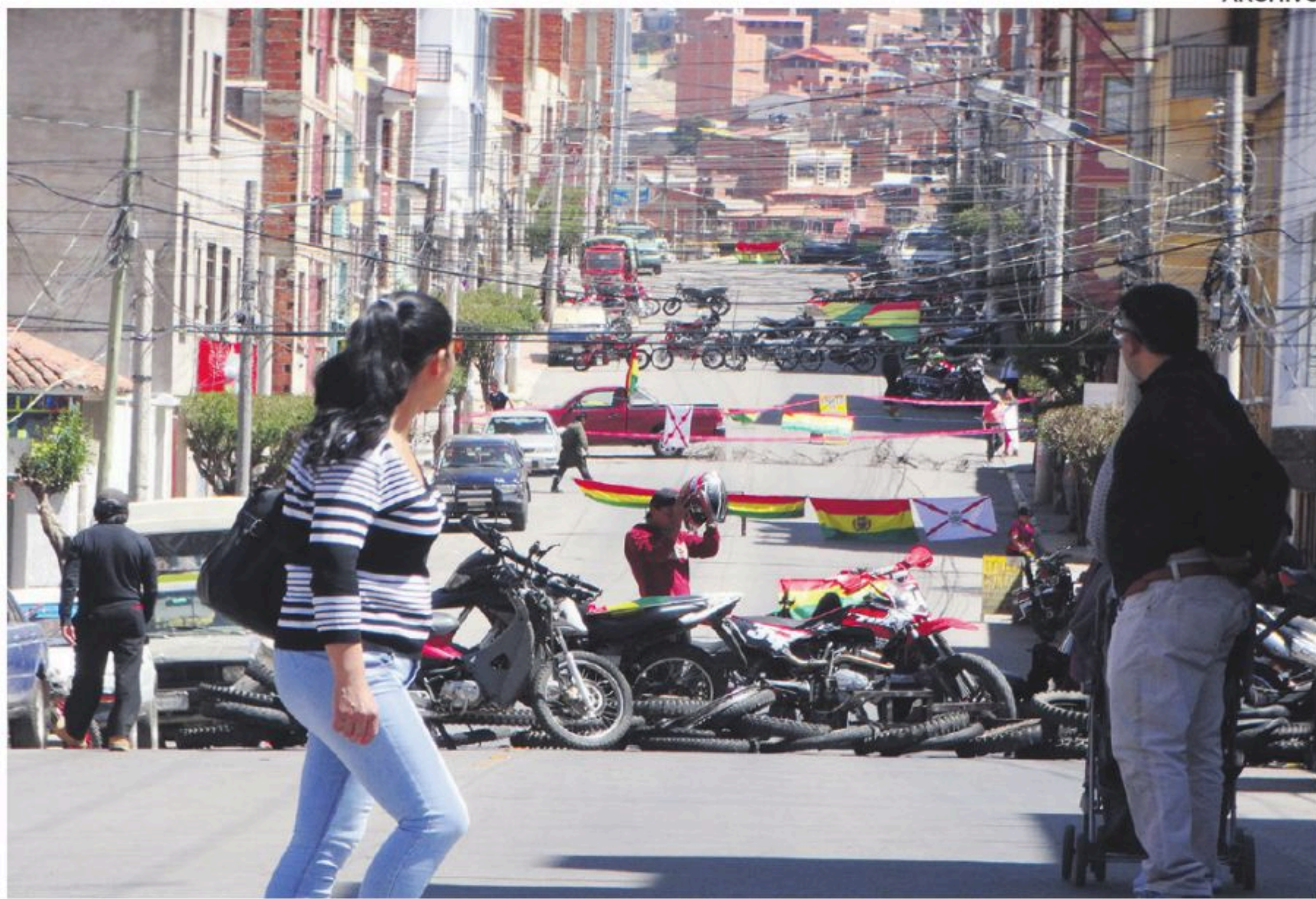
La Capital de Bolivia, Sucre, también se vio afectada por bloqueos.