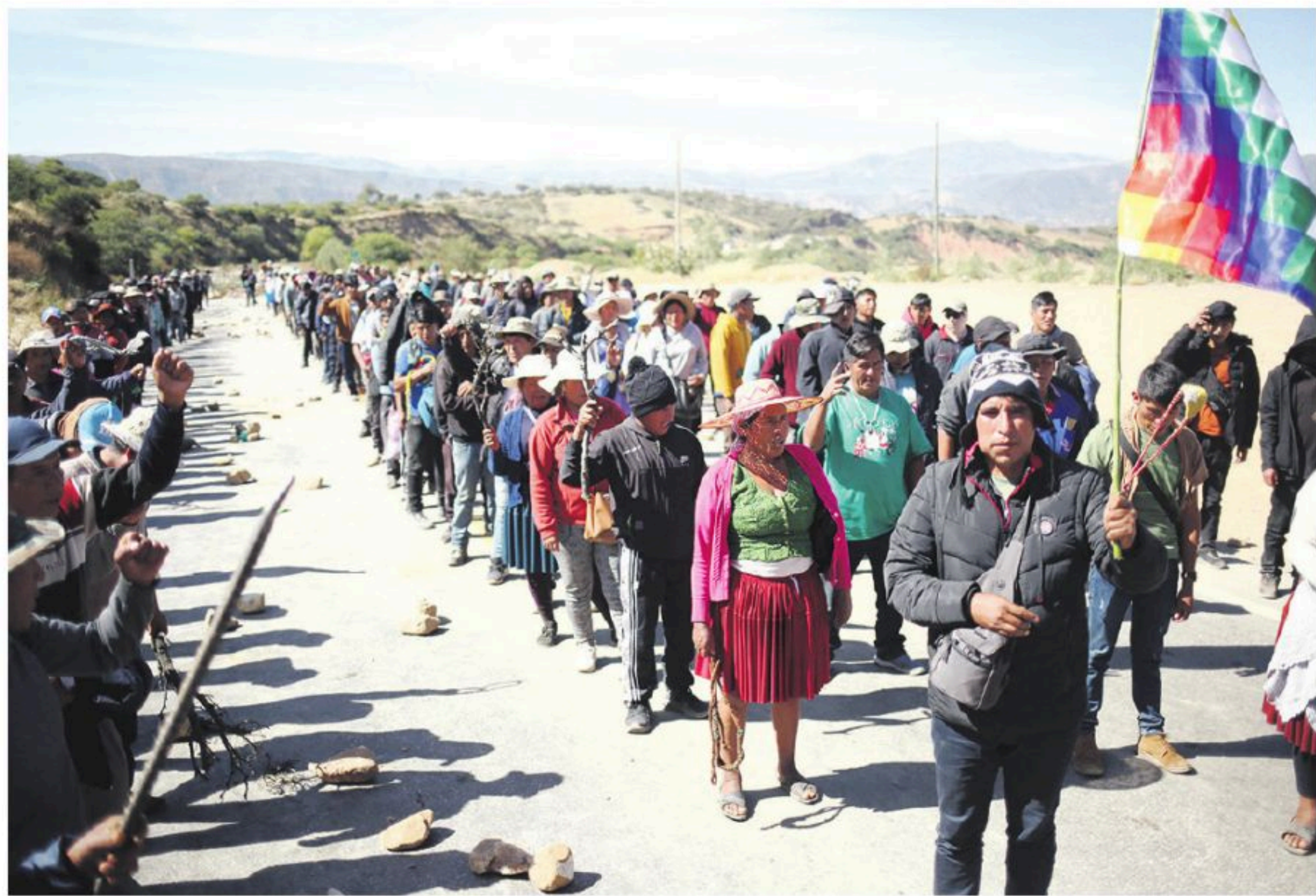
Bloqueo de campesinos en Parotani (Cochabamba). Fue en 2025.