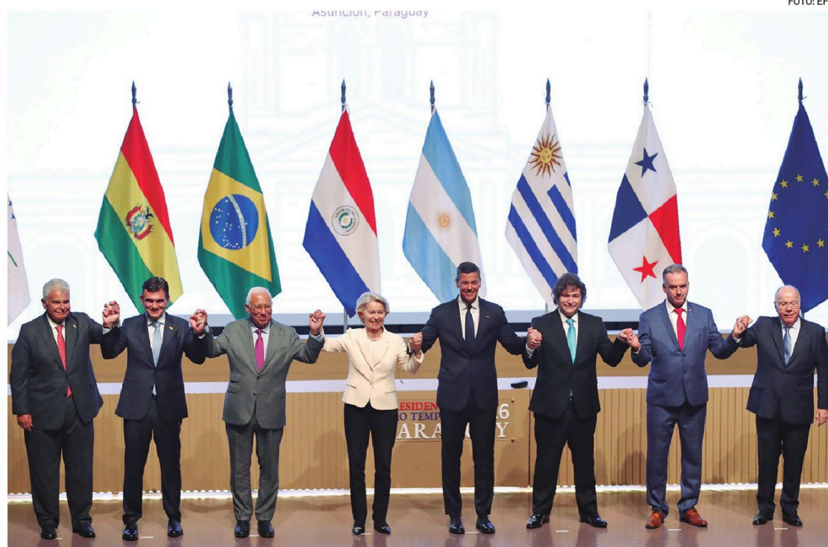
Presidentes del Mercosur y representante de la Unión Europea, en una foto para la historia

El acuerdo Mercosur-UE crea la mayor zona de libre comercio del planeta, con un mercado potencial de alrededor de 720 millones de personas y bloques que concentran cerca del 25% del PIB mundial. El pacto prevé la eliminación gradual del 90% de los aranceles al comercio de bienes entre ambos espacios, facilita el intercambio de productos industriales y agropecuarios y abre oportunidades en inversión, empleo y encadenamientos productivos. Para Sudamérica,