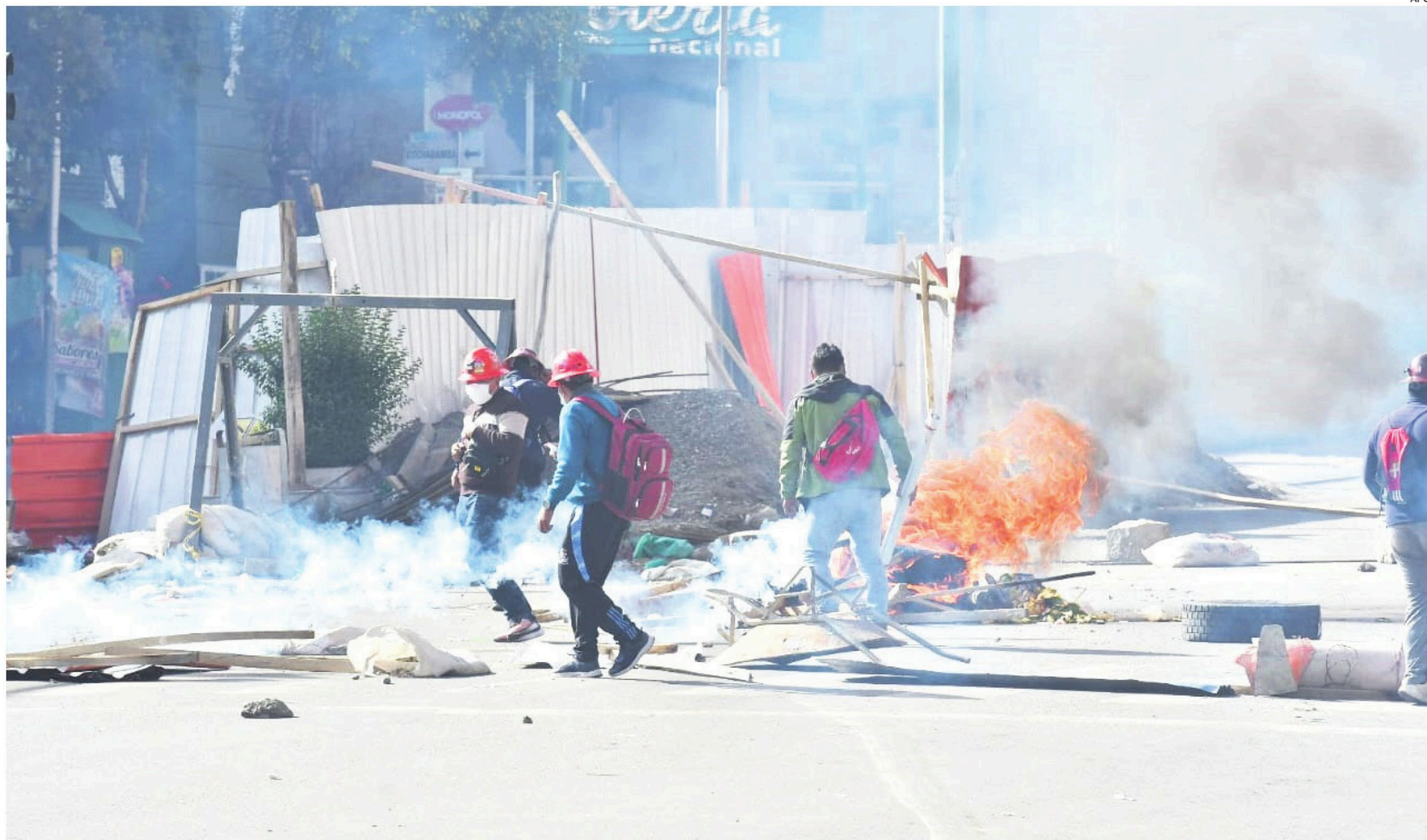
Trabajadores mineros de la COB provocan destrozos de material de construcción en pleno centro de la ciudad de La Paz. Fue en las protestas contra el decreto 5503.

LA COB EN ALERTA, RECHAZA Y LANZA UNA ADVERTENCIA