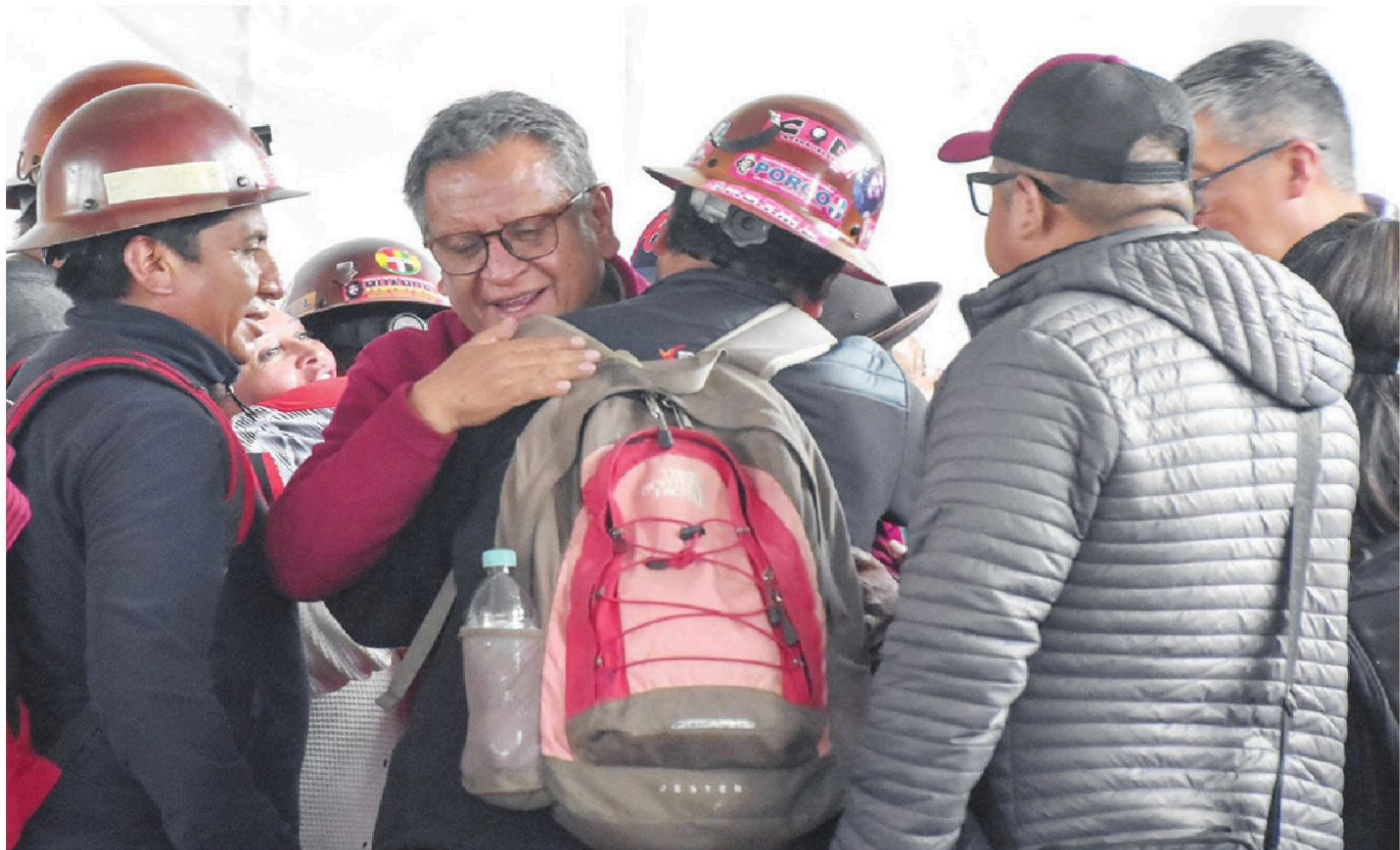
El ministro de Gobierno, Marco Oviedo y el ejecutivo de la COB, Mario Argollo, se dan un abrazo.