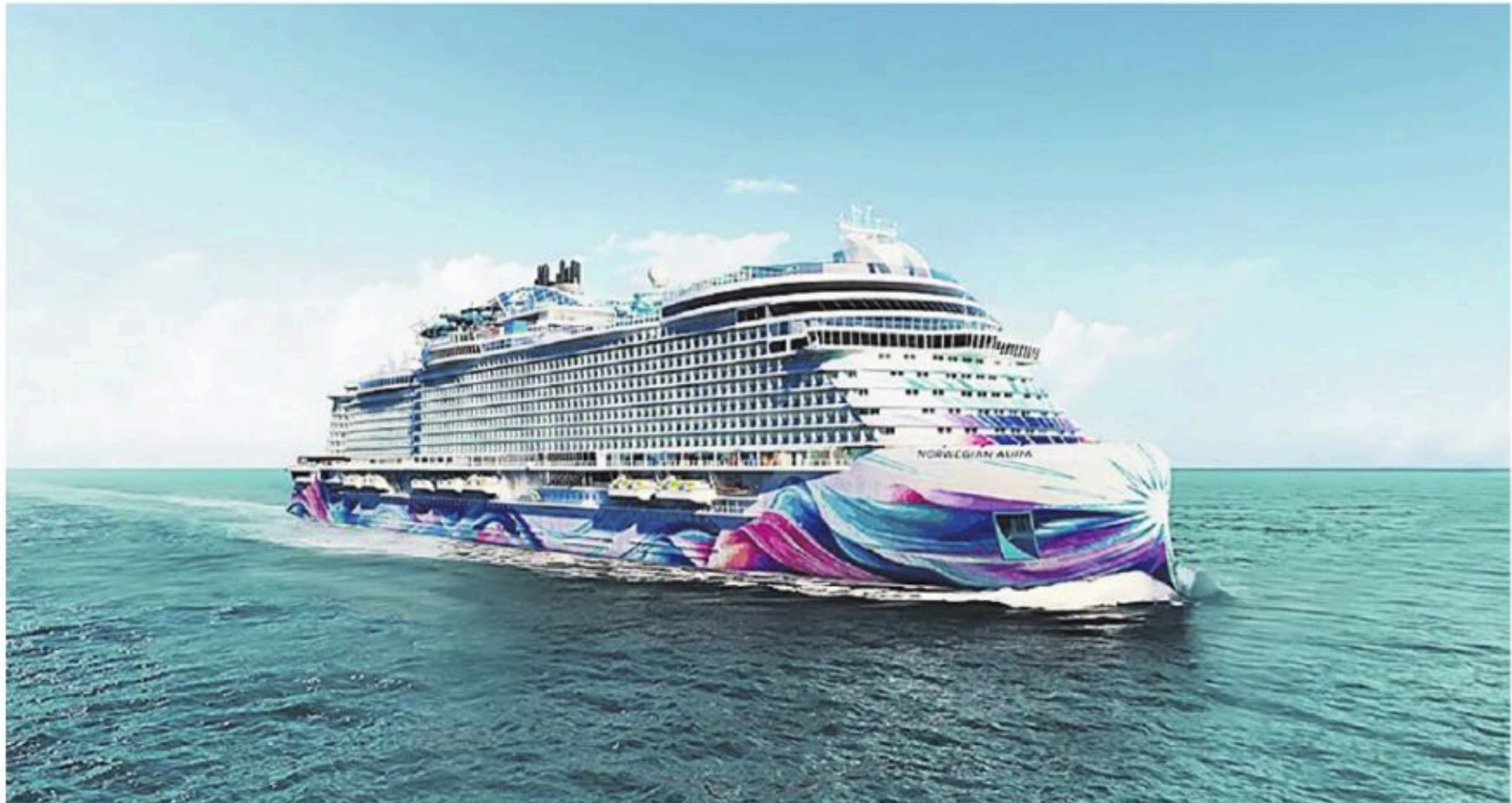
Ilustración del nuevo crucero

Con casi 345 metros de eslora y 169.000 toneladas brutas, el Norwegian Aura, actualmente en construcción en Italia, será un 10 % más grande que otros barcos de la clase Prima y estará enfocado en experiencias familiares, amplios espacios al aire libre y zonas exclusivas como Ocean Heights y The Haven by Norwegian, según el comunicado.