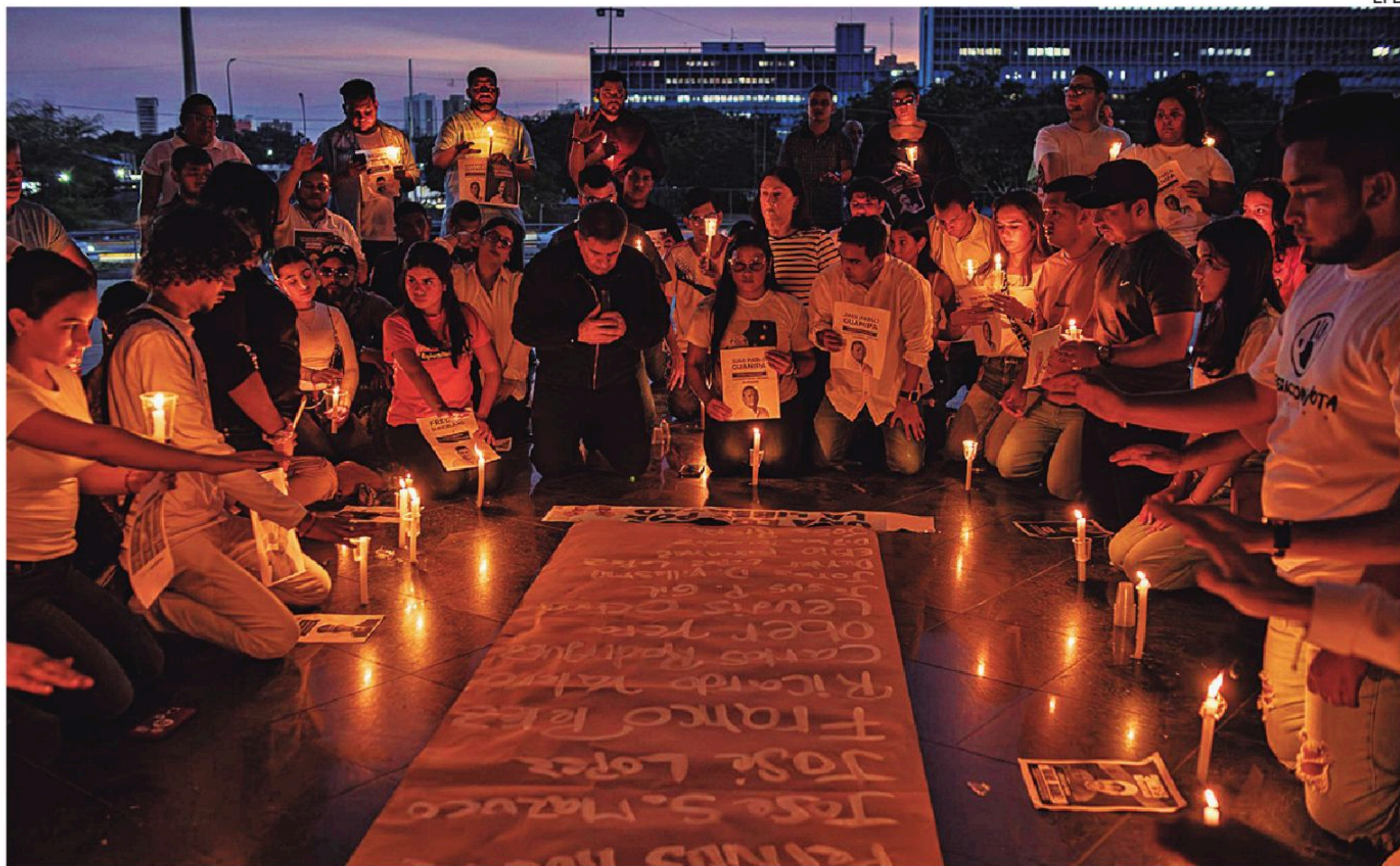
La dirigencia estudiantil de la Universidad del Zulia exigió la liberación de los presos políticos.