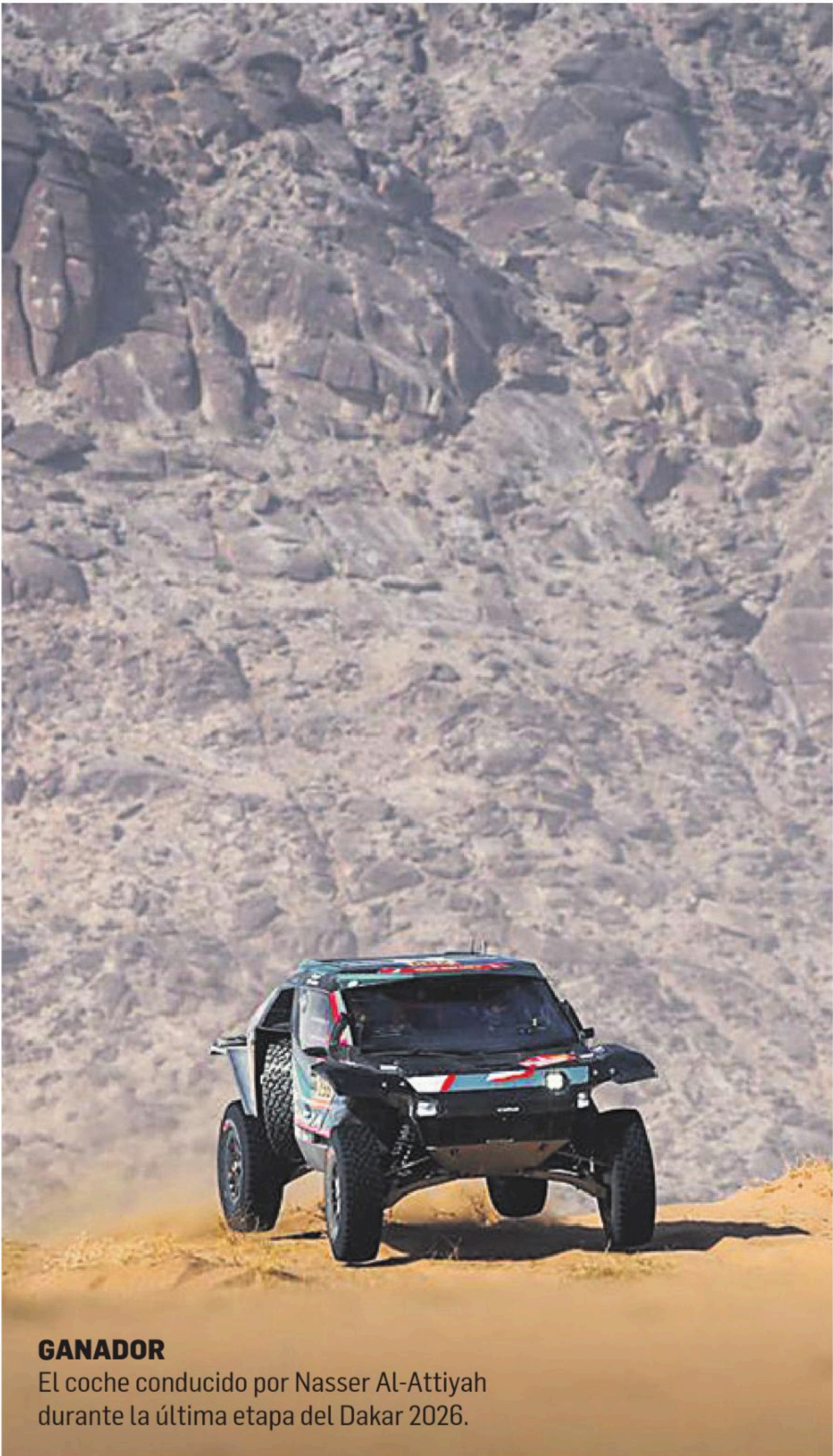
GANADOR El coche conducido por Nasser Al-Attiyah durante la última etapa del Dakar 2026.