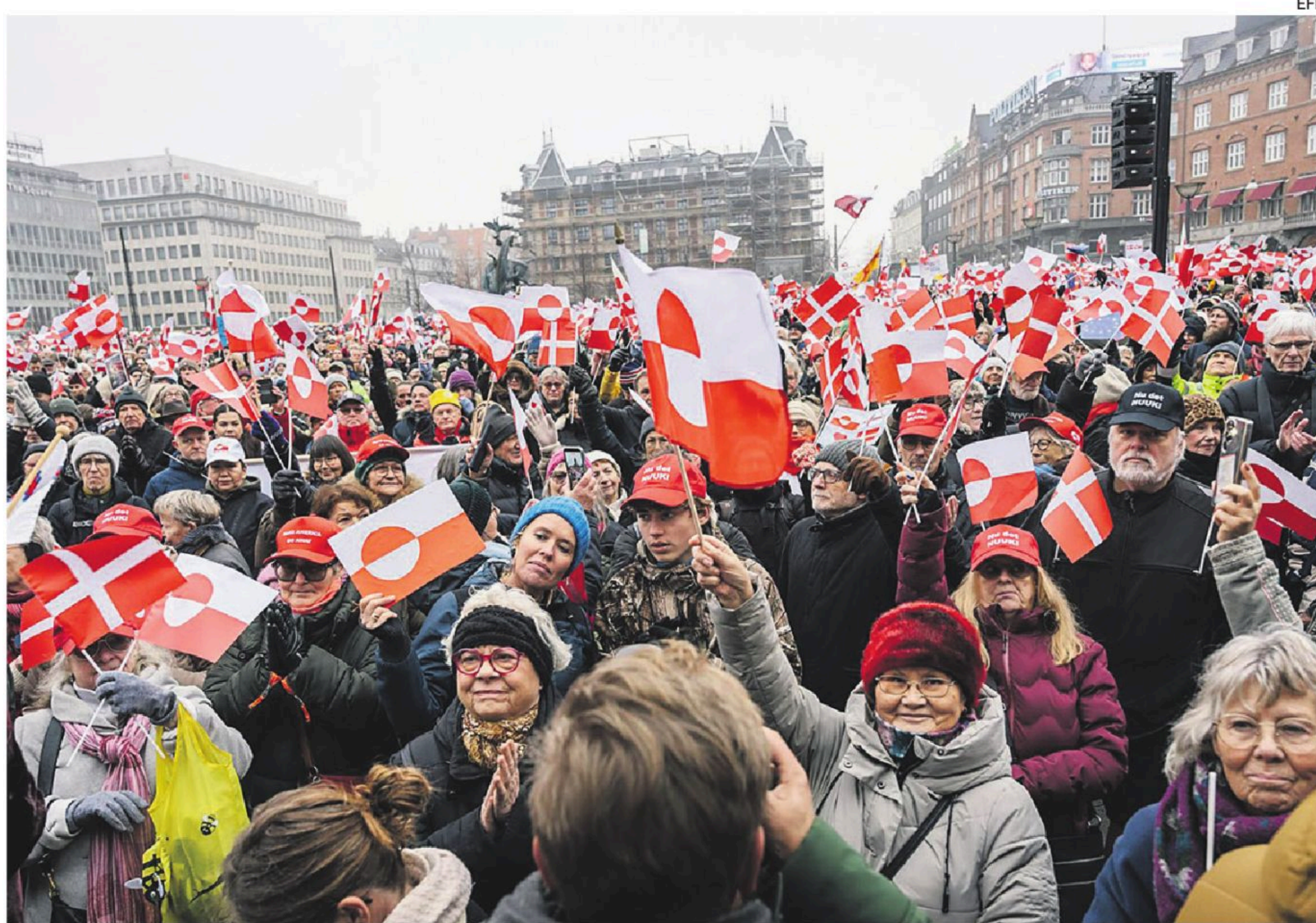
Cientos de daneses salieron a las calles a protestar por la intención de EE.UU. de anexar Groenlandia.

En respuesta, el presidente del Consejo Europeo, António Costa, afirmó desde Asunción que