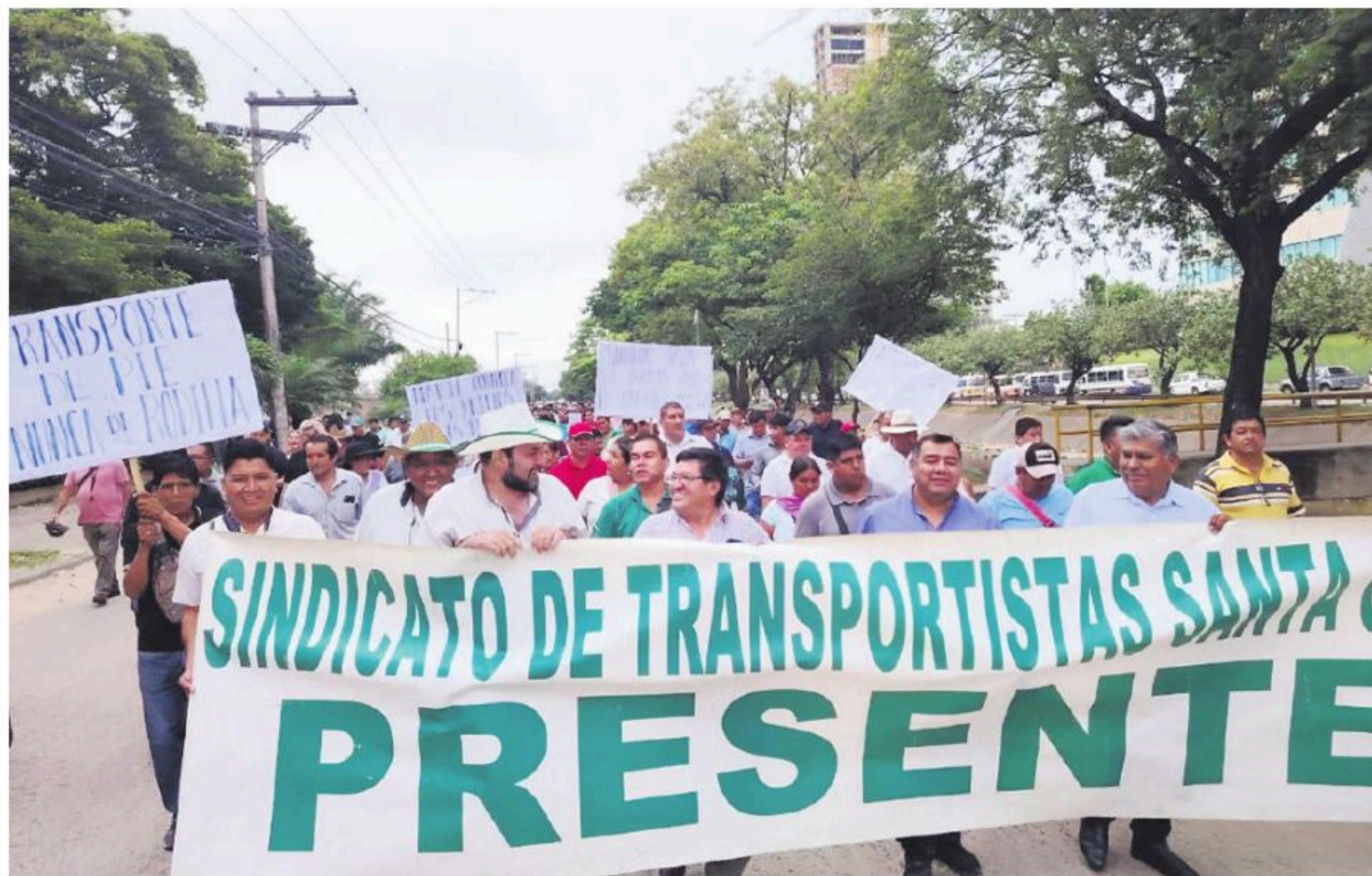
Marcha de protesta de los transportistas en Santa Cruz de la Sierra.

el artículo 213 del Código Penal para agravar las penas por atentados contra la seguridad de los medios de transporte y castigar toda forma de bloqueo”. Esta propuesta plantea castigar con cárcel de ocho a diez años a los bloqueadores.