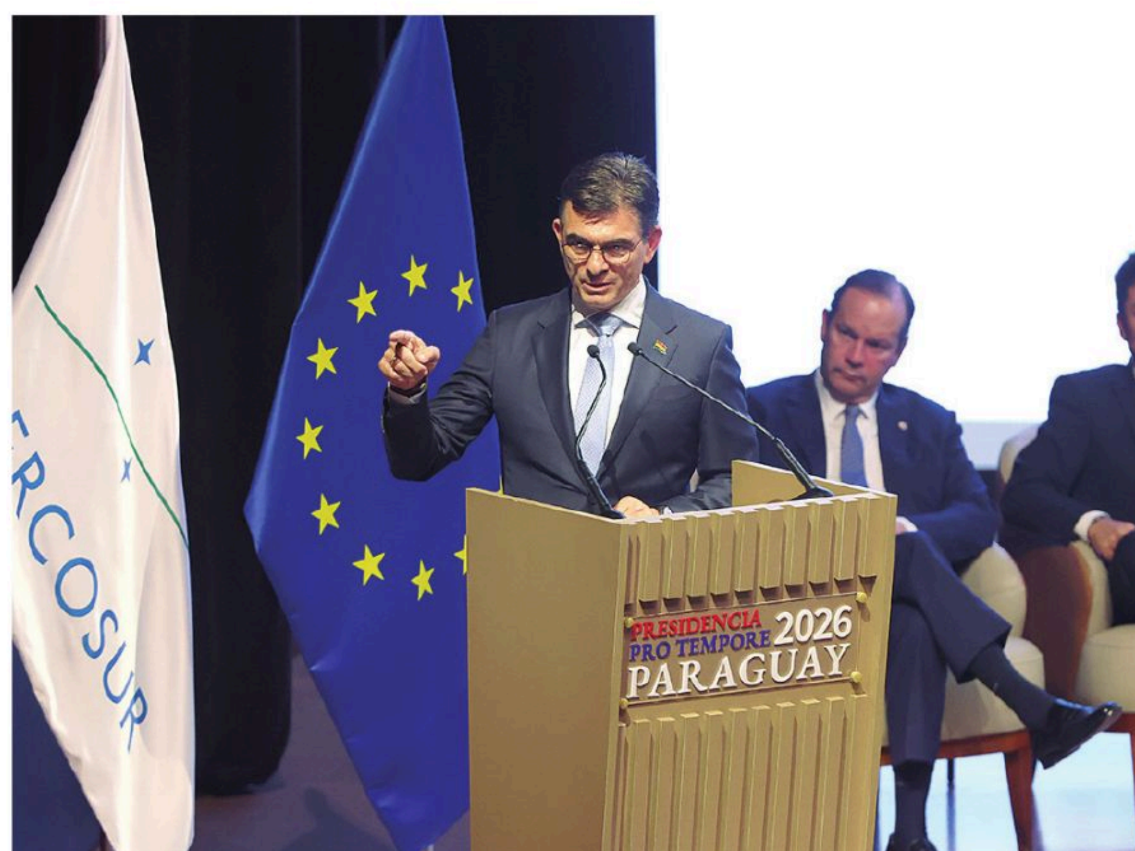
Rodrigo Paz en su primer discurso en un foro internacional

Bolivia es miembro pleno del Mercosur desde julio de 2024