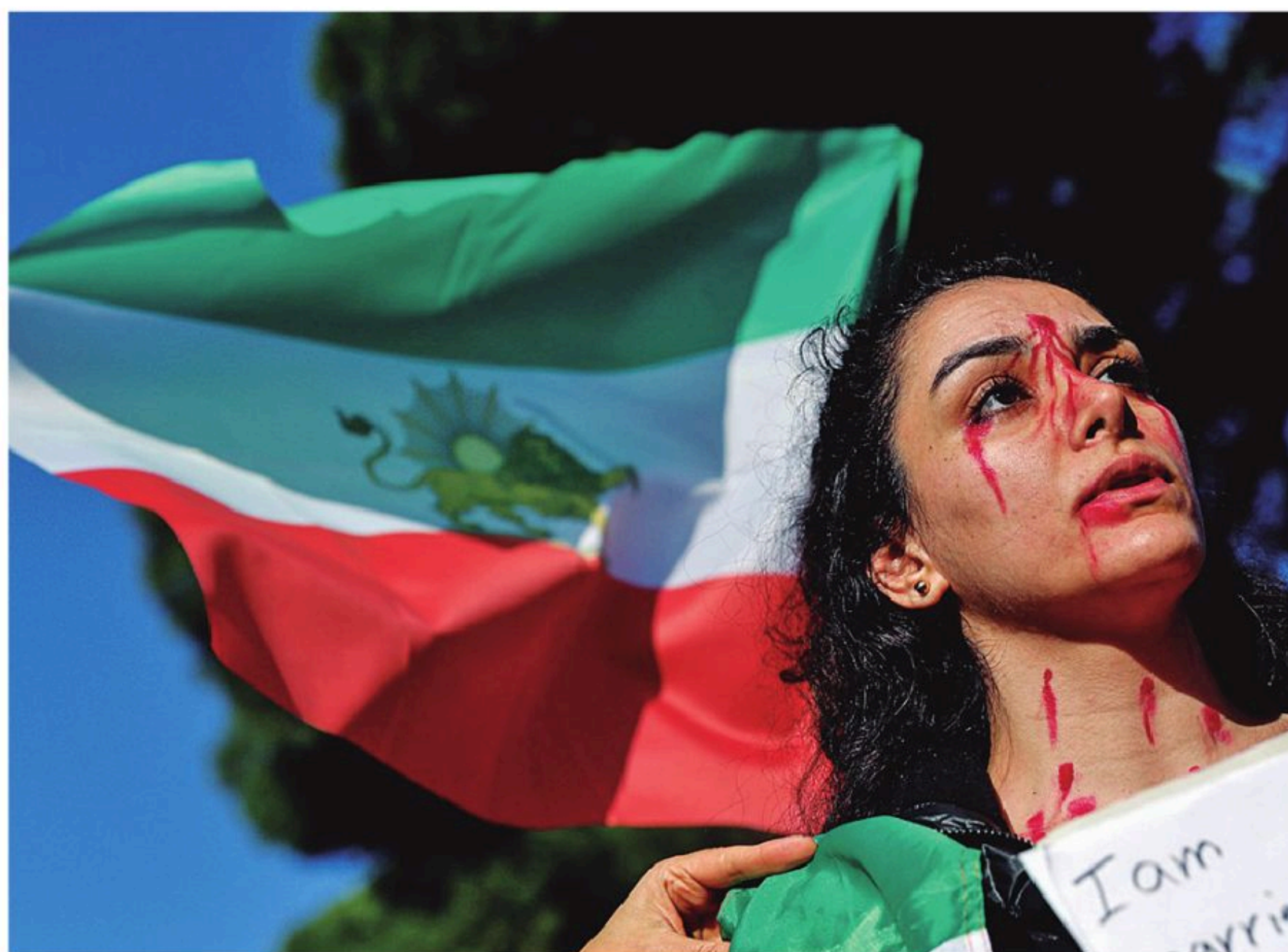
La situación en Irán está generando reacciones en todo el mundo.

Por su lado, el presidente de Estados Unidos, Donald Trump, aseguró en una entrevista que “es el momento de buscar un nuevo liderazgo en Irán”, que acabe con