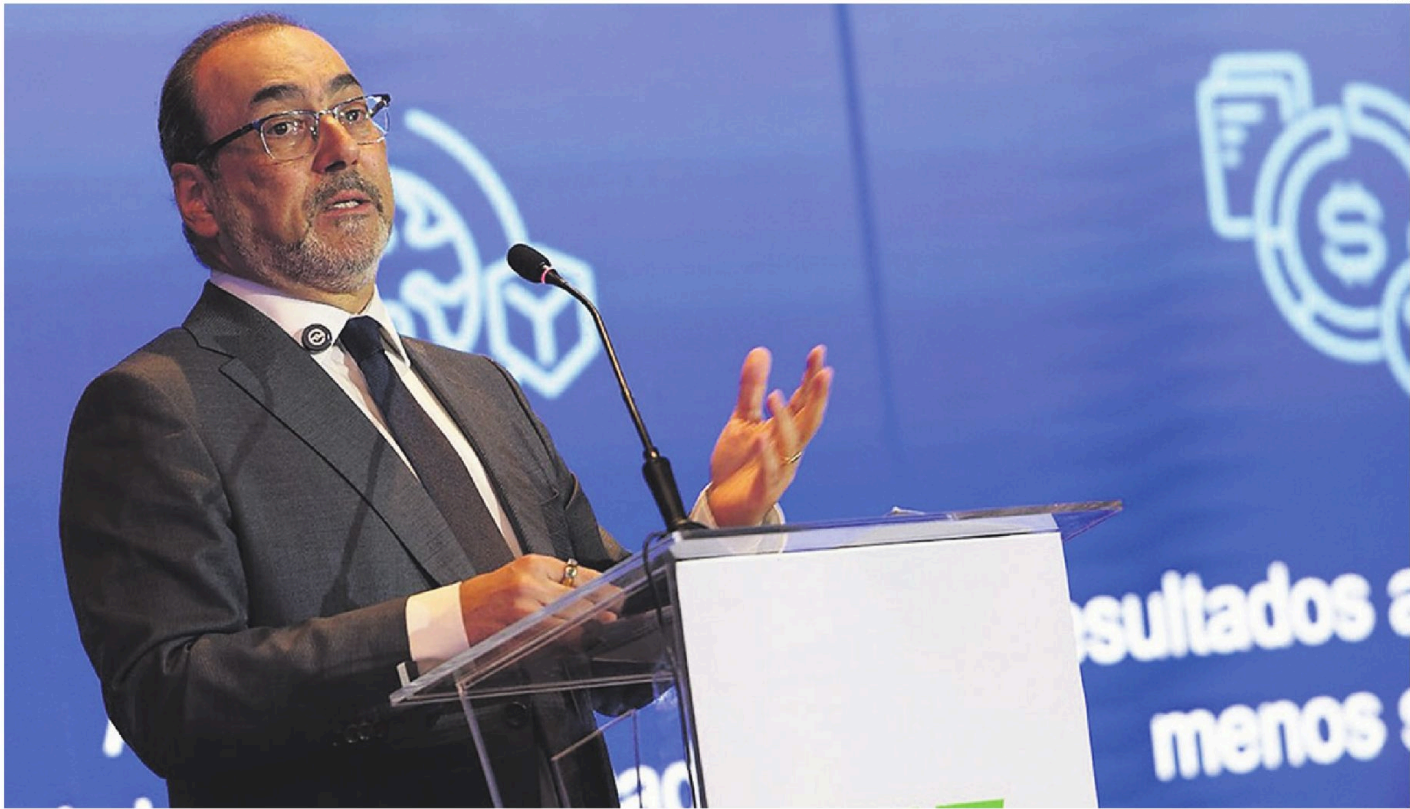
Sergio Díaz-Granados, presidente ejecutivo de CAF, presentó el evento internacional en Panamá

Será un encuentro clave para que 2.500 referentes regionales debatan crecimiento, inversión e innovación, para redefinir el rol de América Latina en el escenario global. EL DEBER participa como aliado de CAF en el desarrollo de este encuentro.