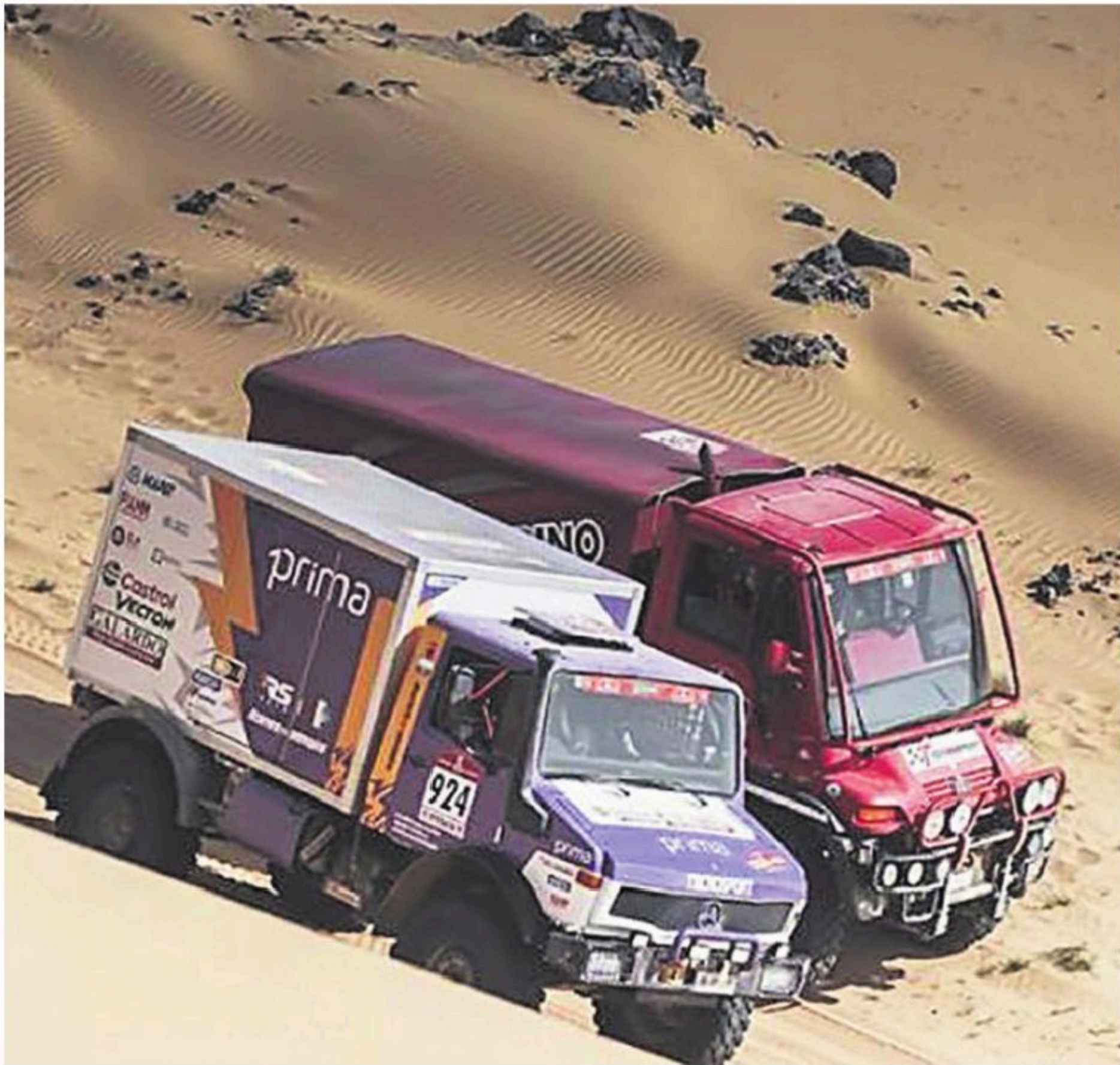
MONSTRUOS los camiones son siempre atractivos en el Dakar. Los pilotos demostraron su técnica sobre las dunas de arena.