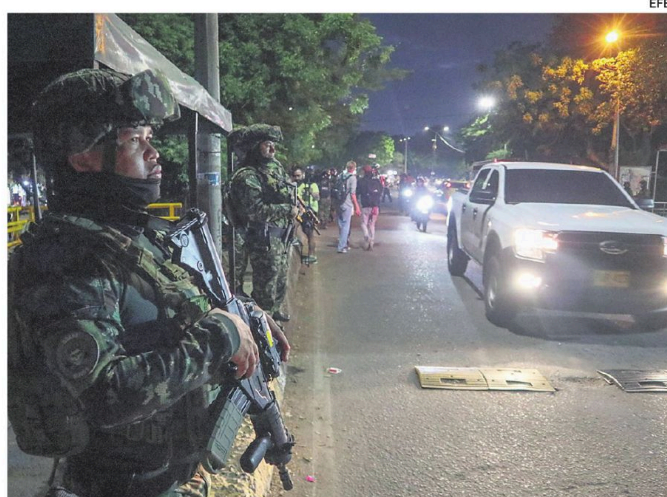
Efectivos del Ejército colombiano, en labores de control.

Los combates, al parecer, fueron motivados por disputas en torno al control territorial, las rutas de movilidad y las economías ilícitas en el sur del Guaviare.