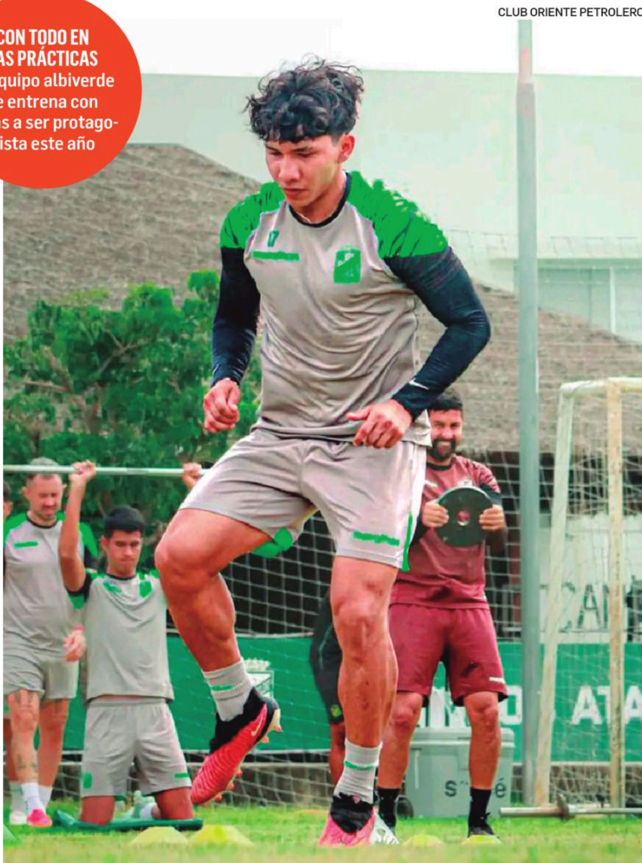
CLUB ORIENTE PETROLERO

CON TODO EN LAS PRÁCTICAS El equipo albiverde se entrena con miras a ser protagonista este año