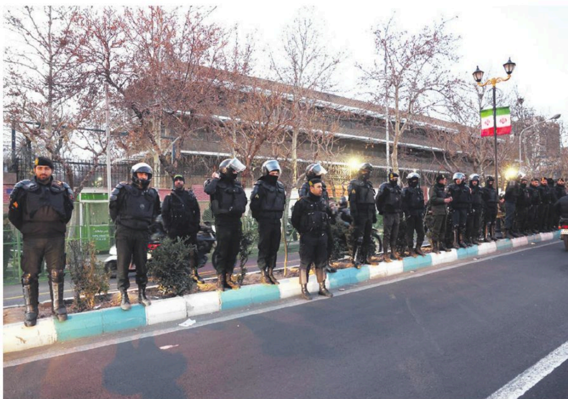
Policías iraníes resguardan la embajada del Reino Unido en Teherán

El canciller dijo que su país "ha demostrado estar dispuesto a negociar" pero que fue "EE.UU. quien abandonó la diplomacia y optó por