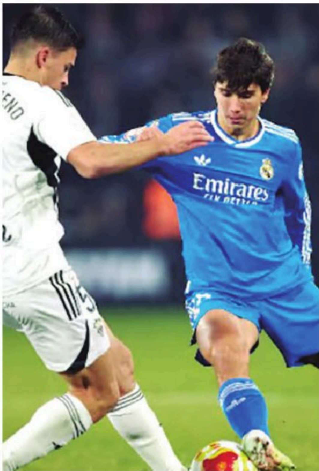
El Real Madrid quedó eliminado de la Copa del Rey tras caer con el Albacete

El partido se presentaba como la oportunidad de reseteo para el Real Madrid. El conjunto blanco, sumergido en una crisis enorme a nivel interno después de la destitución de Xabi Alonso tras perder la final de la Supercopa de España contra el FC Barcelona, tenía en Albacete la vía para olvidar las tristezas, pero acabó fuera de la Copa.