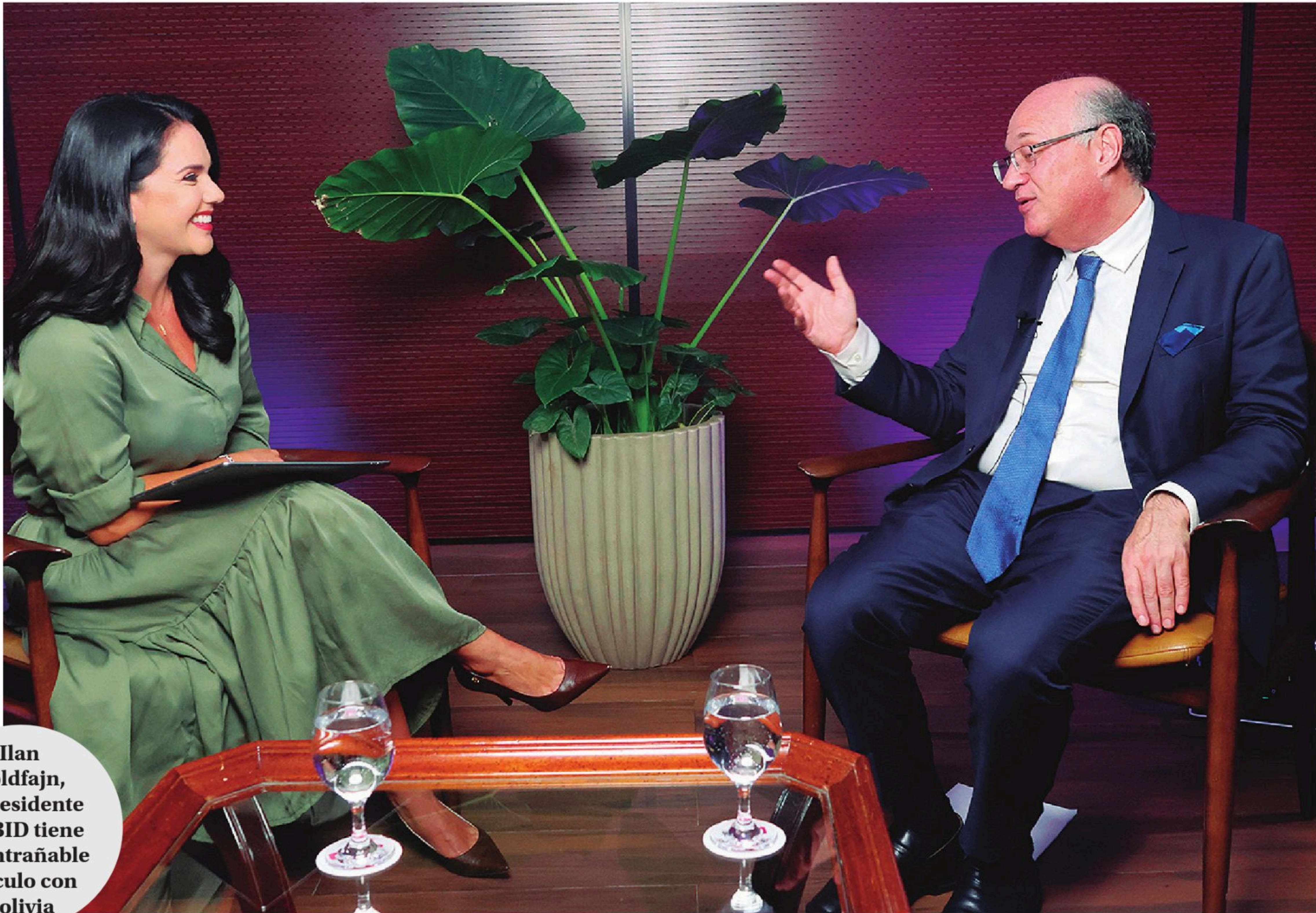
Ilan Goldfajn, el presidente del BID tiene un entrañable vínculo con Bolivia

Cabe a nosotros todos, al Gobierno, al sector privado, a la sociedad, pero también al BID, que trabajemos juntos para que esta oportunidad sea aprovechada. — Ha venido con una cifra. 4.500 millones de dólares es lo que tiene para proyectos de inversión en Bolivia que se deben ejecutar entre 2026 y 2028. ¿Cuáles son los proyectos prioritarios que se han identificado o esas oportunidades de las que usted habla que hay en el país para poder seguir desarrollando Bolivia? Bueno, este monto, que es 4.500 millones, es un monto considerable. Es un monto que es seis veces más de lo que se invirtió en