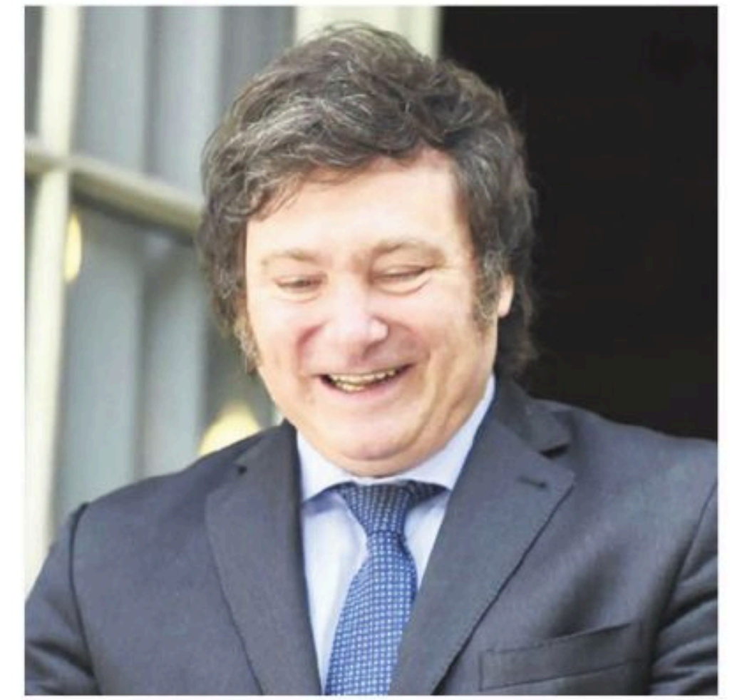
Milei salva un escollo más

Ayer, Delcy Rodríguez informó que en los últimos días han sido liberados 406 presos políticos en el país y que el proceso de excarcelación "se mantiene abierto".