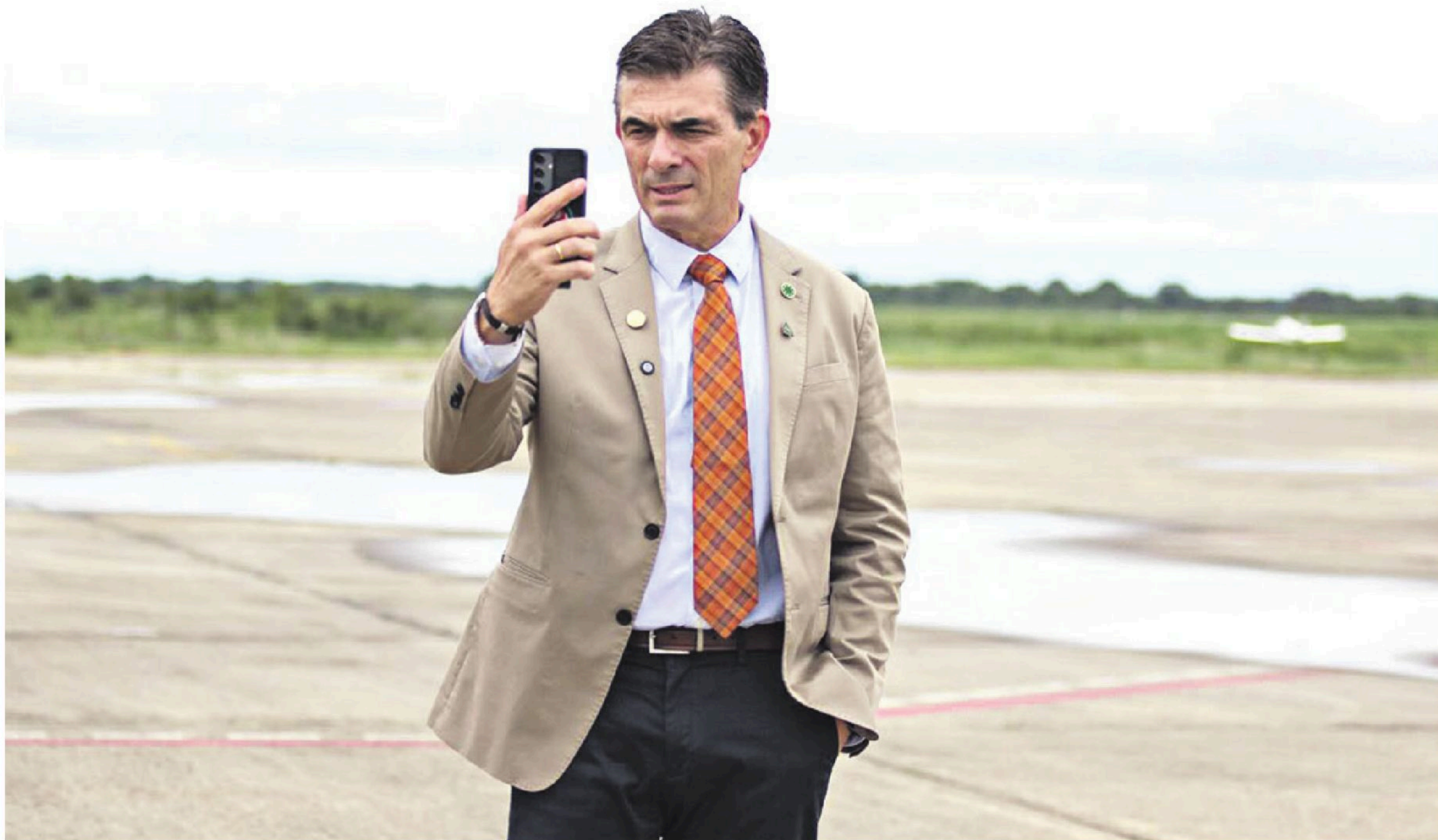
El presidente del Estado, Rodrigo Paz Pereira, podrá ejercer sus funciones desde cualquier parte del mundo mediante su despacho virtual.