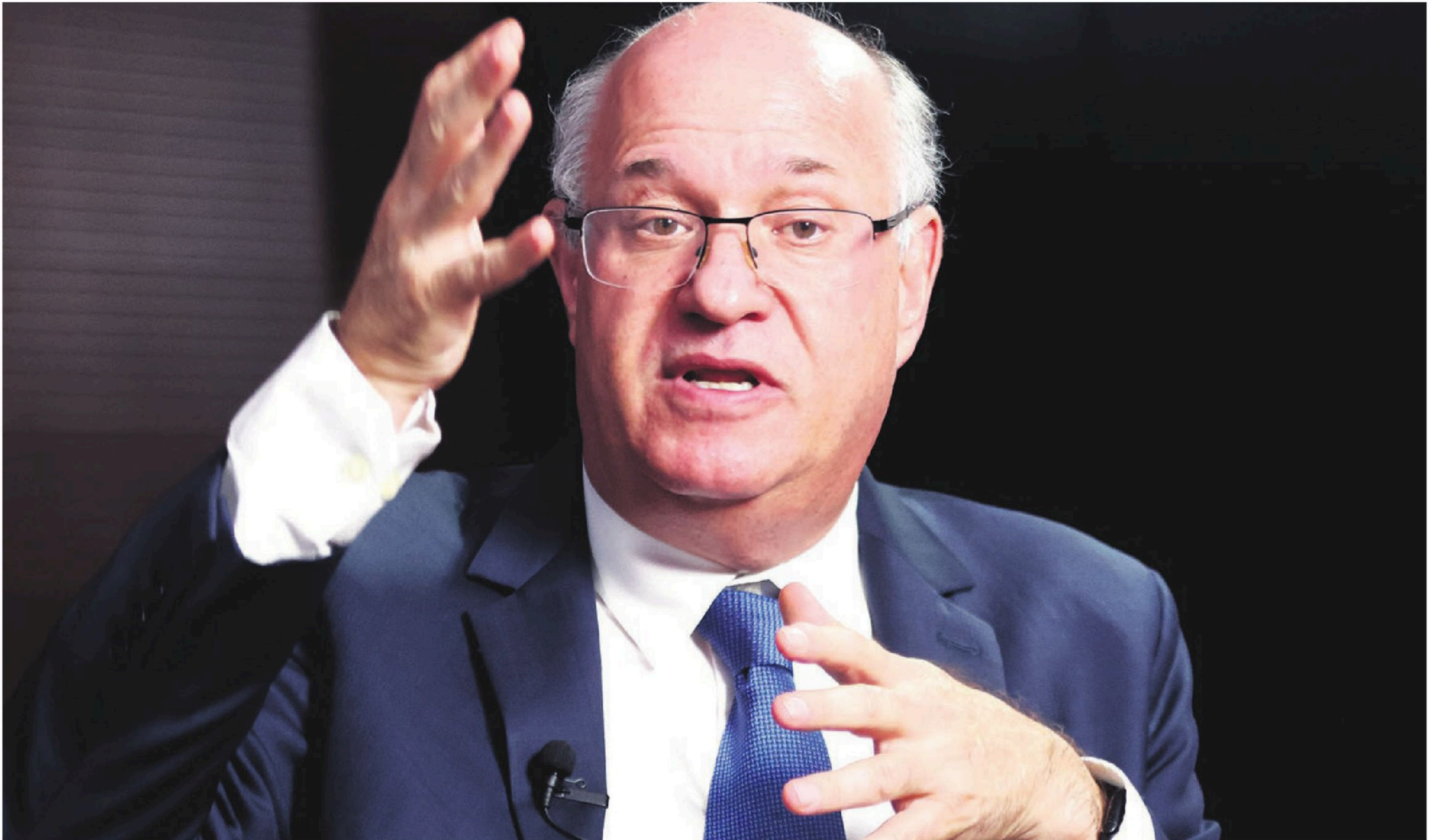
ILAN GOLDFAJN. Regreso: Un presidente del Banco Interamericano de Desarrollo visita Bolivia después de 15 años. Está convencido de que el país tiene potencial para crecer económicamente

ENTREVISTA EXCLUSIVA. ILAN GOLDFAJN RESPONDIÓ A EL DEBER