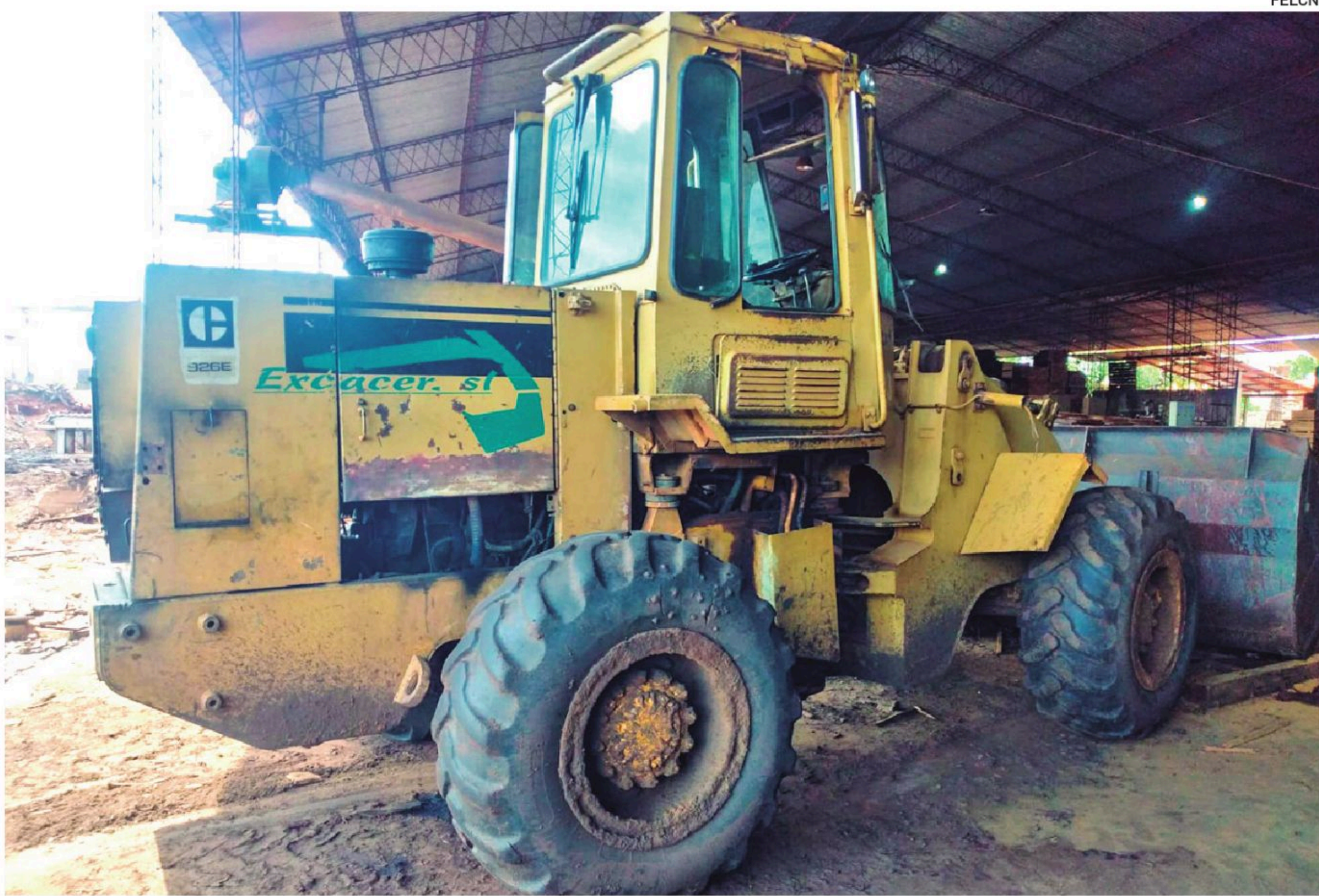
Una de las maquinarias incautadas en San Ignacio de Velasco relacionadas a los 700 kilos de cocaína

Ernesto Justiniano aseguró que se marcó líneas importantes para el esclarecimiento del transporte del cargamento de droga. Ase-