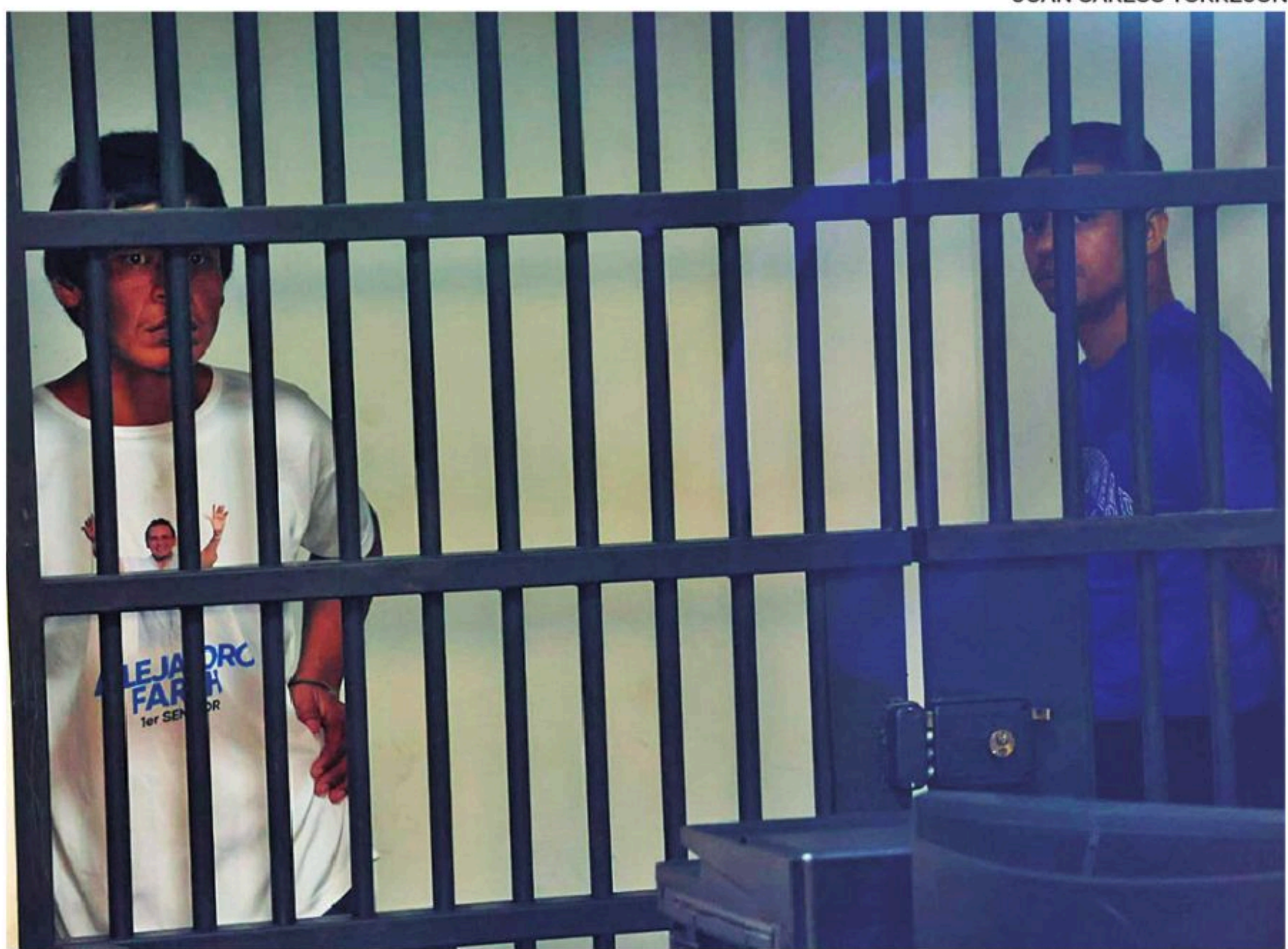
Los reclusos que fueron trasladados a la cárcel de Chonchocoro

Las diligencias de la Fiscalía y la Policía señalan que es acusado de