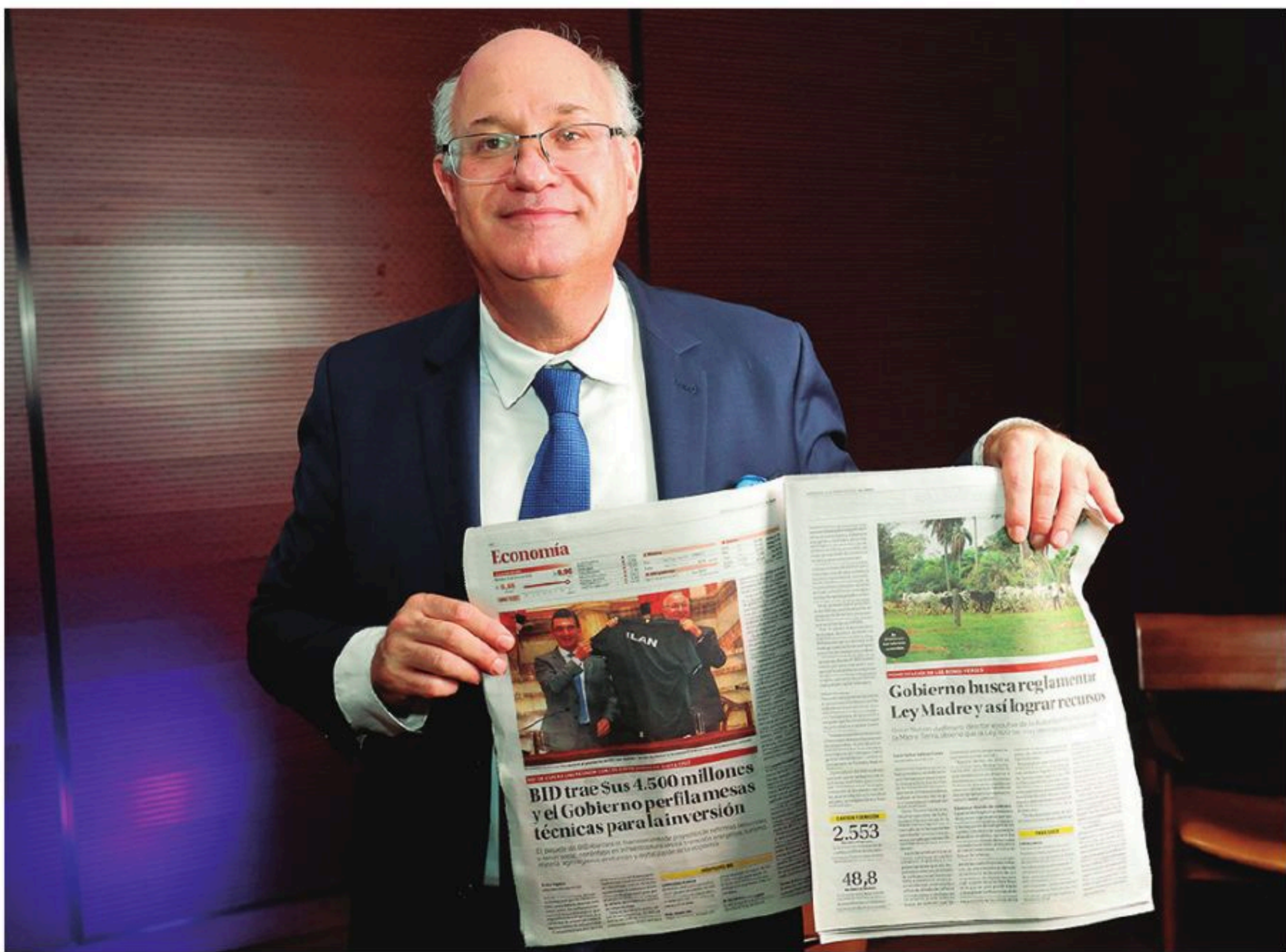
El presidente del BID con EL DEBER en las manos

Queremos ser también el puente entre los desafíos, la oportunidad y la confianza