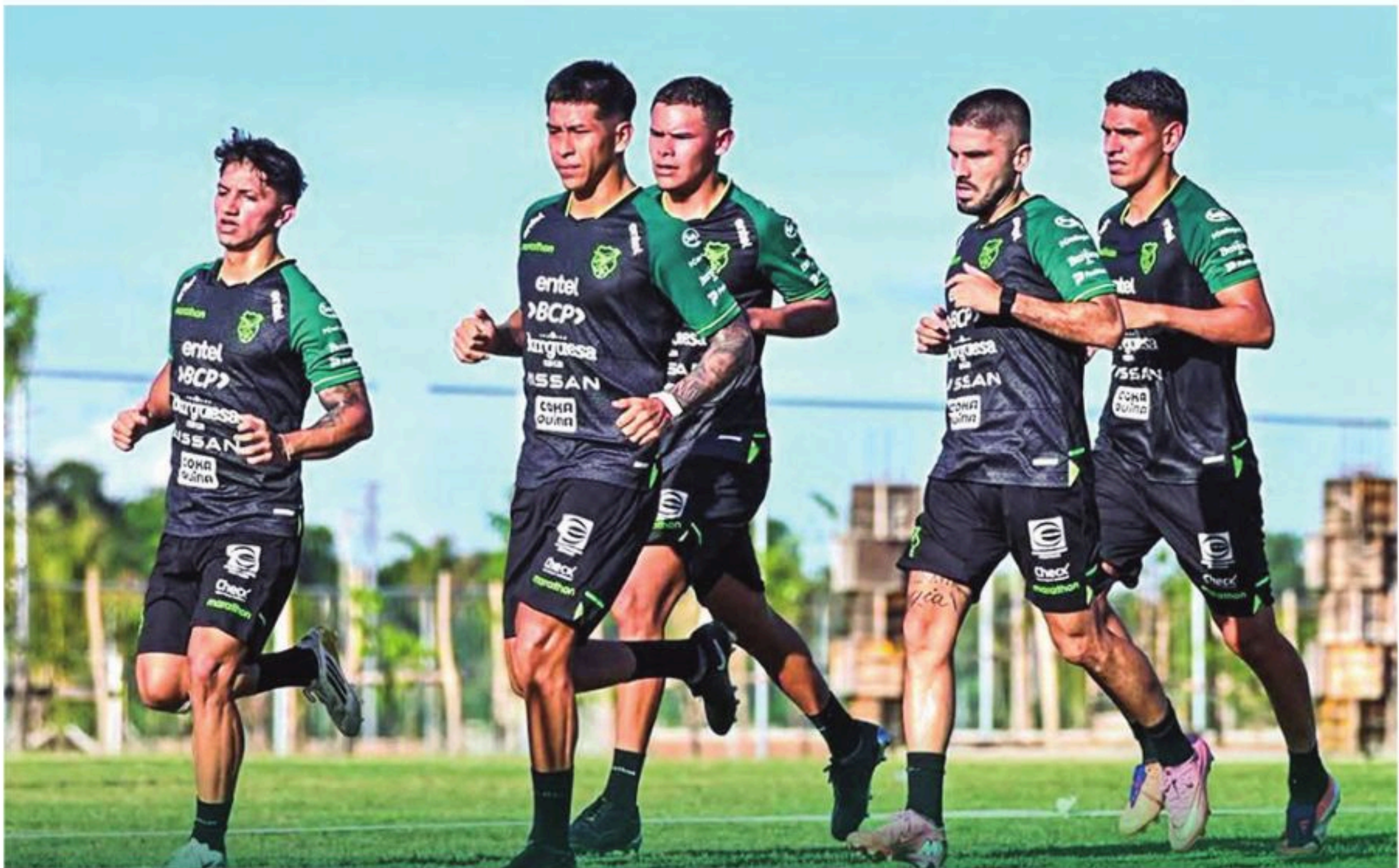
La Verde cumplió una jornada con triple entrenamiento ayer en Santa Cruz

Los canaeros tendrán doble fecha de preparación, el domingo 18 de enero cuando visite a Bolivia, y cerrará el jueves 22 de enero frente a México en el estadio Rommel Fernández Gutiérrez, en Ciudad de Panamá.