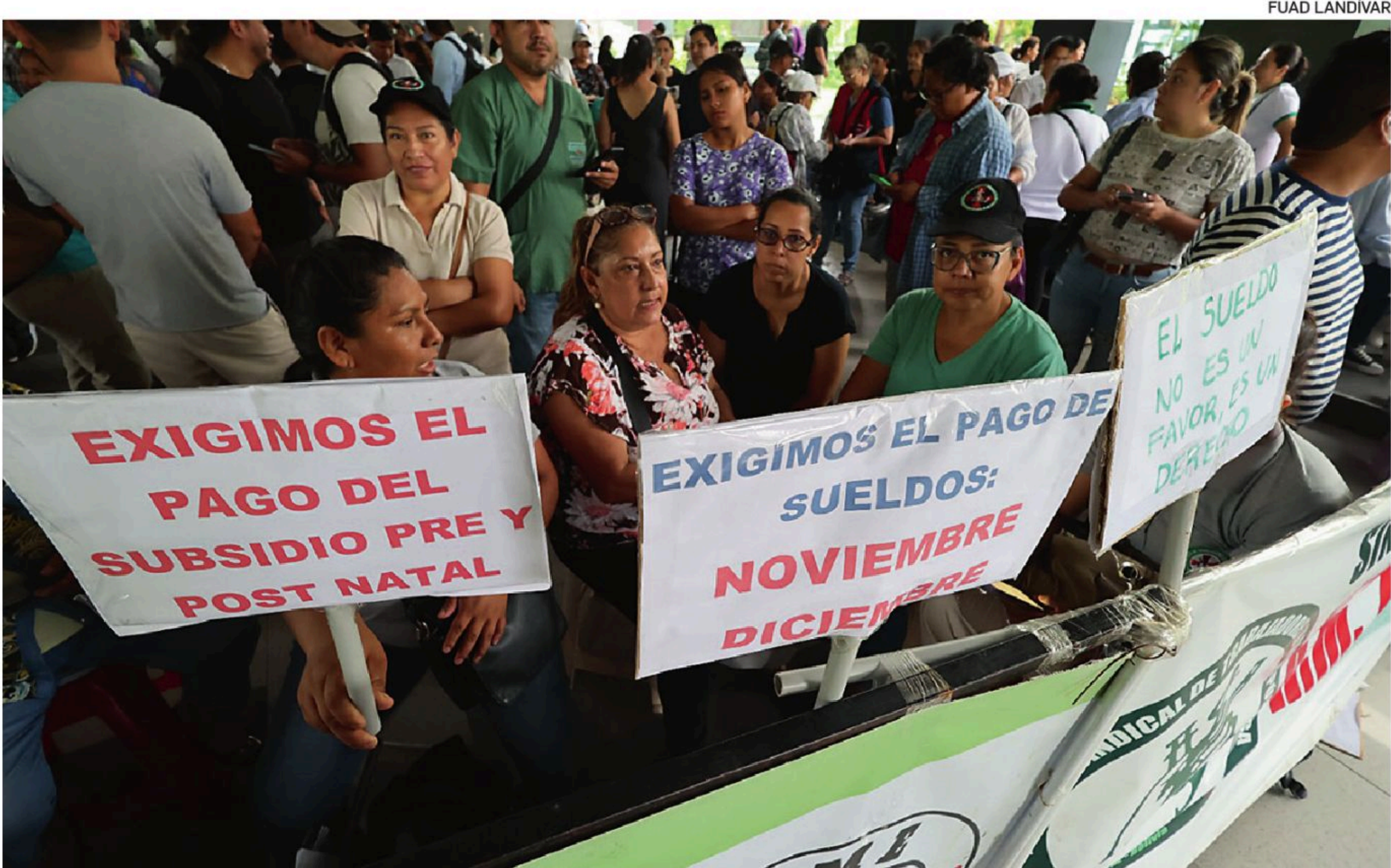
Trabajadores de salud cumplen una semana de ayuno voluntario en puertas de la Quinta Municipal

A quienes más se les debe es a los funcionarios de salud (que