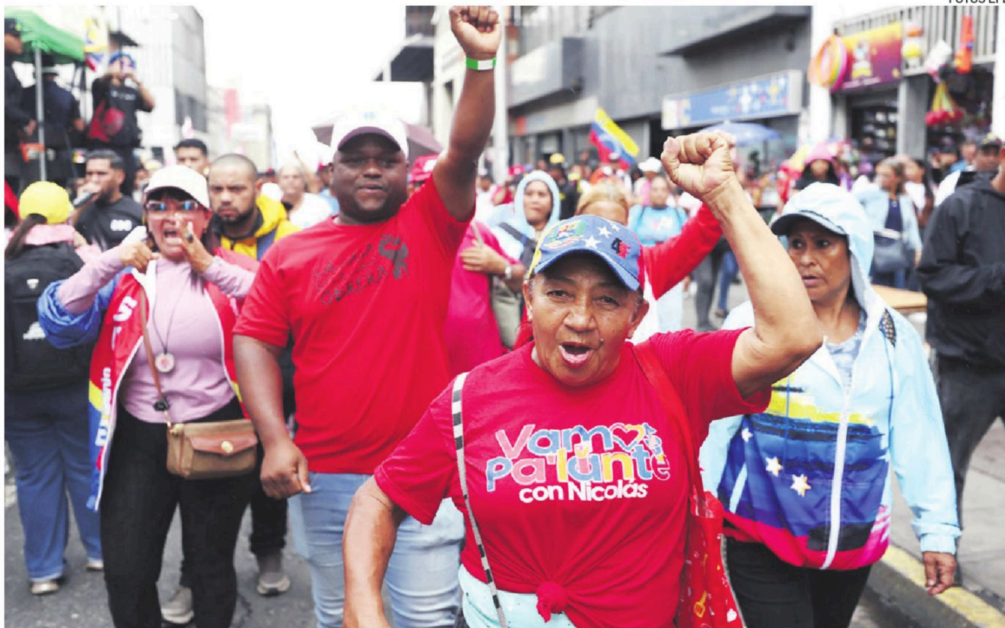
El chavismo salió ayer nuevamente a las calles de Caracas para pedir la liberación de Nicolás Maduro