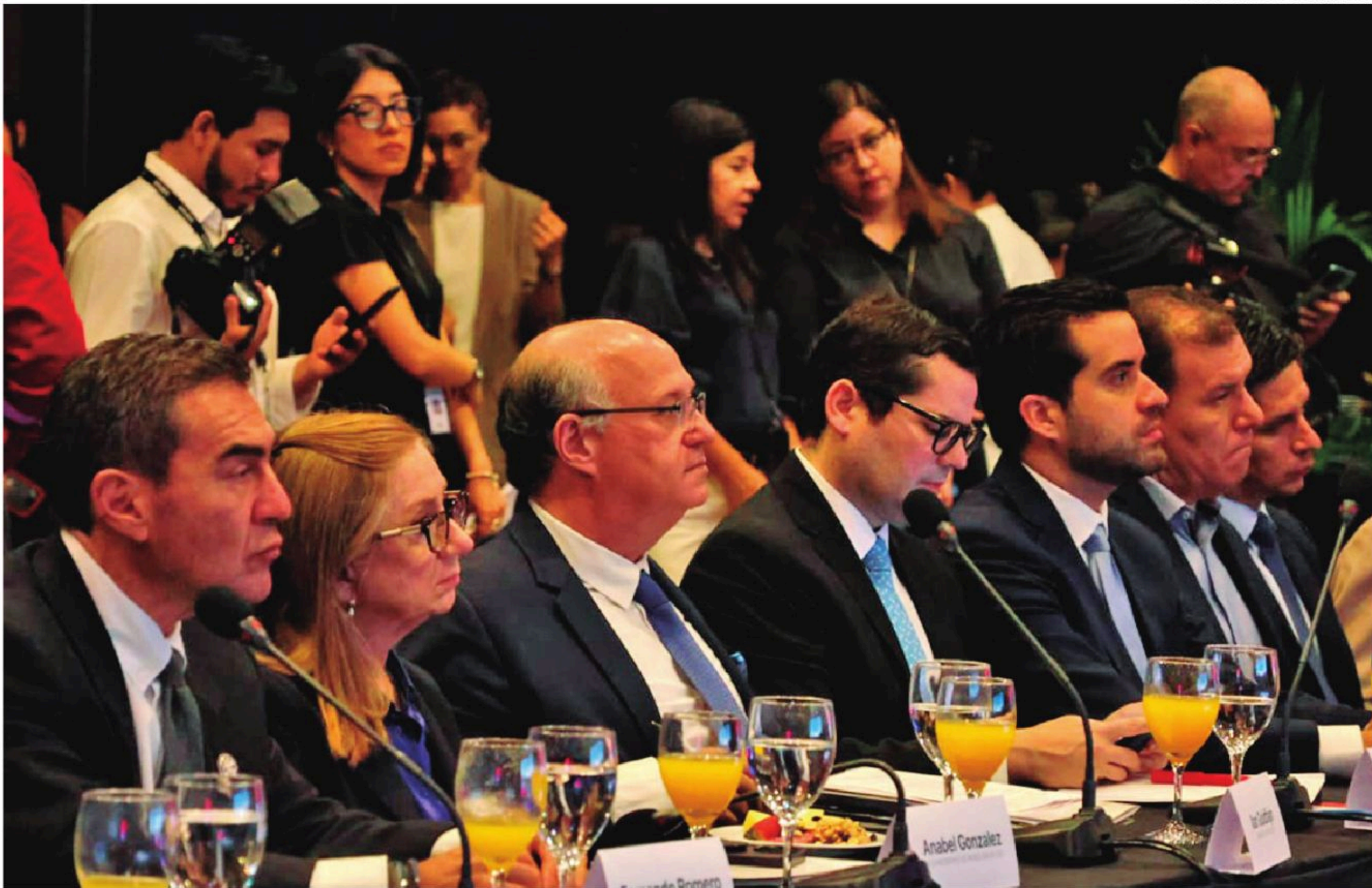
Los empresarios destacaron la presencia, tras 15 años, del presidente del organismo internacional

Tenemos que esperar un poco, como saben, nosotros no entramos en las cuestiones políticas, nosotros somos los técnicos, que una vez la solución política ocurre, o sea, se resuelve y está más claro, pues ahí después nosotros trabajamos.