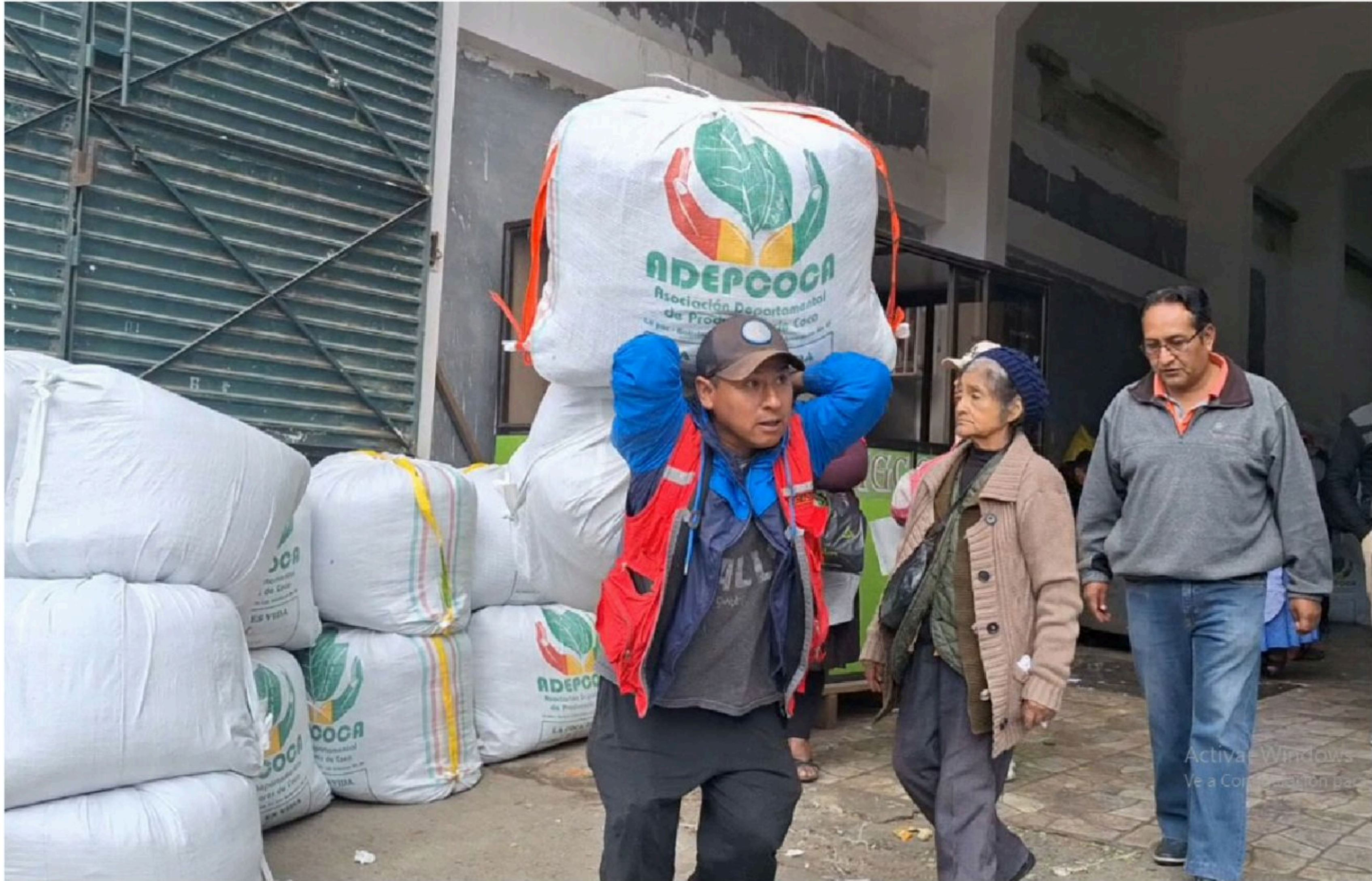
Un estibador de Adepcoca lleva un taque hacia uno de los vehículos que traslada el producto a Santa Cruz