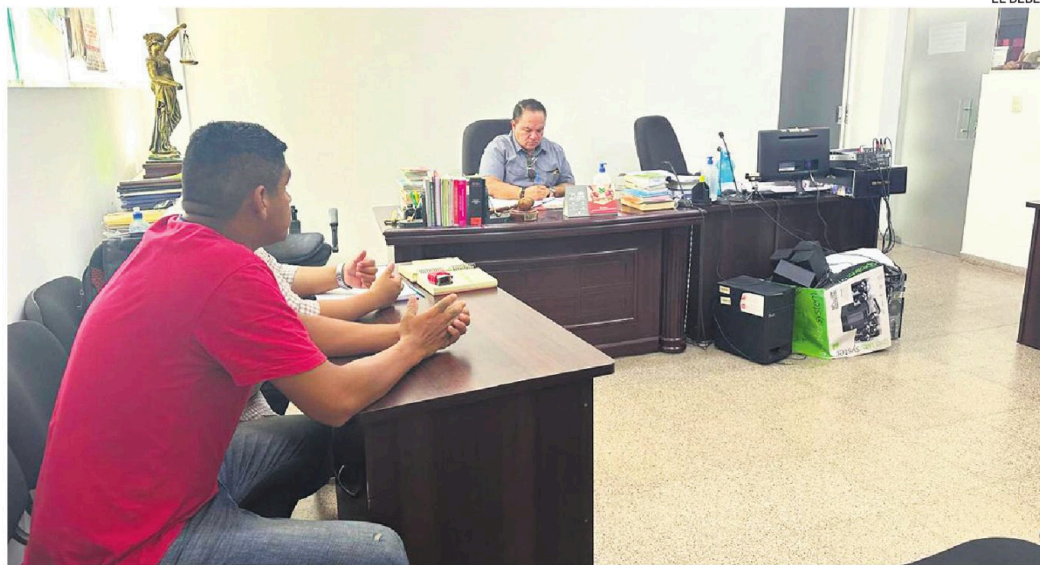
La justicia ordenó la detención preventiva en Palmasola para un hombre acusado de violar a su cuñada

Tras conocer el caso, efectivos de la Felcv y la Fiscalía iniciaron las investigaciones correspondientes,