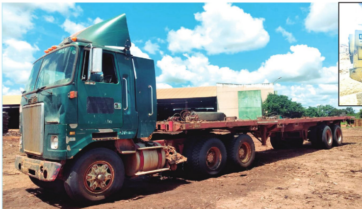
Un tractocamión fue incautado por la Fiscalía y la Felcn durante acciones desarrolladas el fin de semana