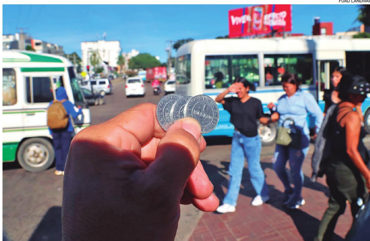
El pasaje transitorio en micros se mantiene en tres bolivianos. Los trufis cobran cinco bolivianos