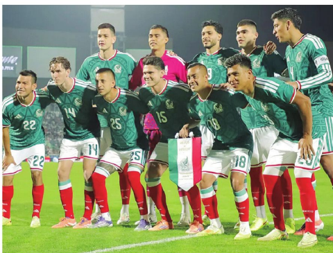
La selección azteca llega diezmada para el compromiso amistoso en la capital cruceña.

Las otras dos bajas en el ataque son César 'Chino' Huerta y Alexis Vega. El primer atacante trabajó en el cierre de año en el Centro de Alto Rendimiento, en busca de acelerar su recupera-