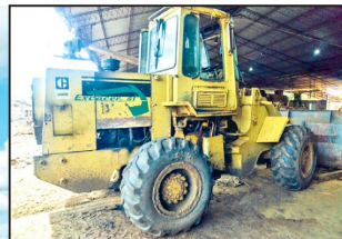
Una pala mecánica secuestrada

Guider Arancibia Guillén guider.arancibia@grupopeldeber.com