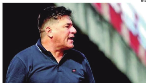
Straccia es nuevo DT de FC Universitario para jugar los torneos locales de este año.

Agregó que se convocó a reunión de directorio para ver el tema legal en el club.