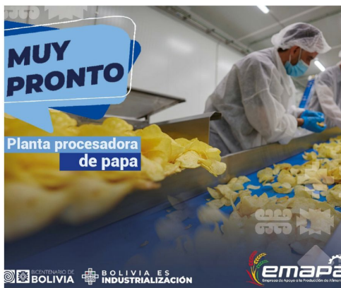
Propaganda que Emapa difundió antes de la inauguración de la planta

Los dos adultos mayores se acogieron a su derecho al silencio.