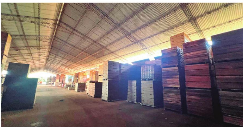
El tinglado de acopio de madera en San Ignacio de Velasco fue intervenido por la Felcn y la Fiscalía. También se secuestró un montacarga

En últimos allanamientos, la Felcn y la Fiscalía incautaron 240.000 dólares, cuatro inmuebles, un tinglado con madera, un montacarga, una pala mecánica y un tractocamión, relacionados al cargamento de droga detectado en Chile