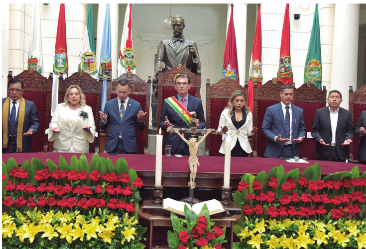
Autoridades nacionales y judiciales participan en un acto de oración en la ciudad de Sucre

El Ejecutivo y el Órgano Judicial hablan de coincidencias y apoyo, en una ceremonia que incluyó la posesión de nuevas autoridades y mensajes de respaldo institucional mutuo.