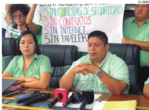
Dirigentes de Fesirmes no descartan nuevos paros del sector

Explicó que el único acercamiento por parte del municipio