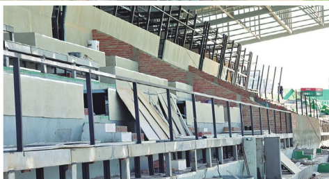
14 palcos fueron concesionados, restan 6 que están en negociación con firmas privadas.

Se trabaja por una infraestructura de nivel internacional.