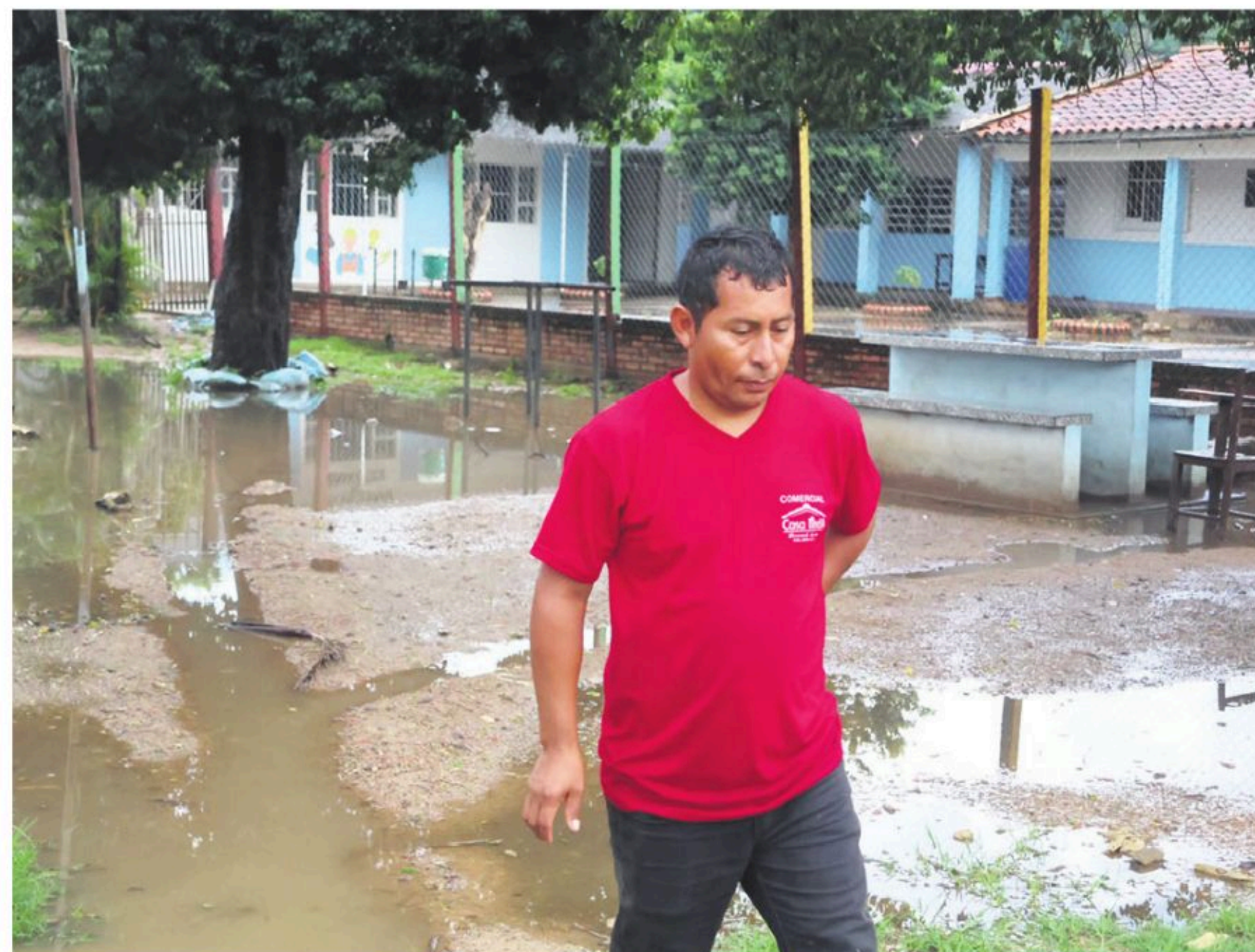
Padres alertan sobre el rebalse del pozo séptico en un colegio

Se trata de la unidad educativa Nuevo Surutú, ubicada en el Distrito 7, zona La Rojiza, donde el agua arrastró prácticamente todo el mobiliario y equipamiento, incluyendo pizarras acrílicas, escri-