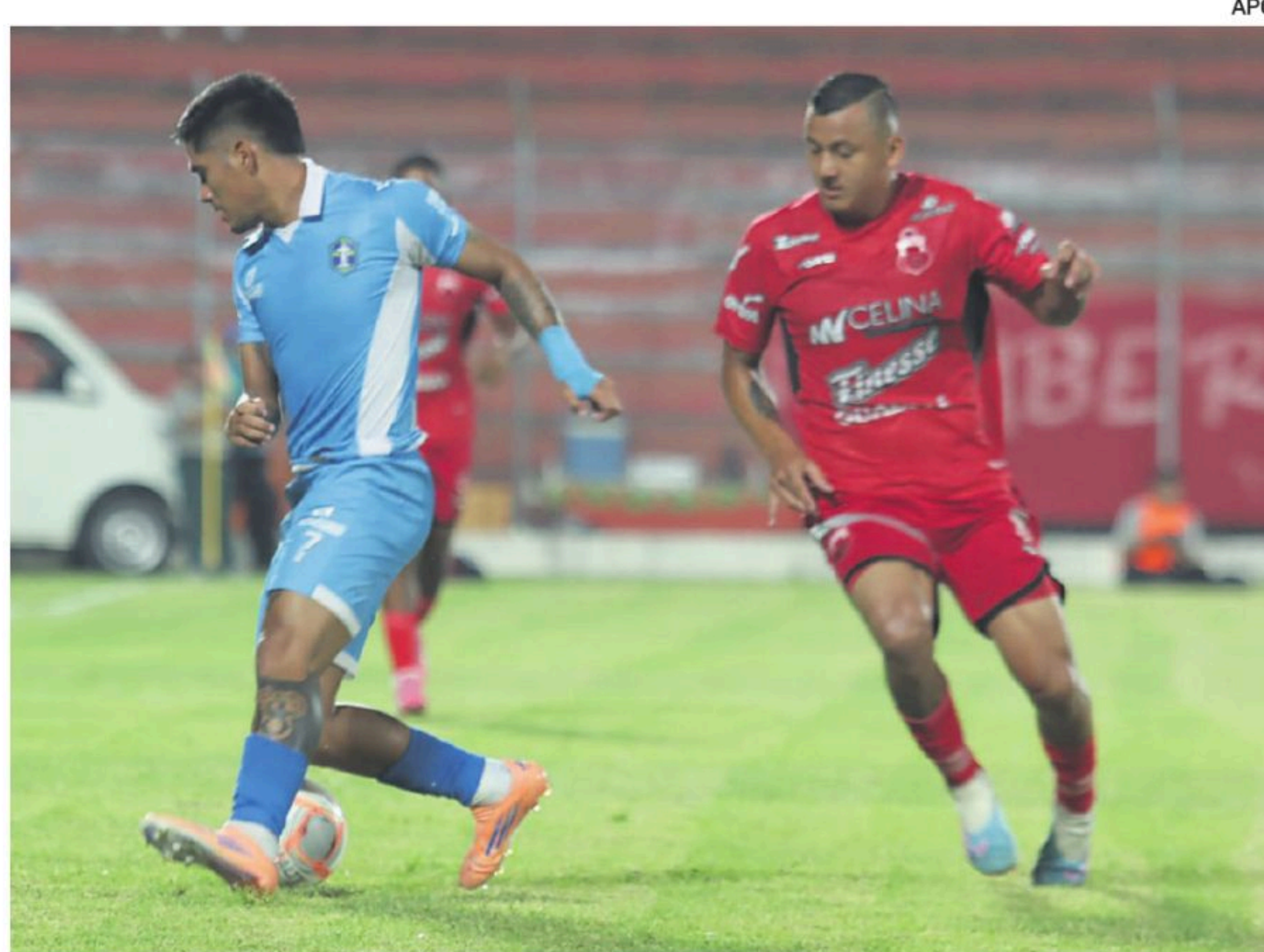
Guabirá y San Antonio no pasaron del empate en planteamiento ofensivo de ambos.

El encuentro fue atractivo desde el inicio. Tanto Joaquín Monasterio como Diomedes Pe-