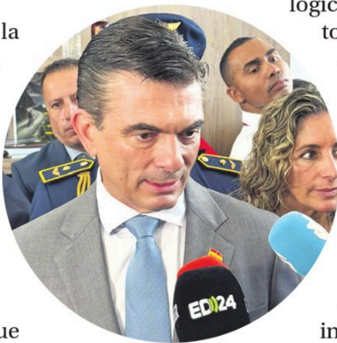
Se siguió la agenda del presidente de Bolivia, Rodrigo Paz

Con este despliegue técnico y humano, Grupo EL DEBER reafirma su posición como el medio líder en información, demostrando que el periodismo boliviano está a la altura de las mayores redes de comunicación del continente.