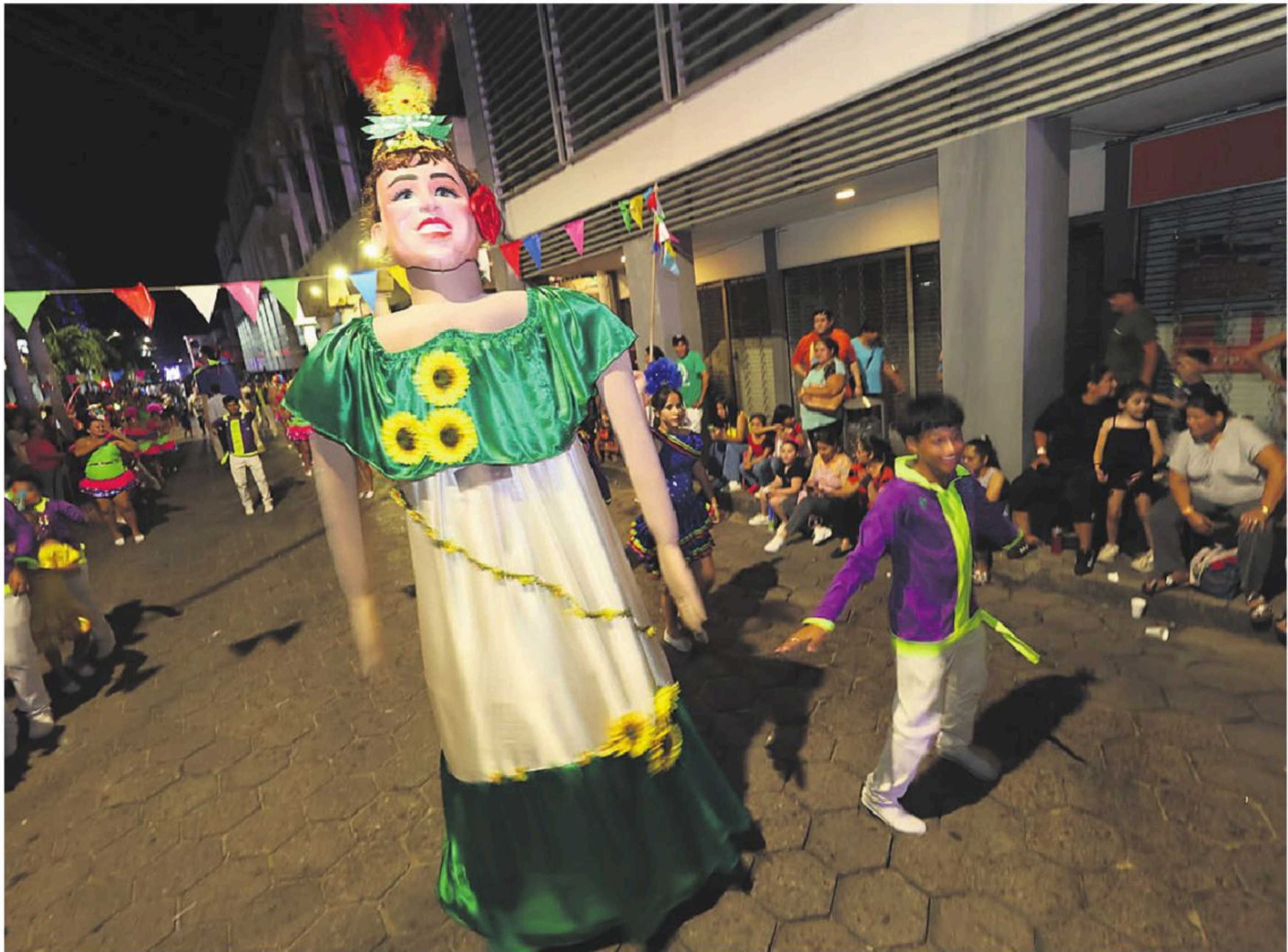
CREATIVOS. Con llamativos elementos, danzarines bailaron al son de chobenas, taquiraris y otros ritmos orientales