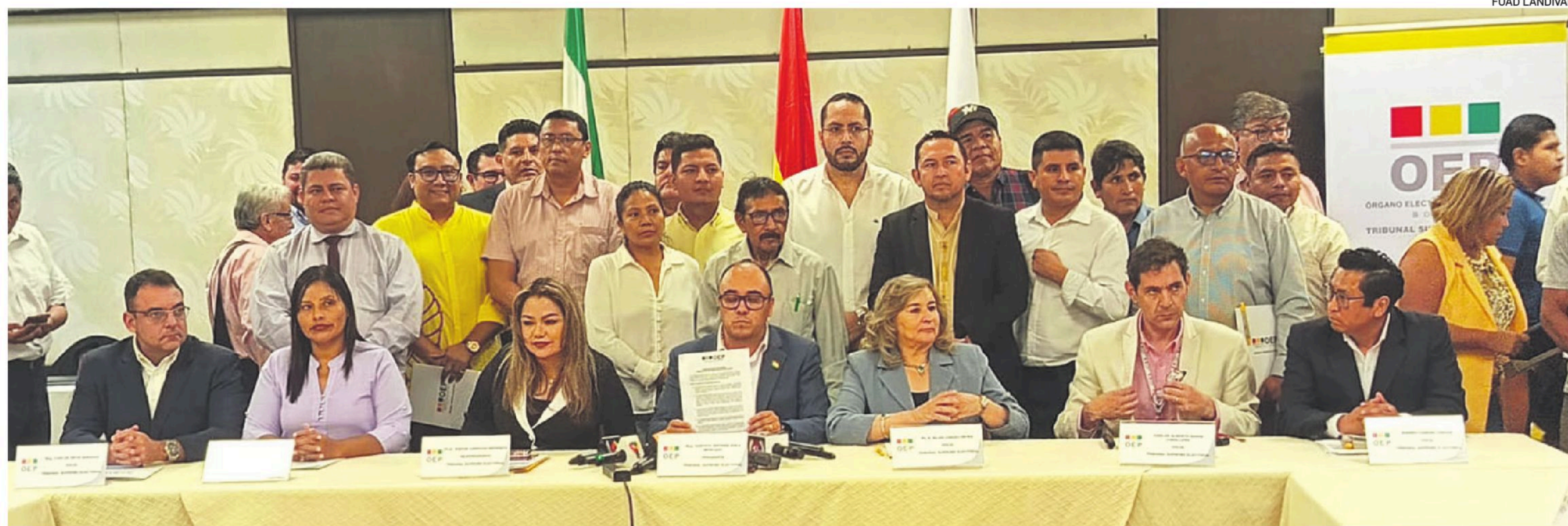
La última reunión entre los vocales del TSE y representantes de organizaciones políticas que se comprometieron a respetar las normas electorales en las subnacionales