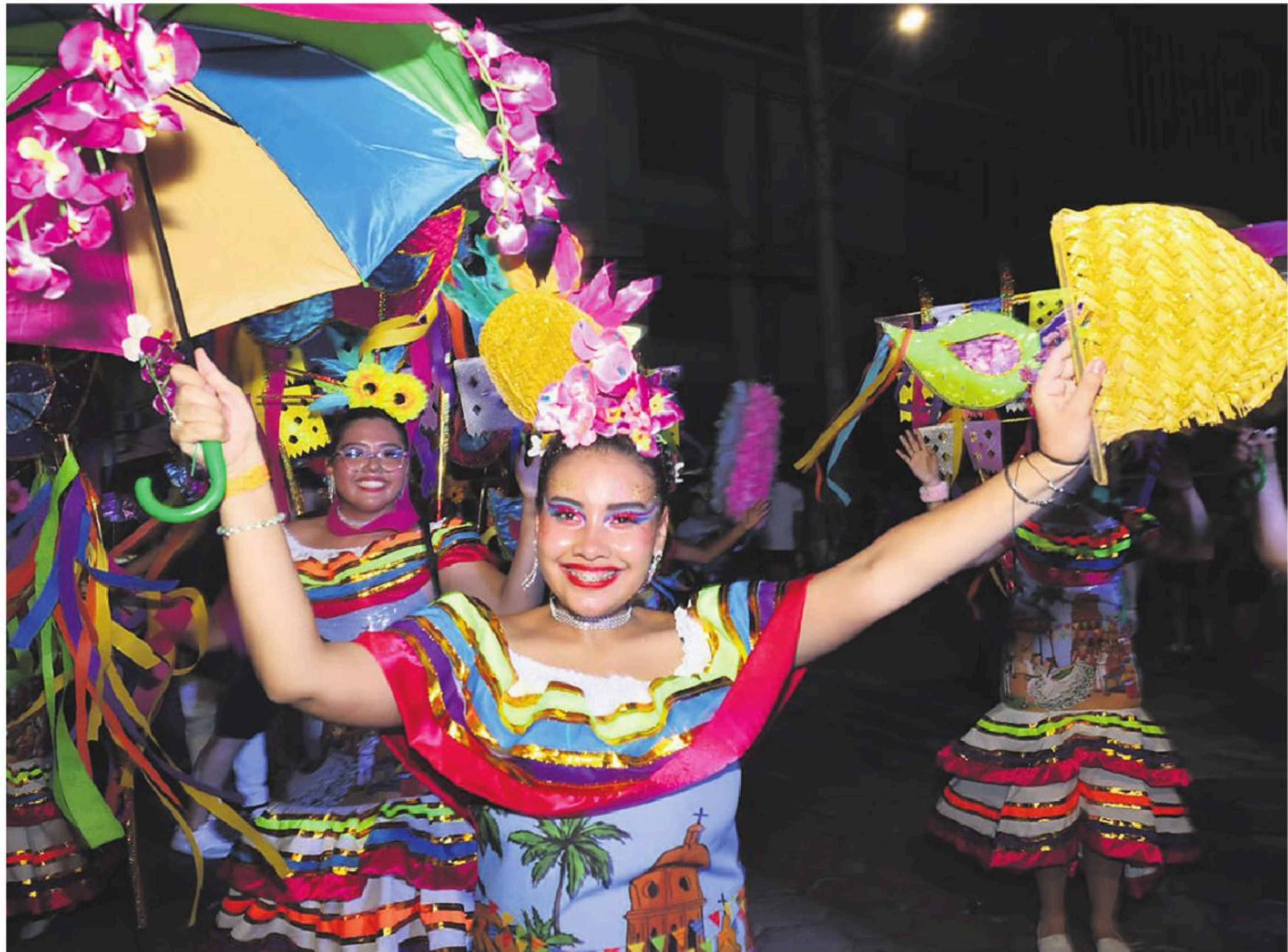
BALLETS. Con mucho colorido y derrochando alegría, grupos folclóricos le pusieron nota alta a la última precarnavalera