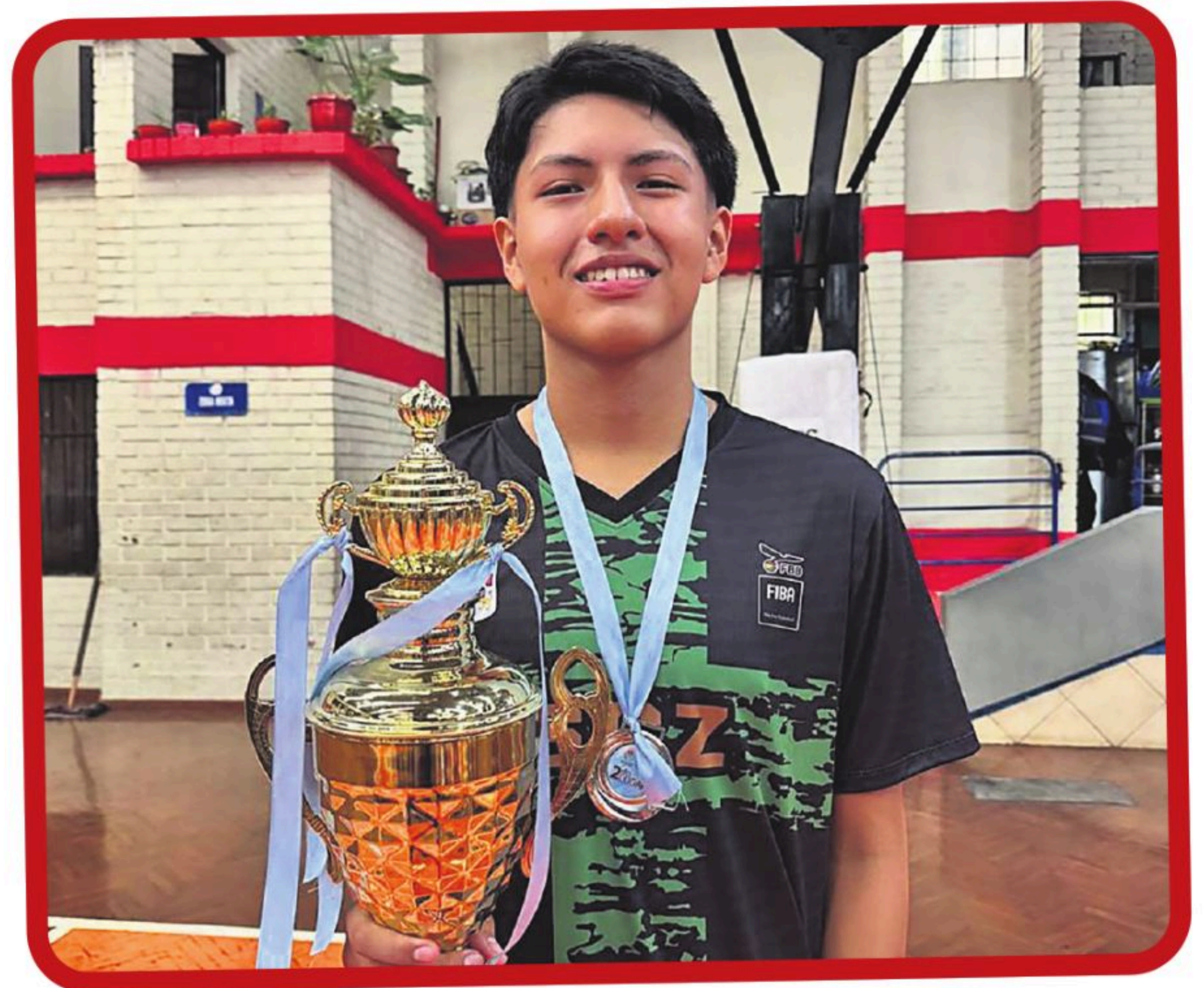
Segundo lugar en la Copa Bolivia, en Cochabamba, el año 2024