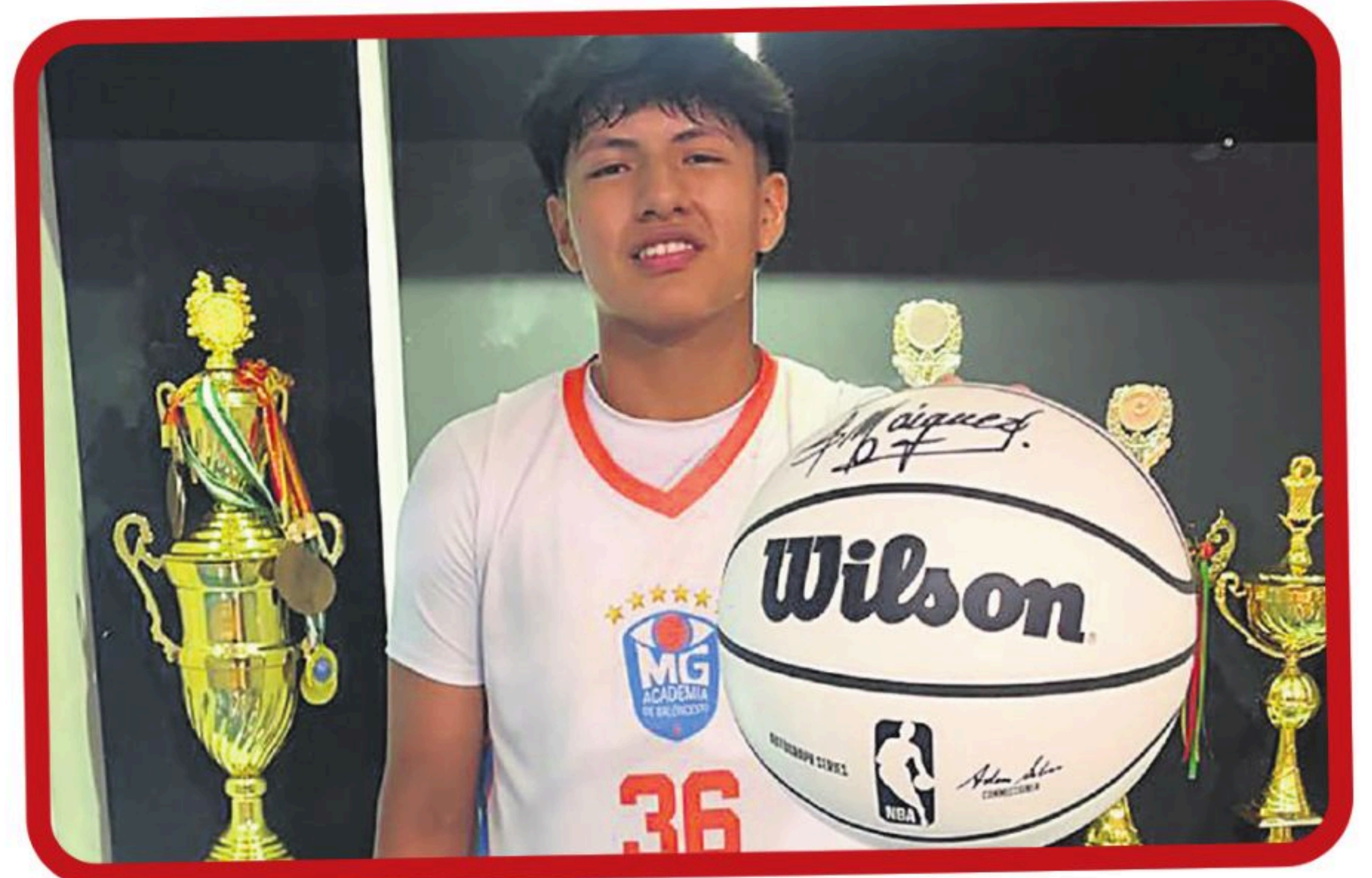
Con el uniforme oficial de la academia MG, en Santa Cruz