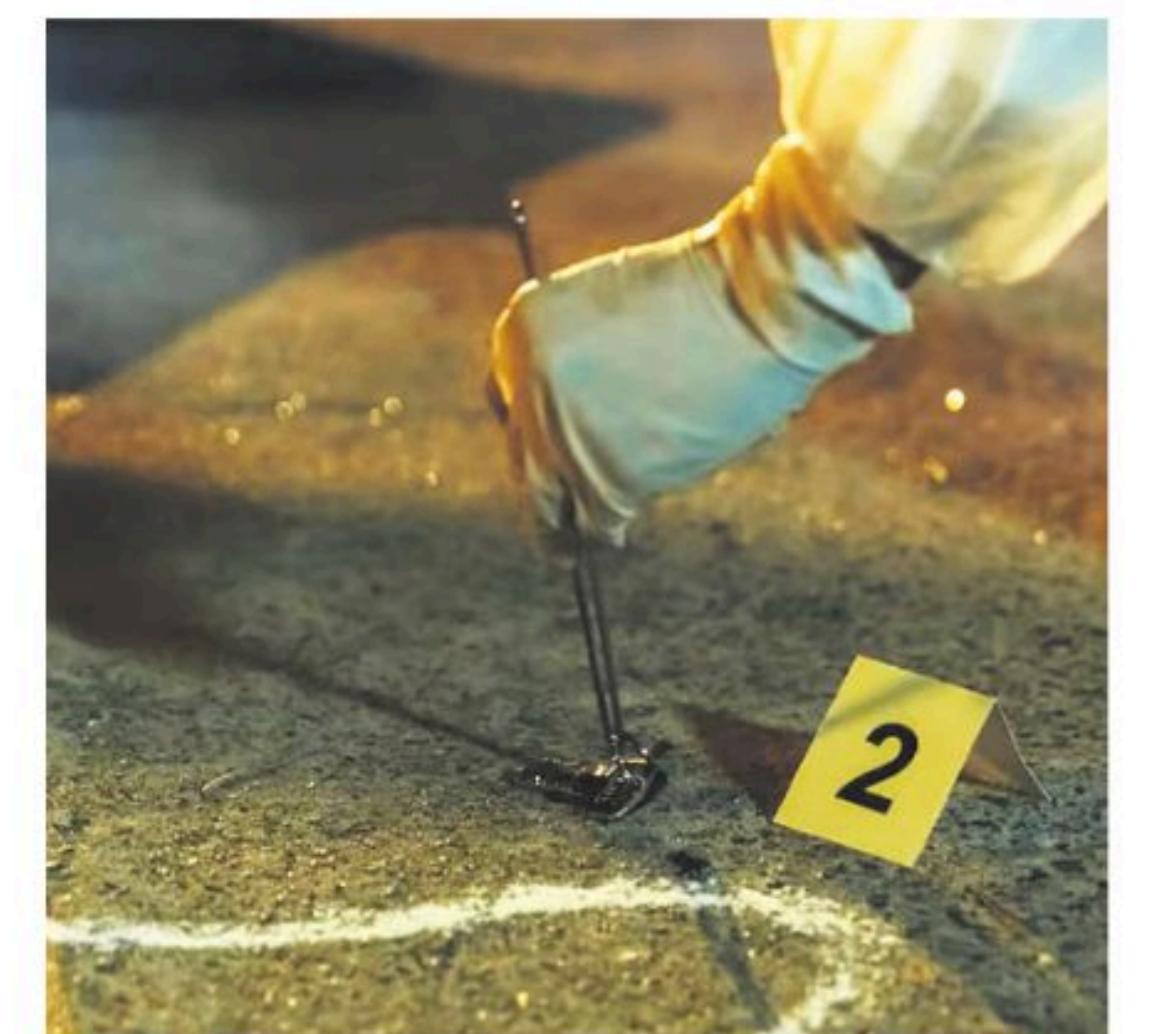
Se investigan los hechos

que atraviesa Ecuador. Desde 2024, el país se encuentra bajo un estado de “conflicto armado interno”, declarado por el presidente Daniel Noboa para intensificar la lucha contra las bandas criminales, a las que el Gobierno ha catalogado como organizaciones terroristas.