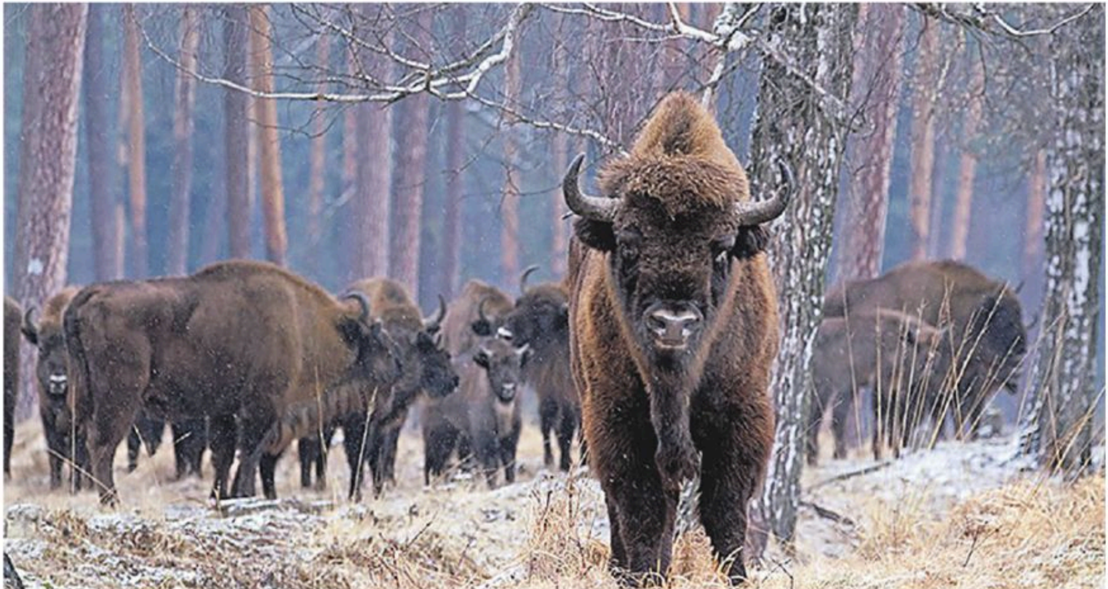
Los bisontes europeos estuvieron a punto de extinguirse

Desde allí se les envió en camión al Parque Natural de Shadaghd donde serán reintroducidos a la vida salvaje.