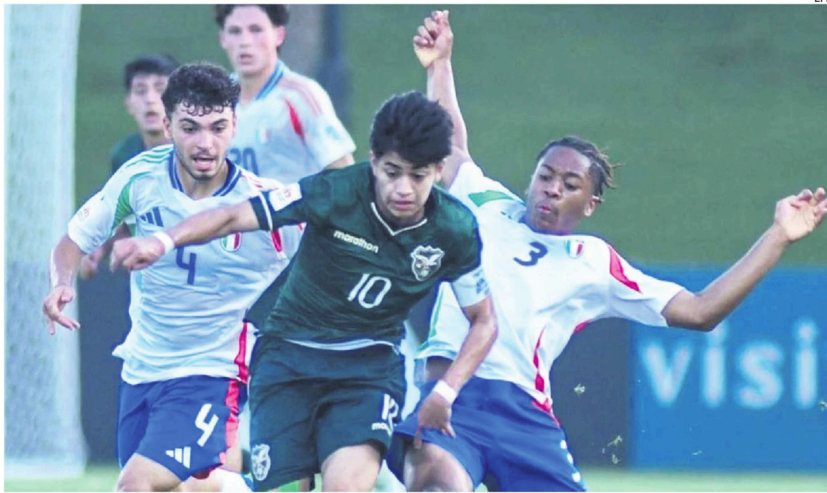
La selección de Bolivia participó en el Mundial Sub-17 el año pasado y los resultados fueron todos de derrota por tanta improvisación.

Consultado sobre la diferencia entre los juveniles bolivianos y ecuatorianos, Vilela es claro: