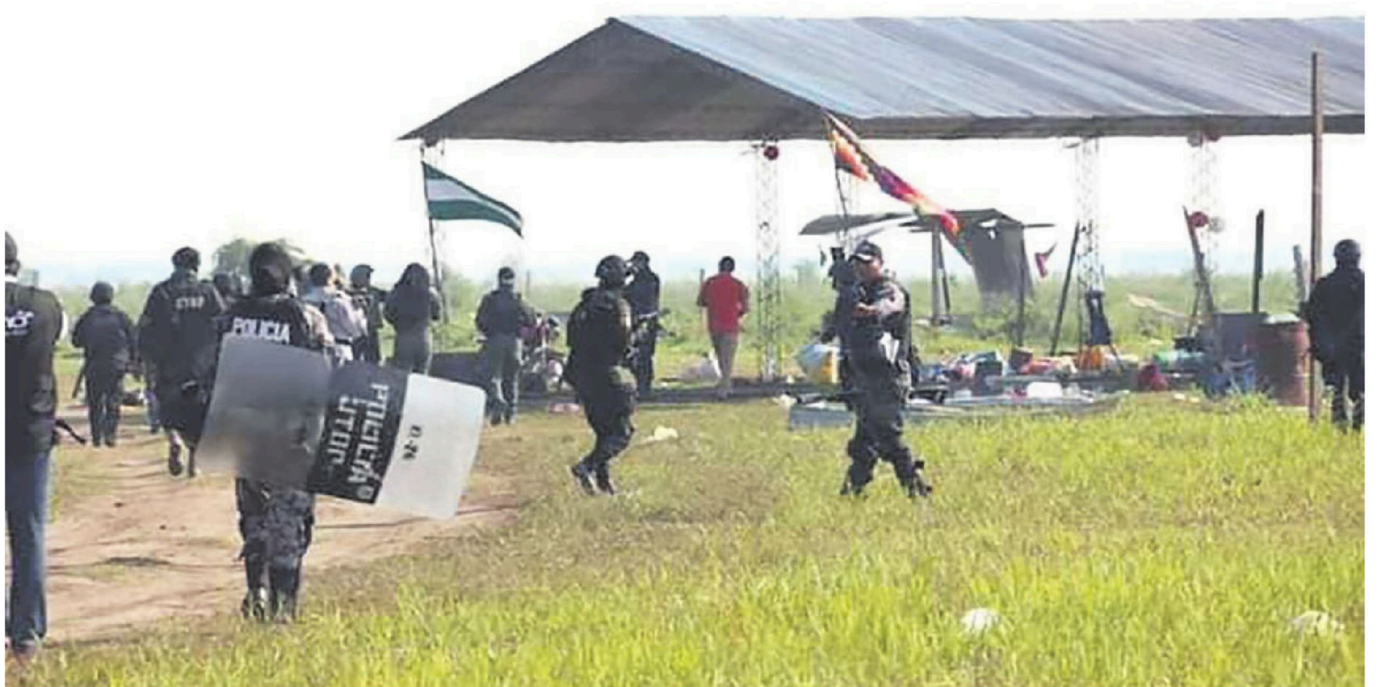
La toma de Las Londras fue el caso más emblemático en el conflicto por tierras; un grupo irregular secuestró a productores y periodistas