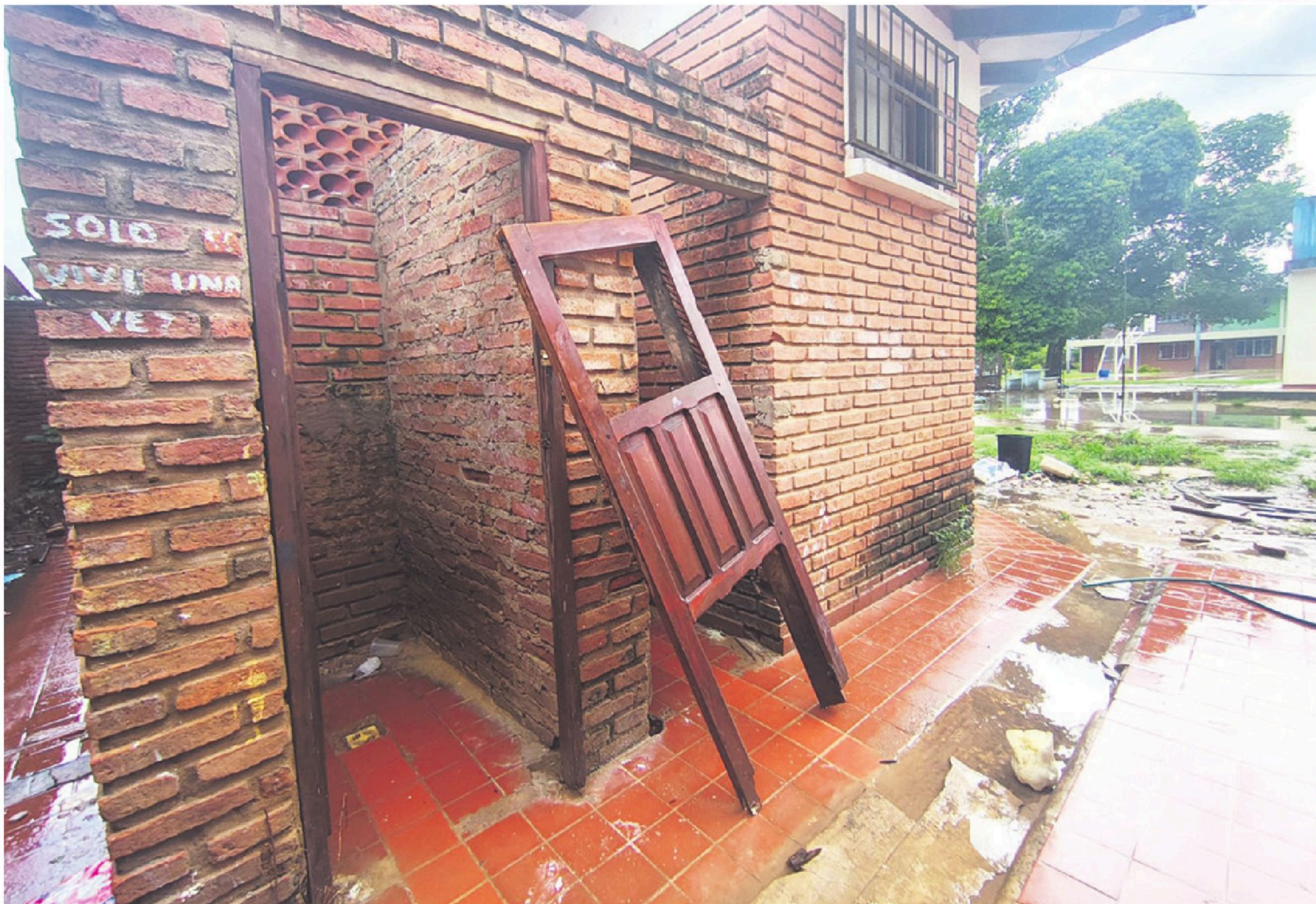
El colegio Naciones Unidas de El Torno presenta serios daños en sus ambientes, como ocurre con los baños que están en la parte externa