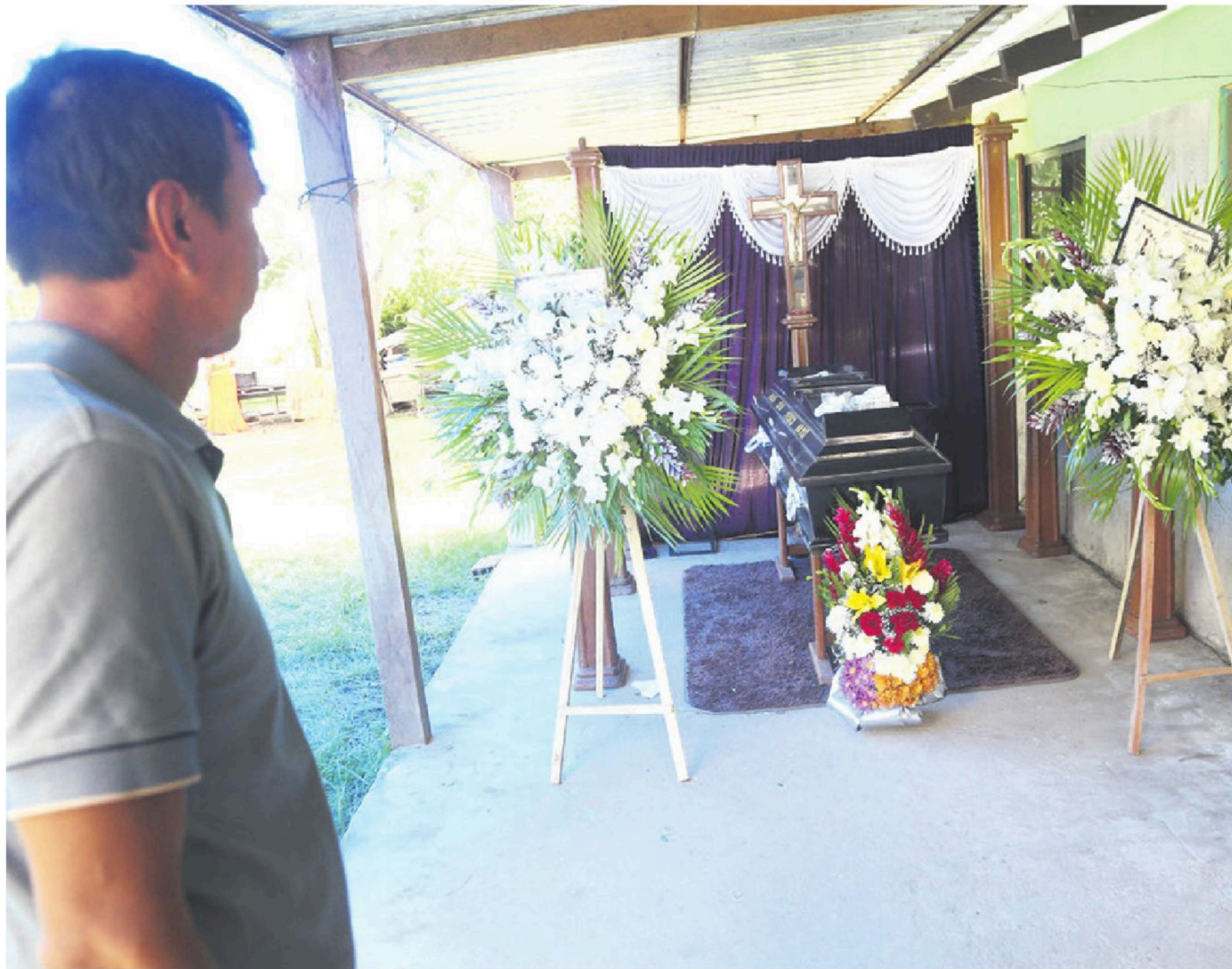
La disputa por tierras en Santa Cruz generó enfrentamientos que se cobró la vida de varias personas

cho significa cumplir la ley. Todo dentro de la ley, nada fuera de la ley. El avasallamiento es un delito y tiene que ser sancionado”, sostuvo la autoridad.