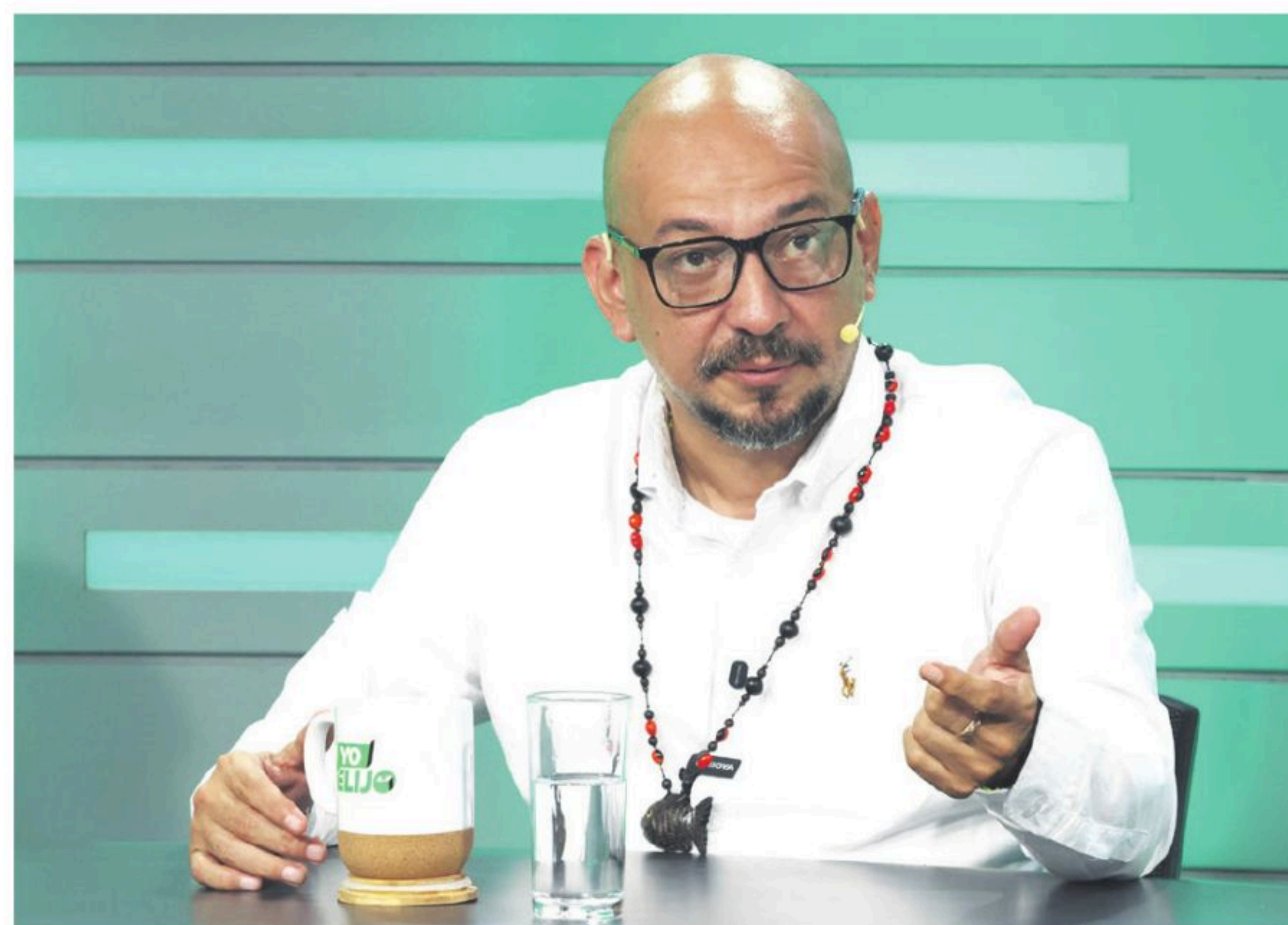
El binomio de NGP, en el panel de EL DEBER

Torrez afirmó que su proyecto no se basa en promesas, sino en compromisos. “No venimos a improvisar, no venimos a prometer, venimos a comprometernos”, sostuvo, al explicar que su plan contempla la creación de tres parques industriales en El Carmen Rivero Torres, Tres Cruces y Abapó, orientados a la industrialización agrícola, energías renovables, economía circular y producción de agua y electricidad.