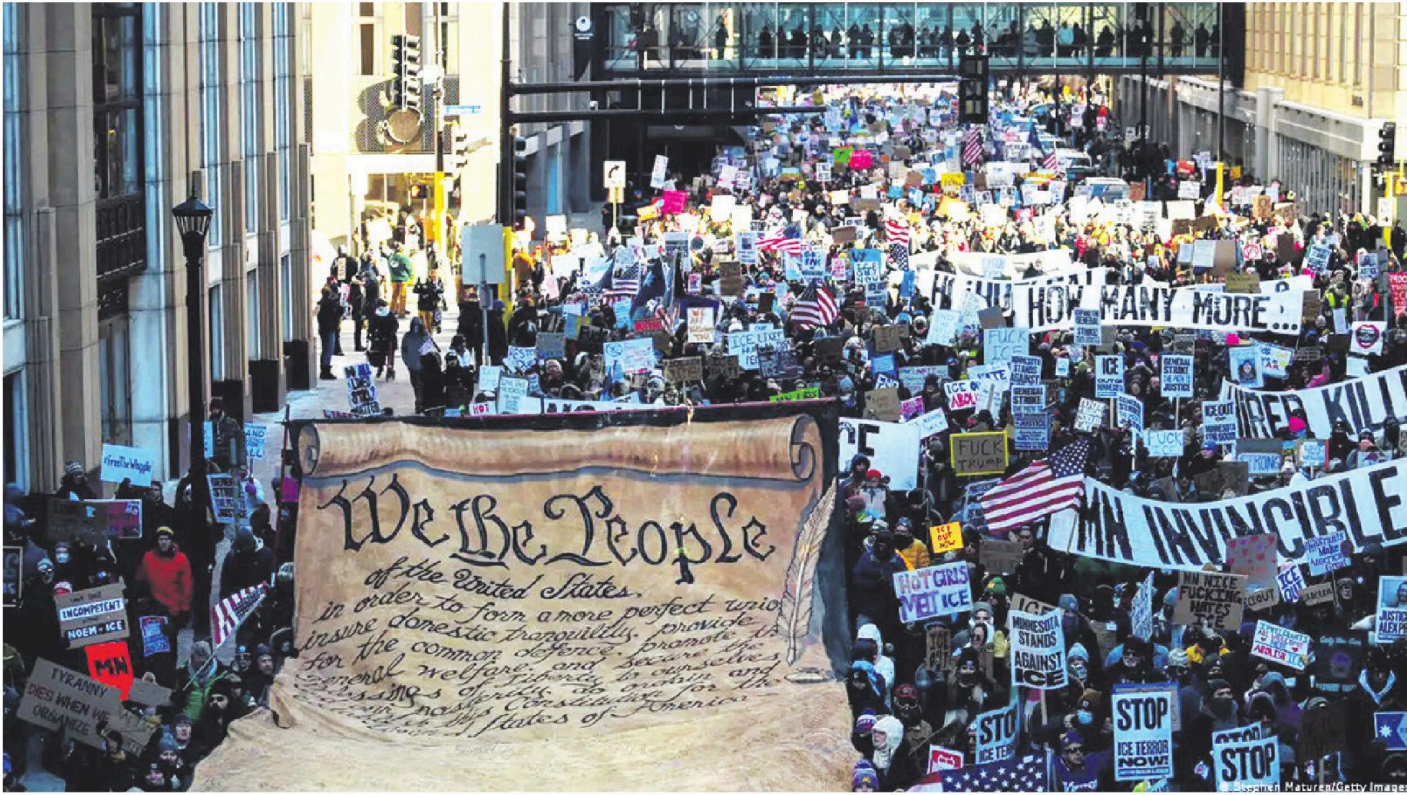
Miles de personas desafiaron las bajas temperaturas y marcharon tanto en Minneapolis como en Nueva York para rechazar los operativos de la policía