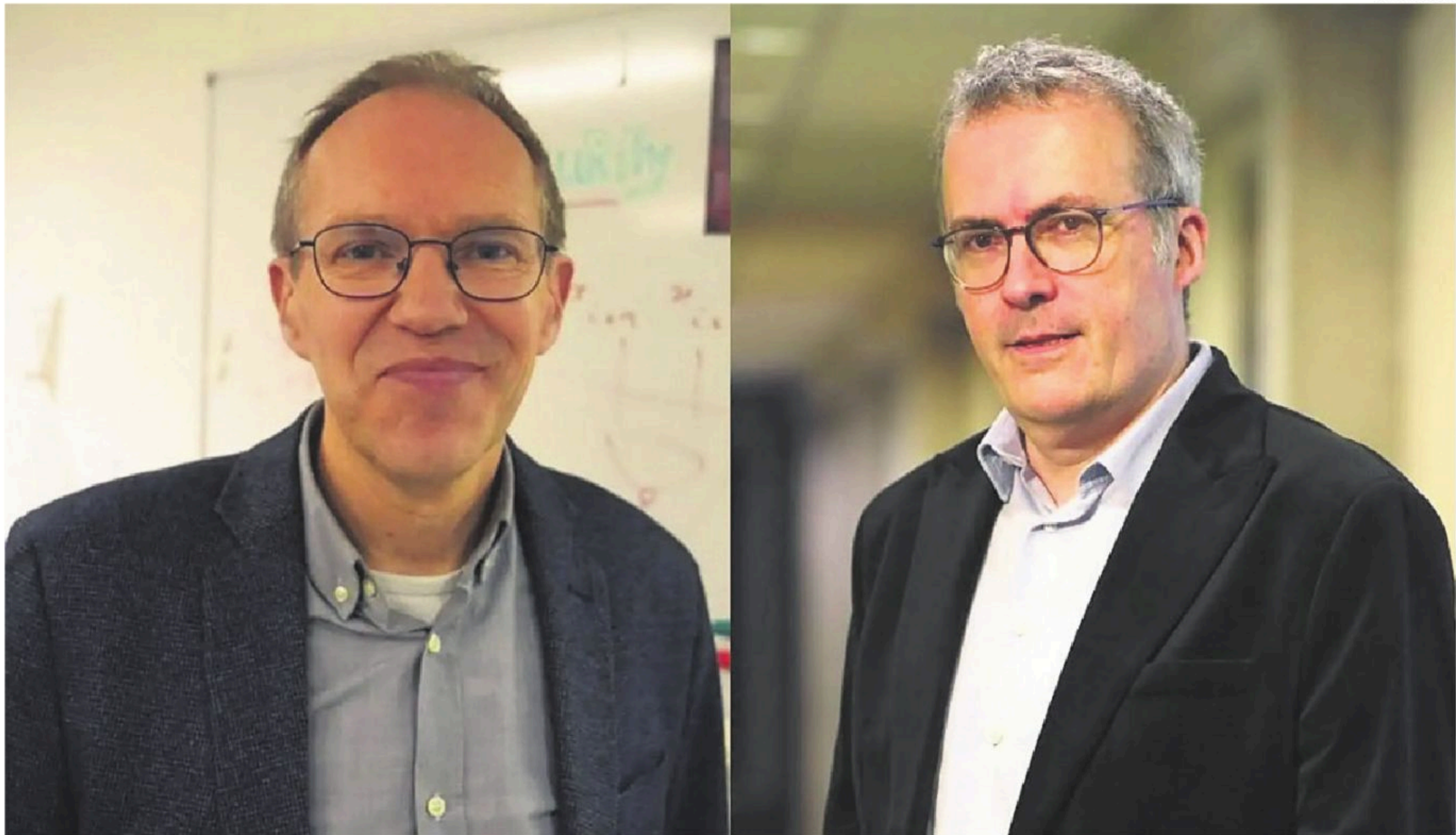
Los ingenieros Joan Daemen (izq) y Vincent Rijmen fueron premiados por la Fundación BBVA

El algoritmo ‘Rijndael’ sirve para cifrar datos, es decir, para transformar un mensaje legible en una cadena de caracteres aparentemente aleatorios y por tanto incomprensibles