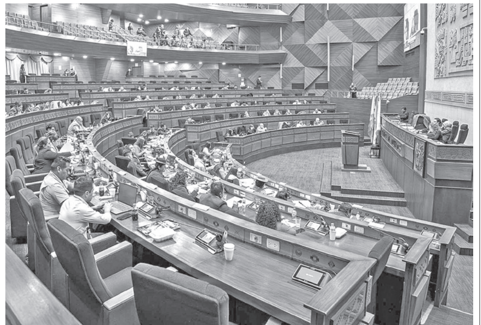
La Asamblea Legislativa Plurinacional, en su nuevo espacio. CAMARA DIPUTADOS

Cuestionó, a su vez, la labor fiscalizadora del propio proponente de la política de reducción y austeridad. La iniciativa de una “dieta universal” legislativa de 10 mil bolivianos se presenta en una semana marcada por gestos simbólicos de austeridad, como la devolución voluntaria de chips telefónicos por parte de algunos parlamentarios, aunque la presión ciudadana exige reformas estructurales al gasto público en medio de la coyuntura económica que azota a la población en general. En diciembre, el senador Véliz presentó un proyecto de Ley para reducir hasta en 50 por ciento las dietas y los sueldos de las principales autoridades del Estado. La propuesta no solamente afecta a legisladores, sino también al Presidente, Vicepresidente, ministros, gobernadores y alcaldes, quienes perciben a partir de 15 mil bolivianos al mes.