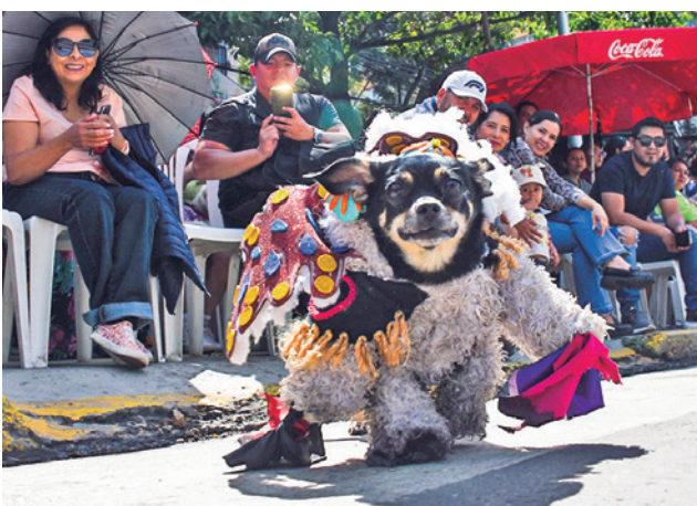
Un perrito disfrazado del osito de la diablada.

El desfile contó con el resguardo de personal municipal y voluntarios, quienes velaron