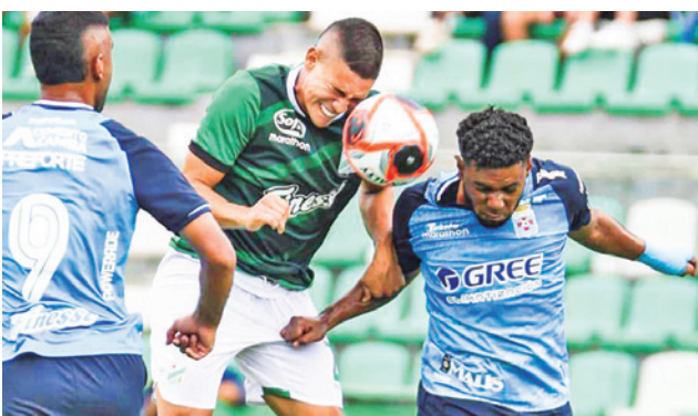
El partido entre Blooming y Oriente Petrolero.

El clásico cruceño que se jugó ante más de 25 mil personas terminó con una pelea y dos expulsados, Gil-