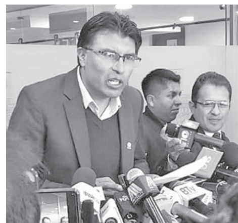
El diputado Nilton Condori.