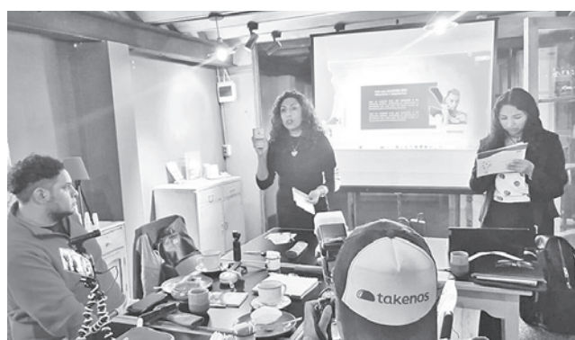
La presentación del estudio económico. SUMANDOVOCES

ceder a créditos bancarios formales, viéndose obligadas a depender de sus propios ahorros o de préstamos informales con altos intereses. Esta exclusión responde a una combinación de factores estructurales, entre los que destacan la falta de garantías, la informalidad de