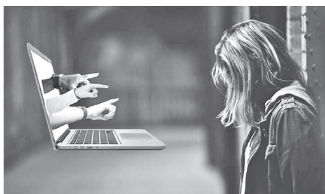
La exposición a la violencia digital. RRSS

como el grupo más afectado. Entre los factores de mayor riesgo se identifican la baja supervisión de los padres, la soledad que experimentan las víctimas y la alta exposición a contenido sexual en internet.