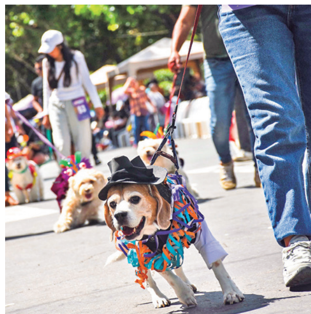
Una mascota disfrazada de cochalito en Carnaval.