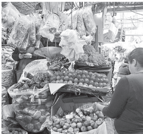
La oferta de productos en los mercados.