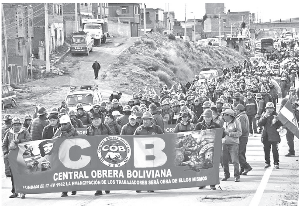
Una protesta de la Central Obrera Bolivia a inicios de 2026. COB

“El financiamiento de lo que se llama el bono PEPE va a ser pagado con los recursos de nuestra jubilación”, señaló. Con este incremento que anunció Paz al mínimo, Bolivia se ubica en la media de los países de la región, donde se calcula que el promedio se acercará a los 400 dólares. El 20 por ciento de aumento será uno de los más altos respecto a los países vecinos que