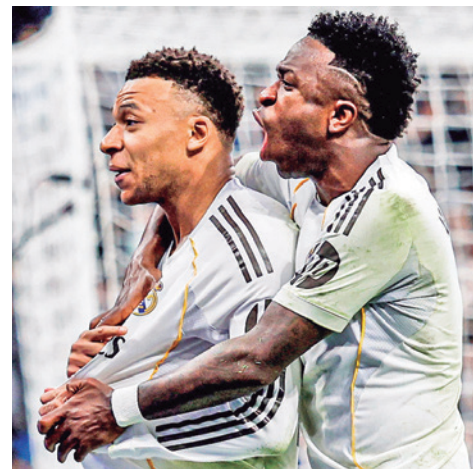
El francés Mbappé en el Real Madrid.