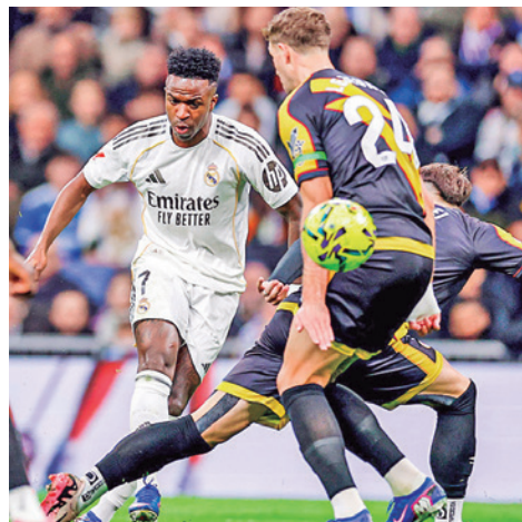
Incidencias de un partido del equipo.