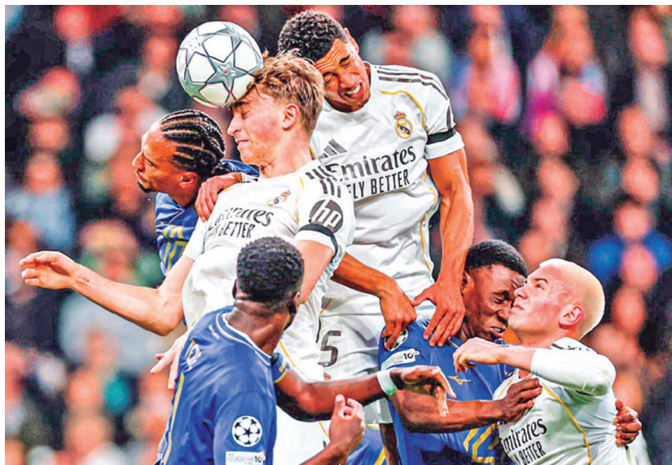
Un partido del Real Madrid, que pasa por un mal momento.

El Real Madrid es el club más exitoso de la historia del fútbol, consiguió su primera Copa de Europa en 1956. Sería la primera de cinco copas consecutivas que ganaría. Esta inigualable hazaña fue conseguida en parte gracias a uno de los más grandes futbolistas de la historia, Alfredo Di Stéfano, bajo la presidencia de Santiago Bernabéu. En 2017 se convirtió en el primer equipo que repetía título bajo el formato Champions.