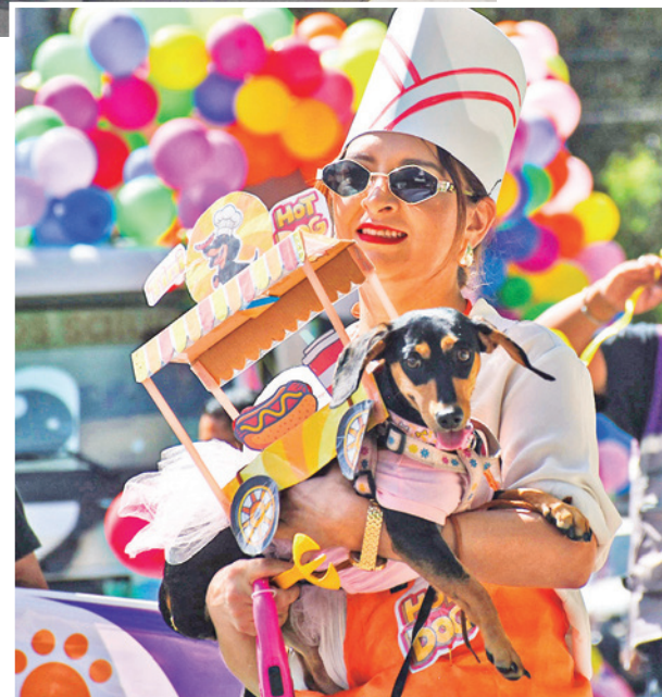
Un salchicha, sí con una alegoría de “perros calientes”.

Reyes Villa anunció que en los próximos días continuarán las actividades oficiales con el Corso Infantil, la coronación de la Reina Infantil y la Feria del Puchero.