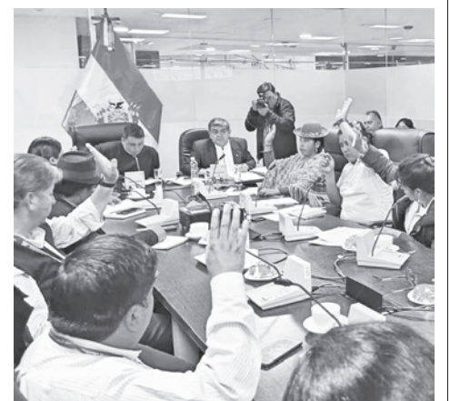
El salario de los legisladores generó polémica. CAMARA DIPUTADOS