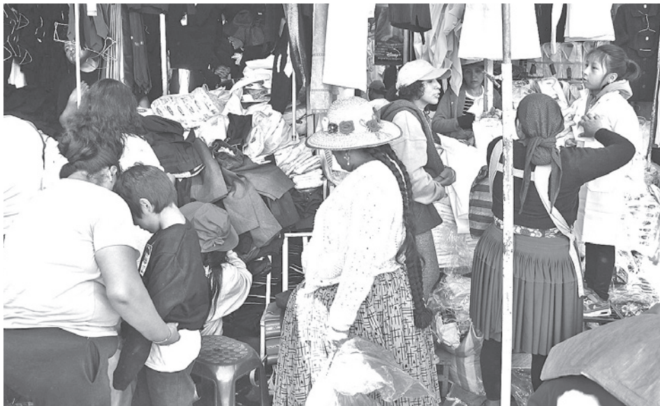
La venta de uniformes escolares en el mercado central de Cochabamba. JOSE ROCHA

“Desde el inicio de la presente gestión, el Ministerio sostuvo, de manera constante, un diálogo transparente, respetuoso y basado en la confianza con la