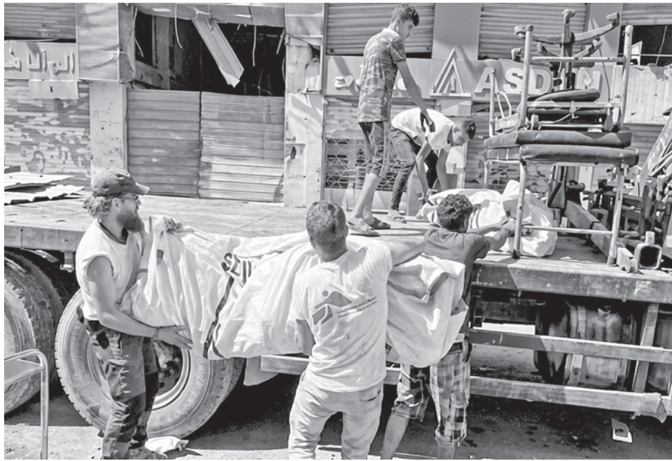
El trabajo de Médicos Sin Fronteras en Gaza durante el conflicto con Israel.

"Ayuda humanitaria, sí. Ceguera en materia de seguridad, no. Lamentablemente, MSF vuelve a demostrar una falta de transparencia y a actuar motivada por intereses irrelevantes", dijo el ministro Amichai Chikli en el comunicado. En diciembre, el Ministerio había indicado que prohibiría a 37 organizaciones humanitarias, entre ellas MSF, operar en Gaza a partir del 1 de marzo por no haber proporcionado información detallada sobre su personal palestino. Según el ministerio israelí, dos empleados de MSF tenían vínculos con el movimiento islamista pales-