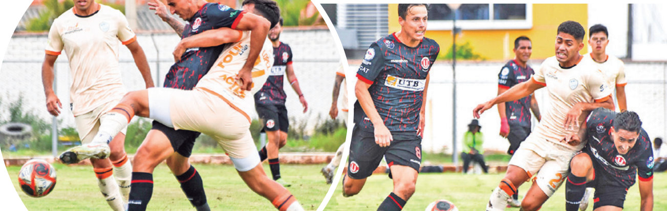
Aurora y Universitario empataron, ayer.