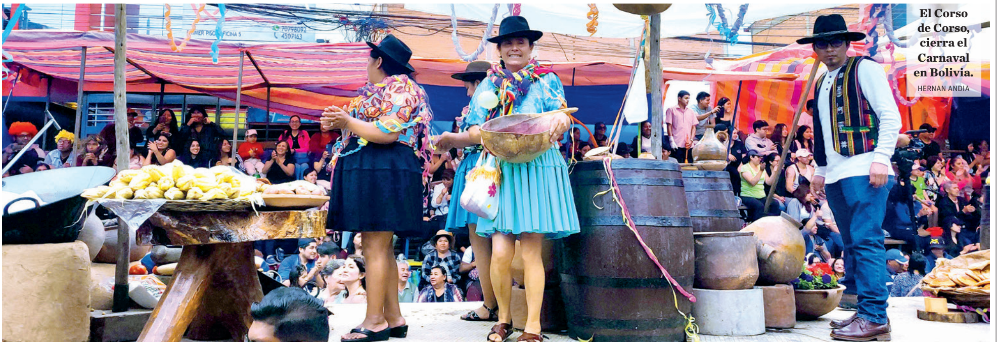
El Corso de Corso, cierra el Carnaval en Bolivia. HERNAN ANDIA