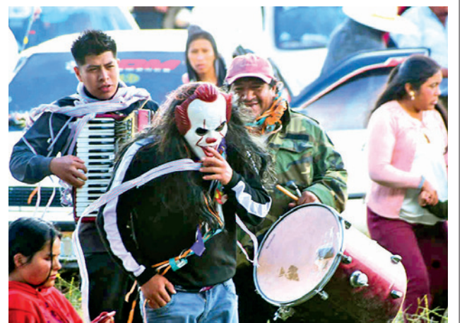
Taquipayanakus en Tutimayu, Sacaba. CARLOS LOPEZ

15 y el 23 de febrero, cerrando el 16 de marzo en Sarco-bamba. Mizque cerrará con su entrada carnavalera el 15 de febrero y actividades como armado de khopuyos, coplas y comparsas el 17 de febrero