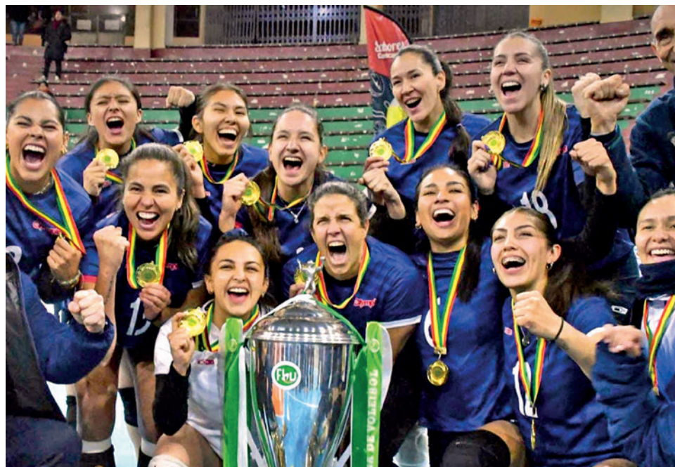
El festejo del Club Olympic que competirá internacionalmente en 2026. CLUB OLYMPIC

La Confederación está encargada de verificar los escenarios antes de ratificar una sede