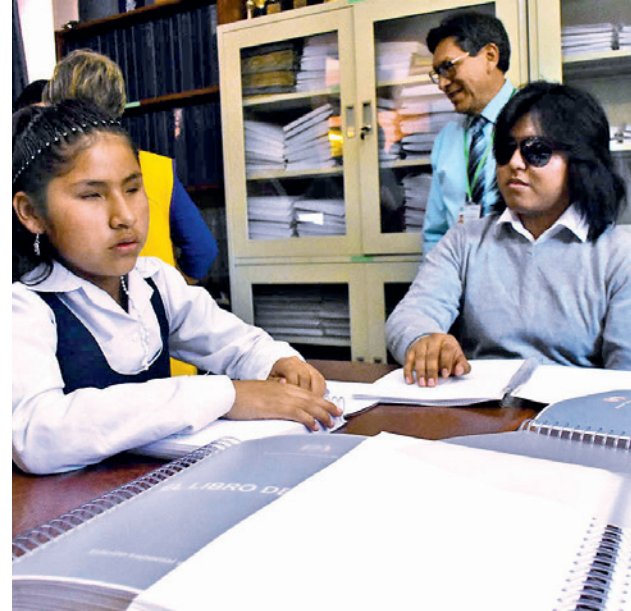
La normativa establece el fortalecimiento de la educación inclusiva. CARLOS LÓPEZ