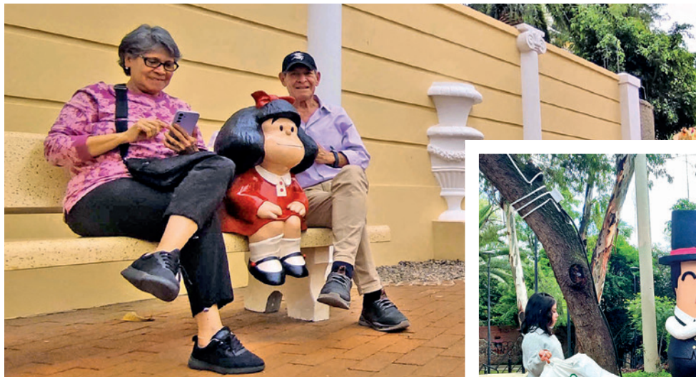
El Pasaje Portales tal como luce ahora. DANIEL JAMES