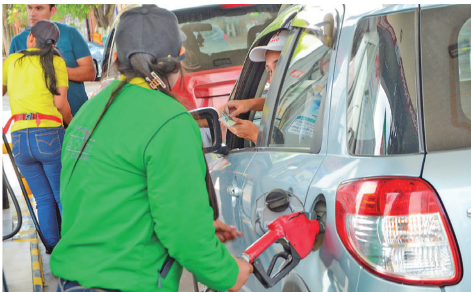
El carguio de combustibles en las estaciones de servicio en Bolivia.

de la norma, la exención tributaria se sustenta en el marco legal vigente, que establece que únicamente la ley puede otorgar o suprimir beneficios fiscales, y que la exención constituye una dispensa expresa de la obligación tributaria.