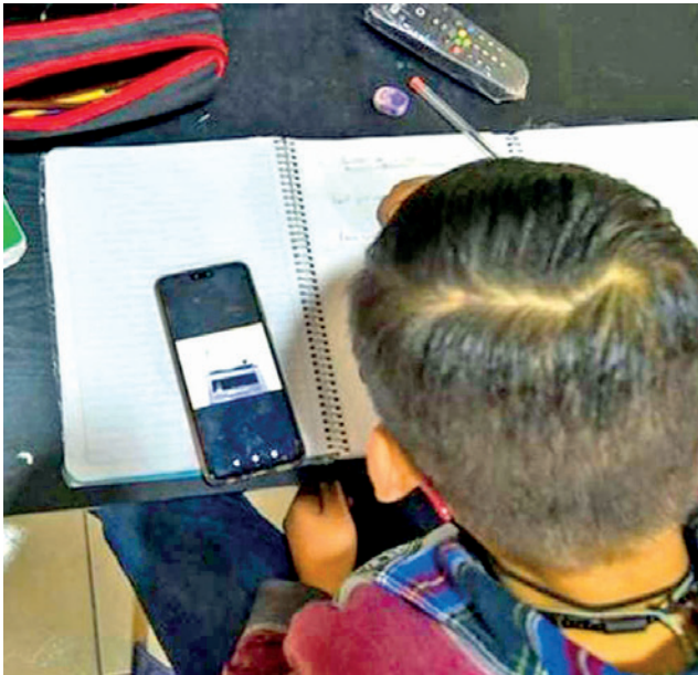
La reglamentación vigente prohíbe el uso de teléfonos celulares en el aula para estudiantes y profesores. RRSS