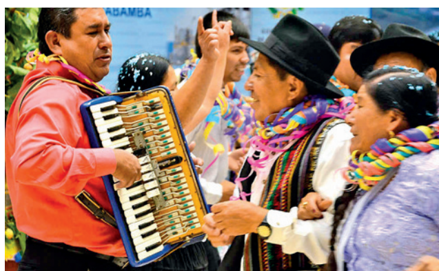
Taquipayanakus de Tiataco, valle alto. JOSE ROCHA