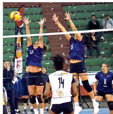
Un partido del Club Olympic.