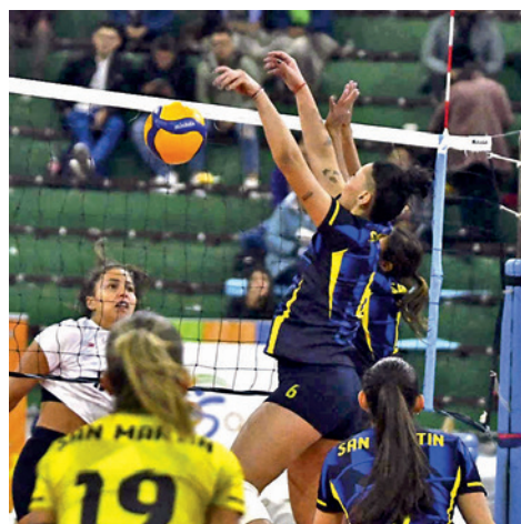
Incidencia de uno de los partidos. RRSS