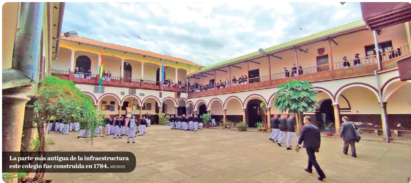
La parte más antigua de la infraestructura este colegio fue construida en 1784.