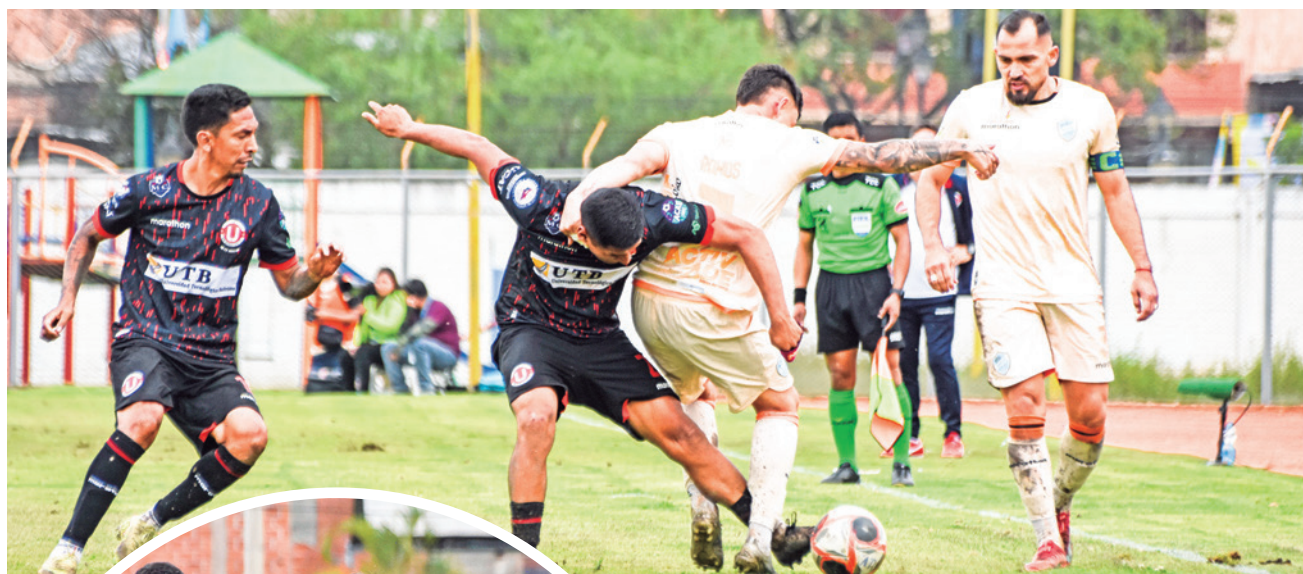
El partido entre Aurora y Universitario de Vinto.

Intenso. En un partido de ida y vuelta con el “manzanero” como el mejor en el primer tiempo y con el Equipo del Pueblo que se repuso y sobre el final intentó marcar diferencia