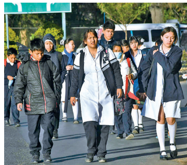
Estudiantes retornan a clases a partir del 2 de febrero en unidades educativas del país.

En el ámbito de la evaluación, el sistema de calificación presenta modificaciones, el rendimiento de los estudiantes se medirá en tres dimensiones: Ser (10 puntos), Saber (45 puntos) y Hacer (40 puntos), priorizando no solo el conocimiento teórico, sino también las habilidades prácticas y la formación en valores dentro del proceso educativo.