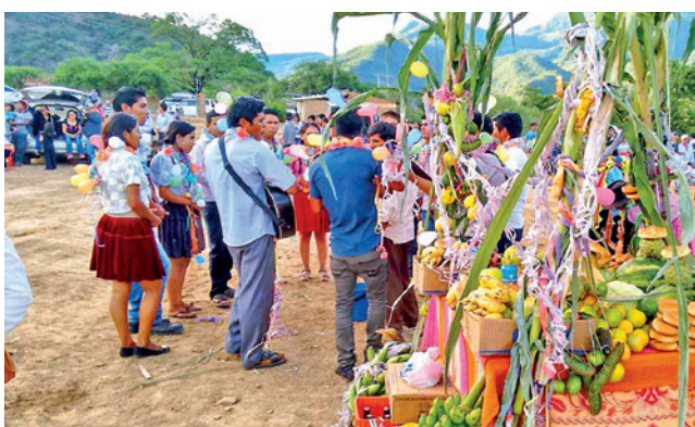
Los Khopuyos en el municipio de Aquile. RRSS

Así, Cochabamba demuestra que su Carnaval no es solo una fecha en el calendario, sino una expresión colectiva de cultura, tradición y alegría compartida.