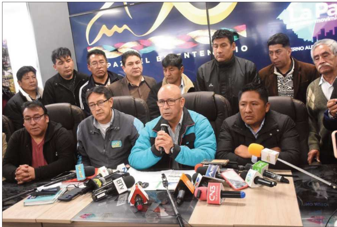
MEDIDA. Los estudiantes tendrán esta tarifa especial de lunes a viernes de 7.00 a 20.00.

TARIFAS. “En los otros medios de transporte, como trufis y servicios exclusivos como taxis, no existe tarifa diferenciada para ninguno de los sectores vulnerables de la ciudadanía”, indicó Millares.