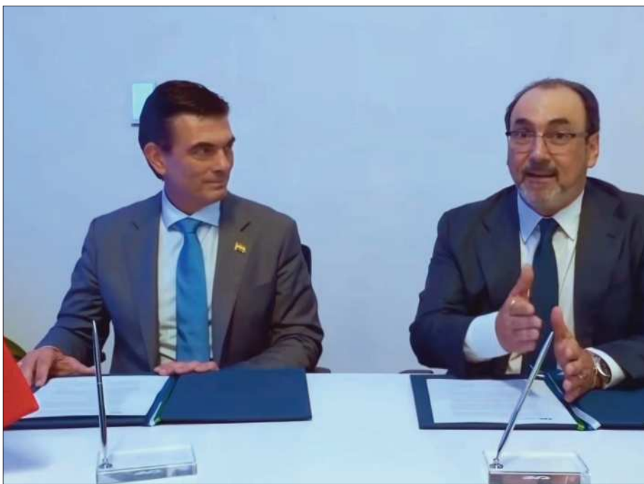
CAPTURA DE PANTALLA

REUNIÓN. El presidente Rodrigo Paz y el titular de CAF, Sergio Díaz-Granados durante su encuentro en Panamá.