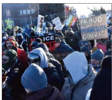
Manifestantes en Minneapolis

Miles de manifestantes llenaron las calles de la convulsa Minneapolis