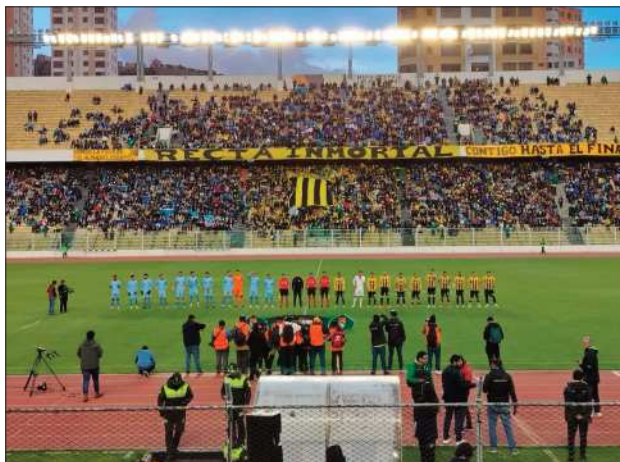
CIVISMO. En el Superclásico se cantó el Himno a Bolivia