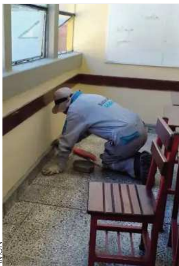
Refacciones en una escuela.