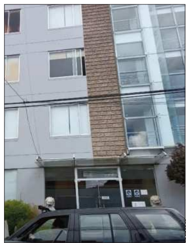
Las oficinas de la empresa china.

La Fiscalía secuestró documentos por la obra de más de $us 400 millones.