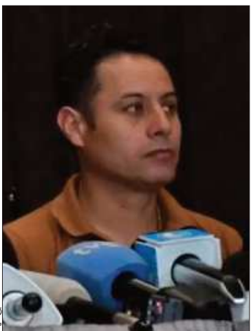
El vicepresidente Edmand Lara.

En diciembre del año pasado, Lara se declaró oposición al gobierno