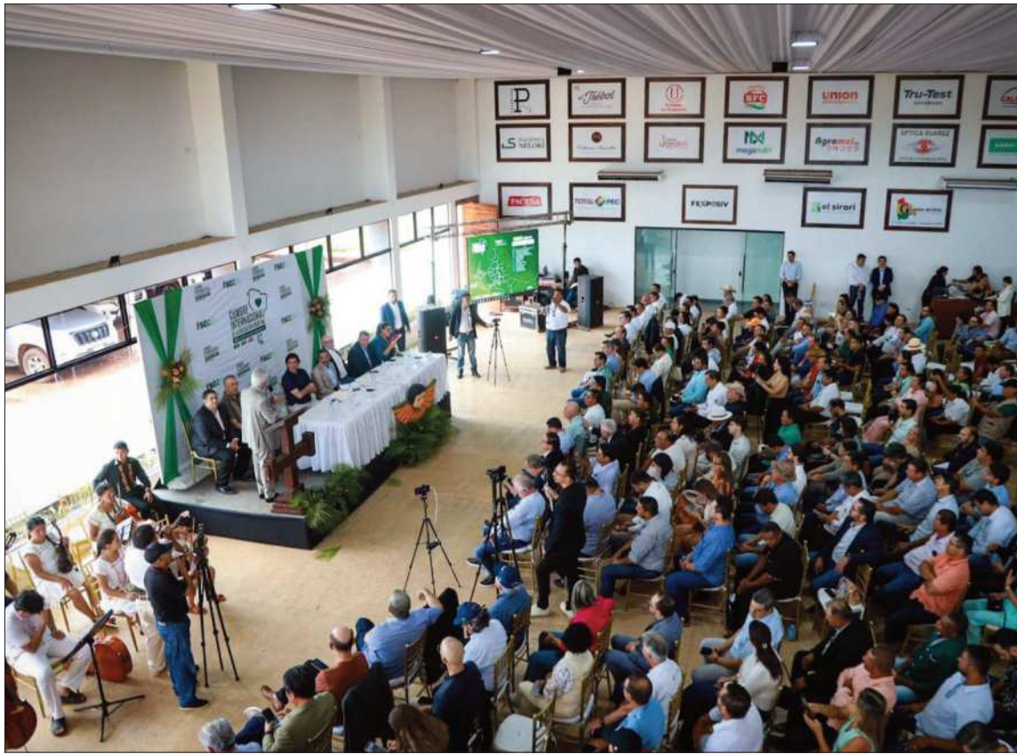
COMITIVA. La delegación de Paraguay que participó en la cumbre realizada en San Ignacio de Velasco.