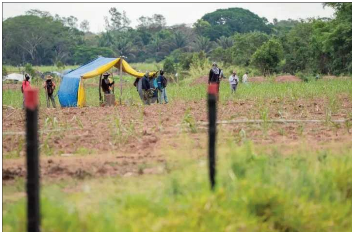
PRESENCIA. La fotografía muestra a un grupo de avasalladores en un predio privado,

El viceministro adelantó que se trabajará para hacer cumplir la ley, garantizar el derecho propietario y realizar cambios en autoridades, además de transparentar información y despolitizar la gestión. “Vamos a hacer los cambios que sean necesarios que haya en las cabezas del INRA y del personal que tiene el INRA, cumpliendo lo que la norma dice, estableciendo