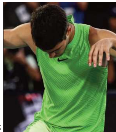
El tenista español Carlos Alcaraz.

Por ahora, la estrella serbia, ex-número uno mundial que es actualmente el cuarto del ranking ATP, es el hombre con más títulos del Grand Slam (24), igualado con los que logró en la categoría femenina la australiana Margaret Court.