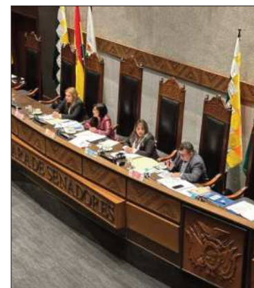
La Cámara de Senadores.

Posteriormente, el Tribunal Constitucional Plurinacional, a través de la Sentencia Constitucional 0020/2023, declaró inconstitucionales los artículos 3.III, 4.I, 4.II y 4.III de la Ley 1350.