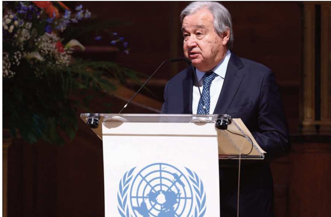
CRISIS. La ONU es el único organismo que puede autorizar el uso de la fuerza, asegura Guterres

“Ya se han anunciado oficialmente decisiones de no honrar contribuciones obligatorias que financian una parte significativa