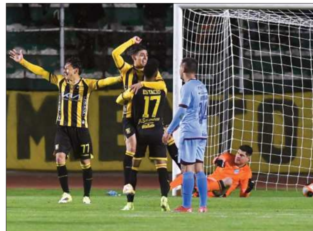
ATIGRADOS. Los stronguistas celebran el empate.