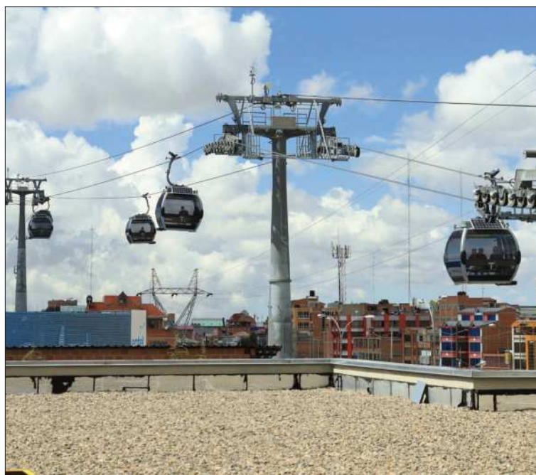
TRANSPORTE. La experiencia de Mi Teleférico podría exportarse.

La postulación forma parte de la estrategia estatal de proyección internacional de empresas públicas bajo la política "Bolivia para el mundo", que busca exportar conocimiento técnico y fortalecer la presencia del país