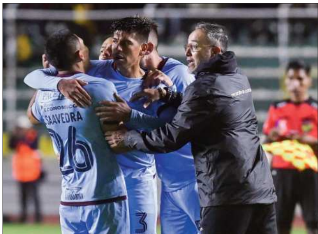
ACADÉMICOS. Los celestes festejan el gol de 'Caute'.

Superclásico. Ante cerca de 25.000 aficionados se jugó el primer gran duelo paceño. El cuadro del DT Robatto se llevaba el triunfo, pero el de Villegas igualó al final, pese a ser superior