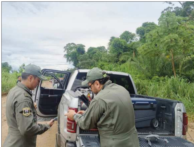
OPERATIVO. La policía llegó hasta Las Londras.

do un perfil adecuado para cada cargo”, señaló. De igual manera, remarcó que los operativos contra los avasallamientos continuarán y pidió el acompañamiento del Ministerio Público para actuar con prontitud contra la toma ilegal de tierras. “Tenemos mucha preocupación de que tengamos datos, vamos a decir, alterados, pero por eso vamos a hacer una auditoría rápida, entendiendo que el 85% de los avasallamientos están en Santa Cruz, tenemos unidades productivas en Cochabamba avasalladas; tenemos a la nación chimana avasallada, en San Borja, Beni, avasallada. De acuerdo con Vaca Díez, todavía resta un 6% de tierras para sanear.