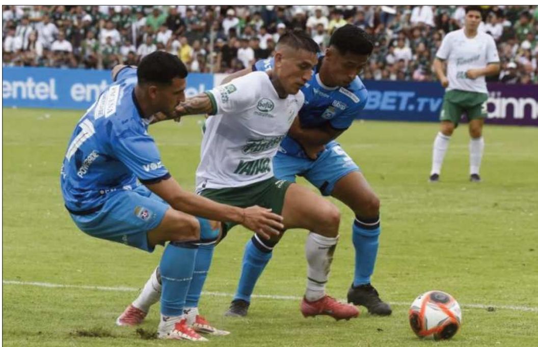
ANTAGONISTAS. Incidencia anterior de un clásico cruceño entre Oriente Petrolero y Blooming.