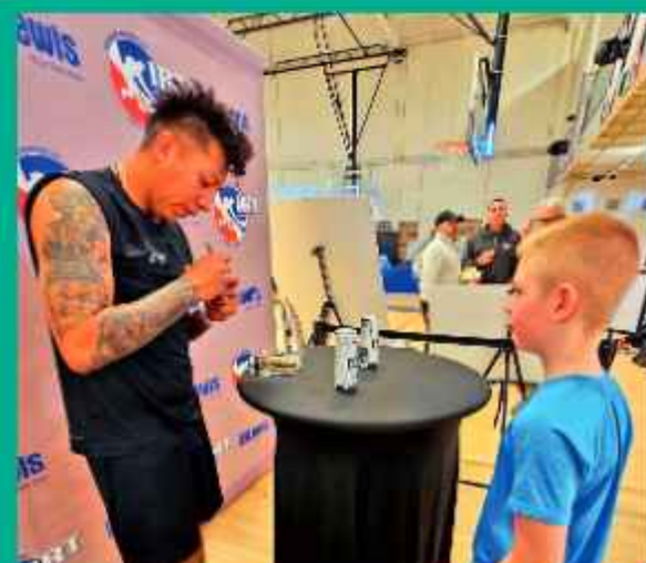
AUTÓGRAFO. El campeón junto a un niño quien le pidió su firma.

El raquetbolista fue campeón del torneo clasificatorio que se desarrolló en Sucre.