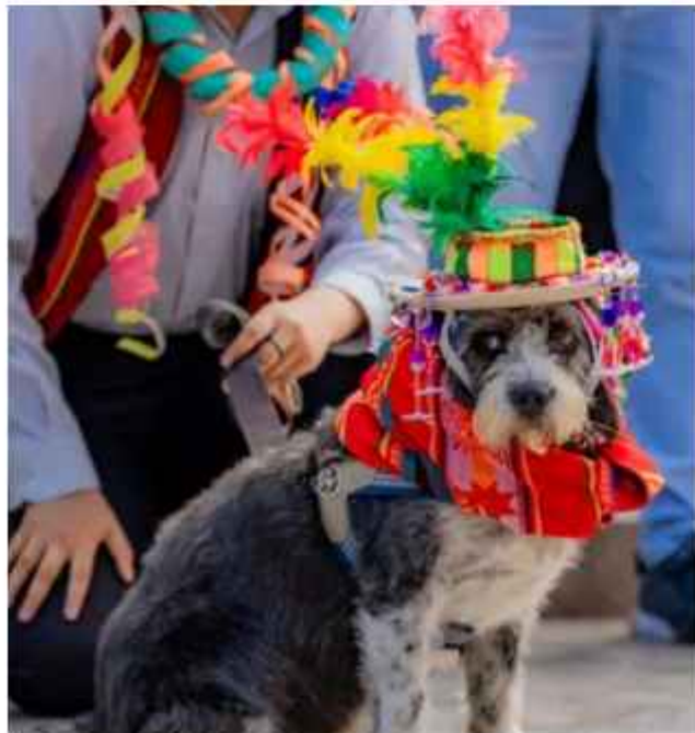
FIESTA. Un perrito debidamente caracterizado.