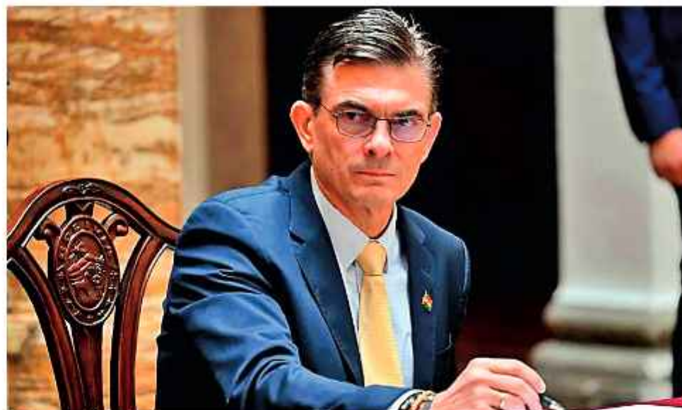
MANDATARIO. El Presidente de Bolivia recurrió a herramientas tecnológicas.

También se consideró otros hidrocarburos y mencionó desechos de aceites; aceites