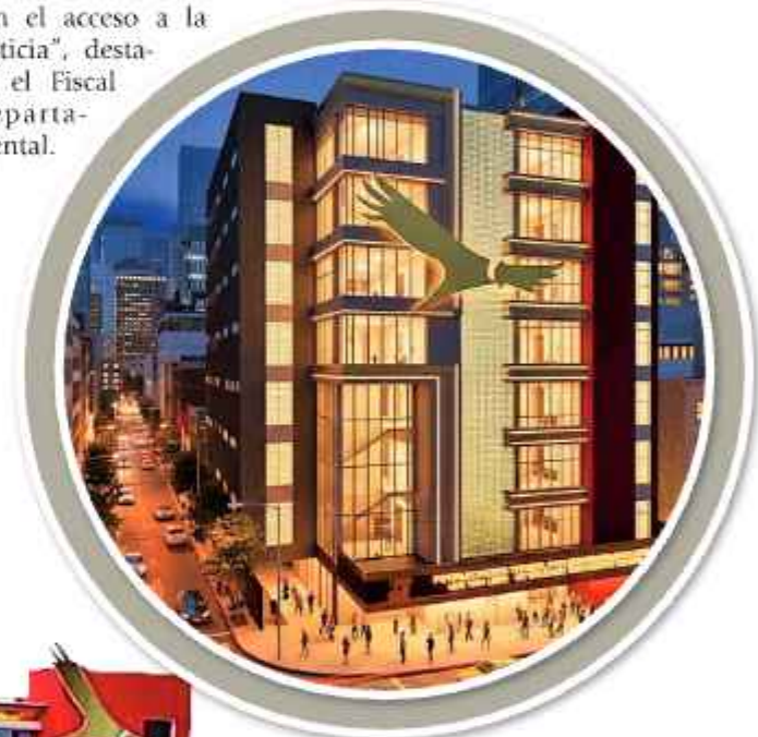
OBRA. La maqueta del nuevo edificio.

Con la infraestructura también se prevé evitar traslados innecesarios de las personas a la ciudad de La Paz, así como para los comunarios de las 20 provincias.