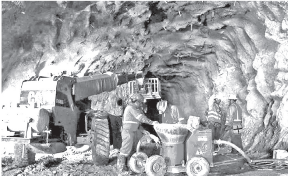
La explotación de minerales en los centros de producción del país. RRS5

Según explicó, las comercializadoras venden minerales en el extranjero y reciben el pago en dólares. Pero esos mismos dólares no ingresan a Bolivia, sino se venden en el extranje-