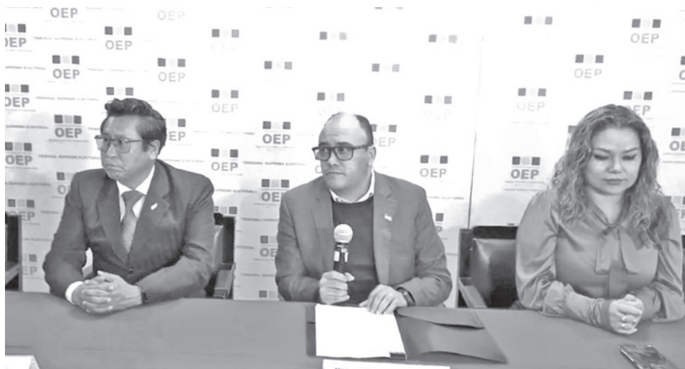
El presidente y los vocales del TSE en reunión de Sala Plena.