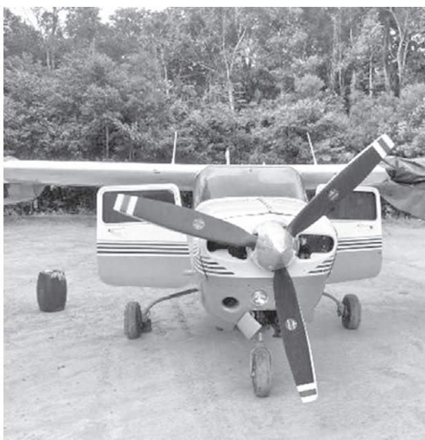
La avioneta en Brasil con droga boliviana. RRSS

El operativo estuvo compuesto por la Policía Federal, la Policía Federal de Carreteras, la Secretaría Estatal de Seguridad Pública, la Policía Civil de Amazonas, la Policía Militar de Amazonas, la Secretaría Ejecutiva-Ad-junta de Inteligencia, la Secretaría de Administración