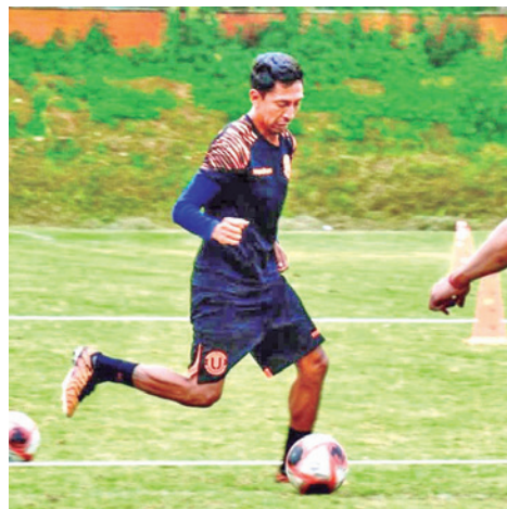
La preparación para la pretemporada.