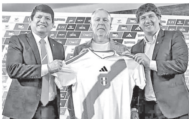
El entrenador brasileño Menezes, llega a Perú. FPF

Los pergaminos del ilustrado responsable técnico, de 65 años, han sido determinantes para que desde las oficinas de la FPF se decantaran en su contratación. Entre su amplio