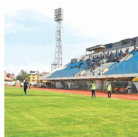
El estadio de Quillacollo.