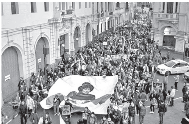
Protesta contra Jerí en el centro de la capital peruana.

protesta que se prolongó hasta la noche, sin que se produjeran enfrentamientos.