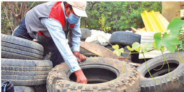
La destrucción de criaderos de mosquitos. DANIEL JAMES

Dato. El Sedes alertó que 20 de cada 100 viviendas inspeccionadas en Cochabamba presentan criaderos de mosquitos