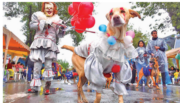
El pasado Corso de Mascotas, en El Prado. JOSE ROCHA

Entre las principales recomendaciones, Vallejo instó a la población a eliminar o tapar todos los recipientes con agua, como turriles, baldes y llantas, y acudir de inmediato a un centro de salud ante síntomas sospechosos. Aclaró que la reproducción del mosquito ocurre principalmente en las viviendas y en áreas con vegetación.