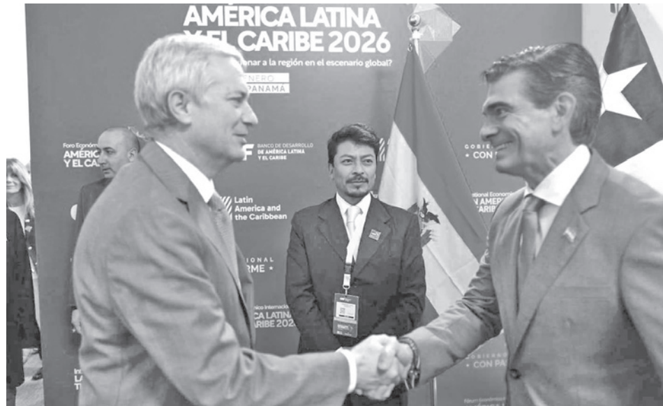
El presidente electo de Chile, José Antonio Kast, y Rodrigo Paz, ayer en Panamá.

te boliviano calificó el diálogo como “franco y fraterno” y enfatizó que, más allá de los factores históricos, ambos países comparten la necesidad de enfocarse en el desarrollo de sus pueblos.