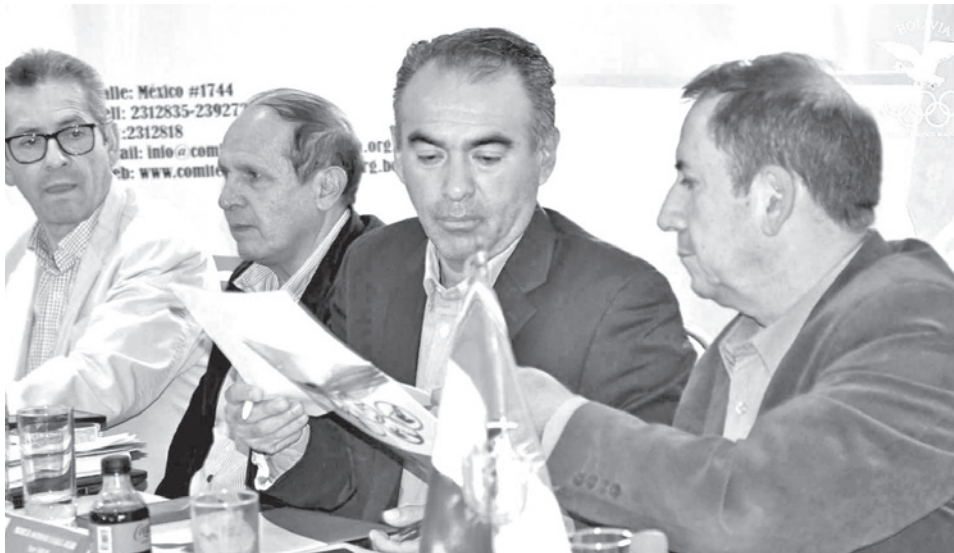
La Asamblea Ordinaria del COB en la que estuvo el viceministro de Deportes. COB