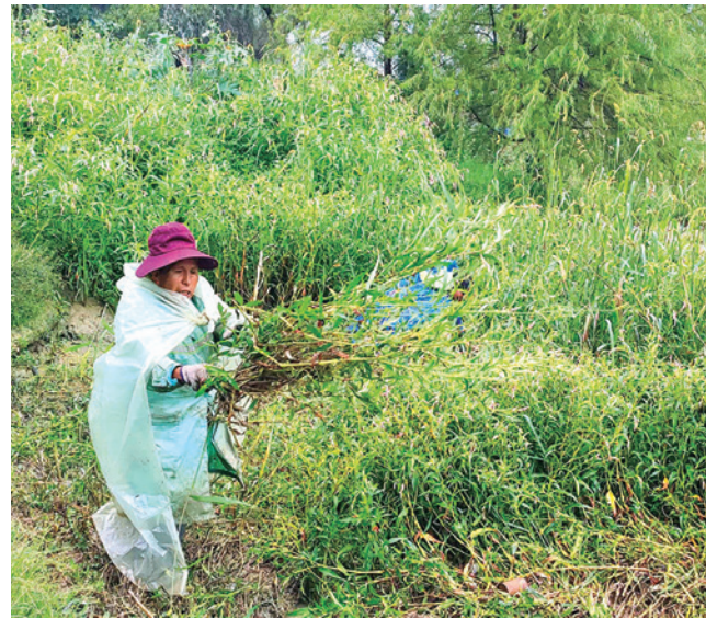
Las mujeres del Plane cortan la maleza en la laguna.

Dato. La laguna de Coña Coña, alimentada por las torrenteras Pajcha, Pinto Mayu y Taquiña, debe recibir mantenimiento durante la temporada de lluvias para evitar colapsos e inundaciones en zonas bajas