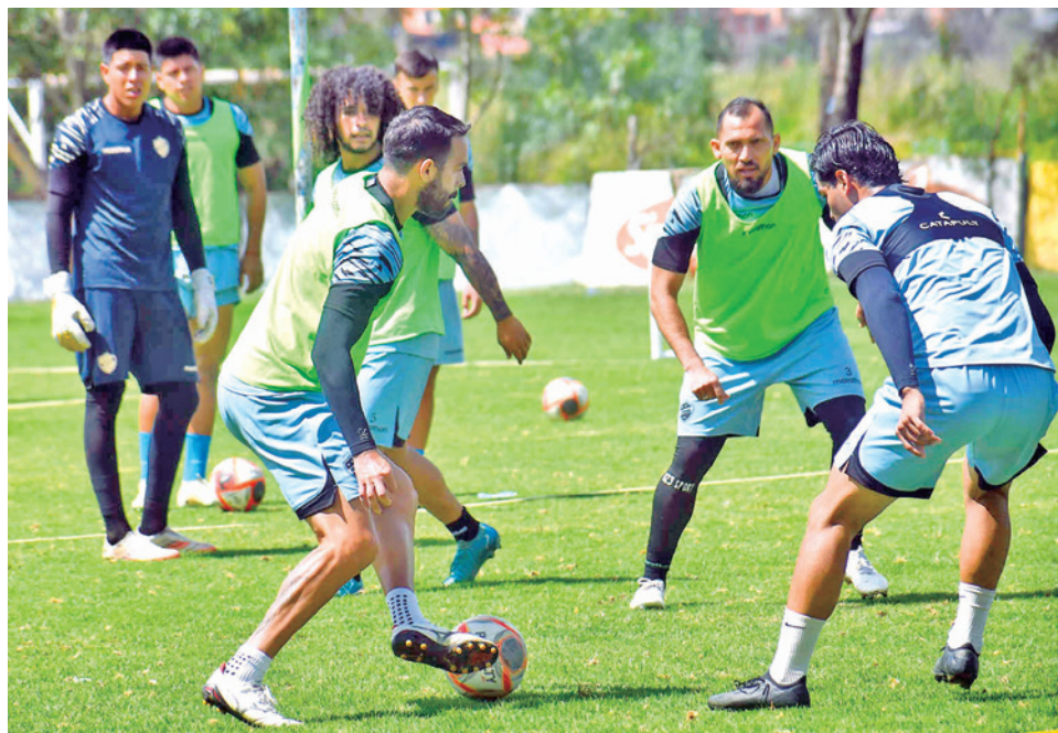
El entrenamiento de Aurora para el Copa de Verano.

La Dirección de Competiciones de la FBF hizo conocer anoche que se decidió suspender el partido de Tarija debido al "incumplimiento reglamentario por parte de Independiente que se presentó con miembros de su plantel afectados por una prohibición".