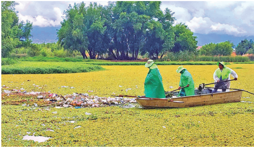
Los trabajos de limpieza en la laguna de Coña Coña, en la zona oeste.