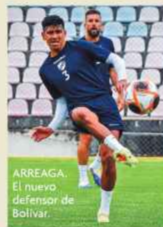
ARREAGA. El nuevo defensor de Bolívar.

"Es un jugador diferente Mister Show Time", dijo el Presidente de la entidad, quien no duda de que podrá ser habilitado para la Copa Libertadores de América.