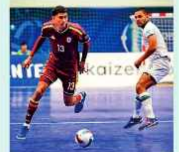
PARTIDO. Jugadores de Colombia y Bolivia en el choque de la Copa América.

La Vinotinto sumó nueve puntos, deberá definir su posición en la tabla el jueves, en el partido ante Brasil por la Serie B. En caso de ganar la canarinha en semifinales se enfrentará con el segundo del Grupo A.