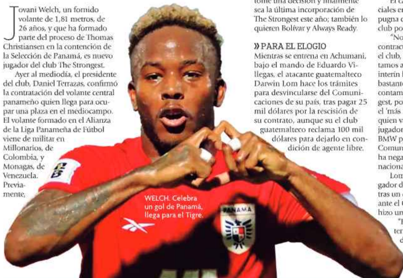
WELCH: Celebra un gol de Panamá, llega para el Tigre.

Los jugadores de Bolívar retornarán a La Paz en las primeras horas de este jueves y esta tarde se entrenarán en las instalaciones de Ananta, donde el entrenador definirá el equipo que se enfrentará a The Strongest, este viernes.