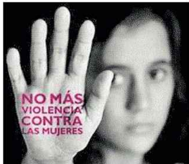
VIOLENCIA. La imagen sólo tiene finalidad ilustrativa.

Las autoridades judiciales y policiales investigan tres casos de violación en contra de adolescentes que se denunciaron en el país.