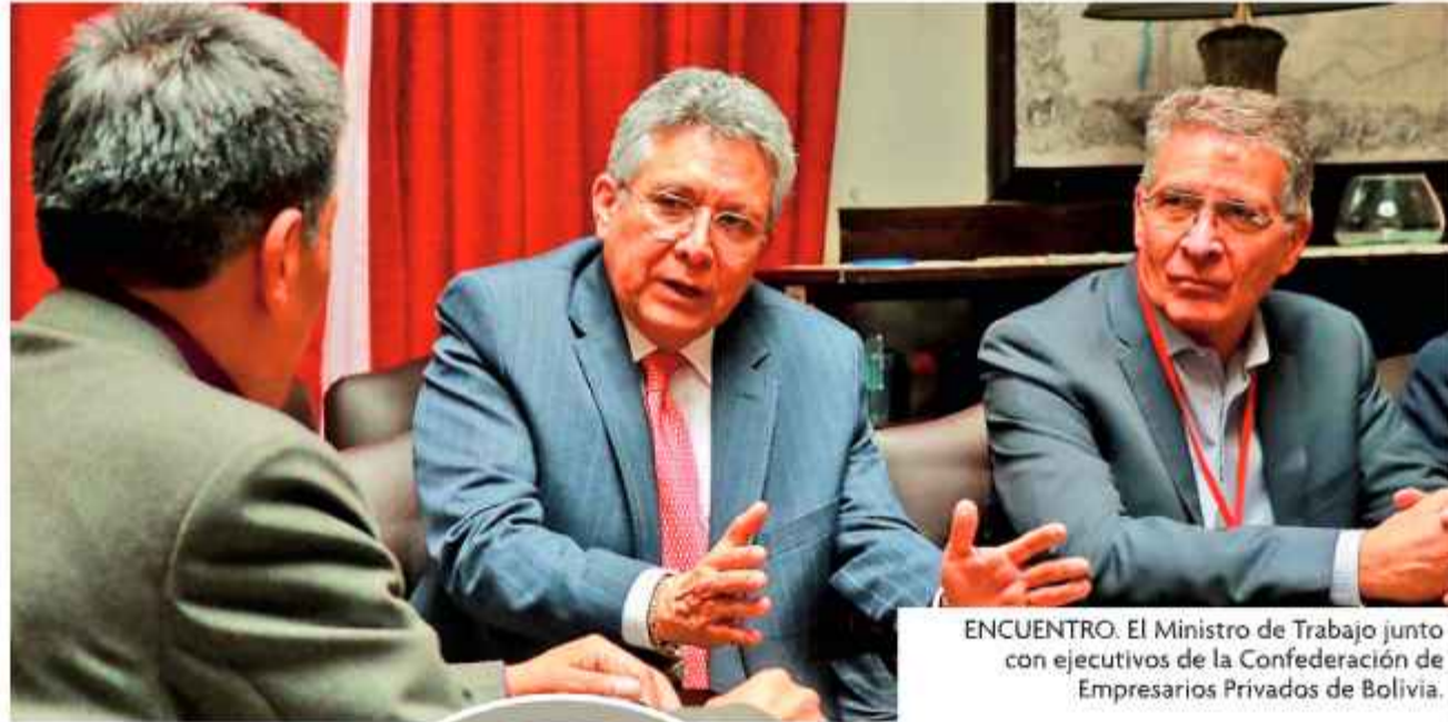
ENCUENTRO: El Ministro de Trabajo junto con ejecutivos de la Confederación de Empresarios Privados de Bolivia.

La determinación del Ministerio de Trabajo establece que esta negociación "no constituye materia de reglamentación en la pre-