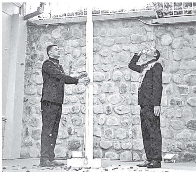
La iza de la bandera de la India.