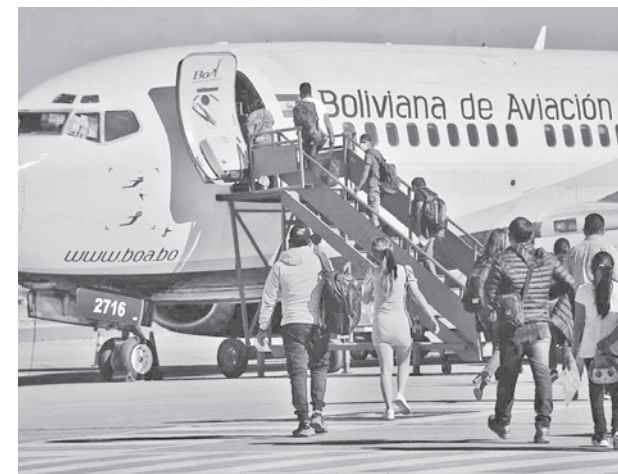
Viajeros en el aeropuerto en Cochabamba. CARLOS LÓPEZ

Asimismo, se encuentran las rutas La Paz-Uyuni, 1.445; Trinidad-Riberalta, 1.020; y Trinidad-Guayaramerín, 1.004.