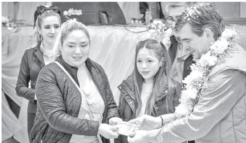
El presidente Rodrigo Paz en el inicio del pago del bono PEPE.

El viceministro del Tesoro y Crédito Público, Cristian Morales, indicó que el Gobierno nacional está destinando para este programa de protección social alrededor de Bs 2.000 millones. Asimismo, explicó que el pago será auto-