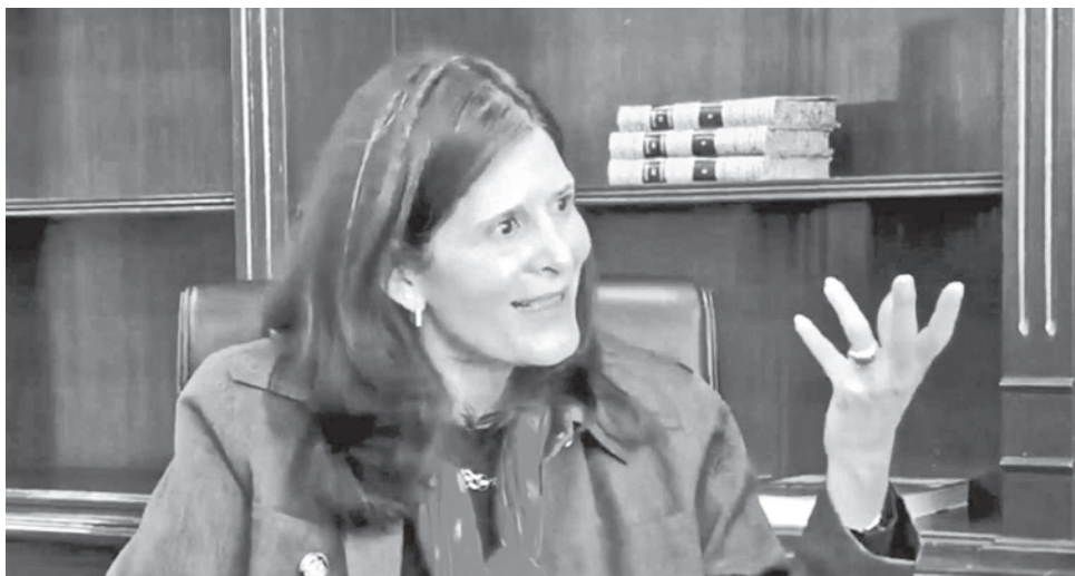
La ministra de Educación, Beatriz García.

“A partir de marzo vamos a lanzar un programa de nivelación para jóvenes del área rural entre 18 y 22 años para que puedan competir en los exámenes en igualdad de condiciones”, dijo la ministra de Educación Beatriz García. La Ministra denunció que el anterior sistema de ingreso era un “foco de corrupción”, donde los cupos para ingresar a la Normal se vendían. “Todo este sistema de ingreso a las normales era un foco de corrupción importante (...) hablan de que se vendían los cupos entre 1.000 y 5.000 dólares. Al final, era un negocio para otros entre 10 y 50 millones de dólares al año. eso ya no existe”, aseveró.