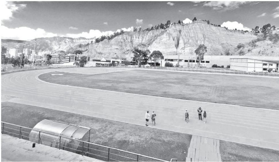
Uno de los escenarios deportivos que será evaluado.