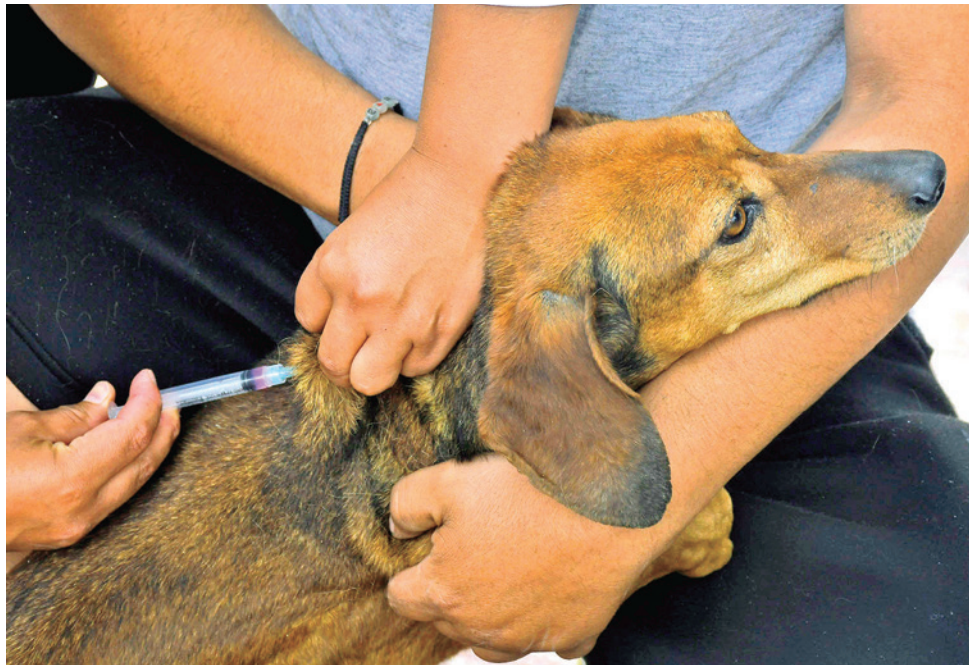
La vacuna contra la rabia canina, la única forma de prevenir la enfermedad.