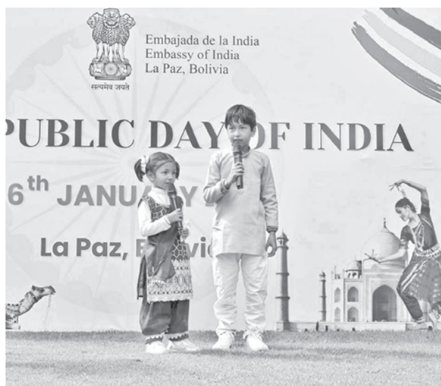
Uno de los grupos de baile y unos niños interpretan canciones.