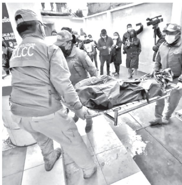
Traslado del cuerpo de la víctima en El Alto. NOTICIAS DE BOLIVIA

De acuerdo a los antecedentes, la madre de 48 años, y su hija de siete estaban caminando hacia su domicilio cuando fueron abordadas