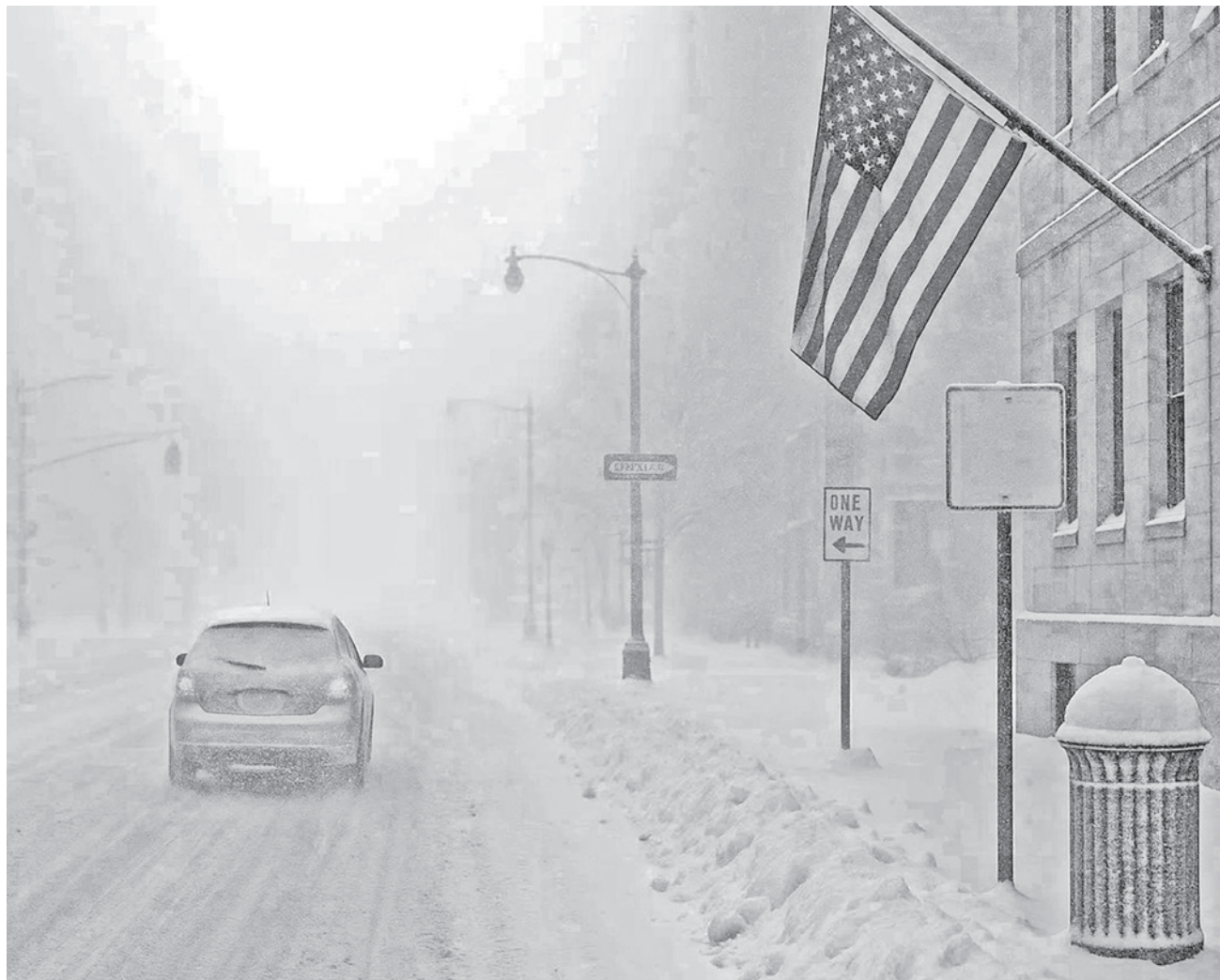
Una imagen de la nieve que cayó en varias ciudades de Estados Unidos.

Clima. Más de 270 millones de personas han estado bajo alerta meteorológica por el temporal que ha dejado temperaturas de hasta -45°C