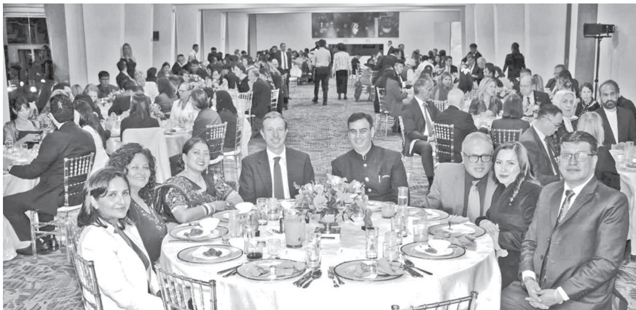
Una cena de honor en el Club de Golf de Mallasilla y un acto en su sede diplomática sirvieron para recordar este importante hito en la historia de la India.

El acto concluyó con un programa cultural que incluyó canciones y bailes interpretados por niños y jóvenes artistas de la comunidad india local.