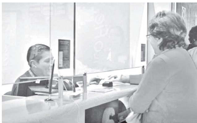
La atención en el sistema financiero. MAYFP

ministro de Economía, José Gabriel Espinoza Yáñez, dio inicio a la reposición de los dólares en un acto celebrado este lunes en una agencia del Banco FIE en Potosí.