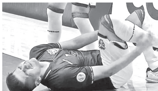
Uno de los jugadores bolivianos sufre los rigores del partido.

El Mapaizo Golf Club de Santa Cruz albergó desde el viernes hasta el domingo el evento que tuvo la presencia de unos 120 deportistas de di-