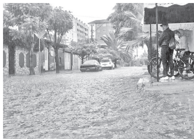
Calles anegadas de agua, tras la lluvia del domingo. D.JAMES

Tras la granizada y lluvia del pasado domingo en Cochabamba, la Unidad de Gestión de Riesgos (UGR) del departamento un plan de contingencia, despla-