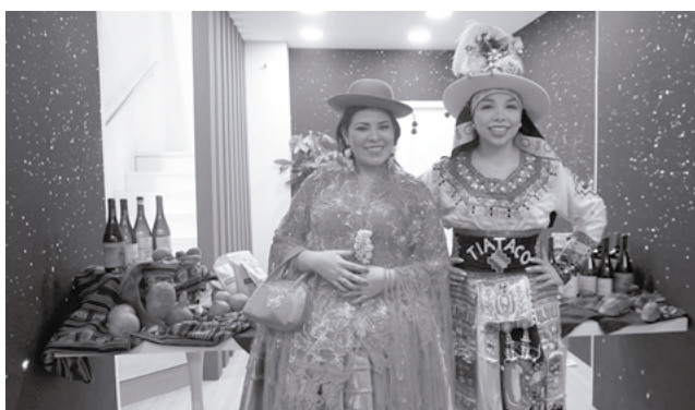
Bolivia presente en la Feria de Turismo. MINISTERIO DE TURISMO

La delegación boliviana estuvo acompañada por la ministra de Turismo Sostenible,