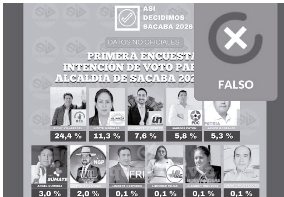
El uso de las plataformas para la "guerra sucia" en las elecciones.

La diferencia de las campañas subnacionales, sobre todo las municipales, es que son territorialmente más localizadas. Es decir, viajar, ir a los lugares para pedir el voto es más barato. Si bien las redes sociales ayudan a tener una presencia más permanente, es más fuerte que la gente pueda tener cercanía con los candidatos, hablar e, incluso, negociar. En las campañas de elección general hay mucho más dinero, se contratan estrategias. En las recientes elecciones hubo al menos seis estrategias extranjeras y otras nacionales.