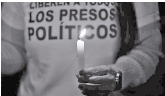
Una persona pide la excarcelación de los presos políticos en Venezuela.

"Al menos 80 presos políticos que estamos verificando han sido excarcelados el día