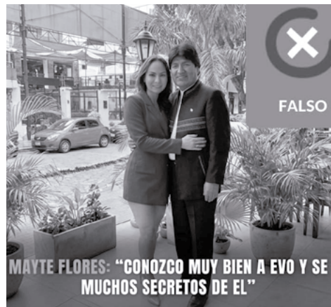
Los actores políticos usan las redes para desprestigiar.