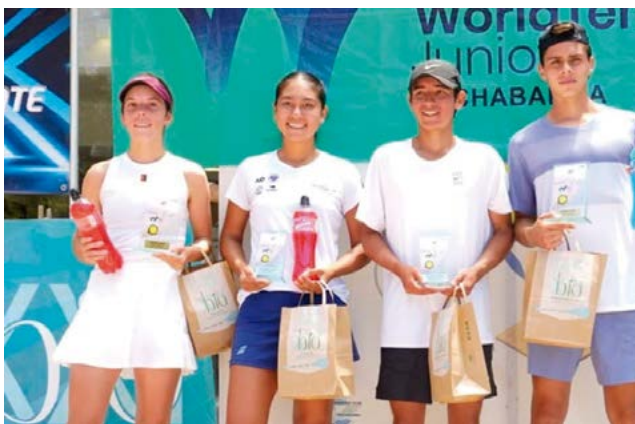
Algunos de los ganadores del torneo internacional.