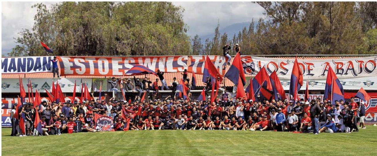
Hinchas y jugadores del club Wilstermann en el complejo de la laguna Alalay.

Réplica. El cuadro aviador asegura que la FBF solo busca “generar un temor infundado” y “sembrar pánico”