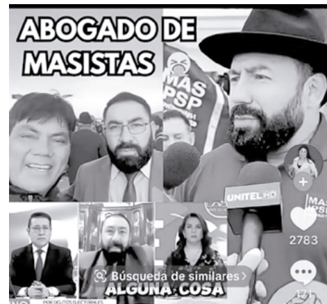
Un ejemplo del uso de RRSS.