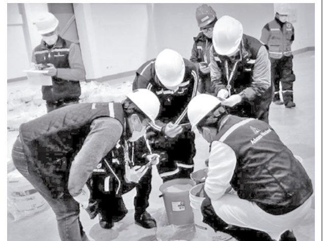
Funcionarios aduaneros examinan el carguío ilegal.

Agregó que las irregularidades en el control de equipaje son responsabilidad de las instancias correspondientes.