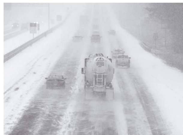
La nieve y el hielo comenzaron a paralizar algunas carreteras en Estados Unidos

El senador demócrata Chris Murphy acusó el domingo en CNN a los responsables republicanos de ser "mentirosos descarados". "Debería alarmar profundamente al público estadounidense que la administración.