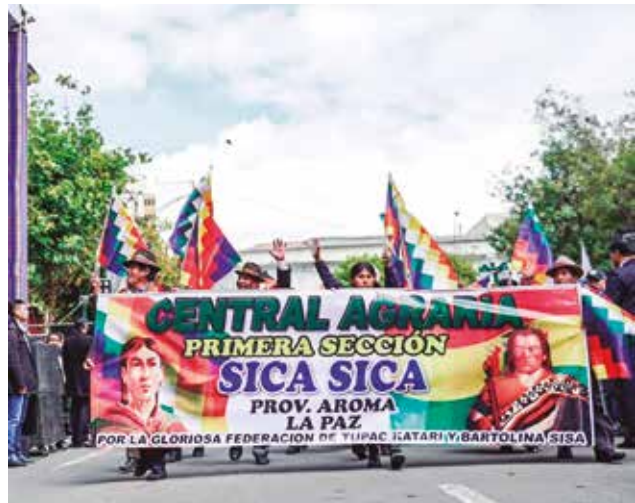
Campesinos paceños hacen su paso por el palco oficial.