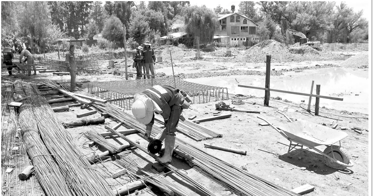
Las obras civiles del nuevo hospital de segundo nivel de Tiquipaya avanzan.

MULTIMEDIA: Conozca más detalles de los avances de las obras. www.lostiempos.com