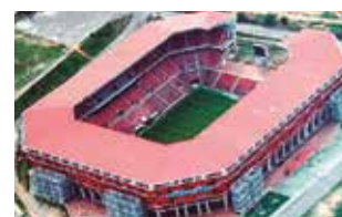
Vista del estadio Metropolitano de Lara.

El certamen Sudamericano sub-20 Venezuela 2025 comenzará hoy (17:00) con dos duelos del grupo A, ambos a jugarse en el estadio Metropolitano de Lara.