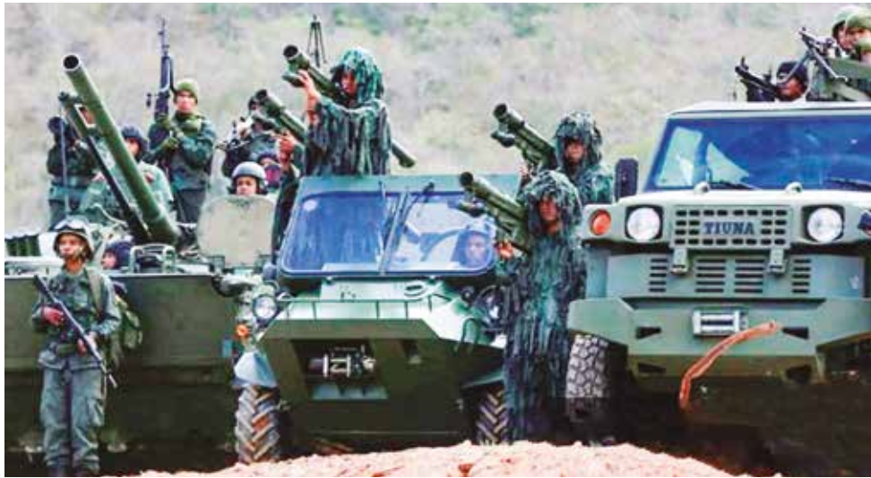
Militares venezolanos realizan ejercicios en la frontera con Colombia.

El operativo, que se extenderá hasta el 23 de enero, incluye 7.267 combatientes concentrados en Fuerte Tiuna, mientras miles de efectivos adicionales están desplegados en puntos estratégicos a lo largo del país. Este despliegue ocurre en un momento en que la violencia en Colombia ha incrementado la presión en la frontera colombo-venezolana, donde se han