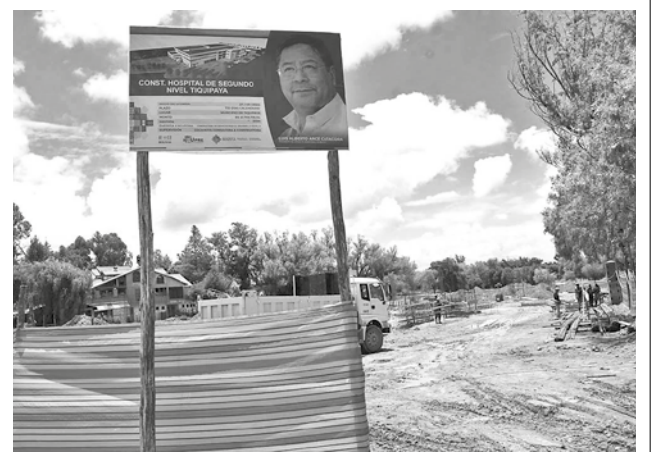
El letrero con datos técnicos del proyecto.