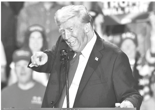
El presidente electo de EEUU, Donald Trump.

Según Urquidí, no se vislumbra ningún cambio positivo en la relación bilateral