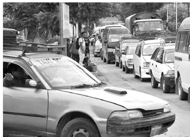
Algunos radiotaxis en las calles de Cochabamba. JOSÉ ROCHA

que se plantean es que tengan nuevos sistemas.