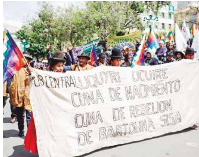
Mujeres campesinas participan del desfile en La Paz.