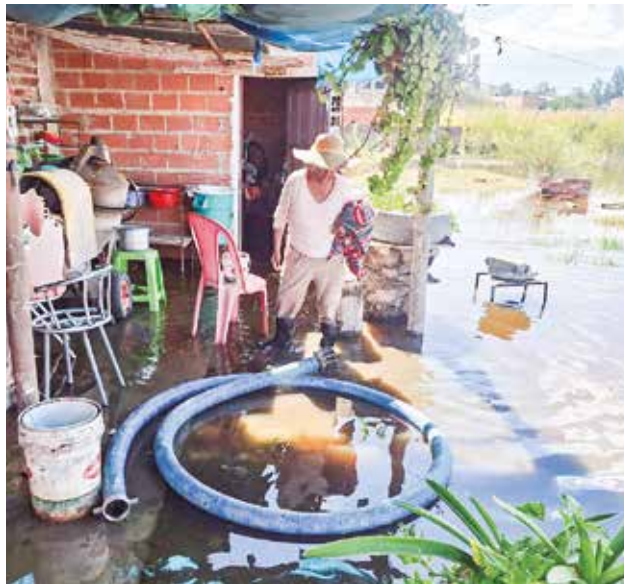
Así se hallan las viviendas en Quillacollo.

rez señaló que en 2021 elaboraron proyectos para la construcción de tres puentes, uno sobre Tuscapujio, pero el crédito no fue aprobado en la Asamblea Plurinacional.