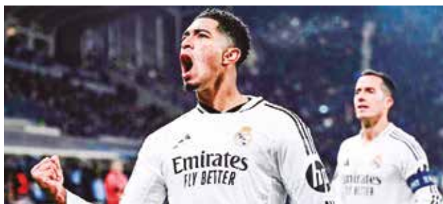
Jude Bellingham (izq.), atacante de Real Madrid, celebra con el público, ayer.

Fútbol. El Merengue mantiene sus chances de ingresar al cuadro de los ocho mejores y evitar jugar los play-offs previos a octavos