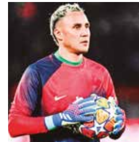
El portero tico Keylor Navas.

Newell's Old Boys asegura al portero tico Keylor Navas