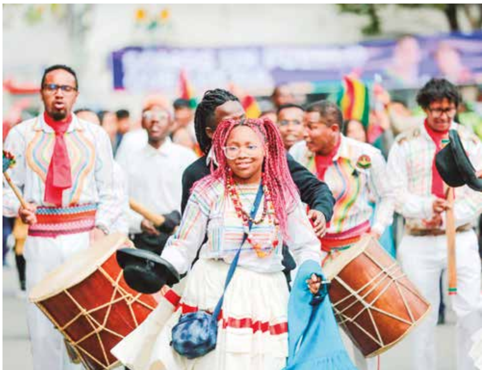
Un grupo de afrobolivianos participa del desfile, ayer.