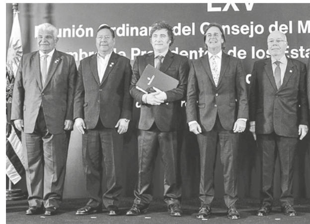
Cumbre del Mercosur en 2024, con el presidente Luis Arce presente.