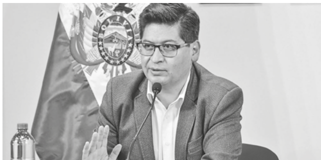
El ministro de Economía, Marcelo Montenegro.

Sectores. La Cainco interpeló al presidente y los industriales piden abrogar un artículo del PGE que prevé decomisos de los productos