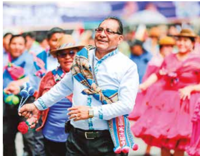
Un grupo de baile expone su danza en la celebración.