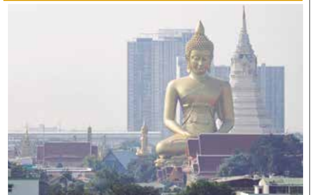
La contaminación ambiental en Bangkok.

El Catatumbo ha sido históricamente una de las regiones más afectadas por la violencia de grupos armados ilegales. Desde noviembre de 2024, la Defensoría del Pueblo había advertido sobre el incremento de amenazas contra civiles.