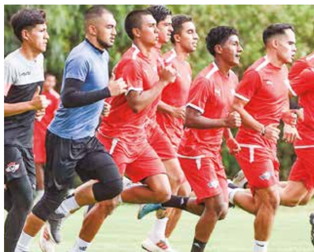
Entrenamiento del plantel de Wilstermann, en el complejo de la laguna Alalay.

San Antonio fue uno de los primeros en comenzar el trabajo. De la mano del DT Julio César Baldivieso, el Santo sumó a 11 jugadores nuevos, además de renovar con otros y prescindir de algunos otros. El club tropical palpita también