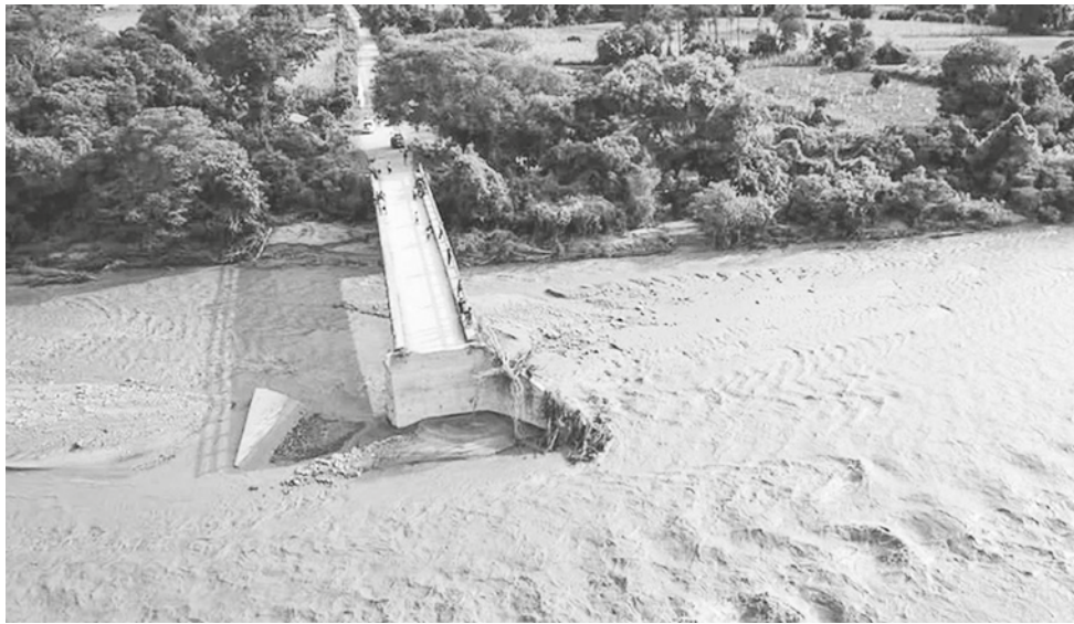
El puente caído en el río San Miguel del Bañado en Monteagudo. VISION 360