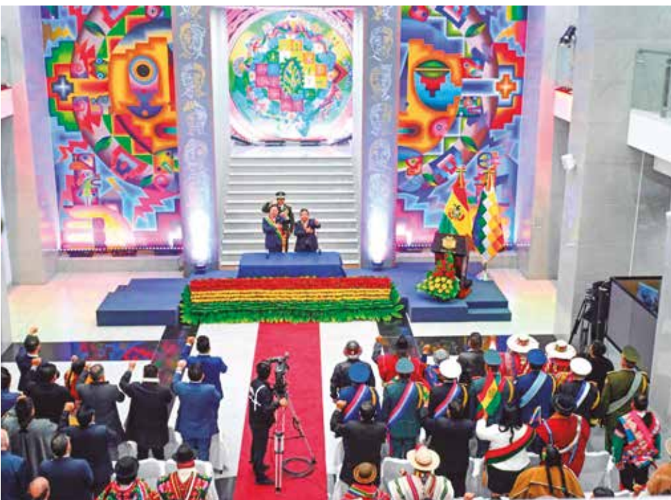
El acto principal en el hall de la Casa Grande del Pueblo, ayer.

1. Justicia: Subrayó la importancia de completar la elección de magistrados mediante un proceso transpa-