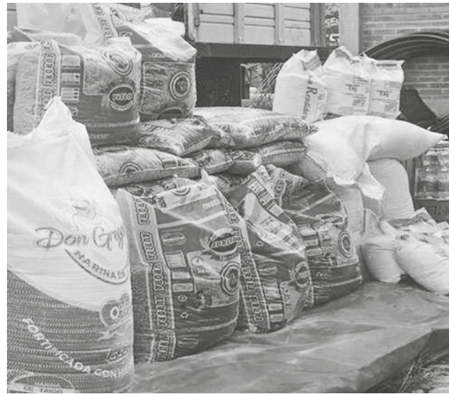
El envío de ayuda para las familias en Monteagudo.

Pronóstico. El Senamhi emitió una alerta por lluvias en 131 municipios por posibles lluvias y tormentas hasta el 31 de enero. En tanto, en 320 municipios se prevén desbordes de ríos