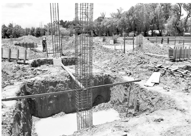
Material de construcción en el terreno.