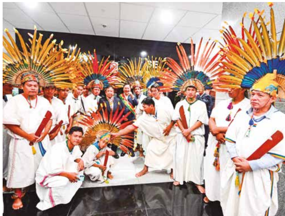
Luis Arce y David Choquehuanca posan junto a indígenas del oriente.

5. Medio ambiente: Advirtió sobre los efectos del cambio climático en Bolivia y planteó la necesidad de fortalecer las capacidades del país para gestionar desastres naturales.