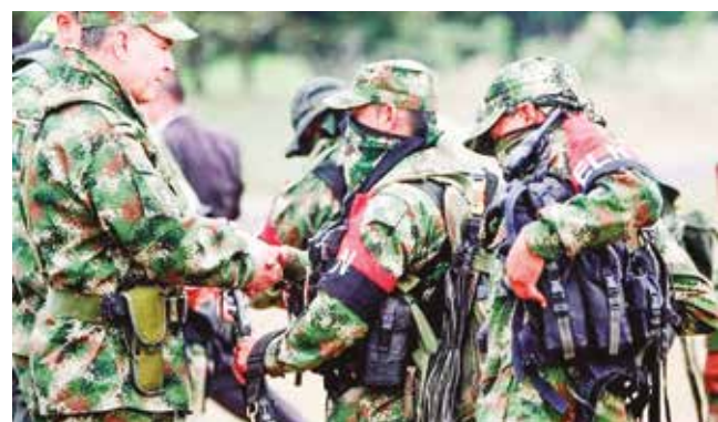
Miembros del ELN en la selva colombiana.

Panorama. El restablecimiento de las órdenes de captura representa un golpe a los esfuerzos de paz con el ELN