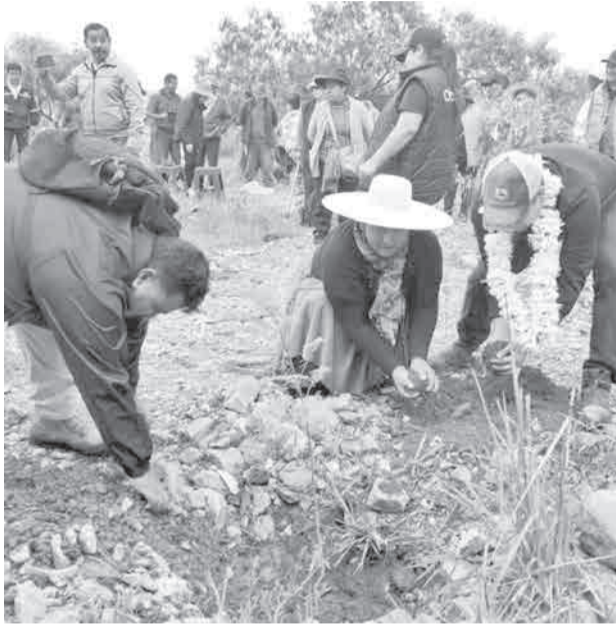
Forestan plantines en Cercado y Tiquipaya. GADC

El Sindicato Agrario Taquiña, ubicado en la Cuenca Pasa-