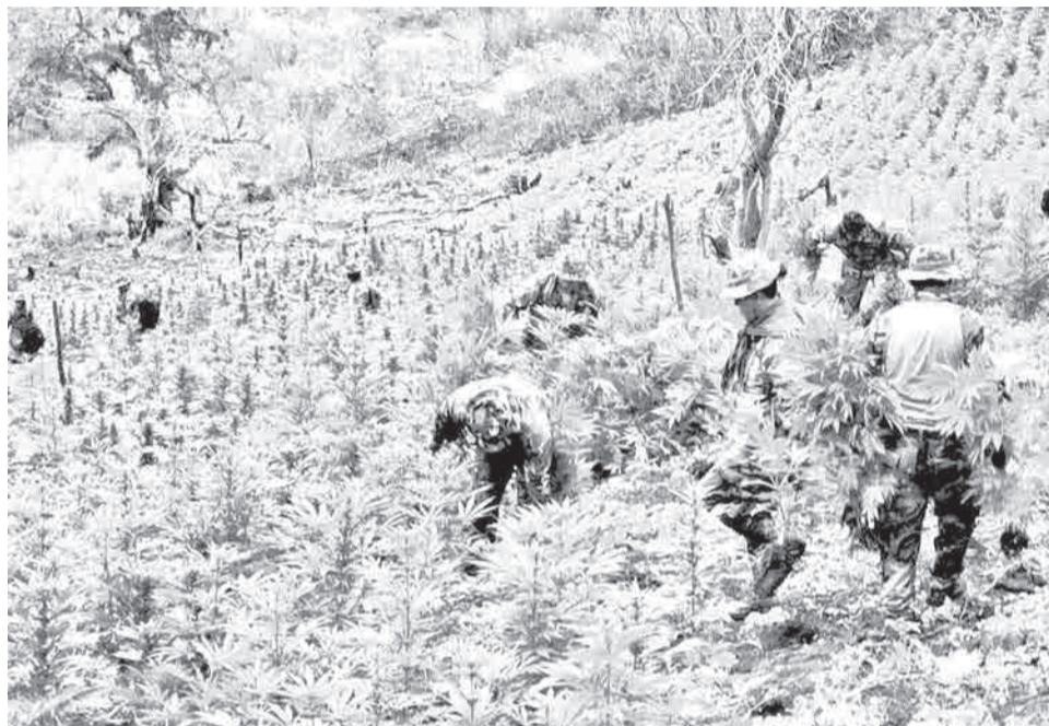
La destrucción de plantas de marihuana en el departamento de Cochabamba.

con el 2 por ciento. El estudio señala también que hay personas de 55 a 65 años que ha consumido esta droga alguna vez. La principal razón que motiva a las personas a consumir marihuana es, en primer lugar, la curiosidad y para experimentar. Este grupo representa el 71% del total de la muestra en estudio. En segundo lugar está la invitación o influencia de amigos o amigas con el 52% y, en tercer lugar, por la aceptación en el grupo de amigos, con el 7%. El cuarto lugar refiere a problemas familiares, con el 5 por ciento, el quinto, por invitación e influencia de los mismos familiares, con el 2 por ciento y finalmente existen otras causas, que concentran el 3%. Respecto a las ciudades capitales que han registrado este consumo son Tarija, que presenta el mayor porcentaje de consumo de marihuana con un 10 por ciento del total; le siguen La Paz y Trinidad, ambas con el 7%. Santa Cruz representa el 3 por ciento y El Alto, el 2 por ciento. Ambos son los departamentos que registran los niveles más bajos. En Bolivia, la Agencia Estatal de Medicamentos, dependiente del Ministerio de Salud, autoriza el uso del aceite cannabis de manera “excepcional y exclusiva”.