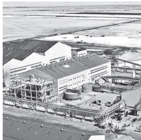
La planta de YLB, en Uyuni. YLB