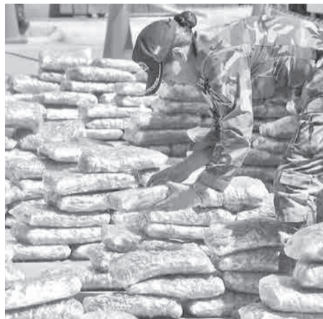
La hierba decomisada al microtráfico. C.L.