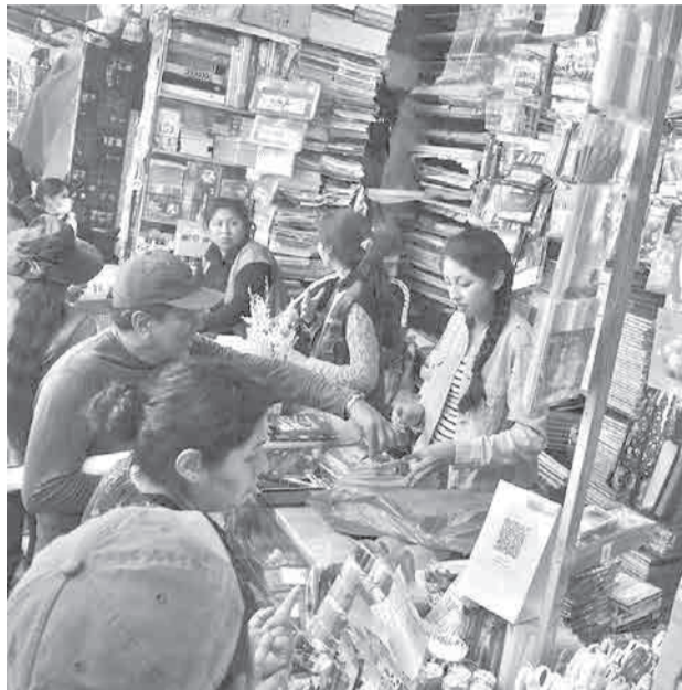
Venta de material escolar en mercados de la ciudad.

El inicio de las labores educativas está previsto para el 2 de febrero de 2026 en todo el país. Las autoridades educativas re-