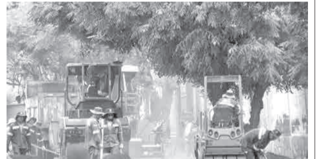
Trabajos de mantenimiento de vías.