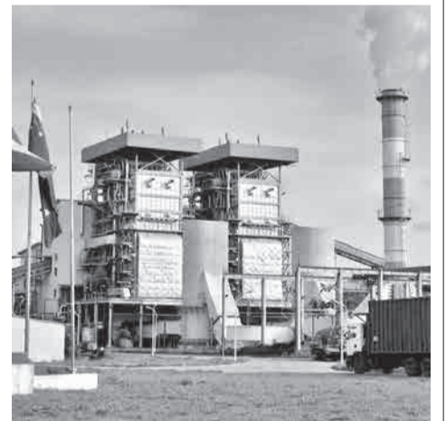
Instalaciones de San Buenaventura.