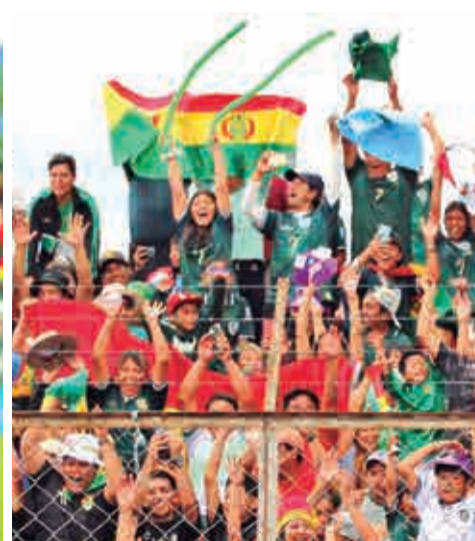
La hinchada boliviana alienta a la selección, ayer en Tarija.