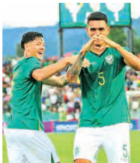
Jugadores de la Verde celebran el gol del empate ante Panamá, ayer. MARCELO GOMEZ