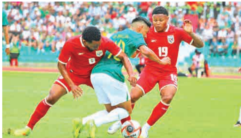
Incidencias del partido entre Bolivia y Panamá, ayer en Tarija. MARCELO GOMEZ

Goles: Kadir Barria, a los 5' (P), Richet Gómez, a los 69' (B).