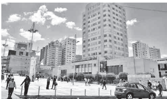
La sede de la UMSA, en La Paz.

neas de acción para enfrentar la crisis, basadas en el trabajo técnico, la investigación académica y el diálogo entre distintos sectores, con el objetivo de aportar al desarrollo del país y