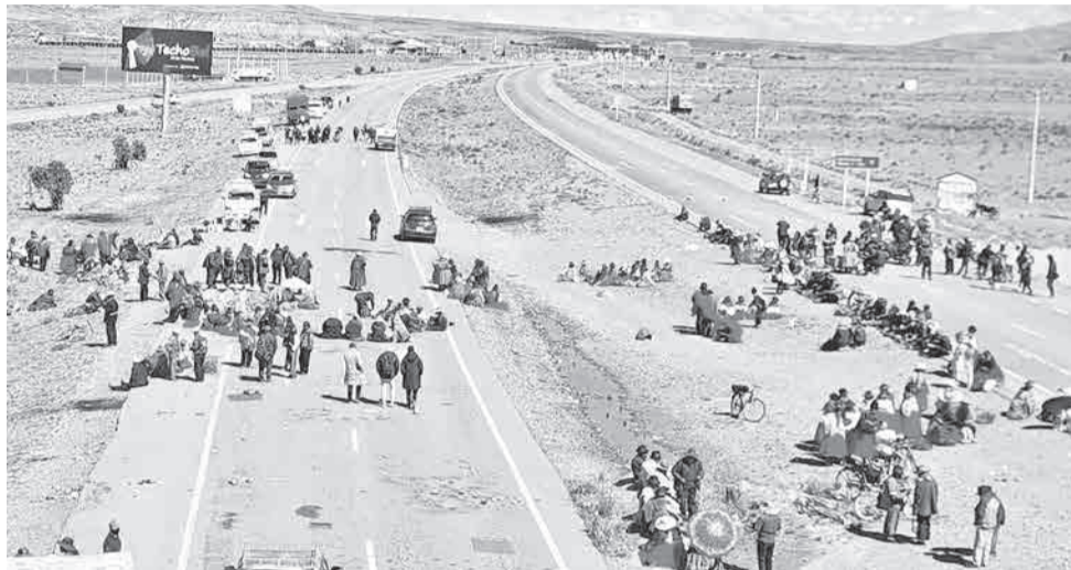
Bloqueos realizados en la ruta La Paz-Cochabamba, hace dos semanas.