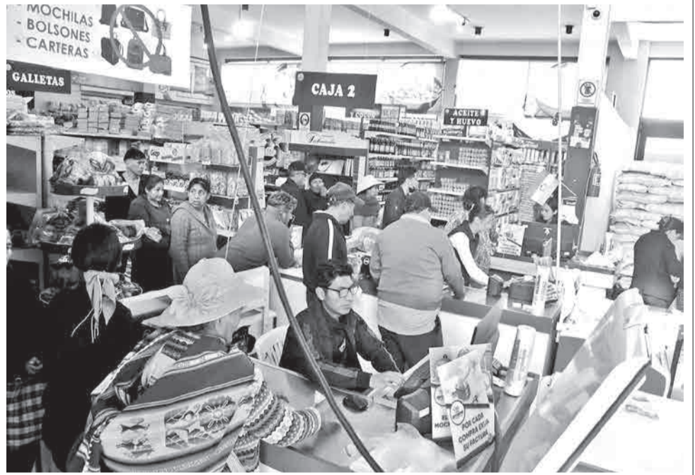
La atención en una sucursal de Emapa. CARLOS LÓPEZ

ductiva Cementos de Bolivia (Ecebol), cuestionada por su baja rentabilidad operativa; Boliviana de Aviación (BoA), que se encuentra bajo observación por deficiencias operativas y financieras. A ellas se suman Empresa Azucarrera San Buenaventura, que sigue sin alcanzar la sostenibilidad, además de la Empresa Estratégica de Producción de Abonos y Fertilizantes. En la lista también figura la Empresa Pública Productiva Envases de Vidrio de Bolivia (Envibol), Servicio Nacional Textil (Senatex), Empresa Siderúrgica del Mutún, Empresa Boliviana de Alimentos (EBA), Editorial del Estado Plurinacional de Bolivia y la Empresa Boliviana de Industrialización de Hidrocarburos (EBIH), que es catalogada por la actual administración como una empresa en quiebra técnica, con pérdidas reportadas que comprometen su continuidad operativa. Según el Gobierno, estas plantas industriales sólo sirvieron para “drenar las Reservas Internacionales” sin generar retorno social ni económico que beneficie. Ante este panorama, el presidente Rodrigo Paz describió el estado de la administración pública heredada como “un desastre”. “Se ha encontrado un horror en el Estado”, dijo.