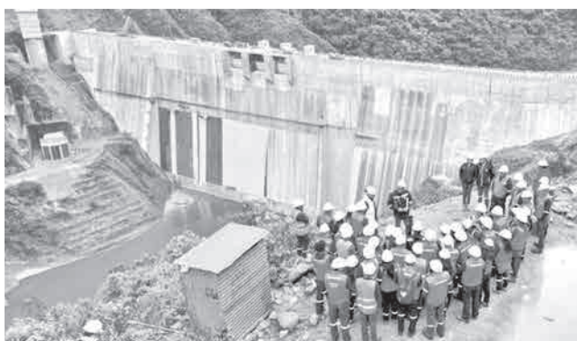
Las visitas a la hidroeléctrica Ivirizu. ENDE

nal de Electricidad - ENDE Corporación, recibió en 2025 la visita de 248 personas externas, correspondientes a siete delegaciones de institutos, universidades y profesionales que recorrieron diferentes frentes de obra.