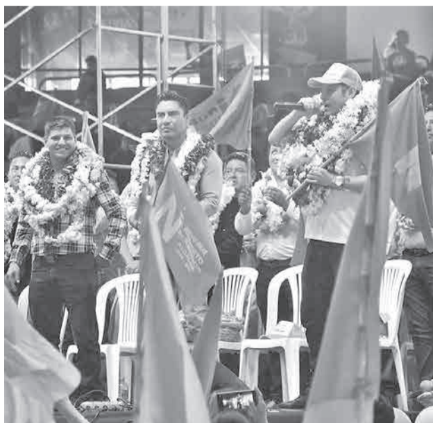
El vicepresidente Edmand Lara, ayer en Cochabamba.

Durante su discurso, cuestionó las deficiencias que enfrentan algunos sectores del departamento. “¿Acaso tenemos un buen sistema de salud? ¿Los niños reciben un desayuno