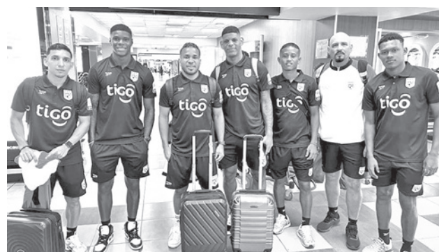
El seleccionado de Panamá a su llegada al país.