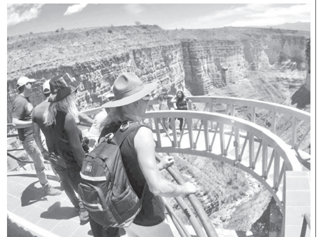
Con los feriados se busca impulsar el turismo. DANIEL JAMES

El objetivo de la medida es promocionar el turismo local y nacional como una manera de reactivar la economía y apoyar a este sector estratégico del país.