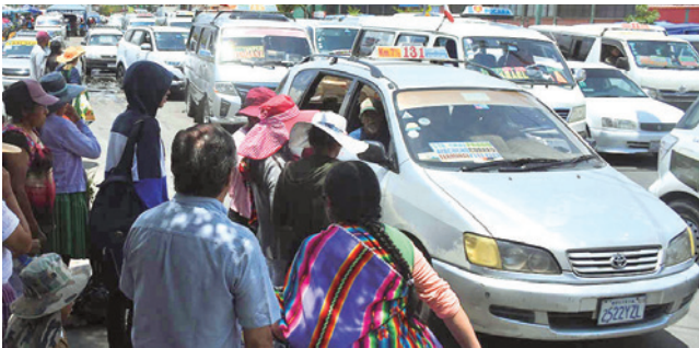
El servicio de transporte público en la ciudad. JOSE ROCHA

Pedido. Un fallo judicial dispone que se realice un estudio técnico específico para este sector de la población