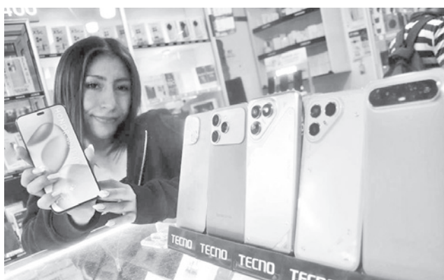
La oferta de productos electrónicos. JOSE ROCHA

En un mensaje publicado en su cuenta de Facebook, la autoridad de Gobierno puntualizó que “a partir del lunes, los aranceles de importación de celulares, tablets y computadoras pasarán a ser del 0%”.