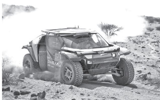
La competición en el Rally Dakar, ayer.

En la disputa del día, el sueco Matthias Ekstrom se adjudicó la victoria con Ford, marcando el mejor tiempo por delante del francés Romain Dumas y el español Carlos Sainz, ambos al mando de vehículos de la escudería estadounidense. De acuerdo con Europa Press, esta actuación reforzó la posición de Ford en la etapa, colocando a tres de sus pilotos en los primeros lugares y demostrando fortaleza tanto en estrategia como