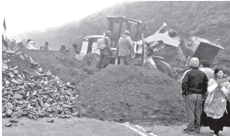
Bloqueos de vías de la Central Obrera Boliviana la semana pasada.

Señaló que se podrá invitar a organizaciones sociales, empresarios, agropecuarios, floricultores y otros sectores para debatir el tema.