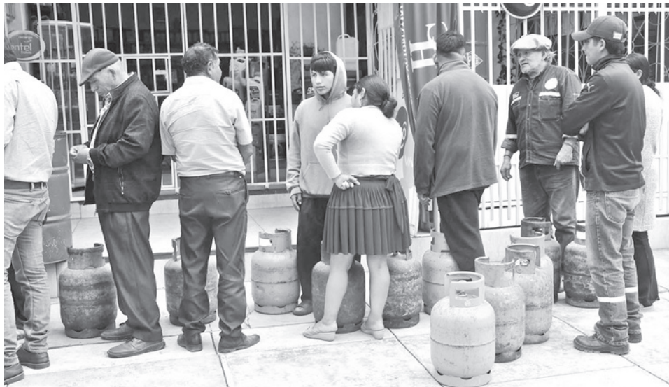
Las filas para la compra de garradas de GLP, en Cochabamba.

Una de las primeras medidas que se aplicó fue la exigencia de la cédula de identidad para vender una garrafa por persona. Sin embargo, la población se vio obligada a acudir a los puntos de distribución de YPFB para adquirir las garrafas de GLP a Bs 22,50 debido a que el producto ya no se encuentra en las tiendas.