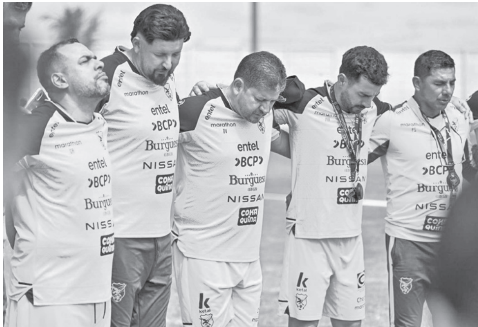
Jugadores y técnico realizan una oración para iniciar esta nueva etapa.