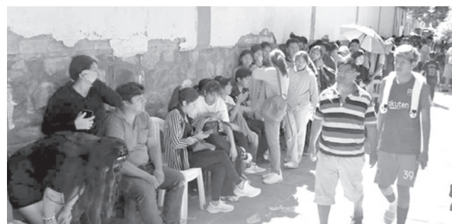
La fila para comprar entradas para el partido.

Hincha. Tarija demostró que respalda totalmente a la Selección Nacional, que el domingo juega con Panamá