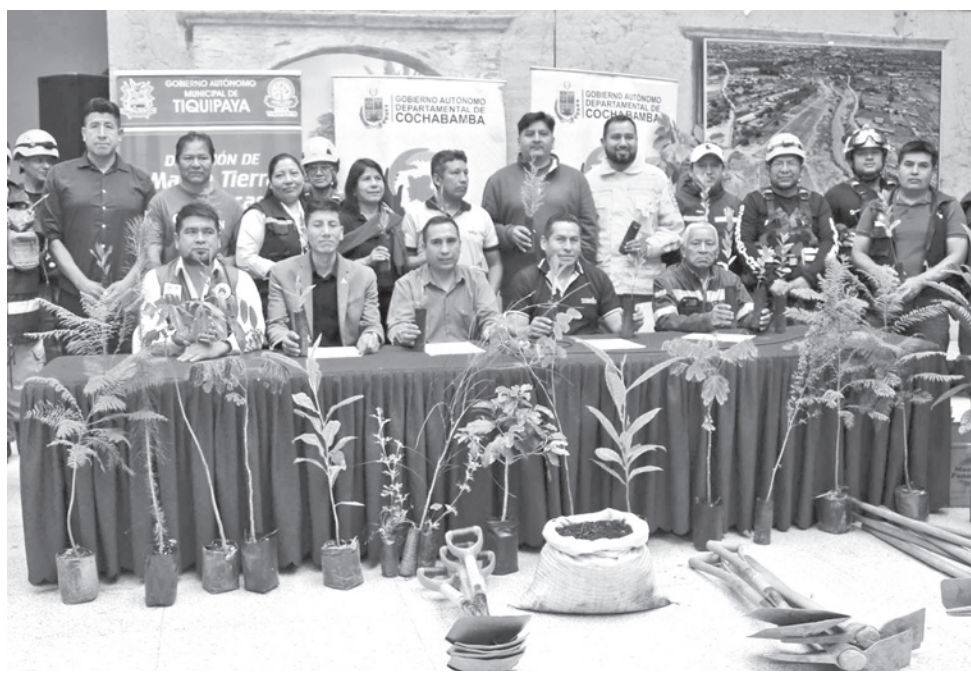
El lanzamiento del plan de reducción de cuencas, como la Taquiña. GADC

El secretario departamental de Medio Ambiente y Recursos