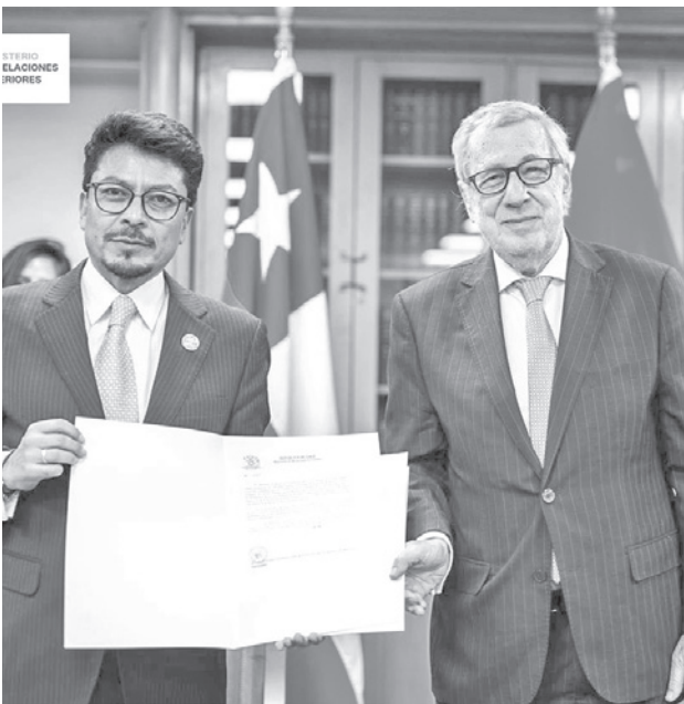
Los cancilleres de Chile y Bolivia, ayer en Santiago.

Las conversaciones también abordaron la integración fronteriza y la gestión de recursos hídricos. Se destacó la modernización del oleoducto Sica Sica, la implementación del proyecto Reversa Ossa II Arica-Cha-