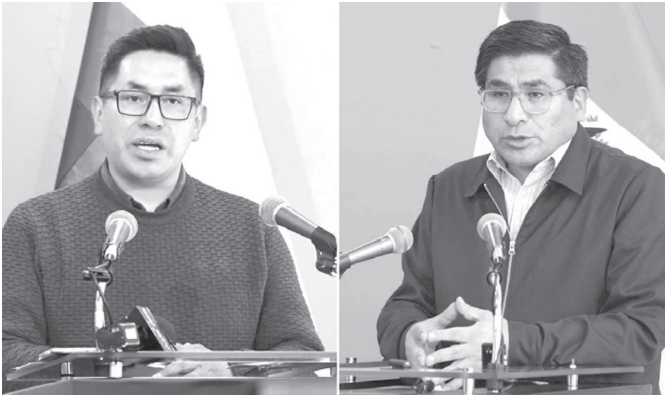
Los exministros de Desarrollo Productivo Néstor Huanca y Zenón Mamani.

El perjuicio no solo se limita al subsidio de la harina, sino a otros rubros, como plantas productivas mal gestionadas. Las autoridades y la parte denunciante han descrito una estructura que involucraría a familiares y personas cercanas a los implicados, actuando para beneficiarse de la distribución irregular de insumos. Presumen que el daño económico asciende a varios millones de bolivianos.