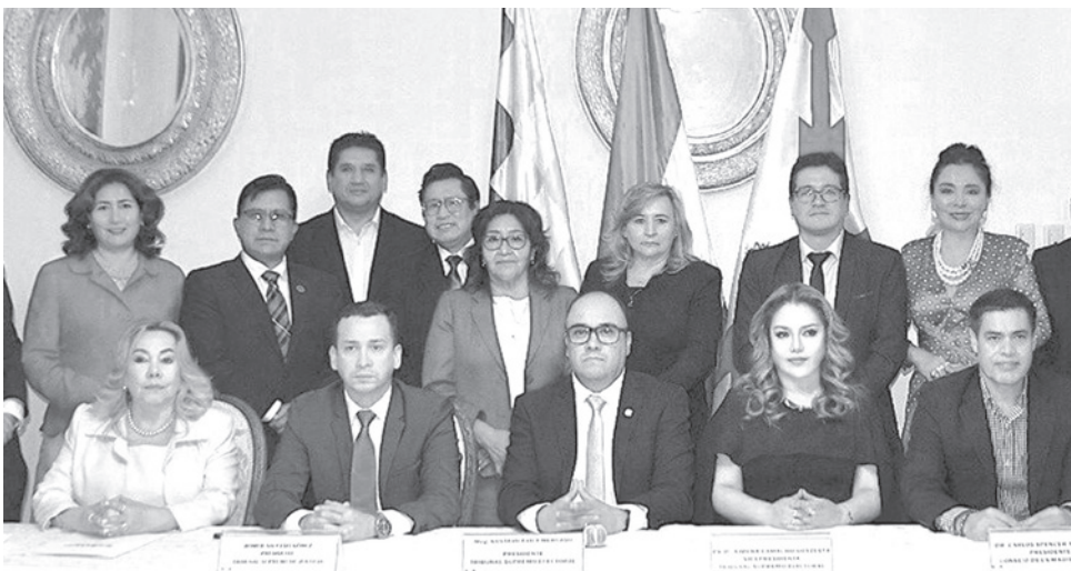
Representantes de instituciones que participaron ayer en la firma del acuerdo electoral.

La Fiscalía compromete la atención prioritaria de las denuncias relacionadas con la Comisión de Delitos Electorales.