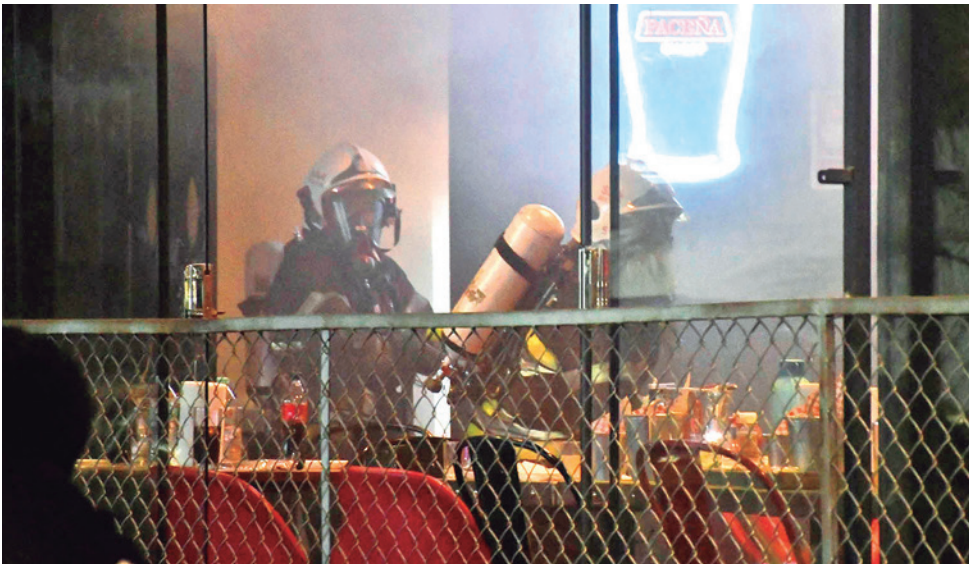
El incendio en un restaurante de la zona de La Recoleta, el miércoles. CARLOS LÓPEZ