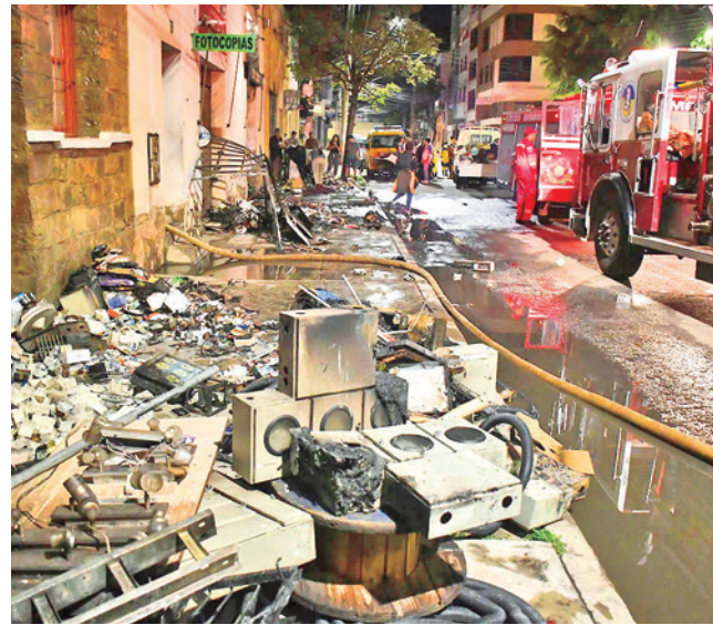
Una tienda incendiada en la calle Avaroa. HERNAN ANDIA

La Alcaldía de Quillacollo determinó ayer una tarifa provisional de Bs 2 dentro del municipio y de Bs 3,50 para las rutas intermunicipales hasta la realización de un informe técnico.