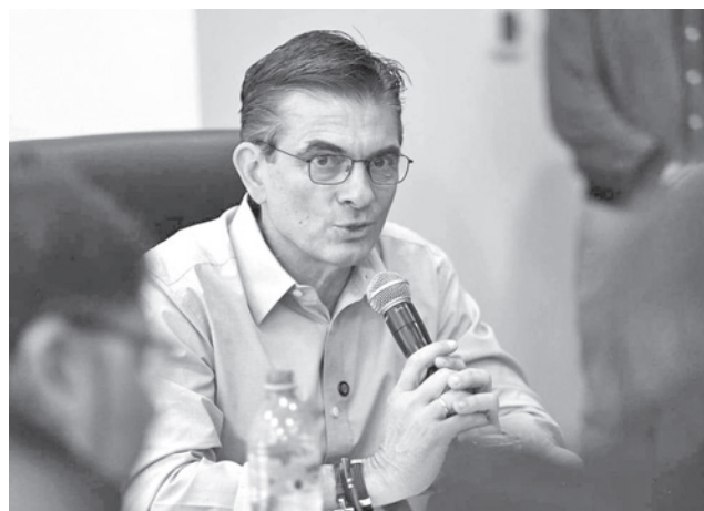
El presidente del Estado, Rodrigo Paz, ayer.

Consultado al respecto, Paz se limitó a señalar que el anuncio oficial lo hará el Canciller del Estado y deslizó que “cuando sea necesario viajar estaré en el exterior” y si no estará en el país consolidando los pasos que, dijo, da su Gobierno.