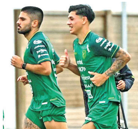
El entrenamiento de la Selección Nacional para el amistoso.