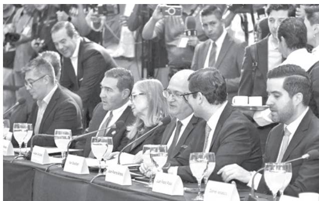
El encuentro del BID con los empresarios, ayer.

“Vamos a trabajar en varios sectores. Al principio, pensamos en cuatro: en la minería, en la agroindustria, en la energía y el turismo”, sostuvo el ejecutivo al considerar importante el interés