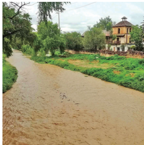
El aumento de caudal en el río Rocha. C.L.