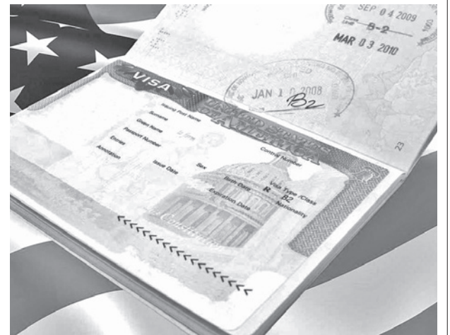
Imagen de una visa de Estados Unidos. RRSS

En ese contexto, Italia y Polonia pidieron a sus ciudadanos que abandonen Irán inmediatamente.