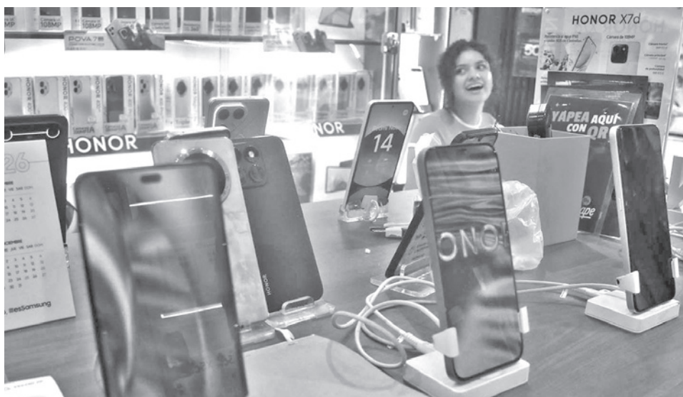
La oferta de celulares, parte de los productos con arancel cero. JOSE ROCHA

dos en la lista de arancel cero se encuentran: teléfonos celulares, computadoras y tablets, impresoras y copiadoras, micrófonos y grabadoras, auriculares y amplificadores, cámaras y monitores, receptores de televisión, cajas registradoras y videojuegos.