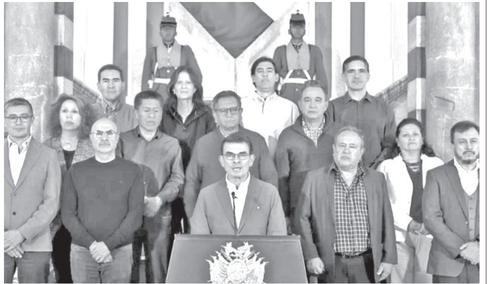
El presidente Rodrigo Paz y los ministros de Estado, el pasado lunes.

En su artículo 5 menciona que “en consideración de la extrema situación de déficit en el abastecimiento, de manera excepcional y temporal, se dispone la suspensión del diésel de la lista de sustancias controladas y la exigencia del requisito de Autorización Previa - AP ante la Dirección General de Sustancias Controladas - DGSC, con el fin de garantizar el abastecimiento continuo y oportuno de combustibles para el transporte, la producción, la agroindustria y los sectores estratégicos del país”.