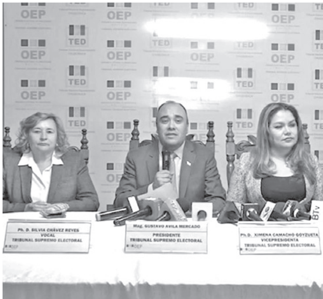
El presidente del TSE, Gustavo Ávila. TSE

Medrano rechazó quedar fuera de la carrera electoral y arremetió contra las autoridades del Tribunal Supremo Electoral, a las que acusó de actuar de forma “irresponsable” y “dirigida”, luego de que se instruyera la cancelación definitiva de su alianza.