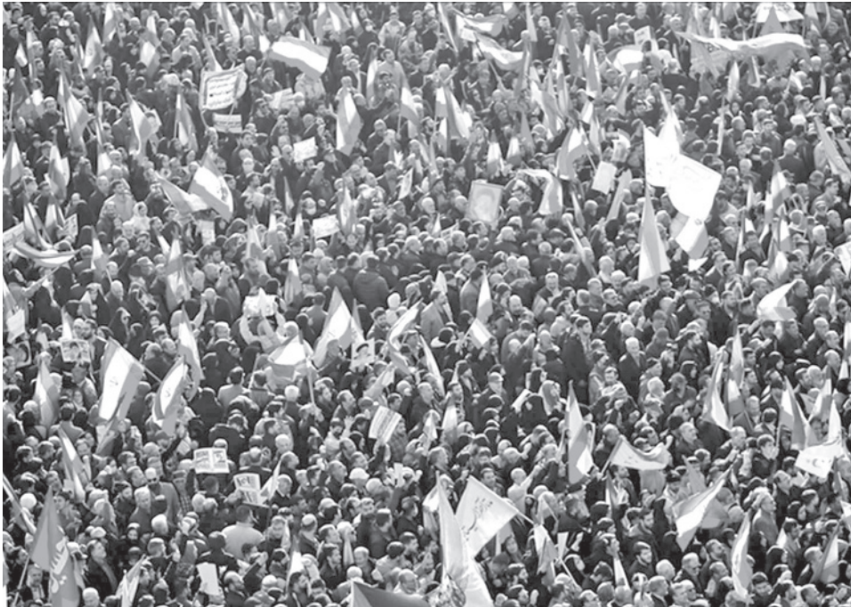
Una de las muchas protestas de los iraníes en la capital, Teherán. AA

“No repita el mismo error que cometió en junio. Ya sabe, si intenta una experiencia fallida, obtendrá el mismo resultado”, dijo en declaraciones a Fox News.