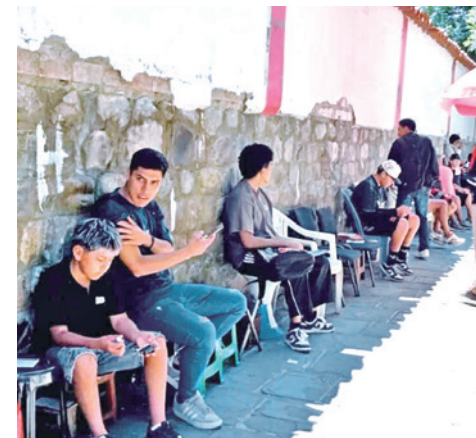
Los hinchas que hacen fila para comprar entradas en Tarija.