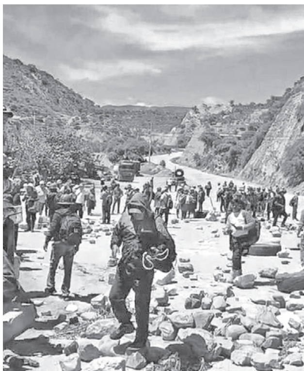
Recientes bloqueos de carreteras en el país.