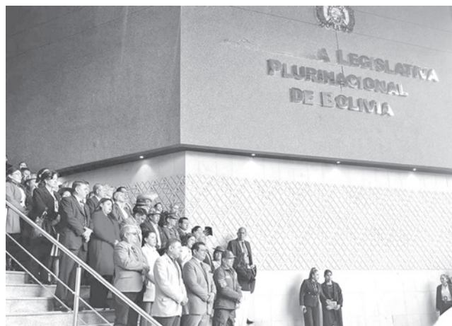
El acto de presentación en la Asamblea Legislativa.

La nueva señalética responde a una necesidad concreta: facilitar el acceso, la