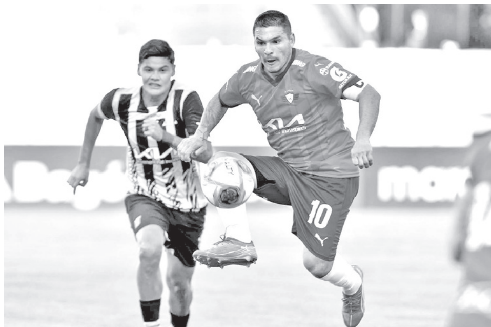
Wilstermann durante su participación en el torneo profesional, en 2025. CARLOS LÓPEZ

“Estamos ahora en la condición de apelados, nos han demandado como tal, tenemos que hacer una evaluación internacional porque se han demandado a los 16 clubes y la FBF, por eso la posición institucional será conjunta, la Federación va a llamar a todos los apelados, vamos a coordinar una estrategia conjunta”, afirmó el abogado Aliaga.