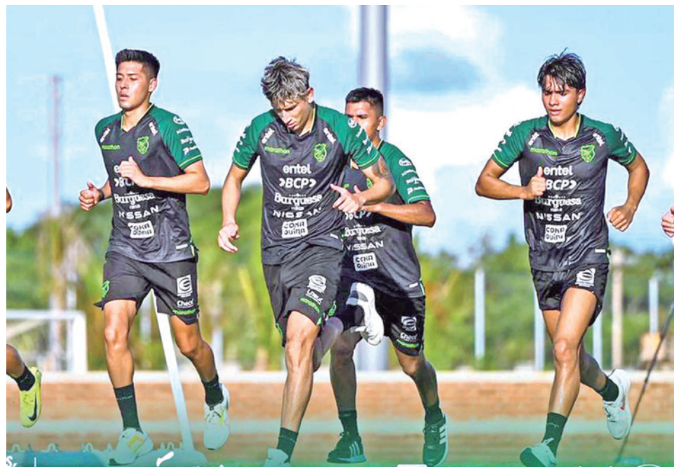
La Verde se prepara para enfrentar a Panamá el domingo.

La Verde ayer cumplió una intensa jornada, se entrenó en triple turno con la finalidad de alcanzar las mejores condiciones posibles el domingo, cuando sostendrá el primer amistoso de este año.