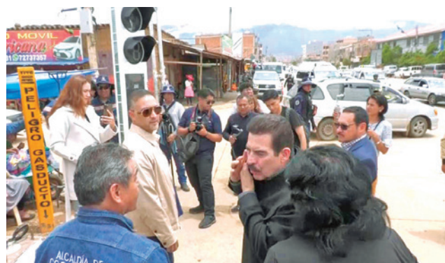
El semáforo inteligente en la zona sur, ayer.

El alcalde Manfred Reyes Villa inspeccionó los trabajos que se ejecutan en la avenida Panamericana en un punto de alta afluencia peatonal y vehicular.