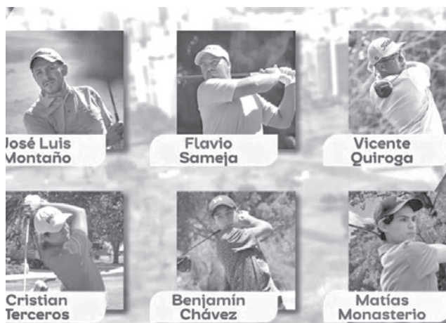
Los bolivianos que estarán en la competición.

Montaña tendrá su séptima participación en este torneo (estuvo en 2015, 2016,