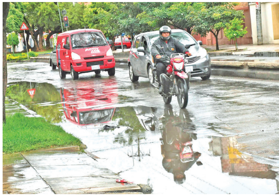
El día lluvioso en la ciudad de Cochabamba, ayer. HERNAN ANDIA

Las precipitaciones podrían alcanzar hasta 20 milímetros de agua en el trópico durante los próximos días