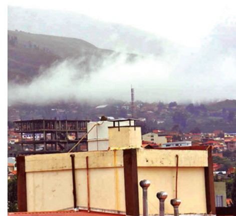
Las precipitaciones seguirán. JOSE ROCHA