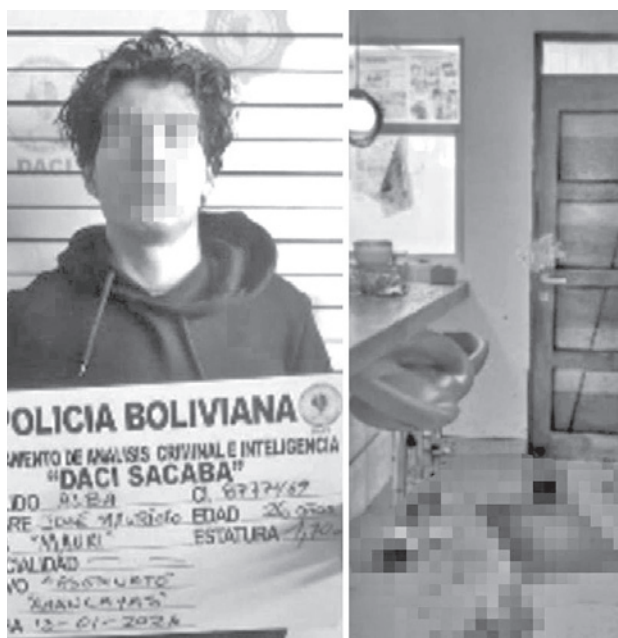
El domicilio de la víctima y el presunto autor.

Las pesquisas vincularon el crimen con un robo agravado ocurrido el 27 de diciembre, cuando se sustrajeron Bs 50.000, dos computadoras portátiles y documentos originales de terrenos ubicados en Ivirgar-