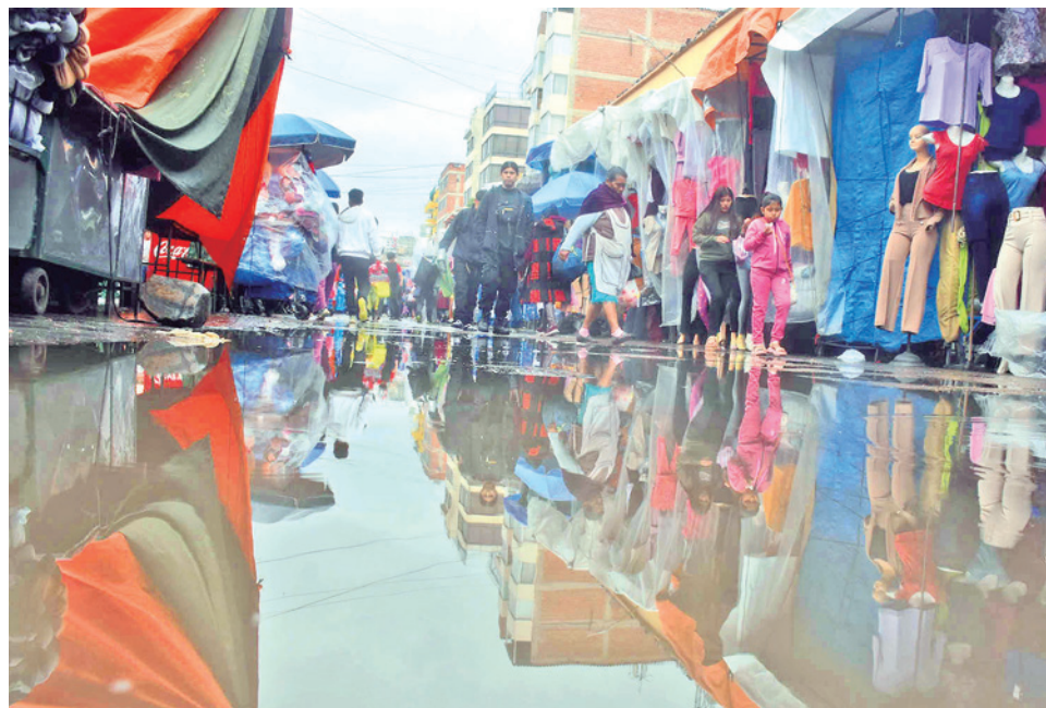
UGR denuncia que basura aumenta las consecuencias de las lluvias. JOSE ROCHA

Las vías aledañas a los mercados, como República, 6 de Agosto, Barrientos y otras, son las más afectadas durante la época de lluvias. Las cuadrillas municipales se encuentran desplegadas las 24 horas para atender emergencias y