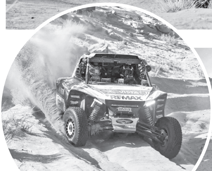
Participantes de la prueba extrema.