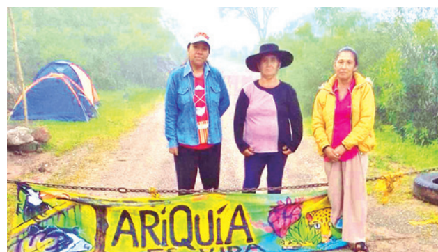
El punto de ingreso a la Reserva de Tariquía. TARIQUÍA HOY

Ayaviri ratificó la declaración de emergencia de la Federación de la Asociación de Municipios de Bolivia (FAM) y dijo que el alcalde envió una nota de reclamo al Ministerio de Economía por la restricción “unilateral” que asumió al señalar que las alcaldías sólo pueden disponer del 20% de su presupuesto para 2026. “Es un atentado, sin precedentes, a la autonomía municipal, el cercenar los recursos”.