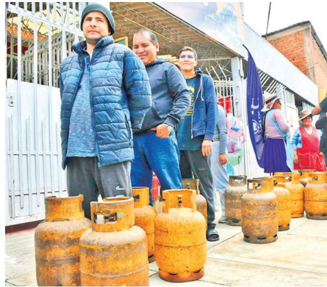
La compra y fila para las garrafas de gas.

Subvención. El Gobierno garantizó que el precio de la garrafa de GLP se mantendrá en Bs 22,50 en las agencias y distribuidoras oficiales de la empresa estatal