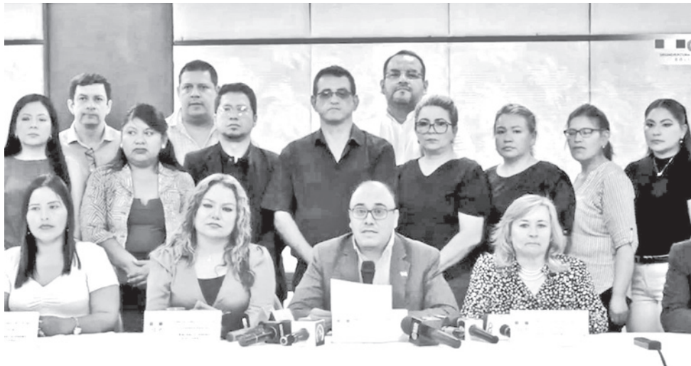
El presidente del Tribunal Supremo Electoral, Gustavo Ávila, ayer.

Ávila anunció que el Tribunal Supremo Electoral sostendrá reuniones con autoridades del Órgano Judicial, del Tribunal Constitucional Plurinacional (TCP) y la Fiscalía General del Estado para garantizar el desarrollo del proceso electoral de las subnacionales.