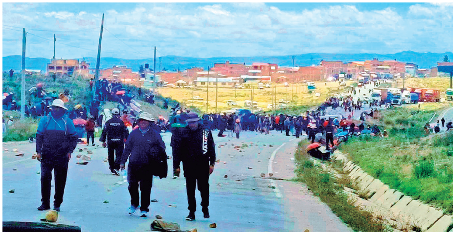
El bloqueo en Caracollo, en la ruta Cochabamba-La Paz. Hasta anoche se reportaron 37 barricadas en las carreteras del país.

Negociación. El Gobierno se abrió a modificar los artículos cuestionados, pero aún no hay acuerdo con los trabajadores. Las pérdidas económicas aumentan. Pág. 3