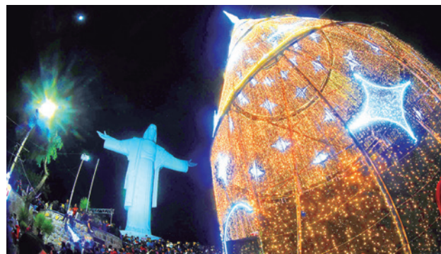
El árbol navideño en el Cristo de la Concordia.