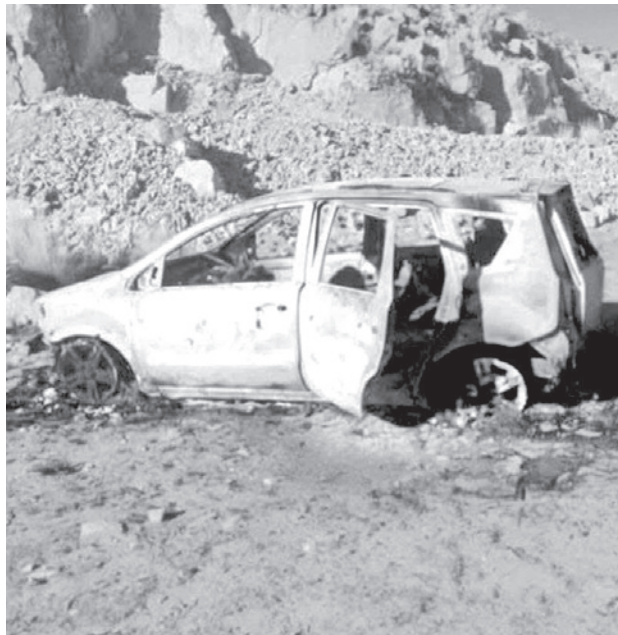
El vehículo de las víctimas carbonizado.

De momento el Ministerio Público no conoce la identidad de las víctimas. El fiscal Morales informó que la persona aprehendida no ha brindado ninguna información