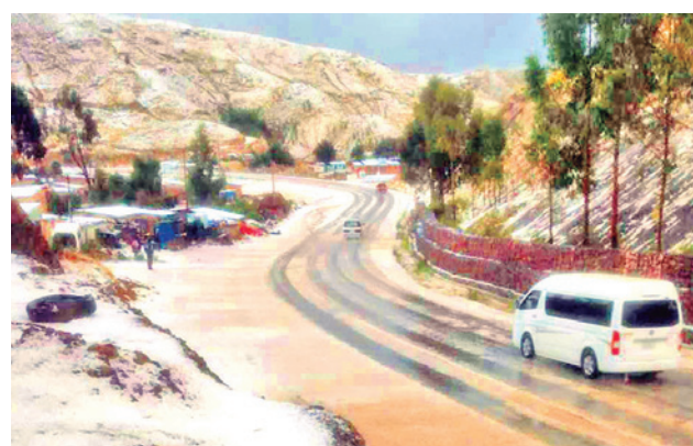
La granizada que afectó a Tapacarí.

El pronóstico da cuenta de que la temperatura mejorará este viernes con máximas de 28 grados Celsius. Sin embargo, el fin de semana se prevé un leve descenso con máximas que bordearán los 22 grados, como ha ocurrido en esta semana.