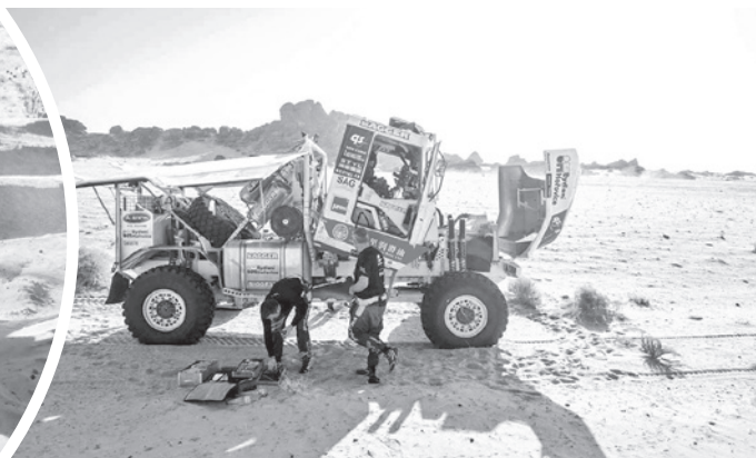
Pilotos reparan su motorizado en la prueba.

ventaja de tres minutos y diecisiete segundos sobre el catari Nasser Al-Attiyah (Dacia), mientras que el sueco Mattias Ekström ocupa el tercer lugar a cinco minutos y treinta y ocho segundos. La dinámica impuesta por las penalizaciones ha forzado cambios constantes entre los principales aspirantes, destacando una competencia marcada por la regularidad más que por los resultados individuales de etapa.