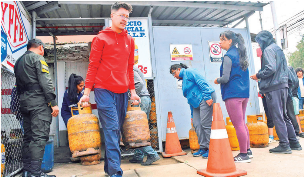
La fila para comprar gas con GLP en la estación Cala Cala de YPFB.