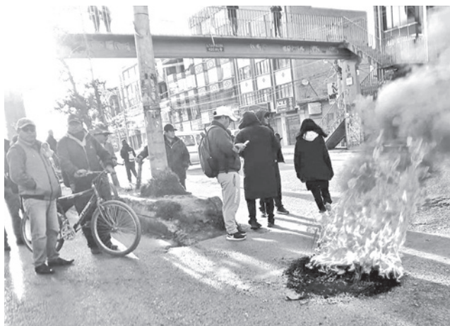
Bloqueos en las carreteras del país. RRSS

El bloqueo generó preocupación en diferentes sectores económicos, pues no pueden