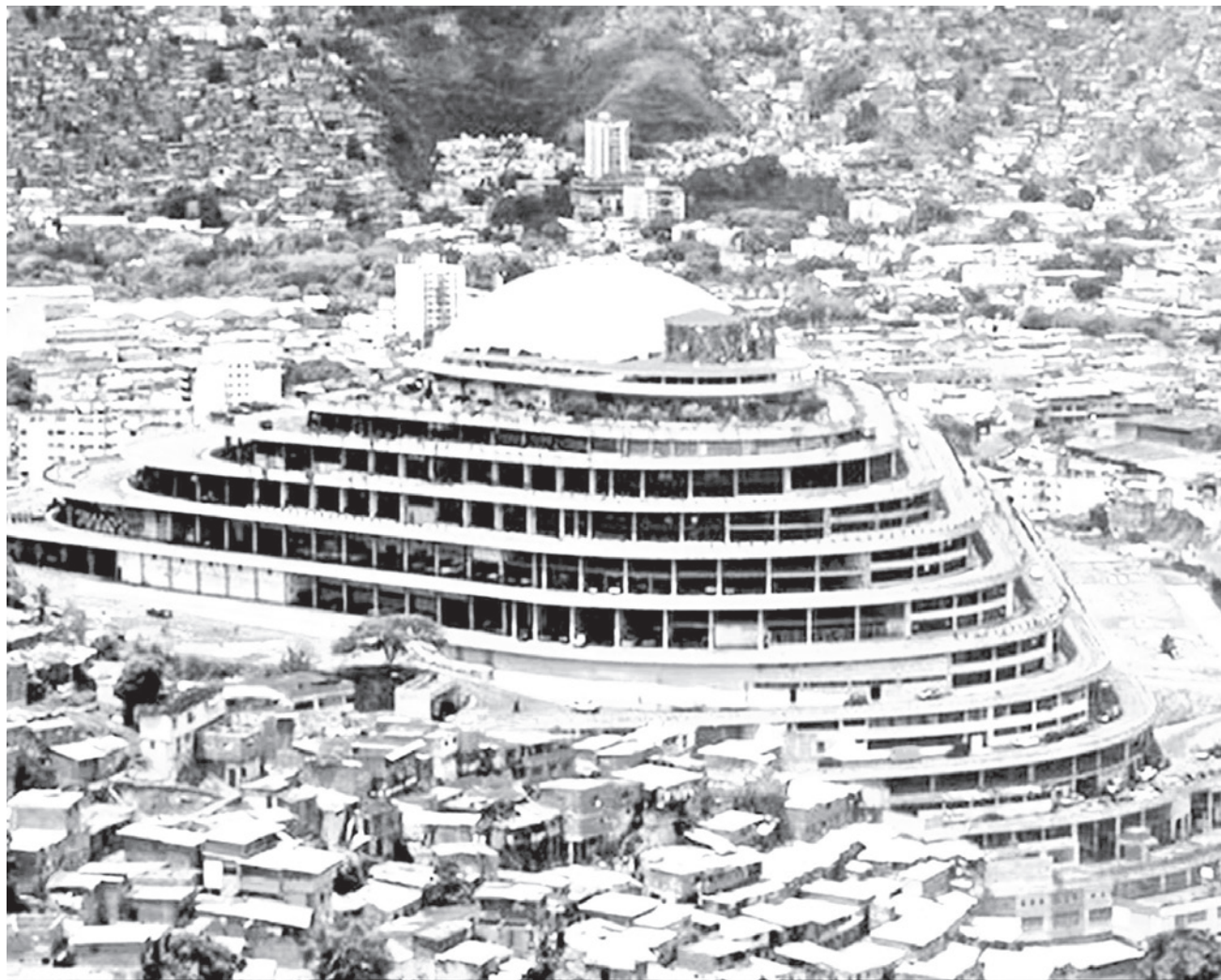
El Helicoide, la cárcel del régimen de Nicolás Maduro, en Caracas, Venezuela.

Acción. El presidente del Parlamento venezolano ha agradecido la mediación a José Luis Rodríguez Zapatero, Lula Da Silva y Qatar