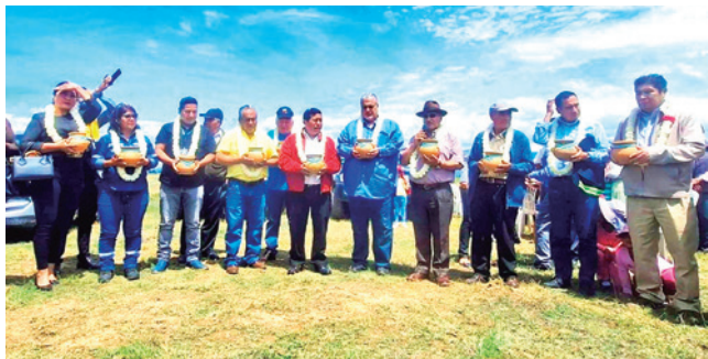
Inician construcción de planta de reciclaje. GADC

Medio ambiente. El proyecto demanda una inversión de $us 200 millones de dólares y tiene el apoyo de los pobladores