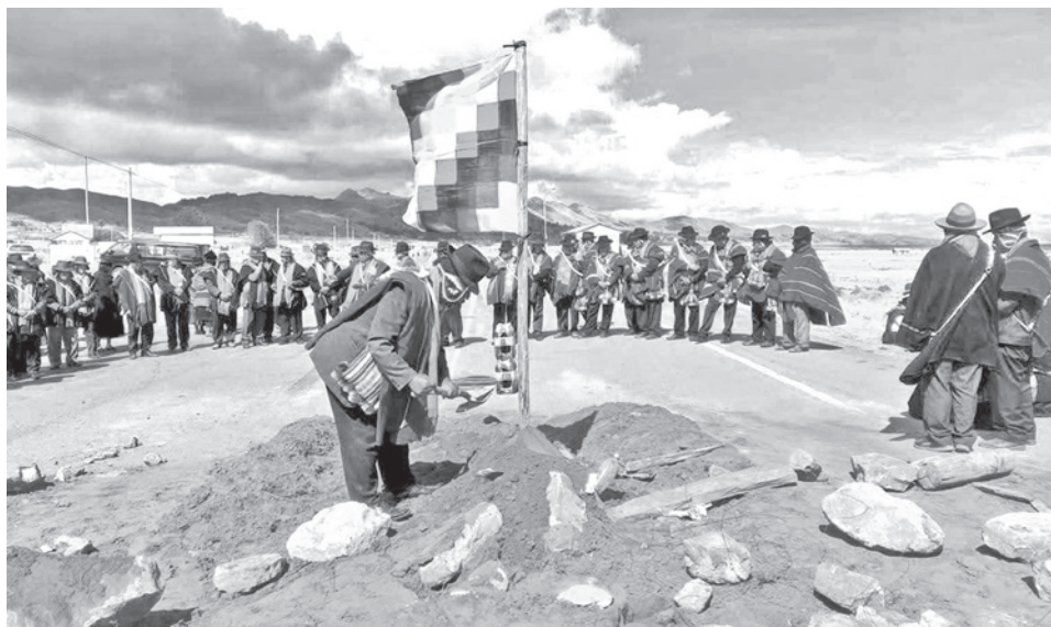
Bloqueo de carreteras en la localidad de Guaquí, en la ruta hacia el Desaguadero.