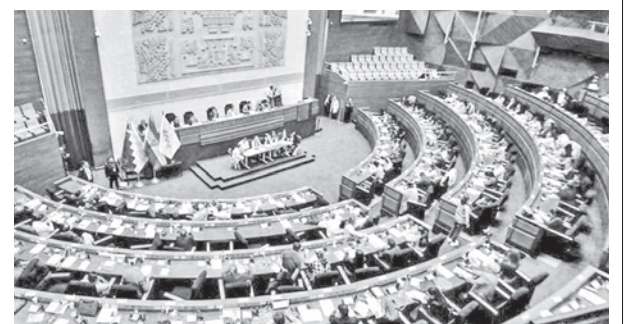
Diputados y senadores en una sesión del legislativo.

Hoy, tanto diputados como senadores, deberán retornar a La Paz para continuar con sus labores.