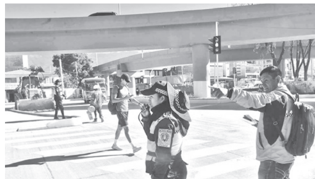
El uso del nuevo distribuidor vial de las avenidas Blanco Galindo y Perú. HERNAN ANDIA

Entre las especies afectadas están jacarandá, pajarilla, paraíso, eucalipto y molle.