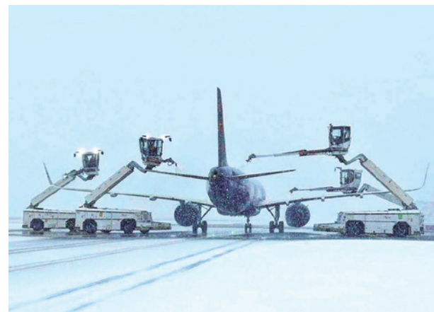
Ayer, en el aeropuerto de Bruselas, estaban ocupados tratando los aviones con líquido antihielo. NIEUWSBLAD.BE

Italia continúa afectada por la climatología adversa en buena parte del país, especialmente en el centro y el norte, donde la nieve ha provocado cortes en la autopista A1, el cierre de escuelas en varias regiones y el desbordamiento del río Aniene.