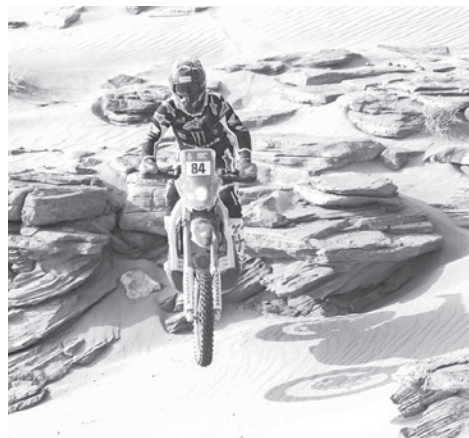
La prueba en la categoría motos del Rally Dakar.