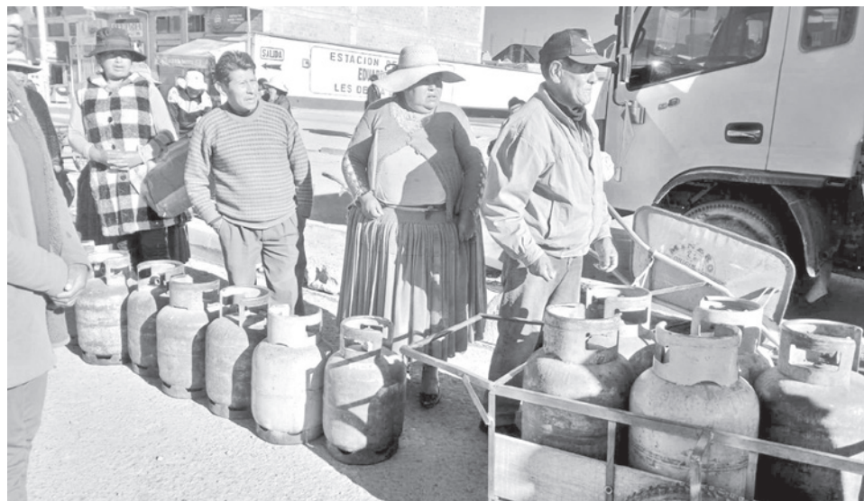
Las filas para adquirir garrafas con GLP, en la ciudad de La Paz.

“Por ahora una persona solo puede comprar una garra-