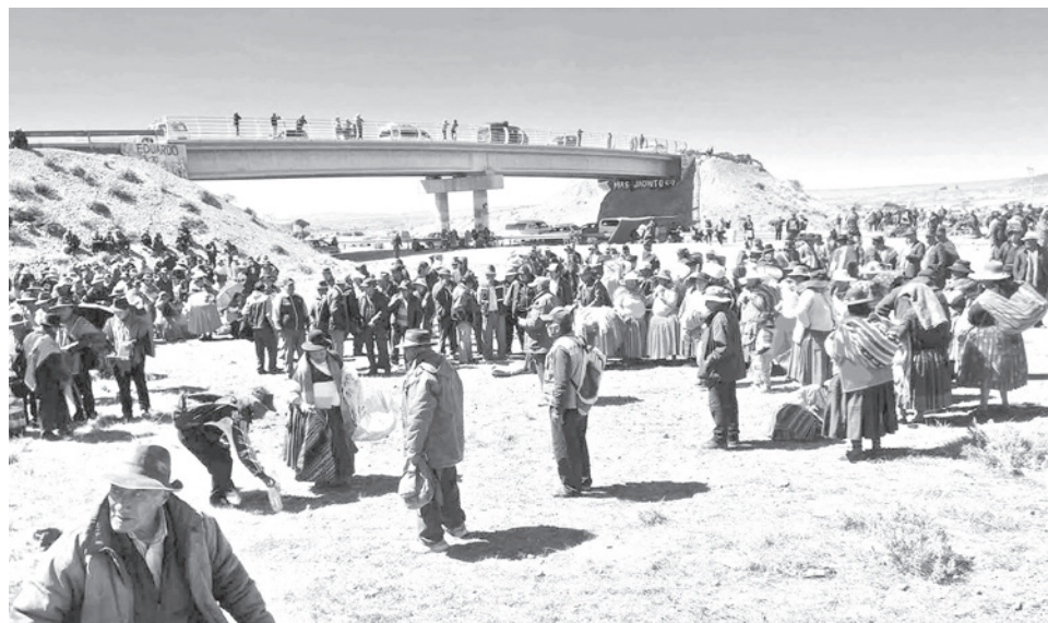
Un punto de bloqueo en carreteras de occidente del país.

La ruta hacia Santa Cruz, a la altura de Yapacaní también está cerrada desde ayer.