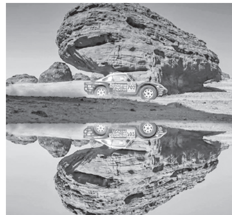
Uno de los competidores en la etapa maratón del rally.