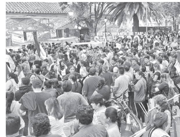
La marcha en defensa de Tariquía.

Petrobras Bolivia asegura que cuenta con la licencia ambiental para desarrollar el proyecto DMO-X3, que está fuera de la reserva de Tariquía. Además, se ampara en un contrato suscrito en la gestión 2025.