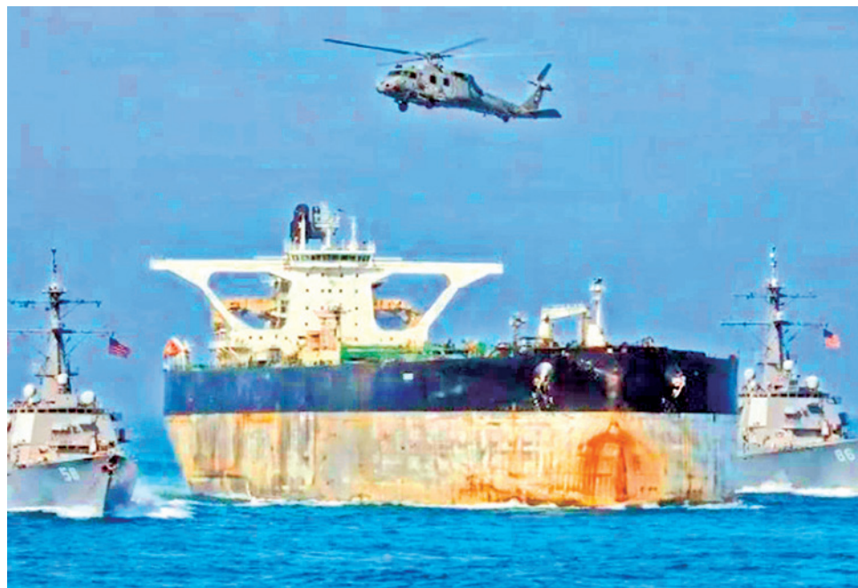
El buque Marinera, capturado este martes por EE.UU. por violar el embargo al petróleo venezolano.

En medio de las negociaciones entre Donald Trump y Delcy Rodríguez en la transición tras la captura de Nicolás Maduro, el presidente norteamericano había anun-