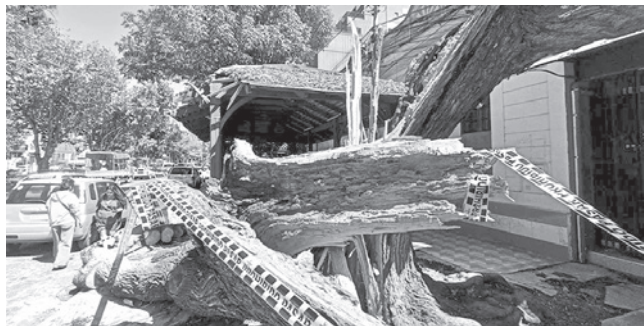
Los árboles caídos en el paseo del Prado. CARLOS LÓPEZ

Prevención. La época de lluvia es una de las más críticas, porque está acompañada de fuertes ráfagas de viento