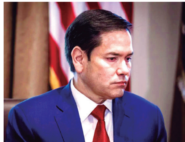
Marco Rubio, secretario de Estado de EEUU.

El anuncio incidió en una baja en los precios mundiales del petróleo. Ya con pérdidas de 2% el día anterior, el crudo siguió esa senda el miércoles en los mercados de Asia y cesó alrededor de 1%.