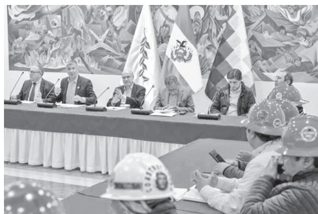
Una de las mesas de diálogo entre Gobierno y sectores.

Ayer por la mañana, autoridades del Gobierno y representantes de organizaciones sociales instalaron mesas de trabajo técnico en el Campo Ferial Chuquiago Marka. Las mesas de diálogo abordaron los siguientes ejes: reforma del Estado y descentralización; recursos naturales y soberanía; sostenibilidad de los carburantes y energía; régimen tributario e incenti-