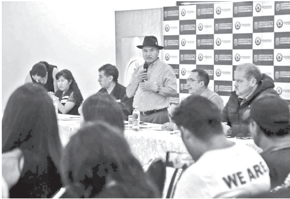
La presentación del informe de la auditoría del botadero de K'ara K'ara. GADC

Uno de los hallazgos más alarmantes es la inestabilidad estructural de las macroceldas 2 y 3, consideradas un riesgo latente y crítico, especialmente durante la época