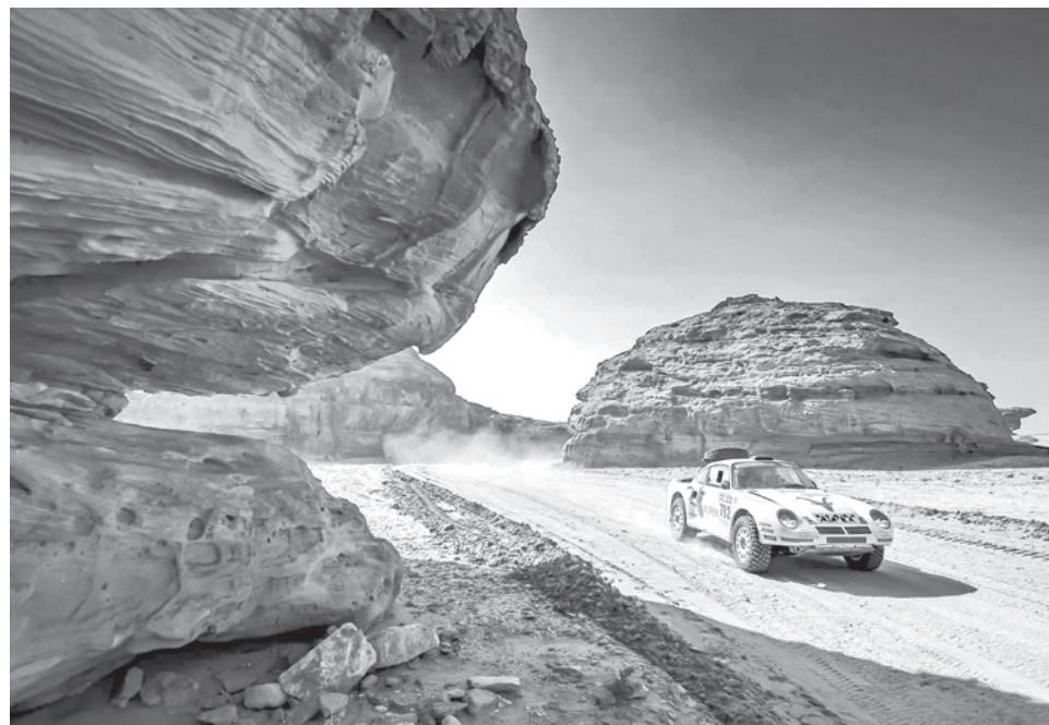
La competición del Rally Dakar 2026.

Lategan completó los 451 kilómetros de especial en 4 horas, 47 minutos y 08 segundos, tras partir en la 23ª posición, y aventajó al catari Nasser Al-Attiyah (Dacia) en más de siete minutos en la meta. A las puertas del podio siguen el veterano español Carlos Sainz y Mathieu Serradori.