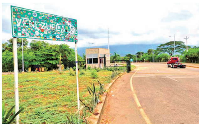
La frontera entre Colombia y Venezuela.

El mandatario colombiano no le respondió de inmediato. “No soy ilegítimo, ni soy narco, solo tengo como bien