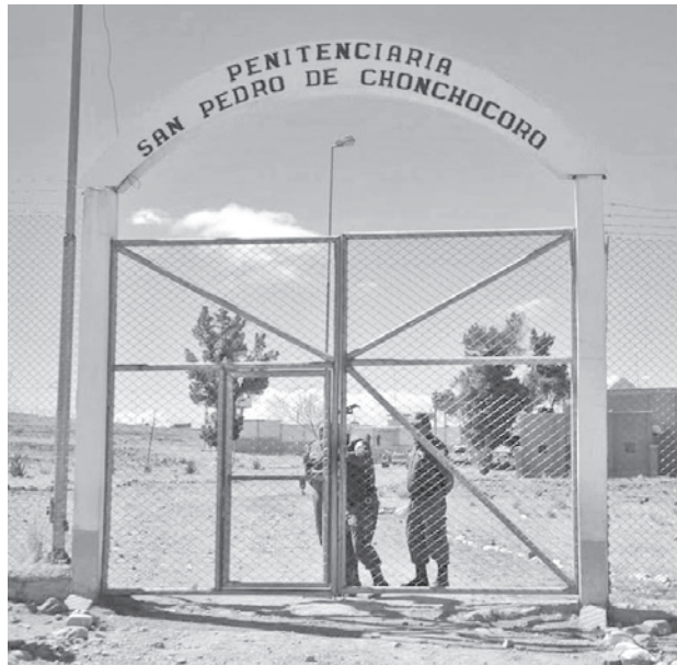
El frontis de la cárcel de Chonchocoro, en La Paz. RR55

Finalmente, la autoridad confirmó que, durante la intervención del Ministerio Público para la toma de declaraciones, el interno acusado decidió acogerse a su derecho constitucional a guardar silencio, mientras continúan las investigaciones para esclarecer el hecho.