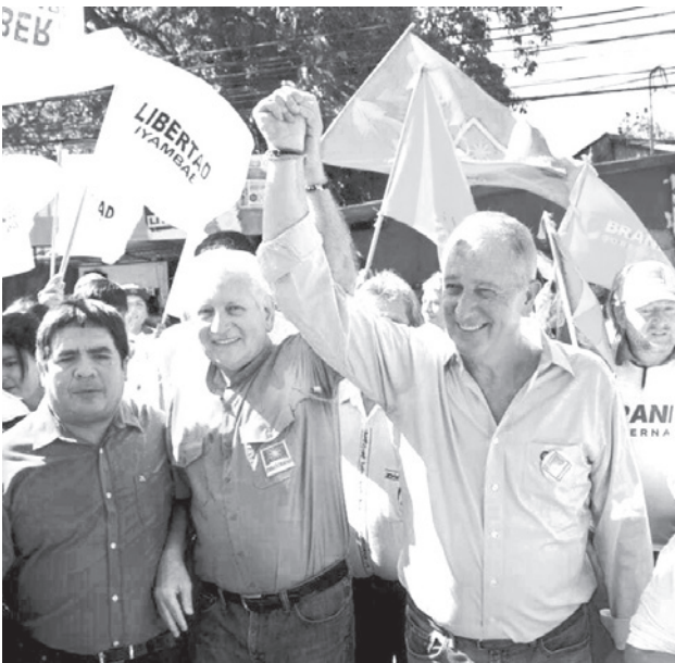
El senador y candidato a la Gobernación cruceña, Branko Marinkovic.

Hace semanas, Rubén Costas, líder de Demócratas, afirmó que Marinkovic sería el candidato a la Gobernación; sin embargo, no fue