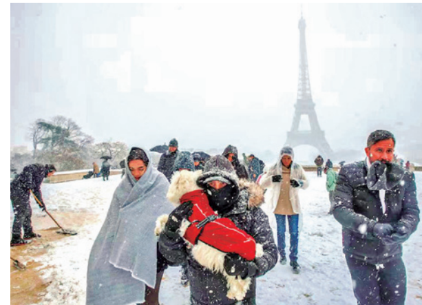
Personas caminan mientras la nieve cae en París, Francia.

Las aspiraciones expansionistas de Trump sobre Groenlandia han sido una constante desde que regresaron hace un año a la Casa Blanca. Bajo la justificación de la seguridad nacional, apelando a la presencia de buques en chinos y rusos en la región, el presidente de Estados Unidos ha venido reclamando el control de la isla.