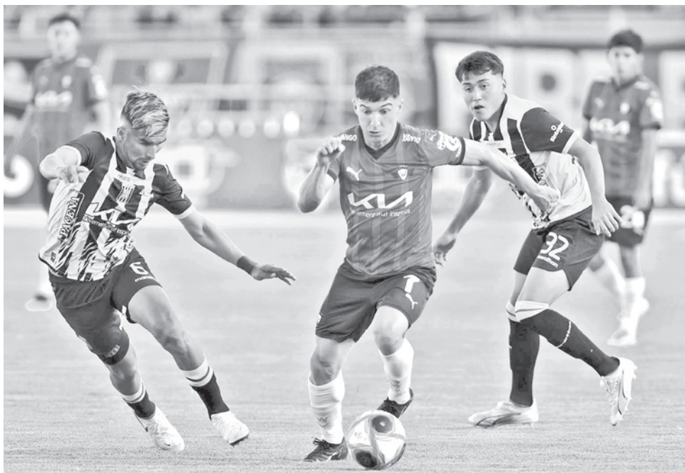
Uno de los partidos de Wilstermann en el torneo profesional, en 2025. CARLOS LÓPEZ

Ayer, se conoció que, en la próxima reunión presencial de Consejo de la División Aficionado, a realizarse el martes 13 en Santa Cruz, habrá una propuesta para que Wilstermann pueda ser tomado en